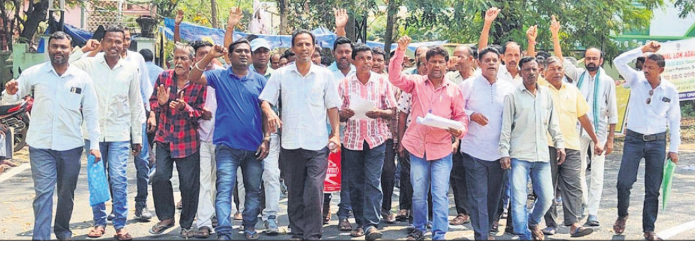
ଚତୁର୍ଥ ଶ୍ରେଣୀ କର୍ମଚାରୀ ସ୍ମାରକପତ୍ର ପ୍ରଦାନ ପାଇଁ ଜିଲ୍ଲାପାଳଙ୍କ କାର୍ଯ୍ୟାଳୟକୁ ଯାଉଛନ୍ତି ।

ବରଗଡ଼, ୧୪ ମାର୍ଚ୍ଚ (ପ୍ରେମାନନ୍ଦ ଖମ୍ବାରୀ) ରାଜ୍ୟର ଗ୍ରାମପଞ୍ଚାୟତଗୁଡ଼ିକରେ କାର୍ଯ୍ୟରେ ରହୁଥିବା ଶ୍ରେଣୀ କର୍ମଚାରୀଙ୍କ ପ୍ରତି ସରକାର ଅଣଦେଖା ମନୋଭାବ ଦେଖାଇ କରୁଛନ୍ତି । ଏଭଳି ଅଭିଯୋଗ ନେଇ ଗୁରୁବାର ଓଡ଼ିଶା ଗ୍ରାମପଞ୍ଚାୟତ ବିଷୟ ନାଗରିକ, ବିକଳାଙ୍ଗମାନଙ୍କ ପାଇଁ ବିଶେଷ ରିହାତି ରହିଥିବା ସୂଚନା ମିଳିଛି ।