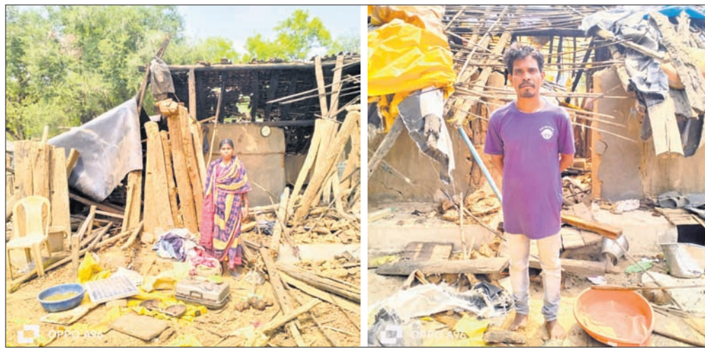
ହାତୀପଲ ଭାଙ୍ଗି ଦେଇଥିବା ଘର।