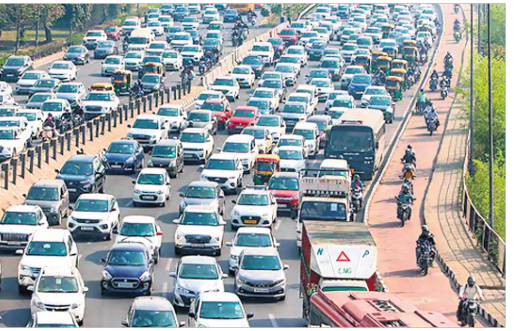
ନୂଆଦିଲ୍ଲୀର ରାମଲୀଳା ମଇଦାନରେ ଗୁରୁବାର କିଷାନ ମହାପଞ୍ଚାୟତ ବେଳେ ୨୪ ନମ୍ବର ଜାତୀୟ ରାଜପଥରେ ଟ୍ରାଫିକ୍ ଜାମ୍।