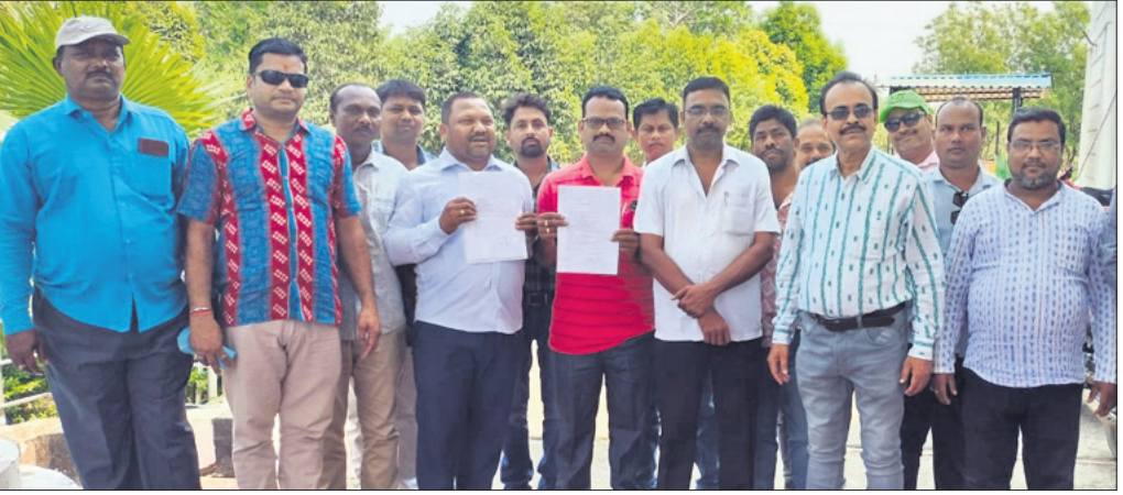
ଜିଲ୍ଲାପାଳଙ୍କ କାର୍ଯ୍ୟକ୍ରମ ସମ୍ମୁଖରେ ଗଣମାଧ୍ୟମ ପ୍ରତିନିଧିମାନେ ।