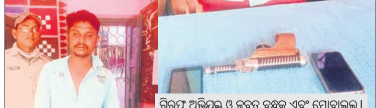
ଗିରଫ ଅଭିଯୁକ୍ତ ଓ ଜବତ ବନ୍ଧୁକ ଏବଂ ମୋବାଇଲ୍ ।

ସଇଁତଳା, ୧୪୩୩(ରାଖାଳ ପ୍ରସାଦ ଶତପଥୀ) ବଲାଙ୍ଗୀର ଜିଲ୍ଲା ସଇଁତଳା ଥାନା ଅନ୍ତର୍ଗତ କରମତଳା ଗ୍ରାମରେ ଗୁରୁବାର ୪୦ପ୍ରହର ନାମାୟକ ଚାଲିଥିବା ବେଳେ ବନ୍ଧୁକ ଦେଖାଇ