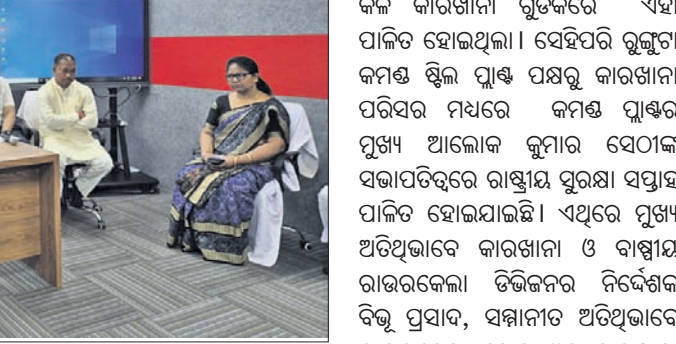
କାର୍ଯ୍ୟକ୍ରମରେ ଉପସ୍ଥିତ ଅତିଥି କୃତ।

କରିବ। ଏହା ଜିଲ୍ଲା ମିନିଷ୍ଟର ପାଠଶେଖର ଏକ ଗୁରୁତ୍ୱପୂର୍ଣ୍ଣ ହସ୍ତକ୍ଷେପ। ୧୯ ଜଣ ଛାତ୍ରଙ୍କୁ ନଗଦ ପ୍ରୋତ୍ସାହନ ରାଶି ଦିଆଯାଇଥିଲା। ଏହି ଅବସରରେ ସମ୍ମାନିତ ଅତିଥିଙ୍କ ଦ୍ୱାରା ଜିଲ୍ଲାର ଦୃଷ୍ଟିବାଧିତ ପିଲାଙ୍କୁ ଲାପଟପ ବନ୍ଧନ କରାଯାଇଥିଲା। ଲାପଟପ ଗୁଡ଼ିକ ଓଏସଇପିଏ ଉଚ୍ଚଶିକ୍ଷା ପାଇବାର ସାହାଯ୍ୟ ହୋଇଥିଲା।