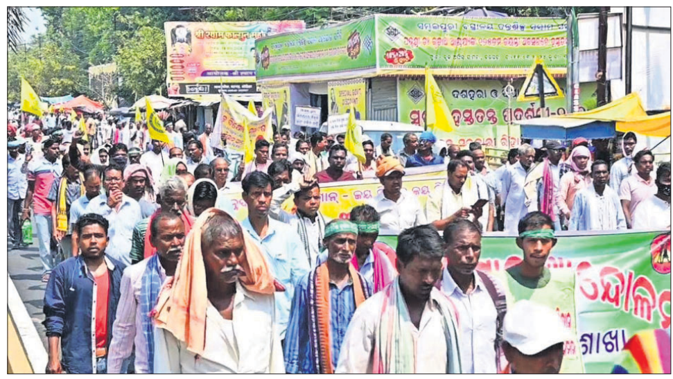
ଚାଷୀଙ୍କ ବିରୋଧ ଶୋଭାଯାତ୍ରା ।