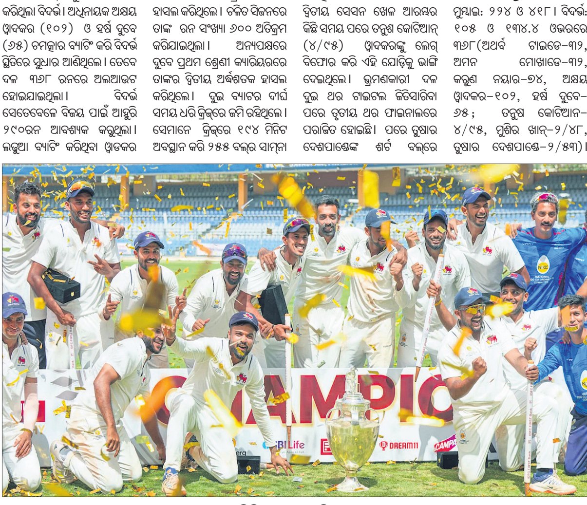
ରଣଜୀ ଟ୍ରଫି ବିଜୟ ପରେ ଉଲ୍ଲସିତ ମୁମ୍ବାଇ ଦଳ।

କରିଥିଲେ। ଅଭିମ ବିଦେ ଖେଳର ବିତାୟ ସେସନ ଖେଳ ଆରମ୍ଭର ଛିଟି ସମୟ ପରେ ଚତୁର୍ଥ କୋଟିଆନ (୪/୯୫) ଖିରକରଙ୍କୁ ଲେଗ୍ ବିଫୋର କରି ଏହି ଯୋଡ଼ିକୁ ଭାଙ୍ଗି ଦେଇଥିଲେ। ଭ୍ରମଣକାରୀ ଦଳ ବୁଲି ଥର ଗାଲଟେ ଛିଟିସାରିବା ପରେ ତୃତୀୟ ଥର ଫାଇନାଲରେ ପରାଜିତ ହୋଇଛି। ପରେ ତୃଷାର ବିଦେଶୀ ଖେଳ ଶର୍ତ୍ତ ବଲ୍‌ରେ