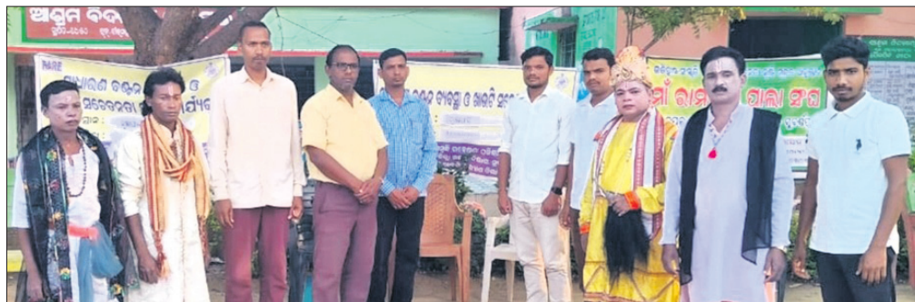
ଖାଉଟି ସଚେତନତା କାର୍ଯ୍ୟକ୍ରମରେ ଛାତ୍ରାଛାତ୍ରୀଙ୍କୁ ସଚେତନ କରାଯାଇଛି ।

ଅନନ୍ତପାଲି, ୧୪୩୩(ପାତାଳର ସାହୁ) ସୁବର୍ଣ୍ଣପୁର ଜିଲ୍ଲା ବୀରମହାରାଜପୁର ବ୍ଲକ ଅନ୍ତର୍ଗତ ଦୁର୍ଜନପେଟା ପଞ୍ଚାୟତର ମୁଖ୍ୟମନ୍ତ୍ରୀ ଆଶ୍ରମ ସ୍ଥଳରେ ଗୁରୁବାର ଦିନ ଖାଉଟି ସଚେତନତା କାର୍ଯ୍ୟକ୍ରମ ଅନୁଷ୍ଠିତ ହୋଇଯାଇଛି । ଜିଲ୍ଲା ମଜଳ ବିଭାଗ ଓ ସ୍ୱେଚ୍ଛାସେବୀ ଅନୁଷ୍ଠାନ ରେଆର ଆନୁକୂଲ୍ୟରେ ଏହି କାର୍ଯ୍ୟକ୍ରମ ଆୟୋଜିତ ହୋଇଥିଲା । ସ୍ଥାନୀୟ ପ୍ରଧାନ ଶିକାନ୍ୟାସ କରୁଛନ୍ତି ।