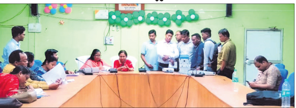
ପ୍ରଶିକ୍ଷଣ ପ୍ରଦାନ କରାଯାଇଛି ।