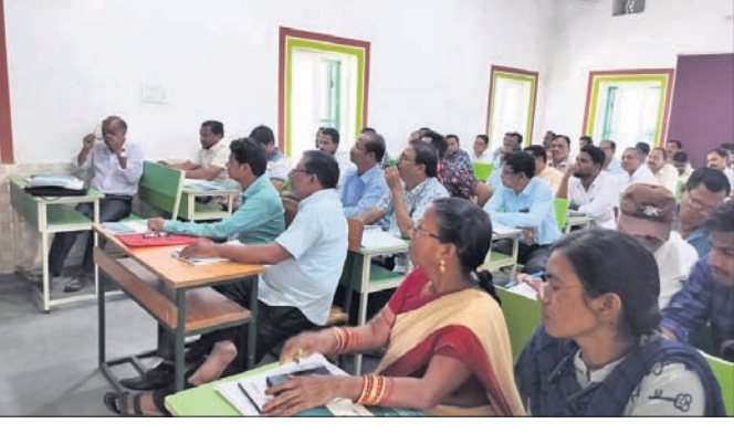
ଶିବିରରେ ଅଂଶଗ୍ରହଣ କରିଥିବା ପୋଲିଂ, ପ୍ରିଜାଇଡ଼ିଂ ଅଧିକାରୀ ।