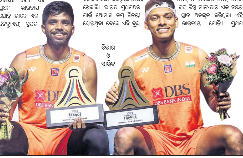
ତିରୀଗ ଓ ସାହିକ

ଖେଳାଳିଙ୍କ ସେଥିରେ ରହିଥିଲା ଗୁରୁତ୍ୱପୂର୍ଣ୍ଣ ଭୂମିକା। ଏହାପରେ ପ୍ରେମ୍ ଓପନ୍ ଜିତି ରେକର୍ଡ୍ କରିବା ସହ ପ୍ରଥମ ଭାରତୀୟ ଯୋଡ଼ି ଭାବେ ବିଶ୍ୱ ର୍ୟାଙ୍କିଙ୍ଗ୍‌ର ୧୯ ଚେନ୍‌ରେ ପ୍ରବେଶ କରିଥିଲେ। କାପାନରେ ଅନୁଷ୍ଠିତ ବିଶ୍ୱ ଚାମ୍ପିୟନଶିପ୍‌ରେ ଗ୍ରୋଉ ପଦକ ଜିତିବା ସହ ଇତିହାସ ରଚିଥିଲା ଏହି ଭାରତୀୟ ଯୋଡ଼ି। ୨୦୨୩ରେ ଏସିଆନ୍ ଚାମ୍ପିୟନଶିପ୍‌ର ପୁରୁଷ ତତକାଳ ଇଭେଣ୍ଟରେ ସ୍ୱର୍ଣ୍ଣ ଓ ମିଳିତ ଚିମ୍ ଲଭେଷ୍ଟରେ ଗ୍ରୋଉ ପଦକ ବିଜୟୀ ହୋଇଥିଲା। ସମାନ ବର୍ଷରେ ସିଏ ଓପନ୍, ଇଣ୍ଡୋନେସିଆ ଓପନ୍ ଓ କୋରିଆ ଓପନ୍ ଜିତିବା ସହ ବିଶ୍ୱ ମାନ୍ୟତାର ଏକ ନମ୍ବର ସ୍ଥାନ ଅଳଙ୍କୃତ କରିଥିଲା ଏହି ଭାରତୀୟ ଯୋଡ଼ି। ପ୍ରଥମ