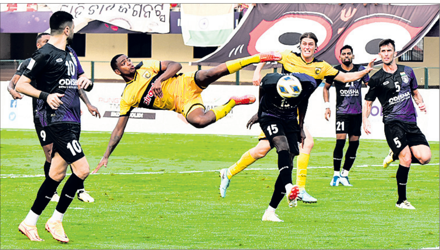
କଳିଙ୍ଗ ଷ୍ଟାଡ଼ିୟମରେ ଗୁରୁବାର ଓଡ଼ିଶା ଏଫସି ଓ ସେଣ୍ଟାଲ କୋଷ୍ଟ ମାରିନର୍ସ ମଧ୍ୟରେ ଅନୁଷ୍ଠିତ ଏଫସି କପ ଫୁଟବଲ ଇଣ୍ଟର-କୋନାଲ ସେମିଫାଇନାଲ୍ ମ୍ୟାଚ। (ଫଟୋ: ବିକାଶ ନାୟକ)।