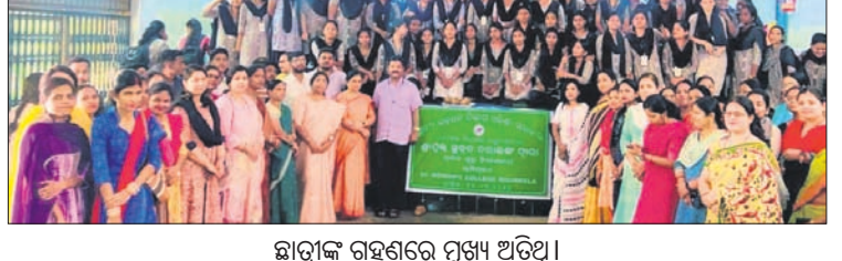
ଛାତ୍ରୀଙ୍କ ରାଶିରେ ମୁଖ୍ୟ ଅତିଥି।