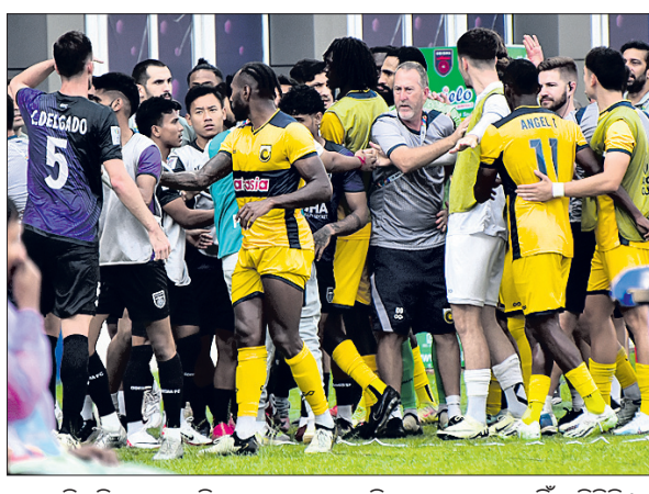
ଏକ ନିଷ୍ପତ୍ତିକୁ କେନ୍ଦ୍ରକରି ବୁଲି ଦଳର ଖେଳାଳିକ ମଧ୍ୟରେ ମୁହାମୁହିଁ ପରିସ୍ଥିତି।

ସ୍ଥାନୀୟ କଳିଙ୍ଗ ଷ୍ଟାଡ଼ିୟମରେ ଗୁରୁବାର ଓଡ଼ିଶା ଏଫସି ଓ ସେଣ୍ଟାଲ କୋଷ୍ଟ ମାରିନର୍ସ ମଧ୍ୟରେ ଅନୁଷ୍ଠିତ ଏଫସି କପ ଫୁଟବଲ ଇଣ୍ଟର-କୋନାଲ ସେମିଫାଇନାଲ୍ ମ୍ୟାଚ ଚଳିଥିଲା। ଫଳରେ ପ୍ରତିଯୋଗିତାକୁ ଓଡ଼ିଶା ଏଫସିର ଅଭିଯାନ ଶେଷ ହୋଇଛି। ମାର୍ଚ୍ଚ ୭ରେ ଗୁଆରାପୁଲ ଷ୍ଟାଡ଼ିୟମରେ ଅନୁଷ୍ଠିତ ପ୍ରଥମ ଚରଣ ମ୍ୟାଚରେ ସେଣ୍ଟାଲ କୋଷ୍ଟ ମାରିନର୍ସ ୪-୦ ଗୋଲରେ ଓଡ଼ିଶା ଏଫସିକୁ ପରାସ୍ତ କରିଥିଲା। ଫଳରେ ୨ଟି ମ୍ୟାଚ ପରେ ଏଗ୍ରିଗେଟରେ ୪-୦ରେ ଅଗ୍ରଣୀ ରହି ସେଣ୍ଟାଲ କୋଷ୍ଟ ମାରିନର୍ସ ଆନ୍ଧ୍ର-ଜୋନ ପ୍ଲେ-ଅଫ ଫାଇନାଲ୍‌ରେ ପ୍ରବେଶ କରିଛି। ଫାଇନାଲ୍‌ରେ ପ୍ରବେଶ କରିବାକୁ ହେଲେ ଓଡ଼ିଶା ଏଫସିକୁ ଏଠାରେ ଅତିକମରେ ୫ ଗୋଲ ବ୍ୟବଧାନରେ ବିଜୟ ଆବଶ୍ୟକ ହେଉଥିଲା। ପ୍ରଥମ ମ୍ୟାଚରେ ଶୁଭିକାମା ମାରିନର୍ସ ନିକଟରୁ ପରାଜିତ ହୋଇଥିଲେ ହେଁ ଘରୋଇ ପରିବେଶରେ ଓଡ଼ିଶା ଏଫସି କଡ଼ା