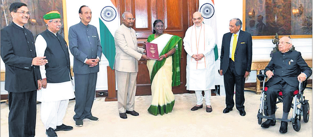
ଓଏନ୍ ନେଶନ୍ ଓଏନ୍ ଇଲେକ୍ଟ୍ରନ୍ କମିଟି ଅଧ୍ୟକ୍ଷ ରାମନାଥ କୋବିନ୍ଦ ରାଷ୍ଟ୍ରପତି ଡ୍ରୋପଦୀ ମୁର୍ମୁଙ୍କୁ ରିପୋର୍ଟ ପ୍ରଦାନ କରୁଛନ୍ତି।

ନୂଆଦିଲ୍ଲୀ, ୧୪ମାର୍ଚ୍ଚ (ପି.ଟି.) ଦେଶରେ ଏକସଙ୍ଗେ ଲୋକ ସଭା ଏବଂ ରାଜ୍ୟ ବିଧାନସଭାଗୁଡ଼ିକର ନିର୍ବାଚନ କରାଯିବ। ପାର୍ଲିମେଣ୍ଟର ଗୋଟିଏ ସଭା ସମୟରେ ଗୋଟିଏ ଭୋଟର ତାଲିକା ପ୍ରସ୍ତୁତ ହେବ। ଏହାର ଗଠିତ ଉଚ୍ଚସ୍ତରୀୟ କମିଟି ଗୁରୁବାର କେନ୍ଦ୍ର ସରକାରଙ୍କୁ ସୁପାରିସ କରିଛି। ଏହାର ୧୦୦ ଦିନ ମଧ୍ୟରେ ପୌର ଓ ପଞ୍ଚାୟତ ନିର୍ବାଚନ କରାଯିବ। ପାର୍ଲିମେଣ୍ଟର ଗୋଟିଏ ସଭା ସମୟରେ ଗୋଟିଏ ଭୋଟର ତାଲିକା ପ୍ରସ୍ତୁତ ହେବ। ଏହାର ଗଠିତ ଉଚ୍ଚସ୍ତରୀୟ କମିଟି ଗୁରୁବାର କେନ୍ଦ୍ର ସରକାରଙ୍କୁ ସୁପାରିସ କରିଛି। ଏହାର ୧୦୦ ଦିନ ମଧ୍ୟରେ ପୌର ଓ ପଞ୍ଚାୟତ ନିର୍ବାଚନ କରାଯିବ। ପାର୍ଲିମେଣ୍ଟର ଗୋଟିଏ ସଭା ସମୟରେ ଗୋଟିଏ ଭୋଟର ତାଲିକା ପ୍ରସ୍ତୁତ ହେବ। ଏହାର ଗଠିତ ଉଚ୍ଚସ୍ତରୀୟ କମିଟି ଗୁରୁବାର କେନ୍ଦ୍ର ସରକାରଙ୍କୁ ସୁପାରିସ କରିଛି। ଏହାର ୧୦୦ ଦିନ ମଧ୍ୟରେ ପୌର ଓ ପଞ୍ଚାୟତ ନିର୍ବାଚନ କରାଯିବ।