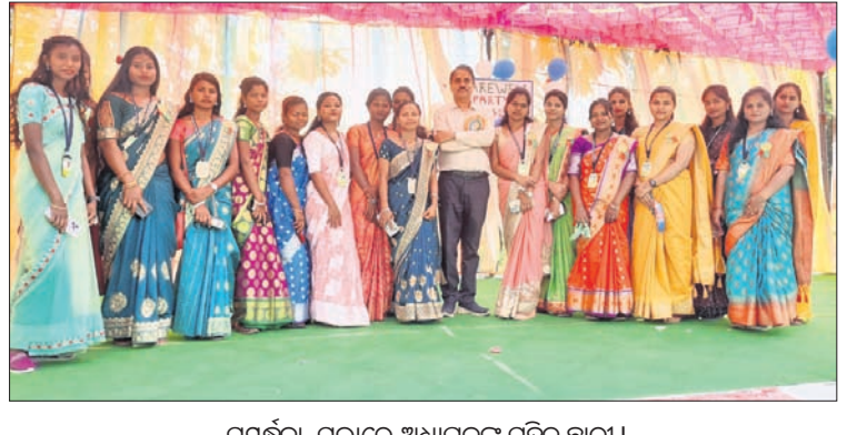
ସମ୍ବର୍ଦ୍ଧନା ସଭାରେ ଅଧ୍ୟାପକଙ୍କ ସହିତ ଛାତ୍ରୀ।