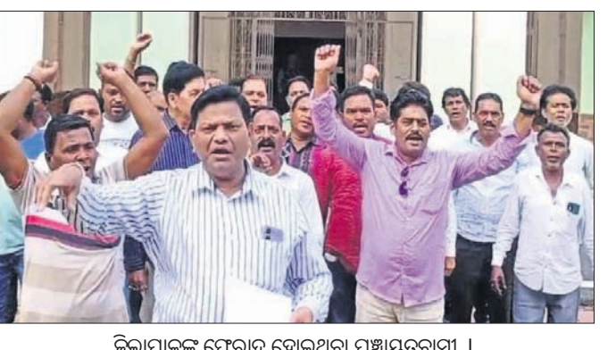
ଜିଲ୍ଲାପାଳଙ୍କୁ ଫେରାଦ ହୋଇଥିବା ପଞ୍ଚାୟତବାସୀ ।

ବରଗଡ଼, ୧୪ ମାର୍ଚ୍ଚ (ପ୍ରେମାନନ୍ଦ ଖମ୍ବାରୀ) ବରଗଡ଼ ଜିଲ୍ଲା ବିଜେପୁର ବ୍ଲକ ଅନ୍ତର୍ଗତ ଲାମୁଣ୍ଡା ପଞ୍ଚାୟତରେ ବହୁସଂଖ୍ୟ ସମସ୍ୟା ଲାଗି ରହିଛି । ଏ ନେଇ ବିଭାଗୀୟ ଅଧିକାରୀଙ୍କ ଦୃଷ୍ଟି ଆକର୍ଷଣ କରାଯିବା ସତ୍ତ୍ୱେ କିଛି ସୁଫଳ ମିଳୁନାହିଁ । ଏଭଳି