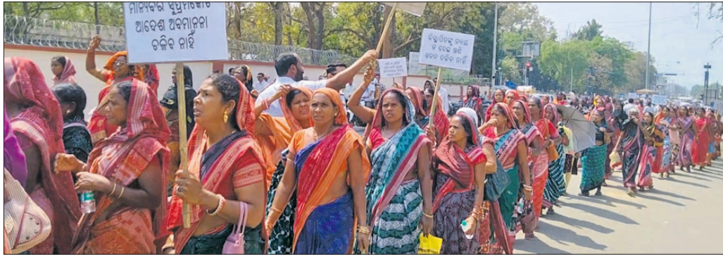
ଜିଲ୍ଲାପାଳଙ୍କ ଅର୍ପିତ ଘେରିବାକୁ ଆସିଥିବା ମହିଳା।

ସୁନ୍ଦରଗଡ଼, ୧୪ମାର୍ଚ୍ଚ(କନ୍ୟା ନାରାୟଣ ମେଞ୍ଚୁଳି)