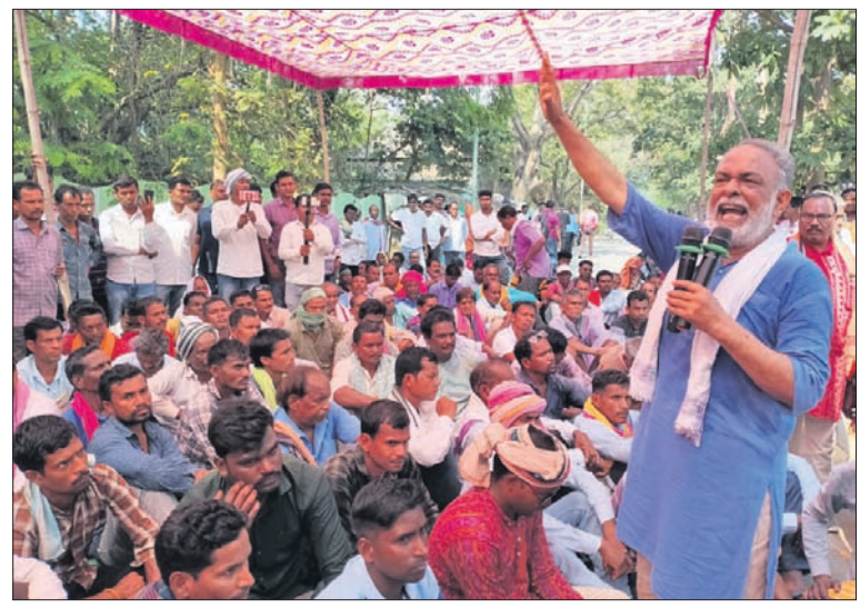
ପ୍ରତିବାଦ ସଭାରେ ଚାଷୀମାନେ ଲିଙ୍ଗରାଜ ଉଦ୍‌ବୋଧନ ଦେଖିଛନ୍ତି ।