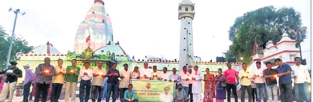
ମା' ସମଲେଖିନୀଙ୍କଠାରେ ଦୀପ ପ୍ରଜ୍ୱଳନ ଅବସରରେ ବିଜେତ ନେତା ଓ ମନ୍ଦିର ଗ୍ରନ୍ଥ ବୋର୍ଡ କର୍ମକର୍ତ୍ତା।