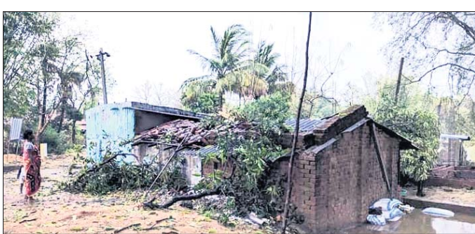
ଝଡ଼ତୋଫାନରେ ଗଛ ଉପୁଡ଼ିପଡ଼ିଛି।

କୁଟିଆ, ୧୬୩ (ବିରଞ୍ଚ ଦଳା) ଶନିବାର କୁଟିଆର ବିଭିନ୍ନ ଅଞ୍ଚଳରେ ଝଡ଼ତୋଫାନ ସାଙ୍ଗକୁ କୁଆପଥର ମାଡ଼ ହୋଇଛି। ଏଥିଯୋଗୁ ଅଞ୍ଚଳରେ ବ୍ୟାପକ କ୍ଷୟକ୍ଷତି ହୋଇଛି। ସନ୍ଧ୍ୟା ସମୟରେ ପ୍ରବଳ ପବନ ଘାଟକୁ ବର୍ଷା ଓ ତୁଣ୍ଡକୁ ତୁଣ୍ଡା କୁଆପଥର ବୃଷ୍ଟି ହୋଇଥିଲା। ଫଳରେ କେତେକ ଗ୍ରାମରେ ବିଦ୍ୟୁତ୍ ଖୁଣ୍ଟ ଓ ଗଛ ଉପୁଡ଼ିବାକୁ ବିଦ୍ୟୁତ୍ ସରବରାହ ବାଧାପ୍ରାପ୍ତ ହୋଇଛି। ପବନ ଯୋଗୁ ଲୋକଙ୍କ ଘରଦ୍ୱାର ଭାଙ୍ଗି ଆକସେଷ୍ଟ୍ ମଧ୍ୟ ଉଡ଼ାଇ ନେଇଛି। କୁଆପଥର ମାଡ଼ ମାଡ଼ରେ ପରିପରିବା ଗଣ ସ୍ତତି ହୋଇଛି। ଗାଞ୍ଜା ଚମାଟୋ, ଆଳୁ, କୋଦି, ବାଇଗଣ, ପୋଟଳ, ତରଭୁଜ, ଲଇ, କଖାରୁ ଆଦି ନଷ୍ଟ ହୋଇଛି।