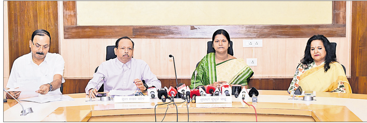
ଭୁବନେଶ୍ୱର, ୧୬ମାର୍ଚ୍ଚ (ଅନିଲ ଦାସ)