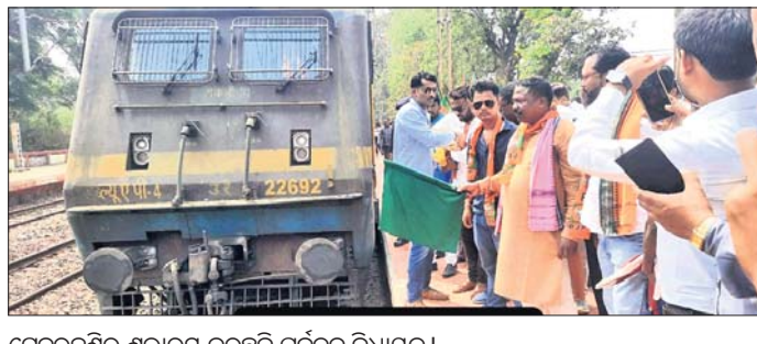
ଟ୍ରେନ୍ ରହଣିର ଶୁଭାରମ୍ଭ କରୁଛନ୍ତି ପୂର୍ବତନ ବିଧାୟକ।

ଦକ୍ଷିଣପୁର ରେଳପଥ ଚକ୍ରଧରପୁର ଡିଭିଜନ ଅଧୀନରେ ଥିବା ବାମରା ରେଳ ଷ୍ଟେଶନରେ ଶନିବାର ପର୍ଯ୍ୟାୟକ୍ରମେ ୫ ଏକ୍ସପ୍ରେସ ଟ୍ରେନ୍ ରହଣି ଶୁଭାରମ୍ଭ ହୋଇଛି। କରୋନା ପୂର୍ବରୁ ବାମରା ଷ୍ଟେଶନରେ ଏକ୍ସପ୍ରେସ ଓ ପାସେଞ୍ଜର ଟ୍ରେନ୍କୁ ମିଶାଇ ମୋଟ ୧୫ ଟ୍ରେନ୍ ରହଣି କରୁଥିଲା। ପରେ କେବଳ ୭ଟି ଟ୍ରେନ୍ ରହଣି ହୋଇ ଅନ୍ୟ ସମସ୍ତ ରହଣିକୁ ଉଠାଇ ଦିଆଯାଇଥିଲା। ଏଥିରେ ଅଞ୍ଚଳବାସୀ ଚାକ୍ ଅସରୋଷ ପ୍ରକାଶ କରି ବିଭିନ୍ନ ସମୟରେ ରେଳରୋକୋ ଆନ୍ଦୋଳନ କରିଥିଲେ। ଅଞ୍ଚଳବାସୀଙ୍କ ଦାବିକୁ ଗ୍ରହଣ କରି କେନ୍ଦ୍ରମନ୍ତ୍ରୀ ଧର୍ମେନ୍ଦ୍ର ପ୍ରଧାନଙ୍କ ପ୍ରତ୍ୟେକରେ ରେଳ ବିଭାଗ ବାମରାଠାରେ ରେଳ ରହଣିର