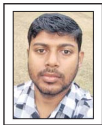
ନିର୍ବିକଳ୍ପ ନାଥ, ଘଣ୍ଟେଶ୍ୱର

ପୂଜନୀ: ଆଗାମୀ ଆଶା ପୃଷ୍ଠା ପାଇଁ କେଶା ଓ ଫଟୋ ପଠାଇବା ଲାଗି ଇ-ମେଲ୍ ଠିକଣା: dharitriagamiasha@gmail.com