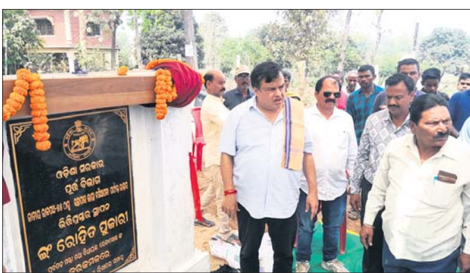
ବିଧାୟକ ଉନ୍ନୟନ କାର୍ଯ୍ୟର ଭିତ୍ତିପ୍ରସ୍ତର ସ୍ଥାପନ କରୁଛନ୍ତି।