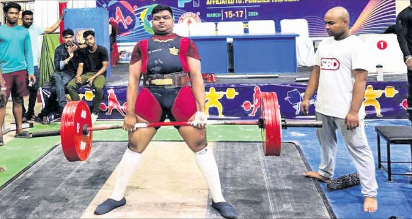
ପ୍ରତିଯୋଗିତାର ଦ୍ୱିତୀୟ ଦିବସରେ ଜଣେ ପ୍ରତିଯୋଗୀ ଶକ୍ତିଭରୋକନ କରୁଛନ୍ତି।