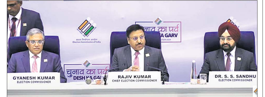
ନିର୍ବାଚନ କାର୍ଯ୍ୟସୂଚୀ ସମ୍ପର୍କରେ ମୁଖ୍ୟ ନିର୍ବାଚନ କମିଶନର (ସିଜିସି) ରାଜୀବ କୁମାର (ମଝି) ଖବରଦାତା ସମ୍ମିଳନୀକୁ ସୂଚନା ଦେଇଛନ୍ତି। ନିକଟରେ ଅଛନ୍ତି ନିର୍ବାଚନ କମିଶନର (ଇସି) ଜ୍ଞାନେଶ କୁମାର ଏବଂ ପୁଷ୍ପଗୀର ସିଂ ସାହୁ।

ପାଇଁ ଉପନିର୍ବାଚନ ମଧ୍ୟ ଲୋକ ସଭା ନିର୍ବାଚନ ସହ ଏକସଙ୍ଗେ ଅନୁଷ୍ଠିତ ହେବାକୁ ଯାଉଛି। ଉପନିର୍ବାଚନ ହେବାକୁ ଥିବା ରାଜ୍ୟଗୁଡ଼ିକ ମଧ୍ୟରେ ଅଛନ୍ତି ବିହାର, ଉତ୍ତରାଞ୍ଚଳ, ହରିୟାଣା, ଝାଡ଼ଖଣ୍ଡ, ମହାରାଷ୍ଟ୍ର, ରାଜସ୍ଥାନ ଏବଂ ଚାଟିଶାହାର। ବିହାର, ପଶ୍ଚିମବଙ୍ଗ ଏବଂ ଉତ୍ତରପ୍ରଦେଶରେ ସମସ୍ତ ୬ ପର୍ଯ୍ୟାୟରେ ନିର୍ବାଚନ ହେବ। ପ୍ରଥମ ପର୍ଯ୍ୟାୟ ଅପ୍ରେଲ ୧୯ରେ ୨୧ ରାଜ୍ୟ ତଥା କେନ୍ଦ୍ରଶାସିତ ଅଞ୍ଚଳର ୧୦୨ ଲୋକ ସଭା କ୍ଷେତ୍ରରେ ନିର୍ବାଚନ ହେବାକୁ ଥିବାବେଳେ ଦ୍ୱିତୀୟ ପର୍ଯ୍ୟାୟ ଏପ୍ରିଲ ୨୬ରେ ୧୩ ରାଜ୍ୟ ଓ କେନ୍ଦ୍ରଶାସିତ ଅଞ୍ଚଳର ୮୯ ଆସନରେ ଭୋଟ ହେବ।