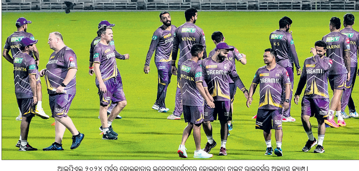
ଆଇପିଏଲ୍ ୨୦୨୪ ପୂର୍ବରୁ କୋଲକାତାର ଇଡେନ୍‌ଗାର୍ଡେନ୍‌ରେ କୋଲକାତା ନାଇଟ୍ ରାଇଡର୍ସର ଅଭ୍ୟାସ କ୍ୟାମ୍ପ।

ପାଇଁ ଏହା ହେଉଛି ଏକ ଗୁରୁତ୍ୱପୂର୍ଣ୍ଣ ପର୍ଯ୍ୟାୟ। ଦଳ ଏଥର ପୋଡି଼ୟମ ଫିନିଶ୍ କରିବାକୁ ଲକ୍ଷ୍ୟ ରଖିଛି। ଏଥିଲାଗି ଦଳକୁ ସମସ୍ତ ପ୍ରକାର ଆବଶ୍ୟକ ସହାୟତା ଯୋଗାଇ ଦିଆଯିବ। ଏହି ସ୍ୱତନ୍ତ୍ର କୋର୍ଟ କ୍ୟାମ୍ପରେ ବିଶେଷକରି ଗୋଲ୍ କିପିଙ୍ଗ୍ ଓ ଡ୍ରାଗ୍ ପୁଲିଙ୍ଗ୍ ଉପରେ ଗୁରୁତ୍ୱ ଆରୋପ କରାଯାଇଛି। ଭାରତ ପଲ୍ ପଲ୍ ଏସିଆନ ଗେମ୍ସ ପୂର୍ବରୁ ଛୁଲାଇ ଓ ସେପ୍ଟେମ୍ବରରେ ଭାରତୀୟ ଦଳର ଗୁଜୁଟ୍ ସ୍ୱତନ୍ତ୍ର କ୍ୟାମ୍ପ ପରିଚାଳନା କରିଥିଲେ।