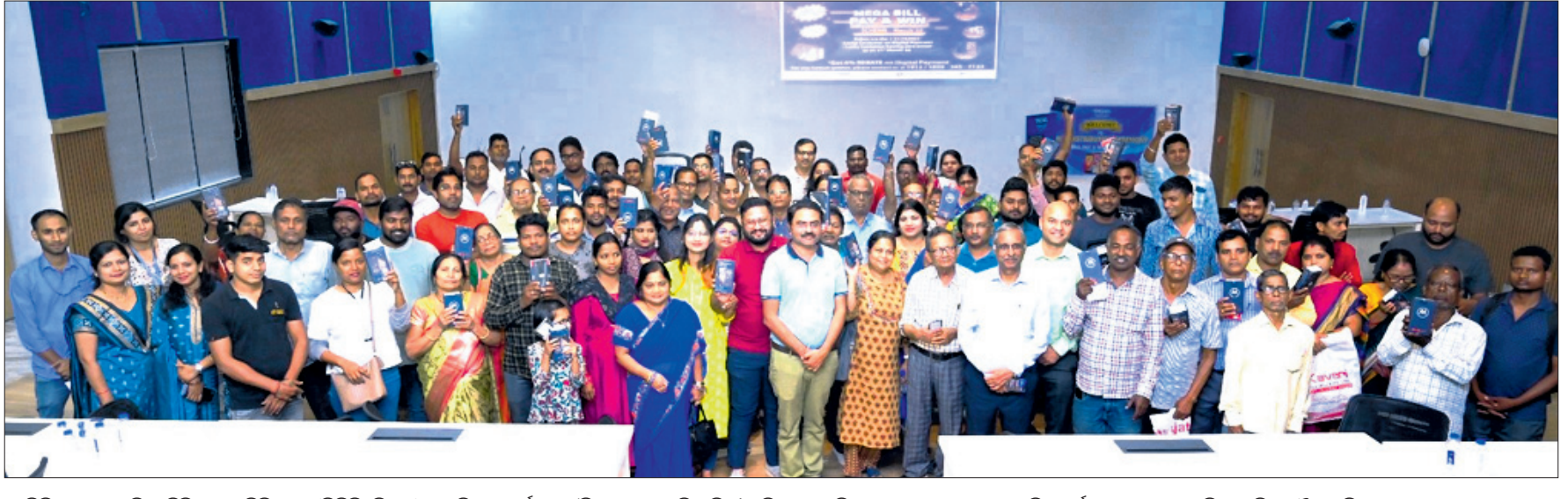
ଟିପି ସେଣ୍ଟ୍ରାଲ ଓଡ଼ିଶା ବିଶ୍ୱବିଦ୍ୟାଳୟ ଲିମିଟେଡ୍ (ଟିପିସିଏଲ୍)ର ଅଭିନବ କାର୍ଯ୍ୟକ୍ରମ 'ବିଲ୍ ଯେ ଆଣ ଓଡ଼ିଶା'ର ବିକଳଗଣଙ୍କ ନିକଟରେ ପୁରସ୍କୃତ କରାଯାଇଛି, ଯାହା ଯମଜ ମଧ୍ୟରେ ବିକଳ ଓଡ଼ିଶା କରାଯାଇଛି।