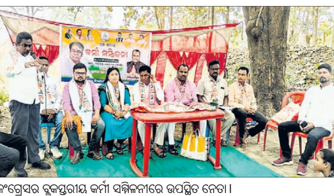
କଂଗ୍ରେସର ରୁକ୍ମପୁରୀୟ କର୍ମୀ ସମ୍ମିଳନୀରେ ଉପସ୍ଥିତ ନେତା ।

ଥିଆନ୍ଦ୍ର ବିଭାଗ ଓ ମୁକ୍ତିକା ସଂରକ୍ଷଣ ଭଳି ବିଭାଗର କିଛି ବିଭାଗ ସରକାରଙ୍କ ପ୍ରଚାର ଆଚରଣ ବିଧି ନିୟମାବଳୀକୁ ଅନୁପାଳନ କରିବା କଥା। ତେବେ ସୁବର୍ଣ୍ଣପୁର ଜିଲ୍ଲାରେ ଆଚରଣବିଧି ଲାଗୁ ହେବାର ୨୪ ଘଣ୍ଟା ପରେ ବି ଏହାକୁ ଅନୁପାଳନ କରାଯାଇ ନ