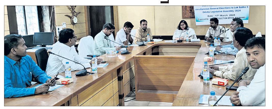
ରାଜନୈତିକ ଦଳ ସହ ଜିଲ୍ଲା ପ୍ରଶାସନର ବୈଠକରେ ଅଧିକାରୀ ଓ ଦଳର କର୍ମକର୍ତ୍ତା ।