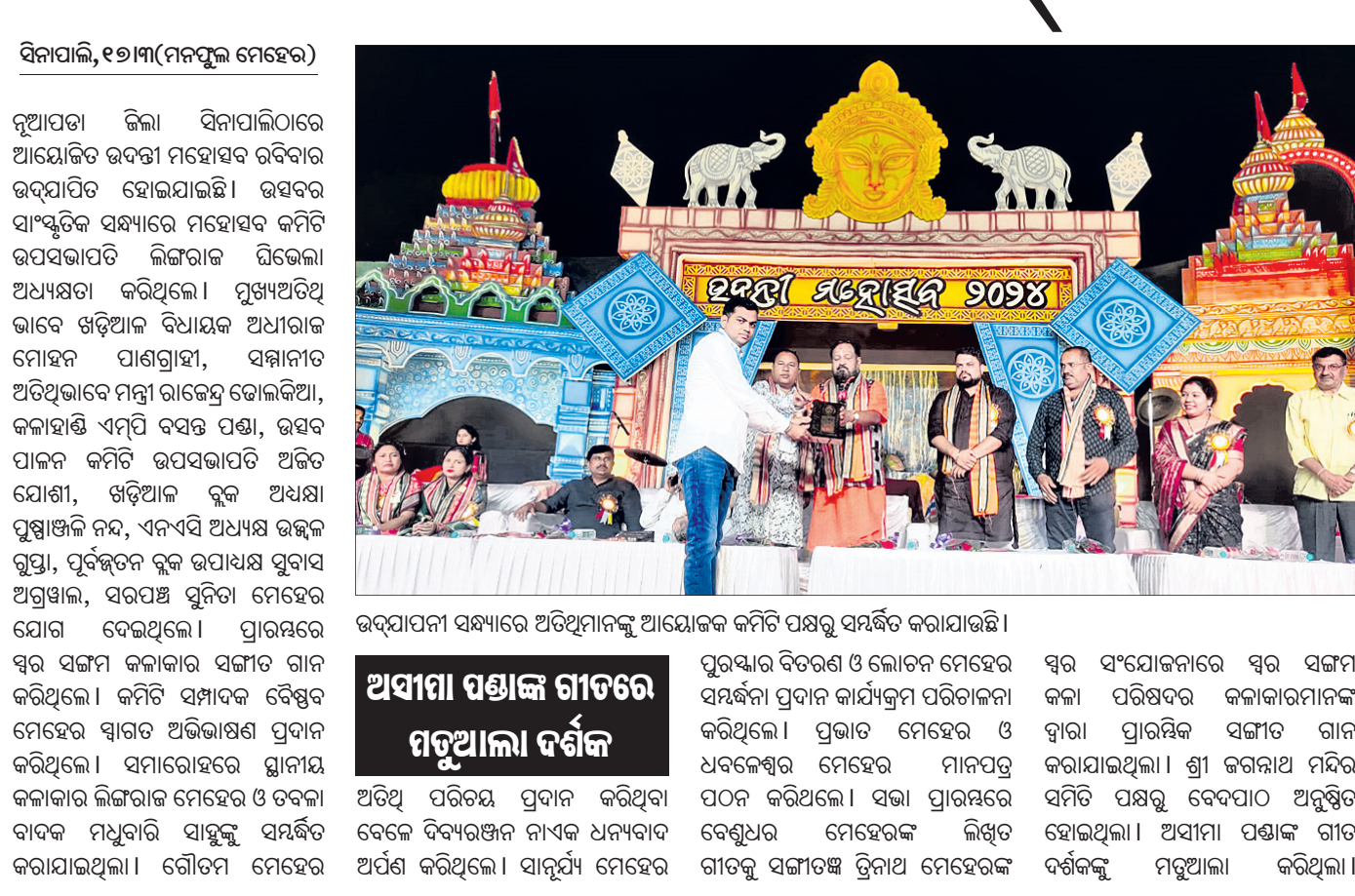
ଉଦ୍‌ଯାପନୀ ସଭ୍ୟାରେ ଅତିଥିମାନଙ୍କୁ ଆୟୋଜକ କମିଟି ପକ୍ଷରୁ ସମର୍ପିତ କରାଯାଇଛି ।