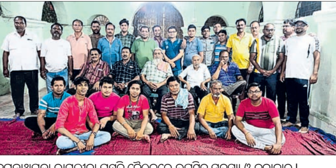
ଜଗନ୍ନାଥପଡ଼ା ରାମଲୀଳା ପ୍ରସ୍ତୁତି ବୈଠକରେ ଉପସ୍ଥିତ ସଭ୍ୟ ଓ କଳାକାର ।

ବିଭିନ୍ନ ବ୍ରାଣ୍ଡର ୧୫୮ ବୋତଲ ବିଦେଶୀ ମଦ ଜବତ ହୋଇଛି। ଏହାର ପରିମାଣ ୬୩ .୪୧୦ ଲିଟର ହେବ। ଏହି ଢାବାକୁ ଦଳଗଞ୍ଜନ ସାହୁଙ୍କୁ ଗିରଫ କରାଯାଇଛି।