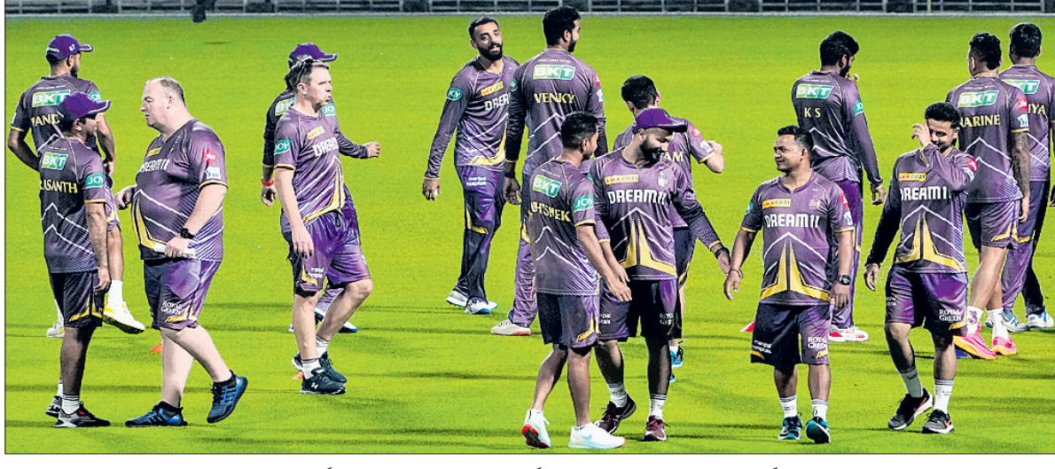
ଆଇପିଏଲ୍ ୨୦୨୪ ପୂର୍ବରୁ କୋଲକାତାର ଇଡେନ୍‌ଗାର୍ଡେନ୍‌ରେ କୋଲକାତା ନାଇଟ୍‌ସ୍ ରାଇଡର୍‌ସ୍ ଅଭ୍ୟାସ କ୍ୟାମ୍ପ।

ପାଇଁ ଏହା ହେଉଛି ଏକ ଗୁରୁତ୍ୱପୂର୍ଣ୍ଣ ପର୍ଯ୍ୟାୟ। ଦଳ ଏଥର ପୋଡିୟମ ଫିନିଶ କରିବାକୁ ଲକ୍ଷ୍ୟ ରଖିଛି। ଏଥିଲାଗି ଦଳକୁ ସମସ୍ତ ପ୍ରକାର ଆବଶ୍ୟକ ସହାୟତା ଯୋଗାଇ ଦିଆଯିବ। ଏହି ସ୍ୱତନ୍ତ୍ର କୋର୍ କ୍ୟାମ୍ପରେ ବିଶେଷକରି ଗୋଲ୍ କିପିଙ୍ଗ୍ ଓ ଡ୍ରାଗ୍ ପୂର୍ଣ୍ଣ ଉପରେ ଗୁରୁତ୍ୱ ଆରୋପ କରାଯାଇଛି। ଭାରତର ପଲ୍ ପୂର୍ବରୁ ଏସିଆନ୍ ଗେମ୍ ପୂର୍ବରୁ ଲୁଲାଇ ଓ ସେପ୍‌ୟମରେ ଭାରତୀୟ ଦଳର ବୁଲ୍‌ଡି ସ୍ୱତନ୍ତ୍ର କ୍ୟାମ୍ପ ପରିଚାଳନା କରିଥିଲେ।