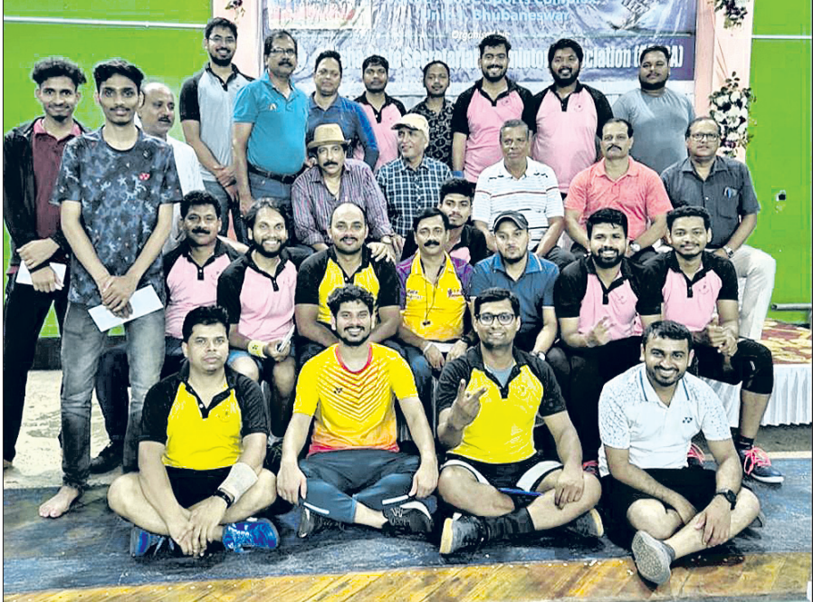
ଅତିଥି ଓ କର୍ମକର୍ତ୍ତାଙ୍କ ଗହଣରେ ଚାମ୍ପିୟନ ଦଳର ଖେଳାଳି।