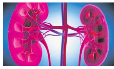
ବର୍ତ୍ତନ କରନ୍ତୁ କାରଣ ଏହା ଉଚ୍ଚ ସ୍ୱାସ୍ଥ୍ୟ ଏବଂ କିଡ୍‌ନୀ ପ୍ରତି ସ୍ଥିତିକାରକ। କିଡ୍‌ନୀକଳିତ ରୋଗର କୌଣସି ଲକ୍ଷଣ ଜାଣିପାରିଲେ ତେବେ ବିଳମ୍ବ ନ କରି ଯଥାଶୀଘ୍ର ଅଭିଜ୍ଞ କିଡ୍‌ନୀ ବିଶେଷଜ୍ଞଙ୍କ ସହ ପରାମର୍ଶ କରନ୍ତୁ।

ନେବାରେ ବି ବାଧା ଉପୁଜେ। ତେଣୁ କିଡ୍‌ନୀକୁ ସ୍ଥୁଳ ରଖିବା ପାଇଁ ପ୍ରଚୁର ପରିମାଣର ପାଣି ପିଅନ୍ତୁ। କିଡ୍‌ନୀକଳିତ ରୋଗ ଦେଖାଗଲେ ଶରୀରରେ ଯୁରିଆ ତତ୍ତ୍ୱ ବଢ଼ିଯାଏ। ଏହାକୁ ସଫଳତା ରଖିବା ପାଇଁ ପ୍ରୋଟିନମୁକ୍ତ ଖାଦ୍ୟ ଅଧିକ ଖାଆନ୍ତୁ। ଘିଅ, କ୍ଷୀର, ମାଛ, ମାଂସ, ପନିର, ସୋୟାବିନ୍ ଆଦିକୁ ଖାଦ୍ୟରେ ସାମିଲ କରନ୍ତୁ। ଯଦି ଆପଣ ନିଶ୍ଚାସପ୍ରାଣୀ ସେବକ କରୁଛନ୍ତି, ତେବେ ଏଭଳି ଅଭାସ ତୁରନ୍ତ