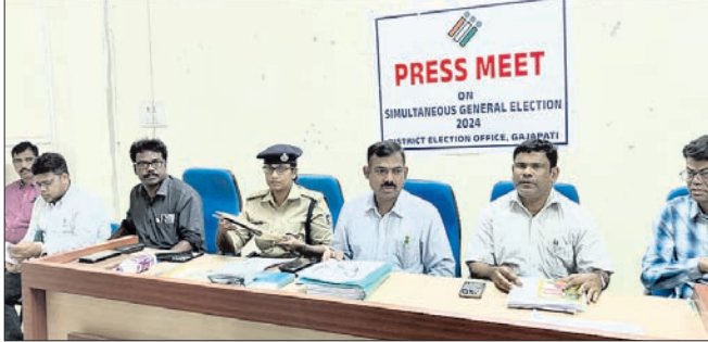
ଜିଲ୍ଲା ପ୍ରଶାସନ ପକ୍ଷରୁ ଖବରଦାତା ସମ୍ମିଳନୀରେ ସୂଚନା ଦିଆଯାଇଛି ।

ପାରଳାଖେମୁଣ୍ଡି, ୧୭୩ (ଗିରିଧାରା ପରିକ୍ଷା) ଆଗାମୀ ସାଧାରଣ ନିର୍ବାଚନ ନିମନ୍ତେ ରବିବାର ଗଜପତି ଜିଲ୍ଲାପାଳଙ୍କ ସମ୍ମିଳନୀ କକ୍ଷରେ ଏକ ଖବରଦାତା ସମ୍ମିଳନୀ ଅନୁଷ୍ଠିତ ହୋଇଛି । ଜିଲ୍ଲାର ୪ ଲକ୍ଷ ୫୯ ହଜାର ୨୨୮ ଭୋଟର ରହିଥିବାବେଳେ ସେମାନଙ୍କ ମଧ୍ୟରୁ ୨ ଲକ୍ଷ ୨୪ ହଜାର ୪୦୫ ପୁରୁଷ ଓ ୨ ଲକ୍ଷ ୩୪ ହଜାର ୭୯୯ ଜଣ ମହିଳା ଓ ୨୪ ଜଣ ତୃତୀୟ ଲିଙ୍ଗ ରହିଛନ୍ତି । ୨୫୪୦ ଜଣ ବରିଷ୍ଠ ନାଗରିକ, ୧୦୩୭ ବିଦ୍ୟାଳୟ ଭୋଟର ଅଛନ୍ତି । ଜିଲ୍ଲାରେ ନିର୍ବାଚନ ଆଚରଣବିଧି ଲାଗୁ ହେବା ସହିତ ସହକାରୀ ଚାରି ଚକିଆ ଯାନ ମାଲିକମାନେ ଟିମ୍ ଗଠନ କରାଯାଇଛି । ନିର୍ବାଚନକୁ ସ୍ୱଚ୍ଛ, ଅବାଧ ଓ ଶାନ୍ତିପୂର୍ଣ୍ଣ କରିବା ପାଇଁ ପ୍ରଶାସନ