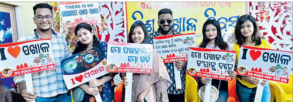
କଟକ ମାହୁଆ ବଜାରସ୍ଥିତ ଏକ ମଣ୍ଡପରେ କ୍ଷେତ୍ରାଧିକାରୀ ଅନୁଷ୍ଠାନ କର୍ମ କରୁଥିବା ସେବା ସମିତି ଗୁଡ଼ିକ ପକ୍ଷରୁ ରବିବାର ପଞ୍ଚାଳ ବିବସ ପାଳନ କରାଯାଇଛି।