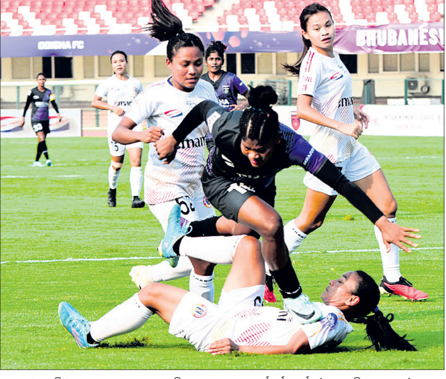
ଓଏଫସି ଓ ଇଷ୍ଟ ବେଙ୍ଗାଲ ମଧ୍ୟରେ ଅନୁଷ୍ଠିତ ମ୍ୟାଚର ଏକ ସଂଘର୍ଷପୂର୍ଣ୍ଣ ମୁହୂର୍ତ୍ତ।