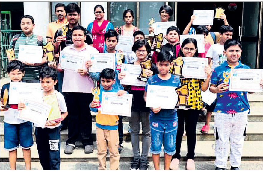
ଅତିଥିକ ଗହଣରେ କୃତୀ ପ୍ରତିଯୋଗୀ।