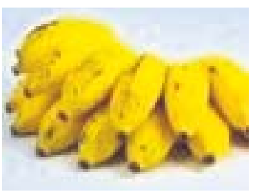
କେଶର, କ୍ଷୀର ଆଦିରେ ଏହି ଭିଟାମିନ୍ ଭରି ରହିଛି। ଏ ସମ୍ପର୍କରେ ଅଧିକ ଜାଣିବା ପାଇଁ ଅଭିଜ୍ଞ ଡାକ୍ତରଙ୍କ ସହ ପରାମର୍ଶ କରନ୍ତୁ।

ନୁହେଁ, ଏହା ଅସ୍ଥିକଳିତ ରହିଲେ ତାହାର ପ୍ରଭାବ ରୋଗ ପ୍ରତିରୋଧକ ଶକ୍ତି ଉପରେ ପଡ଼ିଥାଏ। ସୂନିଭର୍ଷିତ ଅର୍ଥ କାଳିଫର୍ଣ୍ଣିଆର ପୁଷ୍ଟିବିଜ୍ଞାନୀମାନେ ମତ ଦେଇଛନ୍ତି ଯେ, ଯଦି ଜଣେ ବ୍ୟକ୍ତି ଶରୀରରେ ଏହାର ପରିମାଣ କମ୍‌ଥାଏ, ତେବେ ସେ ହୃଦ୍‌ଘାତ ହେବା ସହ ରକ୍ତଚାପ ପରି ସମସ୍ୟାର ସମ୍ମୁଖୀନ ହେବାର ଆଶଙ୍କା ରହିଛି। କବଳୀ, କମଳା, ଆଳମଣ୍ଡ, ଛତୁ, ଅଣ୍ଡା