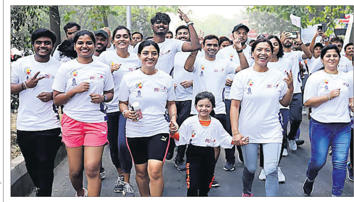
ଲୋକ ସଭା ନିର୍ବାଚନ ପୂର୍ବରୁ ଭୋଟର ସଚେତନତା ପାଇଁ ବୋମ୍ବେଇରେ କର୍ମଚାରୀଙ୍କ ମୁଖ୍ୟ ନିର୍ବାଚନ ଅଧିକାରୀଙ୍କ ପକ୍ଷରୁ ରବିବାର ଆୟୋଜିତ 'ଭୋଟ୍-ଏ-ଥର୍' ଶୀର୍ଷକ ମାରାଥୀରେ ଲୋକ ଭାଗ ନେଇଛନ୍ତି।