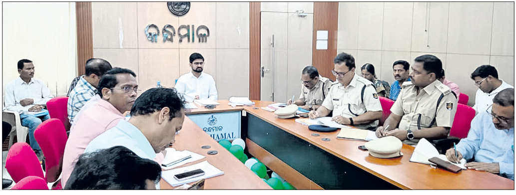
ଜିଲ୍ଲାପାଳଙ୍କ ସହ ଅଧିକାରୀ ଏବଂ ଅନ୍ୟମାନେ ।

ନିର୍ବାଚନ ଚାରିଖ ଘୋଷଣା ପରେ ଶନିବାରଠାରୁ ଆଦର୍ଶ ଆଚରଣ ବିଧି ଲାଗୁକରାଯାଇଛି । କକ୍ଷମାଳ ଜିଲ୍ଲାପାଳ ଆଖିଶ ଇଶ୍ୱର ପାଟିଲ ରବିବାର ଜିଲ୍ଲାର ସମସ୍ତ ଅଧିକାରୀମାନଙ୍କୁ ନେଇ ଭଲ୍ଲାଲ ମୋଡ଼ରେ ଏକ ବୈଠକର ଆୟୋଜନ କରି ଭାରତୀୟ ନିର୍ବାଚନ ଆୟୋଗଙ୍କ ଦ୍ୱାରା ଲାଗୁ କରାଯାଇଥିବା ଆଦର୍ଶ ଆଚରଣ ବିଧି ଉପରେ ଆଲୋଚନା କରିଥିଲେ । ଏହାର ମୂଳ ଲକ୍ଷ୍ୟ ହେଲା ଅବାଧ ଓ ନିରପେକ୍ଷ ନିର୍ବାଚନ ପରିଚାଳନା କରିବା । ନିର୍ବାଚନ କାର୍ଯ୍ୟସୂଚୀ ଘୋଷଣା ଠାରୁ ନିର୍ବାଚନ ପ୍ରକ୍ରିୟା ଶେଷ ହେବା ପର୍ଯ୍ୟନ୍ତ ଏହା କାର୍ଯ୍ୟକାରୀ ହେବ । ଏଥିରେ ରାଜନୈତିକ ଦଳ ଏବଂ ପ୍ରାର୍ଥୀଙ୍କ ସମେତ ସମସ୍ତ ସରକାରୀ କର୍ମଚାରୀଙ୍କୁ ମଧ୍ୟ ଅନ୍ତର୍ଭୁକ୍ତ କରାଯାଇଛି । ନିର୍ବାଚନ ପ୍ରଚାର ପାଇଁ କର୍ମକାରୀଙ୍କୁ ନିର୍ବାଚନ ଅଧିକାରୀ ପରାମର୍ଶ ଦେଇଥିଲେ । ପ୍ରଚାର ପାଇଁ ସରକାରୀ ଗାଡ଼ିର ବ୍ୟବହାର ଉପରେ ସ୍ପଷ୍ଟ ଭାବରେ ନିର୍ଦ୍ଦେଶ ଦିଆଯାଇଛି । ନିର୍ବାଚନ ଅଧିକାରୀଙ୍କୁ ଉପଯୁକ୍ତ ଅନୁମତି ଦିନା ସତ୍ତା, ରାଲି ଆଦି ଆୟୋଜନ ଉପରେ