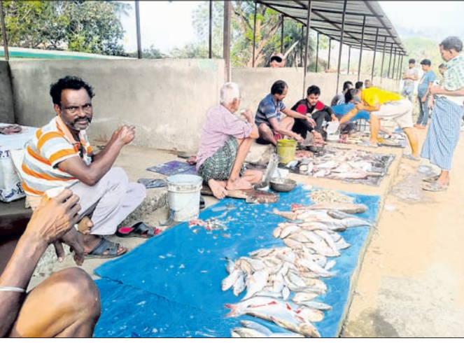
ବାଲିମେଳା ମାଛ ମାର୍ଜେଟ ।

ମାଲକାନଗିରି ଜିଲା ବାଲିମେଳା ସହର ସମେତ କୋରାପୁଟରୁ ବୁଲି ବିଭିନ୍ନ ଅଞ୍ଚଳରେ ଆମିଷ ଦର ନିୟନ୍ତ୍ରଣ ବାହାରକୁ ଚାଲିଯାଇଛି।