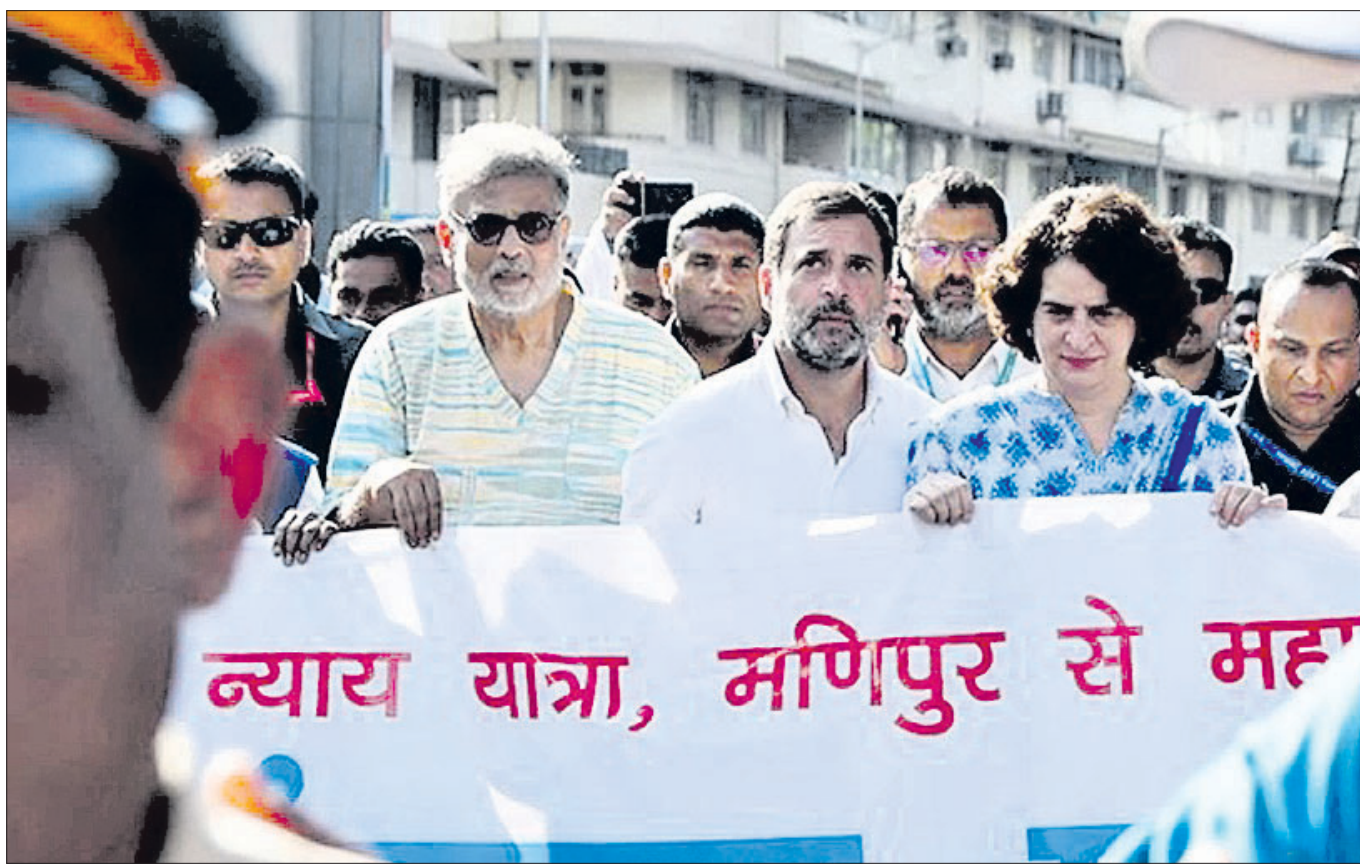
ପୁସ୍ତକରେ ନ୍ୟାୟ ସଂକଳ୍ପ ପଦଯାତ୍ରା ବେଳେ କଂଗ୍ରେସ ନେତା ରାହୁଲ ଗାନ୍ଧୀଙ୍କ ସହ ପ୍ରିୟଙ୍କା ଗାନ୍ଧୀ ଓ ମହାତ୍ମା ଗାନ୍ଧୀଙ୍କ ଅଣନାତି ତୁଷାର ଗାନ୍ଧୀ।