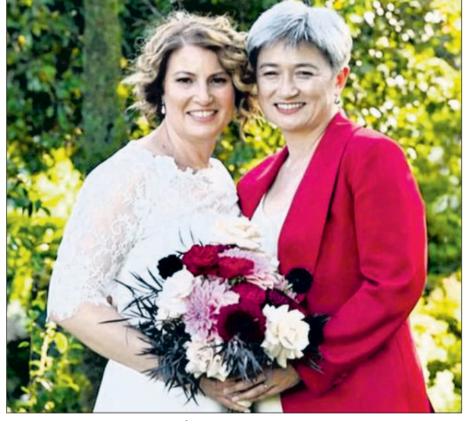
ଅଷ୍ଟ୍ରେଲିଆ ବହିର୍ବାସୀୟ ମନ୍ତ୍ରୀ ପେନି ଫ୍ରେଜ୍ (ବାମ)ଙ୍କ ସହ ମହିଳା ସମଲିଙ୍ଗୀ ପାର୍ଟିନର ସୋପିଆ ଆଲୋଭାଆତେ।

ବାରଣ କରାଯାଇଛି। ତେଣୁ ଶୁକ୍ରବାରଠାରୁ ଚାଲିଥିବା ୩ ଦିନିଆ ମତଦାନ ବେଳେ ତାଙ୍କୁ ବିଶେଷ ବିରୋଧର ସମ୍ମୁଖୀନ ହେବାକୁ ପଡ଼ିନାହିଁ। ପୁଣି ପୁଣିଥରେ ଦେଇଛନ୍ତି। ପ୍ରକାଶ ଯେ, ଗତମାସରେ