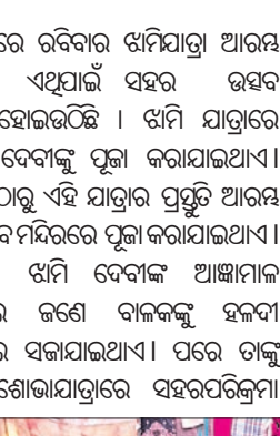
ଝାମିଦେବୀଙ୍କ ପୂଜାର୍ଚ୍ଚନା କରାଯାଉଛି ।

ବ୍ୟବସାୟୀଙ୍କର ଦୀର୍ଘବର୍ଷ ହେବ ଓଜନ ମାପକ ବଚକର। ଆସିବେଳେ ନବୀକରଣ ହୋଇ ନ ଥିବାରୁ ପ୍ରତିଦିନ ବେପାରୀମାନେ କୁଳଖିଲା କୁଳଖିଲା ମାଛ ଏପରି ବିକି ମାଲମାଲ ହେଉଛନ୍ତି।