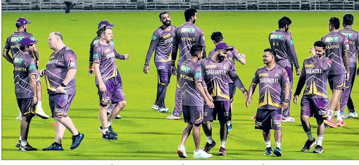
ଆଇପିଏଲ୍ ୨୦୨୪ ପୂର୍ବରୁ କୋଲକାତାର ଇଡେନ୍‌ଗାର୍ଡେନ୍‌ରେ କୋଲକାତା ନାଇଟ୍ ରାଇଡର୍ସର ଅଭ୍ୟାସ କ୍ୟାମ୍ପ।

ପାଇଁ ଏହା ହେଉଛି ଏକ ଗୁରୁତ୍ୱପୂର୍ଣ୍ଣ ପର୍ଯ୍ୟାୟ। ଦଳ ଏଥର ପୋଡିୟମ ଫିନିଶ କରିବାକୁ ଲକ୍ଷ୍ୟ ରଖିଛି। ଏଥିଲାଗି ଦଳକୁ ସମସ୍ତ ପ୍ରକାର ଆବଶ୍ୟକ ସହାୟତା ଯୋଗାଇ ଦିଆଯିବ। ଏହି ସ୍ୱତନ୍ତ୍ର କୋର୍ସ କ୍ୟାମ୍ପରେ ବିଶେଷକରି ଗୋଲ୍‌କିପିଙ୍ଗ୍ ଓ ଡ୍ରାଗ୍ ପୂର୍ଣ୍ଣ ଉପରେ ଗୁରୁତ୍ୱ ଆରୋପ କରାଯାଉଛି। ଭାରତର ପଲ୍ ପୂର୍ବରୁ ଏସିଆନ ଗେମ୍ ପୂର୍ବରୁ ଲୁଲାଇ ଓ ସେପ୍‌ସେରେ ଭାରତୀୟ ଦଳର ବୁଲ୍‌ଡି ସ୍ୱତନ୍ତ୍ର କ୍ୟାମ୍ପ ପରିଚାଳନା କରିଥିଲେ।