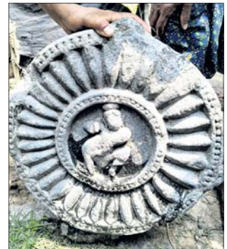
ଉଦ୍ଧାର ହୋଇଥିବା ଶ୍ରୀକୃଷ୍ଣଙ୍କ ମୂର୍ତ୍ତି