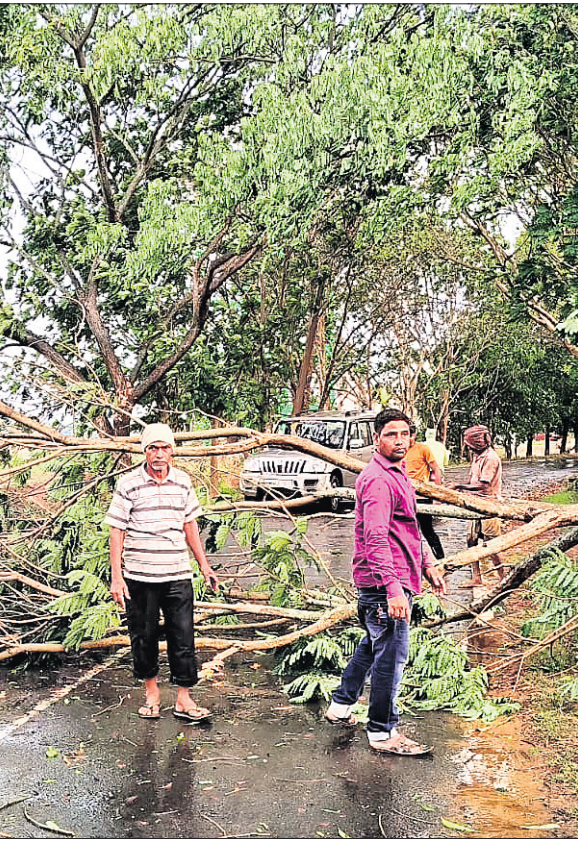
ବହୁଆଁ-ବାଲିଚନ୍ଦ୍ରପୁର ମୁଖ୍ୟ ରାସ୍ତାରେ ଗଛ ଭାଙ୍ଗିପଡ଼ିଛି।

ବ୍ରହ୍ମବରବା, ୧୭ମା (ଯଯାତି ବେହେରା) କାଳବୈଶାଖୀ ଯୋଗୁଁ ରବିବାର ଅପରାହ୍ନରେ ରଘୁଲତାପୁର ବ୍ଲକ୍ ଅଧୀନ ବ୍ରହ୍ମବରବା ପଞ୍ଚାୟତ ଅଞ୍ଚଳରେ ବ୍ୟାପକ କ୍ଷୟକ୍ଷତି ହୋଇଛି। ଘଣ୍ଟାକୁ ୮୦ରୁ ୧୦୦ କିଲୋମିଟର ବେଗରେ ପବନ ବହିବା ସହ ଘନଘନ ବିଜୁଳି ଘଡ଼ଘଡ଼ି ମାରିବା ଦ୍ୱାରା ବହୁ ବ୍ୟକ୍ତିଙ୍କ ବୈଦ୍ୟୁତିକ ସାମଗ୍ରୀ ପୋଡ଼ିଯାଇଛି। ସ୍ଥାନେସ୍ଥାନେ ଗଛ ଉପୁଡ଼ିବା ସହ ଆୟ, ଚାକୁଣ୍ଡା, ଶକନା, ଆକାଶିଆ ପରି ଗଛର ଡାଳ ଭାଙ୍ଗି ରାସ୍ତା ଉପରେ ପଡ଼ିରହିଛି। ଅଞ୍ଚଳର ବହୁ ବ୍ୟକ୍ତିଙ୍କ ଘରର ଡାଳ, ଛପର ଉଡ଼ିଯାଇଛି। ବହୁଆଁ-ବାଲିଚନ୍ଦ୍ରପୁର ମୁଖ୍ୟ ରାସ୍ତାର ବ୍ରହ୍ମବରବା କଲେଜ ଛକ ନିକଟରେ ଏକ ବିରାଟକାୟ ଗଛ ଭାଙ୍ଗି ରାସ୍ତା ଉପରେ ପଡ଼ିବା ଦ୍ୱାରା କିଛି ସମୟ ପାଇଁ ଉକ୍ତ ରାସ୍ତାଦେଇ ଯାତାୟାତ ବାଧାପ୍ରାପ୍ତ ହୋଇଥିଲା। ସ୍ଥାନୀୟ ଲୋକେ ଗଛ କାଟି ସଫା କରିବା ପରେ ଗାଡ଼ି ଚଳାଚଳ ସ୍ୱାଭାବିକ ହୋଇଥିଲା। ପ୍ରାୟ ଏକ ଘଣ୍ଟା ଧରି କାଳ ବୈଶାଖୀ ଡାକ୍ତରରେ ଅଞ୍ଚଳରେ ବ୍ୟାପକ କ୍ଷୟକ୍ଷତି ଘଟିଛି। ବିଦ୍ୟୁତ୍ ସରବରାହ ବନ୍ଦ ରହିଛି।