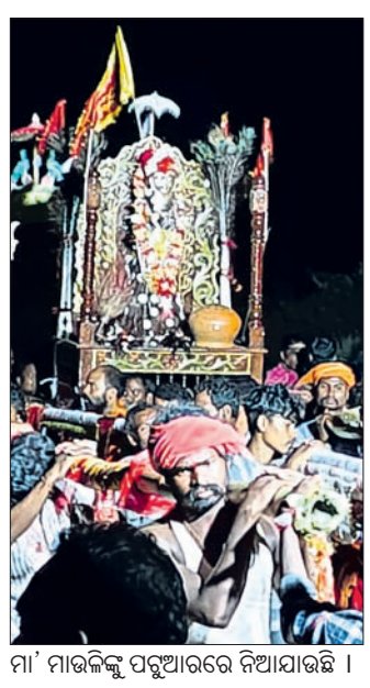
ମା' ମାଉଲିଙ୍କୁ ପଠୁଆରରେ ନିଆଯାଉଛି ।

ମାଲକାନଗିରି ଜିଲା କୋରାପୁଟରୁ ସଦର ବ୍ଲକରେ ମା' ମାଉଲିଙ୍କ ବଡ଼ ଯାତ୍ରାର ଶୁଭାରମ୍ଭ ହୋଇଛି।