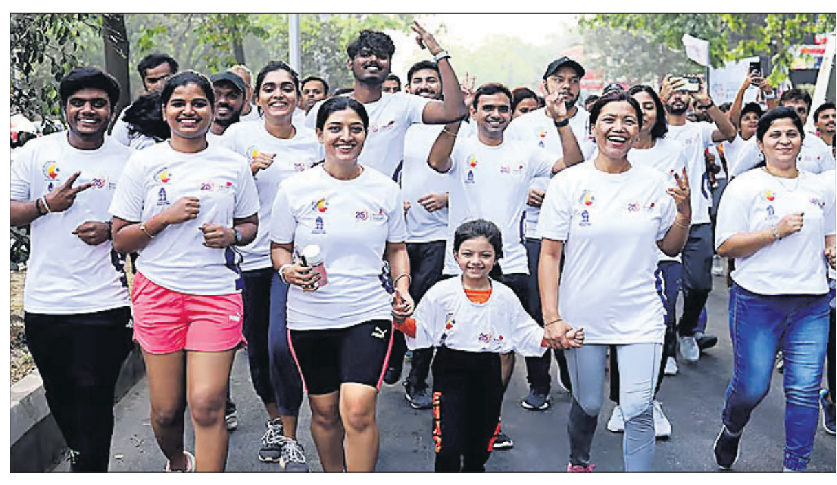
ଲୋକ ସଭା ନିର୍ବାଚନ ପୂର୍ବରୁ ଭୋଟର ସଚେତନତା ପାଇଁ ବେଙ୍ଗାଲୁରୁରେ କର୍ମଚକ ମୁଖ୍ୟ ନିର୍ବାଚନ ଅଧିକାରୀଙ୍କ ପକ୍ଷରୁ ରବିବାର ଆୟୋଜିତ 'ଭୋଟ୍-ଏ-ଥର୍' ଶୀର୍ଷକ ମାରାଥନ୍‌ରେ ଲୋକ ଭାଗ ନେଇଛନ୍ତି।