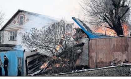
ଫ୍ରେନ୍ଡ୍ ମାଡ଼ ପରେ ବେକ୍‌ଗୋରୋଡ଼ର ଏକ ଗୋଠା ଭାଙ୍ଗିଯାଇଛି।

ଦିଲ୍ଲୀ ଜଳ ବୋର୍ଡ ଅନିୟମିତତା ଅଭିଯୋଗ ସହ ସମ୍ପୂର୍ଣ୍ଣ ମନିଲଣ୍ଡର ମାମଲାରେ ସୁପ୍ରିମକୋର୍ଟ ନିର୍ଦ୍ଦେଶାଳୟ (ଇଡି) ରବିବାର କାରି କରନ୍ତି। ଅନୁପକ୍ଷରେ ଲୋକ ସଭା ନିର୍ବାଚନରେ ପ୍ରଚାରରୁ କେଜ୍‌ରିଫ୍‌ଲଙ୍କୁ ଦୂରରେ ରଖିବା ପାଇଁ ଏହା ଏକ ସହାୟକ ସରକାରୀ ବୋଲି ଆର୍‌ସିଏଫ୍‌ଆର୍‌ସି (ଆପ୍) ଅଭିଯୋଗ କରିଛି। ମନିଲଣ୍ଡର ପ୍ରଚାର ଆଇନ(ସିଏଏଏ) ଅନୁଯାୟୀ, ସୋମବାର ଇଡିର ଏପିକେ ଅବଦୁଲ କଲୀମ ରୋଡ୍‌ରେ ଥିବା କାର୍ଯ୍ୟାଳୟରେ ହାଜର ହୋଇ ସମନ ରେକର୍ଡ କରାଯିବାରୁ କେଜ୍‌ରିଫ୍‌ଲଙ୍କୁ କୁହାଯାଇଛି। ଦିଲ୍ଲୀ ଅଧିକାରୀ ନାଟି ସମ୍ପର୍କିତ ମନିଲଣ୍ଡର ମାମଲାରେ ମଧ୍ୟ ଆପ୍ ଆବାହକ ତଦନ୍ତର ସମ୍ପୂର୍ଣ୍ଣାନ୍ତ ହୋଇଛି। ଏହି ମାମଲାରେ ହାଜର ହେବା ପାଇଁ ଇଡି କେଜ୍‌ରିଫ୍‌ଲଙ୍କୁ ୮ ଥର ସମନ କରିବା ସତ୍ତ୍ୱେ ସେ ହାଜର ହୋଇ ନାହାନ୍ତି। ଏହି ମାମଲାରେ ୨୧ ତାରିଖରେ ହାଜର ହେବା ପାଇଁ ଇଡି ପୁଣିଥରେ ତାଙ୍କୁ ସମନ ଜାରି କରିଛି।