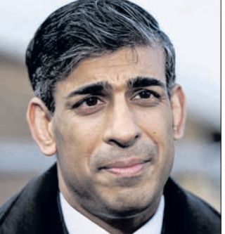
ବର୍ଷୀୟ କ୍ରିକେଟ ଭାରତୀୟ ନେତା ଖଣ୍ଡନ କରିଛନ୍ତି। ସେ ପ୍ରତାରକୁ ଓହ୍ଲାଇବା ପାଇଁ ନିଷ୍ପତ୍ତି ନେଇଥିବାବେଳେ ଆସନ ହରାଇବା ଆଶଙ୍କାରେ ଥିବା ଦଳର କେତେଜଣ ବିଦ୍ରୋହୀ ନେତାଙ୍କ ମଧ୍ୟରେ ଅଧିକାରୀଙ୍କର ସ୍ୱର ଦେଖାଯାଇଛି। ତେବେ ସାଧାରଣ ନିର୍ବାଚନରେ ସୁନକ କଞ୍ଜରଭେଟିକୁ ପାର୍ଟିର ନେତା ରହିବେ ବୋଲି ପରିବହନ ମନ୍ତ୍ରୀ ମାର୍କ ହାର୍ପର ଦୃଢ଼ାବଳି କରିଛନ୍ତି। ସୁନକଙ୍କ ଗ୍ଲାନରେ ପୂର୍ବତନ ପ୍ରତିଦ୍ୱନ୍ଦ୍ୱୀ ନେତା ତଥା ବର୍ତ୍ତମାନର ହାଉସ୍ ଅଫ୍ କମନ୍ସ ନେତା ପେନି ମର୍ଡୋକ୍ସ ନେତୃତ୍ୱ ନେବା ନେଇ ଚାଲିଥିବା ଗୁଜବକୁ ହାର୍ପର ଖଣ୍ଡନ କରିଛନ୍ତି।

ପାଇଁ ନିଷ୍ପତ୍ତି ନେଇଥିବାବେଳେ ଆସନ ହରାଇବା ଆଶଙ୍କାରେ ଥିବା ଦଳର କେତେଜଣ ବିଦ୍ରୋହୀ ନେତାଙ୍କ ମଧ୍ୟରେ ଅଧିକାରୀଙ୍କର ସ୍ୱର ଦେଖାଯାଇଛି। ତେବେ ସାଧାରଣ ନିର୍ବାଚନରେ ସୁନକ କଞ୍ଜରଭେଟିକୁ ପାର୍ଟିର ନେତା ରହିବେ ବୋଲି ପରିବହନ ମନ୍ତ୍ରୀ ମାର୍କ ହାର୍ପର ଦୃଢ଼ାବଳି କରିଛନ୍ତି। ସୁନକଙ୍କ ଗ୍ଲାନରେ ପୂର୍ବତନ ପ୍ରତିଦ୍ୱନ୍ଦ୍ୱୀ ନେତା ତଥା ବର୍ତ୍ତମାନର ହାଉସ୍ ଅଫ୍ କମନ୍ସ ନେତା ପେନି ମର୍ଡୋକ୍ସ ନେତୃତ୍ୱ ନେବା ନେଇ ଚାଲିଥିବା ଗୁଜବକୁ ହାର୍ପର ଖଣ୍ଡନ କରିଛନ୍ତି।