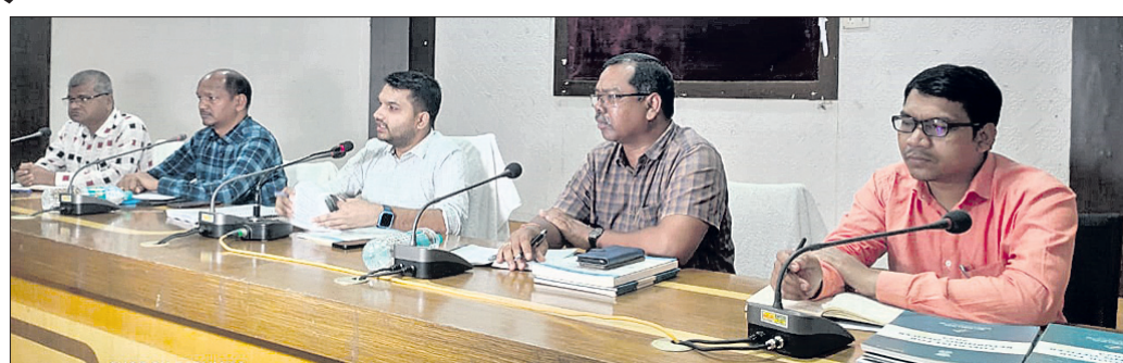
ବୈଠକରେ ଜିଲାପାଳ ଓ ଅନ୍ୟ ଅଧିକାରୀମାନେ ନିର୍ବାଚନ ସମ୍ବନ୍ଧୀୟ ସୂଚନା ଦେଉଛନ୍ତି ।

ମାଲକାନଗିରି ଜିଲାପାଳ ପାଞ୍ଚାଶ ସଦସ୍ୟ ବିଶିଷ୍ଟ ଏକ ଖବରଦାତା ସମ୍ମିଳନୀରେ ନିର୍ବାଚନ ପାଇଁ ସମସ୍ତ ପ୍ରସ୍ତୁତି ଶେଷ ହୋଇଥିବା ଏବଂ ଶନିବାରରୁ ଲାଗୁ ହୋଇଥିବା ଆଚରଣ ବିଧି କଡ଼ାକଡ଼ି ପାଳନ କରାଯିବ ବୋଲି କହିଛନ୍ତି।