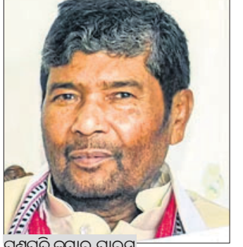
ପଶୁପତି କୁମାର ପାରସ୍

ଲୋକ ସଭା ନିର୍ବାଚନ ପାଇଁ ବିହାରରେ ଆସନ ବୁଝାମଣାରେ ଭାଜପା ରାଷ୍ଟ୍ରୀୟ ଲୋକ ଜନଶକ୍ତି ପାର୍ଟି (ଆରଏଲ୍‌ଜେପି) ପ୍ରତି ଅନାୟାସ କରିଥିବା ଅଭିଯୋଗ କରି ପଶୁପତି କୁମାର ପାରସ ମଙ୍ଗଳବାର କେନ୍ଦ୍ର ମନ୍ତ୍ରଣାଳୟ ଇସ୍ତଫା ଦେଇଛନ୍ତି। ସେମାନେ ବିହାରରେ ଏନଡିଏ ମେଝ ପାଇଁ ଆସନ ବୁଝାମଣା ତୁଟାଇ ଦେଇଥିଲେ। ଭାଜପା କଠୋର ହେଉଥିବା ଆସନରେ ନିର୍ବାଚନ ଲଢ଼ିବାକୁ ଥିବାବେଳେ କେନ୍ଦ୍ରରେ ୧୨ ଏବଂ ବିହାର ପାଖାପାଖି ନେତୃତ୍ୱାଧୀନ ଏଲ୍‌ଜେପି(ରାମବିକାସ)କୁ ୫ ଆସନ ଛାଡ଼ିଥିଲା। ତେବେ ପଶୁପତିଙ୍କ ଦଳ ଆରଏଲ୍‌ଜେପିକୁ ମେଝରେ ଅଣବେଶା