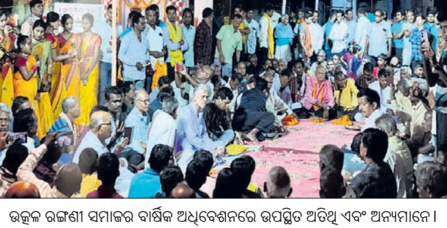
ଉତ୍କଳ ରଙ୍ଗଣୀ ସମାଜର ବାର୍ଷିକ ଅଧିବେଶନରେ ଉପସ୍ଥିତ ଅତିଥି ଏବଂ ଅନ୍ୟମାନେ।