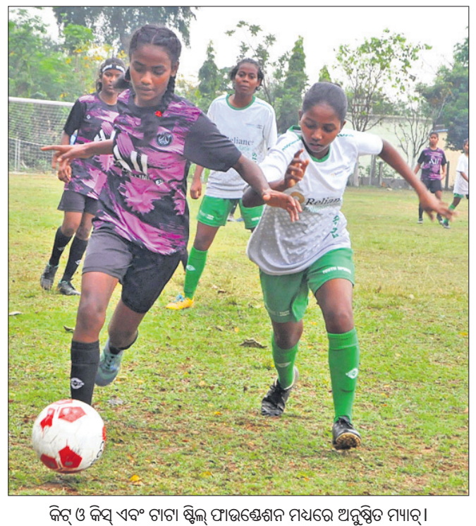
କିଟ୍ ଓ କିସ୍ ଏବଂ ଟାଟା ଷ୍ଟିଲ୍ ଫାଉଣ୍ଡେସନ ମଧ୍ୟରେ ଅନୁଷ୍ଠିତ ମ୍ୟାଚ୍।