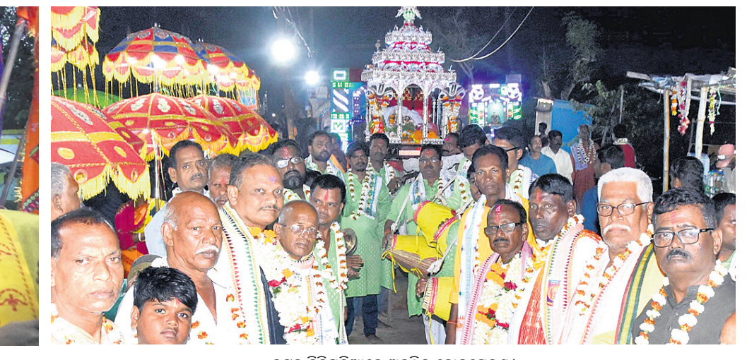
କଟକ ଚିନ୍ଦିଆରେ ଅନୁଷ୍ଠିତ ବୋକମେଳଣ।