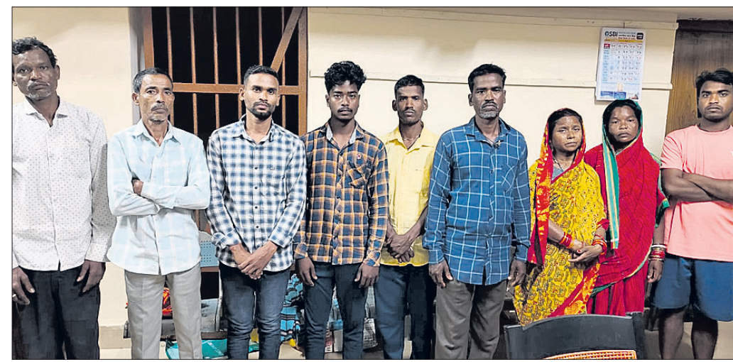
ଗିରଫ ହୋଇଥିବା ଅଭିଯୁକ୍ତମାନେ।

ଭୁବନେଶ୍ୱର, (ପୂର୍ଣ୍ଣକାନ୍ତ ବେହେରା) / ବାଲିପାଟଣା (ଅଭିମନ୍ୟୁ ନାୟକ) ୧୯/୩