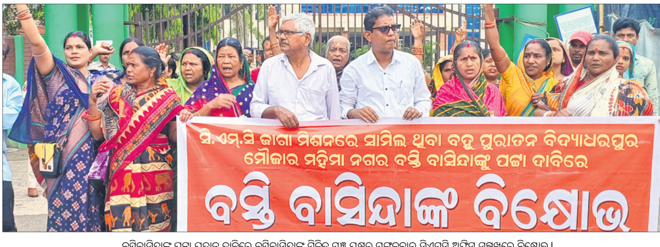
ବସ୍ତ୍ରବାସିନ୍ଦାଙ୍କୁ ପକା ପ୍ରଦାନ ଦାବିରେ ବସ୍ତ୍ରବାସିନ୍ଦାଙ୍କ ମିଳିତ ମଞ୍ଚ ପକ୍ଷରୁ ମଙ୍ଗଳବାର ସିଏମ୍‌ସି ସମ୍ମୁଖରେ ବିକ୍ଷୋଭ।