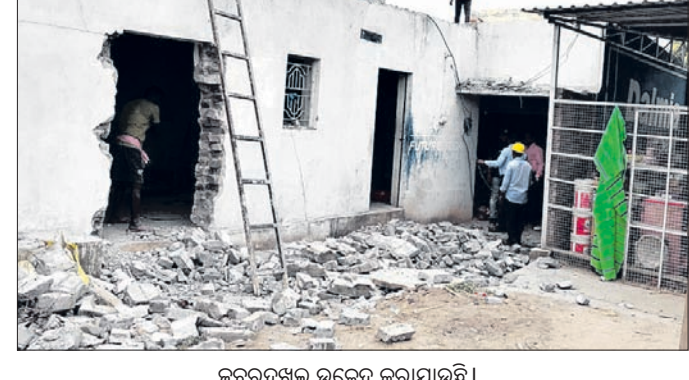
ଜବରଦସ୍ତଳ ଉଚ୍ଛେଦ କରାଯାଇଛି।