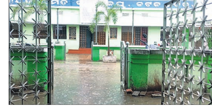
ବୁକ୍ କାର୍ଯ୍ୟାଳୟ ପରିସରରେ ଜମି ରହିଥିବା ବର୍ଷା ପାଣି।

କଟକ ସଦର, ୧୯୩୩ (ସୁଶାନ୍ତ କୁମାର ଜେନା) କଟକ ସଦର ବୁକ୍ ଅଞ୍ଚଳରେ ବର୍ଷା ହୋଇଛି। ଏଥିପାଇଁ କଟକ ସଦର ବୁକ୍ କାର୍ଯ୍ୟାଳୟ ପରିସରରେ ବର୍ଷା ପାଣି ଜମି ରହି କୃତ୍ରିମ ବନ୍ୟାର ଭ୍ରମ ସୃଷ୍ଟି କରିଛି। ଏଥିପାଇଁ ବୁକ୍ କର୍ମଚାରୀ