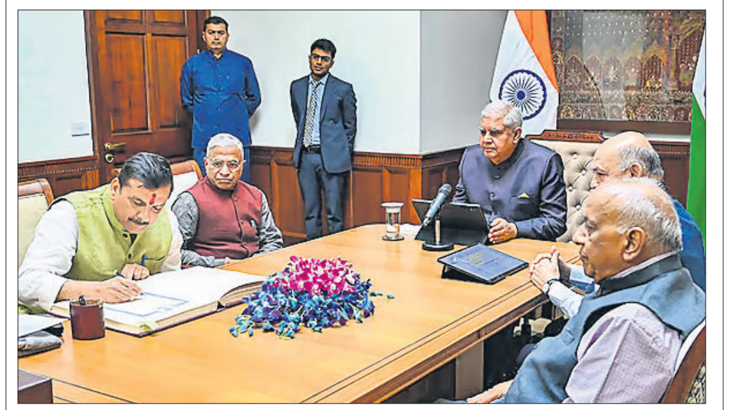
ଦିଲ୍ଲୀ ଅବକାରୀ ଦୁର୍ଗତି ମାମଲାରେ ଜେଲରେ ଥିବା ଏଏପି ନେତା ସଞ୍ଜୟ ସିଂ ମଙ୍ଗଳବାର ପାଇଁମେଝି ଆସି ରାଜ୍ୟ ସଭା ସଦସ୍ୟ ଭାବେ ଶପଥ ନେବା ପରେ ଦସ୍ତାବିଜରେ ସ୍ୱାକ୍ଷର କରୁଛନ୍ତି। ରାଜ୍ୟ ସଭା ଅଧ୍ୟକ୍ଷ କରବୀପ୍ ପନ୍ଦର ଏବଂ ଉପାଧ୍ୟକ୍ଷ ହରିକେଶ ନାରାୟଣ ସିଂ ଉପସ୍ଥିତ ଅଛନ୍ତି।

ଆଗାମୀ ଲୋକ ସଭା ଏବଂ ବିଧାନସଭା ନିର୍ବାଚନରେ ଶରଦ ପାଠ୍ୟର ଗୋଷ୍ଠି ଏହାର ନାମ 'ନାଶନାଲିଷ୍ଟ କଂଗ୍ରେସ ପାର୍ଟି-ଶରଦକ୍ରମ ପାଠ୍ୟ' ଏବଂ ଦଳୀୟ ଚିହ୍ନ 'ତୁରୀ ବଜାର'ର ବ୍ୟକ୍ତି ବ୍ୟବହାର କରିପାରିବେ। ଏଥିପାଇଁ ସୁପ୍ରିମକୋର୍ଟ ମଙ୍ଗଳବାର ଅନୁମତି ପ୍ରଦାନ କରିଛନ୍ତି। ଅତି ପାଠ୍ୟର ଗୋଷ୍ଠି ନିର୍ବାଚନରେ 'ଘଣ୍ଟା' ଚିହ୍ନ ବ୍ୟବହାର ଉପରେ ରୋକ ଲାଗାଇବାକୁ ଶରଦ ପାଠ୍ୟର ଗୋଷ୍ଠି ଆବେଦନ କରିଥିଲା। ଶରଦ ପାଠ୍ୟର ଏନିଏସି ପ୍ରତିଷ୍ଠା କରିଥିବାବେଳେ ଏହା ବିଭାଜିତ ହେବା ପୂର୍ବରୁ ଦଳୀୟ ଚିହ୍ନ ଘଣ୍ଟା ରହିଥିଲା। ଅତି ପାଠ୍ୟର ଗୋଷ୍ଠି ନିର୍ବାଚନ କମିଶନ ପ୍ରକୃତ ଏନିଏସିର ମାନ୍ୟତା ଦେବା ସହ ଘଣ୍ଟା ଚିହ୍ନ ପ୍ରଦାନ କରିଥିବାରୁ ଏହା ନିର୍ବାଚନରେ ଭୋଟରଙ୍କୁ ବିଭ୍ରାନ୍ତ କରିବ ବୋଲି ଅଭିଯୋଗ କରି ପାଠ୍ୟର ଗୋଷ୍ଠି ଉଚ୍ଚ ଚିହ୍ନରେ ଅଧିକାର ପାଇଁ ଅତି ପାଠ୍ୟର ଗୋଷ୍ଠିକୁ ଅନୁମତି ନ ଦେବାକୁ ଅନୁରୋଧ କରିଥିଲେ। ଏହା ବିଚାରାଧୀନ ଥିବାବେଳେ ଚଳିତ ନିର୍ବାଚନରେ ଅତି ପାଠ୍ୟର ଘଣ୍ଟା ଚିହ୍ନ ବ୍ୟବହାର କରିବାକୁ ଅନୁମତି ଦିଆଯିବ।