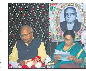
ସାରକା ଭବନରେ ଅନୁଷ୍ଠିତ ସ୍ମୃତି ସମାରୋହରେ ଯୋଗଦେଇଥିବା ଅତିଥିବୃନ୍ଦ।