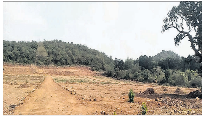
ବେଲପଡ଼ା ମୌଜାରେ ଜମି ମାଫିଆଙ୍କ ରାଜୁତି ପରିବର୍ତ୍ତନ ମନ୍ତ୍ରଣାଳୟରେ ଅଭିଯୋଗ

ଖୋର୍ଦ୍ଧା ଜିଲ୍ଲା ବେଗୁନିଆ ତହସିଲ ଅଞ୍ଚଳରେ ଜମି ମାଫିଆଙ୍କ ରାଜୁତି ବଢ଼ିବାରେ ଲାଗିଛି। ଗାଡ଼ି ପ୍ରମାଣପତ୍ରରେ ଚଞ୍ଚଳତା ଓ ଜମିର କିମ୍ବଦନ୍ତୀ ପରିବର୍ତ୍ତନ କରି ବିକ୍ରି କରିଦେଉଥିବା ନିଜର ରହିଛି।