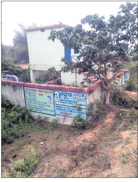
ଅଟଳ ହୋଇଯାଇଥିବା ପାନୀୟକଳ ପ୍ରକଳ୍ପ।

ନିଶ୍ଚିତକୋଇଲି ରୁକ୍ମ ବାବୁଙ୍କ ପଞ୍ଚାୟତରେ ପାନୀୟ ଜଳ ପ୍ରକଳ୍ପ ଦୀର୍ଘଦିନ ହେବ ଅଟଳ ହୋଇଯାଇଛି। ଗ୍ରାମ୍ୟ ପରିମଳ ଓ ଜଳ ଯୋଗାଣ ବିଭାଗର ଦାୟିତ୍ୱହୀନତା ଓ ଅବହେଳା କାରଣରୁ ଏପରି ଅବସ୍ଥା ହୋଇଥିବା ଅଭିଯୋଗ ହୋଇଛି। ଫଳରେ ପାନୀୟ ଜଳ ପାଇଁ ଲୋକେ ତହଳ ଦିଲି ହେଉଛନ୍ତି। ଏହାସତ୍ତ୍ୱେ ପାନୀୟ ଜଳ ପ୍ରକଳ୍ପକୁ ସତଳ କରିବା ପାଇଁ ବିଭାଗୀୟସ୍ତରରେ ପଦକ୍ଷେପ ନିଆଯାଇ ନ ଥିବାରୁ ଗ୍ରାମୀୟ ଅଞ୍ଚଳରେ ଅସନ୍ତୋଷ ପ୍ରକାଶ ପାଇଛି।