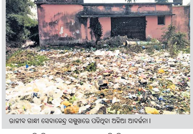
ରାଜ୍ୟ ଗାନ୍ଧୀ ସେବାକେନ୍ଦ୍ର ସମ୍ପୂର୍ଣ୍ଣରେ ପଡ଼ିଥିବା ଅଭିଆ ଆବର୍ଜନା।