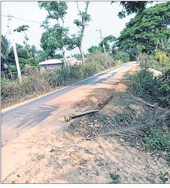
ପାଟିଯାଇଥିବା ପାଇବ୍ ଲାଇବ୍।

ପଞ୍ଚାୟତ ପାନୀୟ ଜଳ ପ୍ରକଳ୍ପ ଉପରେ ବାବୁଙ୍କ ଗ୍ରାମର ଲୋକେ ନିର୍ଭର କରିଥାନ୍ତି। ସରକାରଙ୍କ ତରଫରୁ ଲକ୍ଷ୍ୟକ ଟଙ୍କା ବ୍ୟୟରେ ଏହି ପାନୀୟ ଜଳ ପ୍ରକଳ୍ପ ସ୍ଥାପନ କରାଯାଇଥିଲା। ମାତ୍ର ସମ୍ପୂର୍ଣ୍ଣ ଠିକାଦାର ଅଟଳ ଅନୁଯାୟୀ ନିର୍ମାଣ କାର୍ଯ୍ୟ କରି ନଥିବା ଅଭିଯୋଗ ହୋଇଛି। ଏପରିକି ଠିକାଦାର ବିଚ୍ଛାଦିତ ପାଇଁ ପ୍ରକଳ୍ପକୁ ଅଟଳ କରି ଦେଇଛନ୍ତି। ଉତ୍କଳ ଜଳସ୍ତର ନିମ୍ନଗାମୀ ହୋଇ ପଡ଼ିଛି। ଫଳରେ ନଦୀ କୂଳରେ ଥିବା ଏହି ପଞ୍ଚାୟତରେ ଉତ୍କଳ ଜଳାଭାବ ବେଶାଦେଇଛି। ଜନ ସାଧାରଣଙ୍କ ସହ ପାନୀୟ ଜଳ ନିମନ୍ତେ ଅଟଳ ହୋଇଯାଇଛି ବୋଲି ଗ୍ରାମୀୟ ଲୋକେ ଅଭିଯୋଗ କରାଯାଇଛି। ଗତ କିଛି ଦିନ ହେଲା ଗ୍ରାମୀୟ ଅଞ୍ଚଳରେ ଅହେତୁକ ଭାବେ ଚାପମାତ୍ରା ବୃଦ୍ଧି ପାଇଛି। ଅସହ୍ୟ ଗରମ ଓ ଗୁରୁତ୍ୱକ୍ରିୟ ଅନୁଭୂତ ହେଉଛି। ଉତ୍କଳ ଜଳସ୍ତର ନିମ୍ନଗାମୀ ହୋଇ ପଡ଼ିଛି। ଫଳରେ