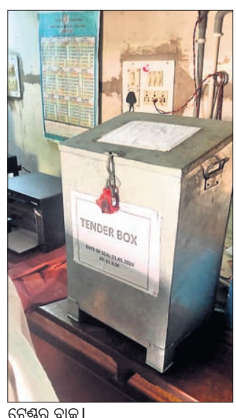
ଚେଣ୍ଡର ବାବୁ ଚଳିତବର୍ଷ ଅହେତୁକ ବୃଦ୍ଧି କରାଯିବା ଚେଣ୍ଡର ନ ପଡ଼ିବାର କାରଣ ବୋଲି