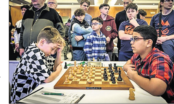
ଏକ ମ୍ୟାଚ୍ ଅବସରରେ ଅଂଶ ନେତୁରକର (ଡାହାଣ)।

ପ୍ରଥମ ଭାରତୀୟ ଭାବେ ଜିତିଲେ ନେତୁରକର। ଭୁବନେଶ୍ୱର ୧୨୧ ରନ୍ରେ ବିଜୟ ହାସଲ କରିଛି। ଭୁବନେଶ୍ୱର ୧୨୧ ରନ୍ରେ ବିଜୟ ହାସଲ କରିଛି। ଭୁବନେଶ୍ୱର ୧୨୧ ରନ୍ରେ ବିଜୟ ହାସଲ କରିଛି।