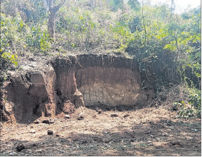
ପାହାଡ଼ରୁ ବେଆଇନ ଭାବେ ମୋରମ କଟାଯାଇ ଚାଲାଣ କରାଯାଉଛି। ବିଶେଷକରି ମୋରମ ମାଟିଆମାନେ ବିକ୍ରୟ ଚାଟିରେ ଜେସିପି ମେଶିନ

ଅନୁଗୋଳ ଜିଲ୍ଲା କିଶୋରନଗର ବ୍ଲକ୍ ହତ୍ତପା ଥାନା ନାକିତି ରାଜସ୍ୱ କାର୍ଯ୍ୟାଳୟ ଅଧୀନରେ ଥିବା କଣ୍ଡାଳ ପାହାଡ଼ରୁ କିଛିଦିନ ହେବ ମୋରମ ମାଟିଆମାନେ ବେଆଇନ ଭାବେ ମୋରମ ଚାଲାଣ କରୁଥିବା ଅଭିଯୋଗ ହୋଇଛି। ଏ ନେଇ ଅଞ୍ଚଳବାସୀ ନାକିତି ରାଜସ୍ୱ କାର୍ଯ୍ୟାଳୟରେ ଅଭିଯୋଗ କଲେ ମଧ୍ୟ କୌଣସି ପୁଫଳ ମିଳୁନାହିଁ। ଏହାର ପ୍ରତିବାଦରେ ରୁଧିରୀ କଣ୍ଡାଳ ଗ୍ରାମବାସୀ ଅନୁଗୋଳ ଜିଲ୍ଲାପାଳଙ୍କଠାରେ ଅଭିଯୋଗ କରିଛନ୍ତି। ଗ୍ରାମବାସୀ ଅଭିଯୋଗପତ୍ରରେ ଦର୍ଶାଇଛନ୍ତି, ନାକିତି ତଥା ଆଖପାଖ ଅଞ୍ଚଳରେ ଥିବା ସରକାରୀ ଜମି ଓ କିଛି