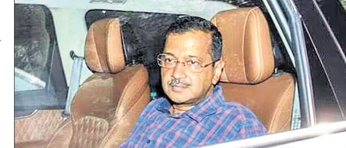
ଦିଲ୍ଲୀ ମୁଖ୍ୟମନ୍ତ୍ରୀ ଅରବିନ୍ଦ କେଜ୍‌ରିୱାଲଙ୍କୁ ଇଟି ପକ୍ଷରୁ ଗିରଫ କରି ନିଆଯାଇଛି। ନୂଆଦିଲ୍ଲୀ, ୨୧ମାର୍ଚ୍ଚ