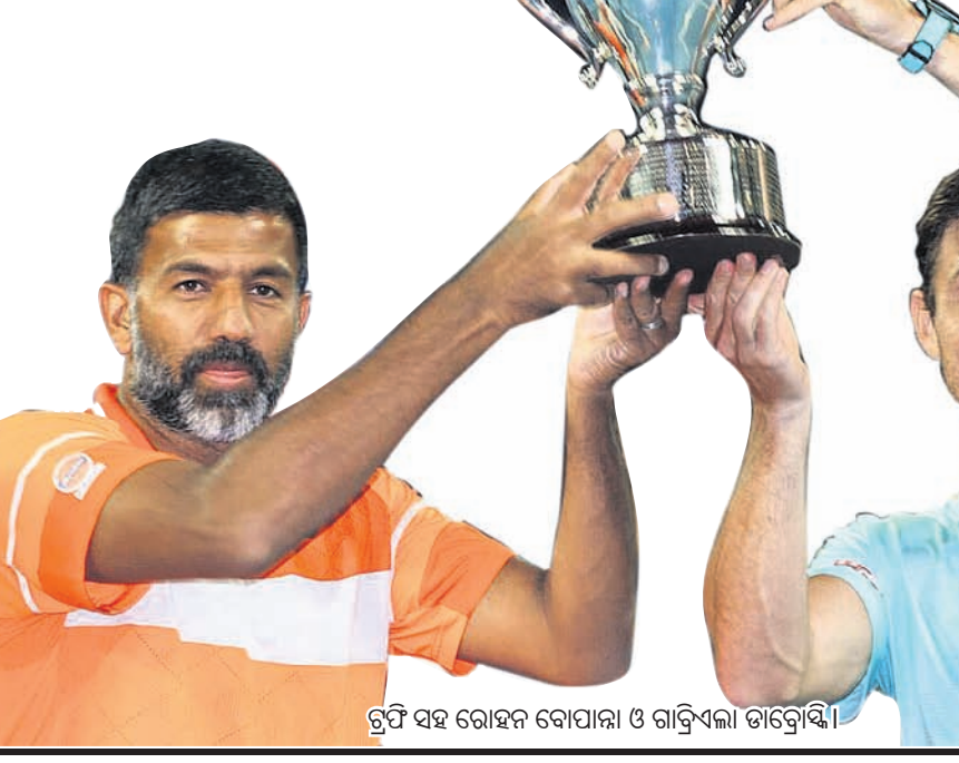
ଟ୍ରଫି ସହ ରୋହନ ବୋପାଳା ଓ ଗାବ୍ରିଏଲା ଡାବ୍ରୋସି

ଫ୍ରେମ୍‌ଲନ୍ଡ୍ ଓପନ୍ ସେମିଫାଇନାଲରେ ପରାଜିତ ହୋଇଥିଲେ। ଦୁଇଟି ଗ୍ରାଣ୍ଡସ୍ଲାମ, ୨୪ଟି ଏଟିପି ଗାଇଟଲ ଏବଂ ଏସୀୟ କ୍ରୀଡ଼ା ଚେନ୍‌ସିରେ ସ୍ୱର୍ଣ୍ଣପଦକ ବିଜୟୀ ହୋଇଥିଲେ ବେଳେ ପୁରସ୍କାର ରାଶି ଓ କମ୍ପାନୀ ବିଜ୍ଞାପନରୁ ସେ ମୋଟ ୬୨ଲକ୍ଷ ପାଉଣ୍ଡ ରୋଜଗାର କରିଥିବା ଜଣାଯାଇଛି। ଇତିମଧ୍ୟରେ ୧୯ ଖେଳାଳି ବୋପାଳାଙ୍କର ଯୋଡ଼ିବାର ହୋଇସାରିଲେଣି। ୨୦୨୨ ଶେଷଭାଗରେ ଅଷ୍ଟ୍ରେଲିଆର