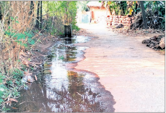
ରାମଚନ୍ଦ୍ରପୁର, ୨୧୩ (ଗଣେଶ୍ୱର ଦା)

ରାଜ୍ୟ ସରକାରଙ୍କ ବସ୍ତୁ ଯୋଜନାରେ ପ୍ରତ୍ୟେକ ଗ୍ରାମାଞ୍ଚଳ ଓ ସହରାଞ୍ଚଳର ପ୍ରତ୍ୟେକ ଘରକୁ ବିଶୁଦ୍ଧ ପାନୀୟ ଜଳ ଯୋଗାଇ ଦେବା ପାଇଁ ରାଜ୍ୟ ସରକାରଙ୍କ ବସ୍ତୁ ଓ ମେଟା ଖାତର ସମ୍ପାଦନା ଯୋଜନା କାର୍ଯ୍ୟକାରୀ ହୋଇଛି। ପରିଚାଳନାଗତ ତ୍ରୁଟି ଯୋଗୁ କେନ୍ଦୁଝର ଜିଲ୍ଲା ଆନନ୍ଦପୁର ବ୍ଲକ୍ ଅନ୍ତର୍ଗତ କଳାପୁର ଗ୍ରାମର ଗାଁ ରାସ୍ତାରେ ପାନୀୟ ଜଳ ଭାସୁଛି। ଖରା ଦିନରେ ସାଧାରଣତଃ ପିଇବା ପାଣିର ସମସ୍ୟା ଦେଖାଯାଉଥିବା ବେଳେ ଏଠାରେ ପାଣିର ଅପ ବ୍ୟବହାର କରାଯାଉଥିବା ପରିଲକ୍ଷିତ ହୋଇଛି। ଉପସ୍ଥୁଳ