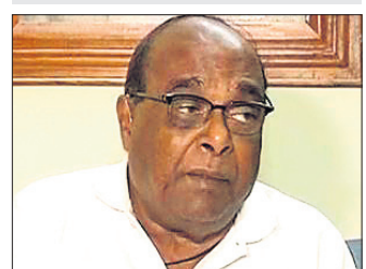
ଭୁବନେଶ୍ୱର, ୨୧ମାର୍ଚ୍ଚ