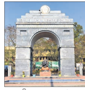
ଭିସୁର୍ ପୁଷ୍ୟ ପୀଠକ।