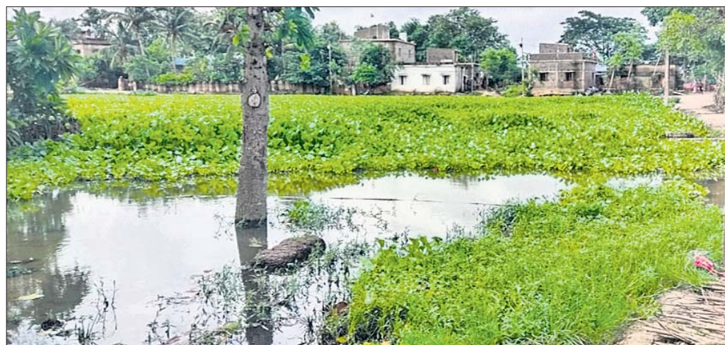
ଦଳରେ ପୂର୍ଣ୍ଣ ହୋଇଥିବା ପୋଖରୀ ।

ରାଜ୍ୟ ସରକାର ଆମ ପୋଖରୀ ଯୋଜନାରେ ପୋଖରୀ ଓ ଜଳାଶୟନକୁ ପୁନରୁଦ୍ଧ କରିବା ପାଇଁ ଗୁରୁତ୍ୱ ଦେଉଛନ୍ତି।