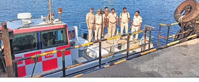
ପୁରୁଣା ଠାରେ ପହଞ୍ଚି ଏକ ବଡ଼ଧରଣର ଆକ୍ରମଣ କରିଥିଲେ । ଏହାପରେ କେନ୍ଦ୍ର ସରକାରଙ୍କ ନିର୍ଦ୍ଦେଶ କ୍ରମେ ଜଳପଥ ବ୍ୟାପକ ପୋଲିସ୍ ମୁତୟନ କରାଯାଇ ବିଭିନ୍ନ ଯାନବାହନ ଯାଞ୍ଚ କରାଯାଇଛି ।

ଗଞ୍ଜାମ ପୋଲିସ୍ ପକ୍ଷରୁ ଦୁଇଦିନିଆ 'ସାଗର କବଚ' ସମରାଜ୍ୟାସ ଗୁରୁବାର ଶେଷ ହୋଇଛି । ଛତ୍ରପୁର, ଗଞ୍ଜାମ, ରକ୍ଷା, ଚମାଖଣ୍ଡି ଓ ଆର୍ଯ୍ୟପଲ୍ଲୀ ସାମୁଦ୍ରିକ ଥାନା ପୁଲିସ୍ ପକ୍ଷରୁ ପ୍ରାୟଗଠାକୁ ହରିପୁର ପ୍ରସ୍ତୁତ ୩୭ କିମି ଜଳପଥରେ ପାଟ୍ରୋଲିଂ ହୋଇଛି । ଏଥିସହ ସମୁଦ୍ରକୁ ସଂଲଗ୍ନ ହୋଇଥିବା ୧୬ ନମ୍ବର ଜାତୀୟ ରାଜପଥ ଡିଆରଡିଏ ଛକ, ମାଣ୍ଡିଆପଲ୍ଲୀ ଛକ, ଆଇଆରଇ ଛକ, ଜୟଶ୍ରୀ କେମିକାଲ ଛକ, ସୁମ୍ନା ଛକଠାରେ ବ୍ୟାପକ ପୋଲିସ୍ ମୁତୟନ କରାଯାଇ ବିଭିନ୍ନ ଯାନବାହନ ଯାଞ୍ଚ କରାଯାଇଛି । ୨୦୦୮ ନଭେମ୍ବର ୨୬ରେ ଜଳପଥ ଦେଇ ପାକିସ୍ତାନର ଆତଙ୍କବାଦୀମାନେ