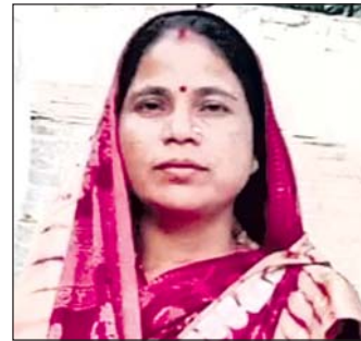
ପାଣିକୋଇଲି, ୨୧୩ (ବିକାଶ ମଲ୍ଲିକ):