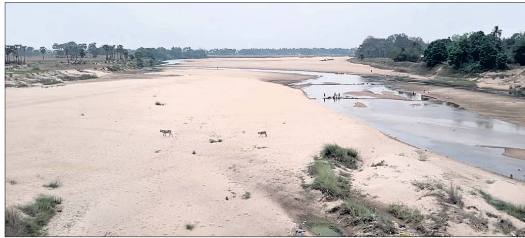
କେନ୍ଦ୍ରାପଡ଼ାରେ ଲୁଣାନଦୀ ଶୁଖିଲା ପଡ଼ିଛି ।