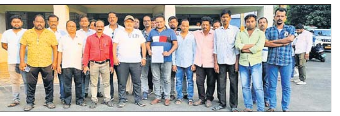
ବାବିପ୍ରସ୍ତ ସହ ଘରୋଇ ବସ୍ ମାଲିକ ସଂଘ କର୍ମକର୍ତ୍ତା ।

କୋଦଳା/ଛତ୍ରପୁର, ୨୧ମା (ଅମିତ କୁମାର ପଟ୍ଟନାୟକ/ଦିଲୀପ ସାମଲ) ରାଜ୍ୟ ସରକାରଙ୍କ ଲକ୍ଷ୍ମୀ ବସ୍ ପରିଚାଳନାରେ ଅସନ୍ତୋଷ ପ୍ରକାଶ କରିଛି ଘାନାୟ ଘରୋଇ ବସ୍ ମାଲିକ ସଂଘ । ଘାନାୟ ପ୍ରଶାସନ ଏବଂ ମାଲିକ ସଂଘ ମିଳିତ ଆଲୋଚନା ମୁତାବକ ଲକ୍ଷ୍ମୀ ବସ୍ ରୁଟ୍ ହୋଇଥିବା ବେଳେ