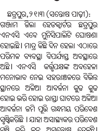
ବାସ୍ତବରେ ଥିବା ଅଧିକାରୀ କିମ୍ପା କର୍ମଚାରୀ କୌଣସି ଖର୍ଚ୍ଚ ଖର୍ଚ୍ଚ ବୁଲି ବୁଲି ଦେଖୁନାହାନ୍ତି

ଗଞ୍ଜାମ ଜିଲ୍ଲା ସେତକ୍ୱାର୍ଟର ଛତ୍ରପୁର ଏନଏସ୍ ଏବେ ପୁନିସ୍ଥାପିତ ହୋଇଛି । ମାତ୍ର କିଛି ଦିନ ହେଲା ଏଠାରେ ପରିମଳ ବ୍ୟବସ୍ଥା ବିପର୍ଯ୍ୟୟ ଅବସ୍ଥାରେ ଅଛି । ଏନଏସ୍ କର୍ତ୍ତୃପକ୍ଷଙ୍କ ଅବହେଳା ମନୋଭାବ ନେଇ ସହରାଞ୍ଚଳରେ ବିଭିନ୍ନ ସ୍ଥାନରେ ଅଳିଆ ଆବର୍ଜନା କୁଟ କୁଟ ହୋଇ ଭରି ହୋଇ ରାସ୍ତା ଘାଟରେ ଅଳିଆ ଆବର୍ଜନା ଜମି ପୁଣି ଗଣମୟ ପରିବେଶ ସୃଷ୍ଟିକରିଛି । ଯାହା ଅସାଧ୍ୟକର ପରିବେଶ ସୃଷ୍ଟି କରି ଜନ ଅସନ୍ତୋଷ ତେଜୁଛି । ଛତ୍ରପୁର ଏନଏସ୍ କାର୍ଯ୍ୟନିର୍ବାହୀ ଅଧିକାରୀଙ୍କଠାରୁ ଆରମ୍ଭ କରି ସମସ୍ତଙ୍କ