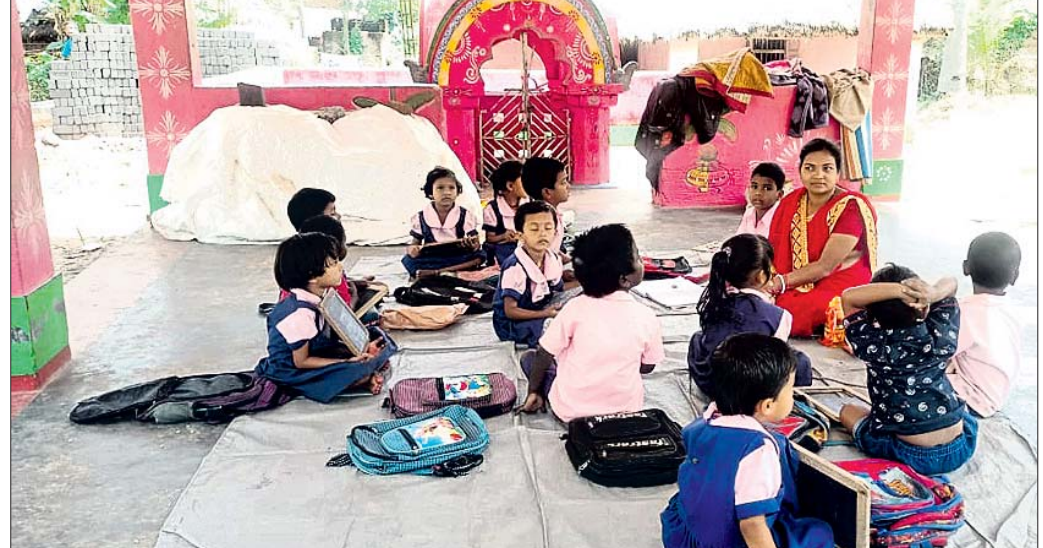
ଅଜ୍ଞାନତ୍ରୀ ପିଲାମାନେ ମନ୍ଦିର ବାରଣ୍ଡାରେ ପଢୁଛନ୍ତି ।