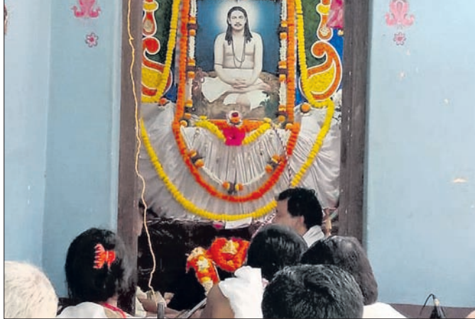
ଗୃହାସନ ପ୍ରତିଷ୍ଠା ଉତ୍ସବରେ ଯୋଗଦେଇଥିବା ଶ୍ରଦ୍ଧାଳୁ ।