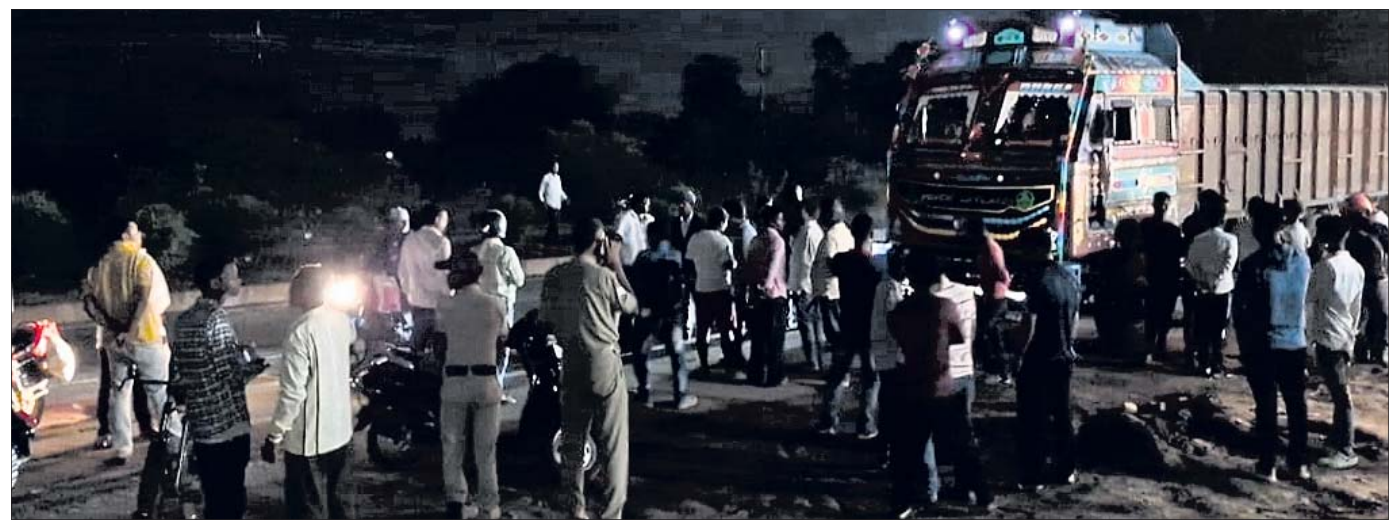
ଭୁବନେଶ୍ୱରରେ ଲୋକେ ରାସ୍ତାରେ ଲୋକେ କରିଛନ୍ତି ।

ଯାଜପୁରରେ, ୨୧ମାର୍ଚ୍ଚ (ପବିତ୍ର ରଞ୍ଜନ ମହାନ୍ତି):