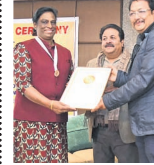
ପୁରସ୍କାର ଗ୍ରହଣ ଅବସରରେ ପିଟି ଉଷା

ଭାରତର ଦୌଡ଼ରାଣୀ ଭାବେ ବିଶେଷ ପରିଚିତ କେରଳର ପ୍ରଖ୍ୟାତ ଆଥିଲେଟ୍ ପି.ଟି. ଉଷା। ୧୯୭୯ରୁ ୨୦୦୦ ମସିହା ମଧ୍ୟରେ ସେ ଭାରତ ପାଇଁ ୧୦୩ଟି ଅନ୍ତର୍ଜାତୀୟ ପଦକ ବିଜୟିନୀ ହୋଇଥିଲେ। ସେଥିରେ ୨ଟି ଏସୀୟ କ୍ରୀଡ଼ାର ୪ ସ୍ୱର୍ଣ୍ଣ ଓ ୭ ରୌପ୍ୟ ପଦକ ରହିଛି। ଅଲିମ୍ପିକ୍ କ୍ରୀଡ଼ା ସହିତ ଉଷାଙ୍କ ସମ୍ପର୍କ ଘନିଷ୍ଠ ଥିଲା। ଅଲିମ୍ପିକ୍ ୪ଶହ ମିଟର ଦୌଡ଼କୁ ପଦକ ଜିତିବାକୁ ଟାକ୍ ଲକ୍ଷ୍ୟ ସଫଳ ହୋଇ ନ ଥିଲେ ବି ତିନୋଟି ଅଲିମ୍ପିକ୍ ସଂସରଣରେ ଭାରତକୁ ପ୍ରତିନିଧିତ୍ୱ କରିବା ଏକ ଐତିହାସିକ ଘଟଣା। ଦେଶର ପ୍ରଥମ କନିଷ୍ଠ ପ୍ରତିଯୋଗୀ ଭାବେ ମାତ୍ର ୧୬ ବର୍ଷ ବୟସରେ ୧୯୮୨ ମସିହା ଅଲିମ୍ପିକ୍‌ରେ ଭାଗ ନେଇଥିଲେ। ୧୯୮୦ ଦଶକରେ ଭାରତ ସମେତ ଏସିଆରେ ୪ଶହ ମିଟର ଦୌଡ଼ରେ ଟାକ୍ ପ୍ରାଧିକ୍ୟ ଦେଖିବାକୁ ମିଳିଥିଲା। ଭାରତ ସରକାର ତାଙ୍କୁ ଅର୍ଜୁନ ପୁରସ୍କାର ଓ ପଦ୍ମଶ୍ରୀ ପଦକ ଦେଇ ସମ୍ମାନିତ କରିଥିଲେ। ପିଟି ଉଷା ଏବେ ଭାରତୀୟ ଅଲିମ୍ପିକ୍ ସଂଘର ଅଧ୍ୟକ୍ଷ। ଦୌଡ଼କୁ ପଦ୍ମରେ ଟାକ୍‌ର ସାମଗ୍ରିକ ଯୋଗଦାନ ପାଇଁ ତାଙ୍କୁ ଜୀବନବ୍ୟାପୀ ସାଧନା