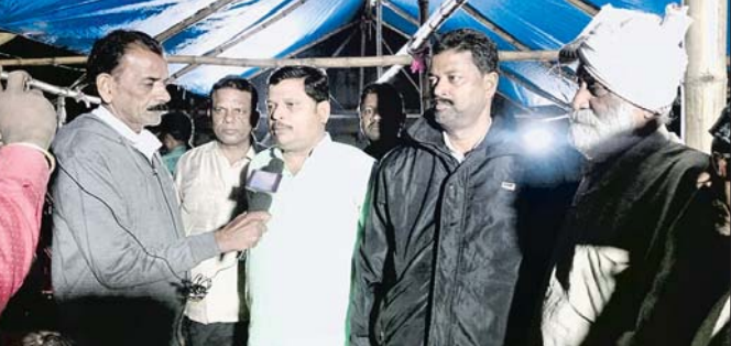
ବୈଠକରେ ଯୋଗଦେଇଥିବା କଂଗ୍ରେସ ନେତା ଓ କର୍ମୀ ।