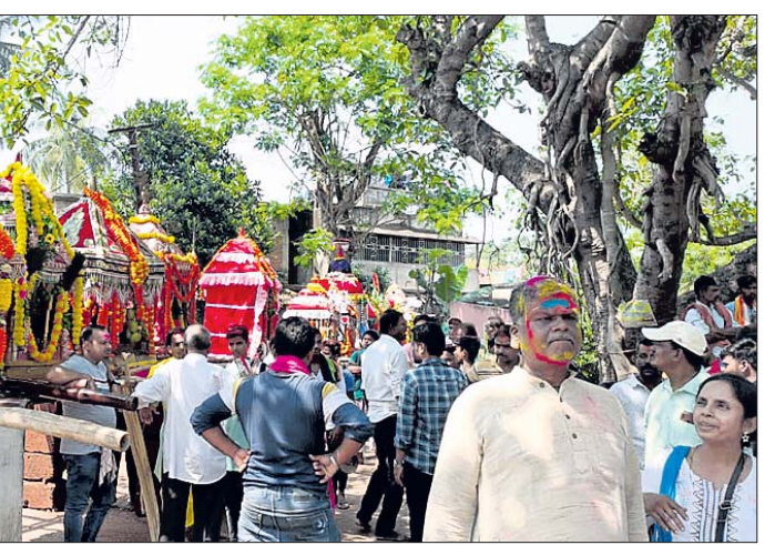
ପ୍ରସିଦ୍ଧ ଛତିଆ ରାଜବୋଲ ମିଳନରେ ସାମିଲ ହୋଇଥିବା ୩୯ ବିମାନ ।

ରାଜ୍ୟ ସରକାର ଆମ ପୋଖରୀ ଯୋଜନାରେ ପୋଖରୀ ଓ ଜଳାଶୟନକୁ ପୁନରୁଦ୍ଧ କରିବା ପାଇଁ ଗୁରୁତ୍ୱ ଦେଉଛନ୍ତି।