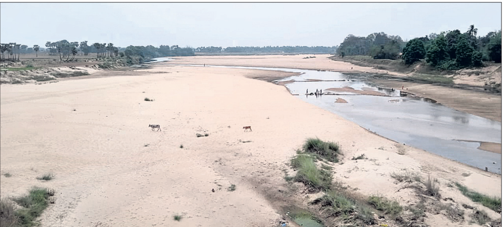
କେନ୍ଦ୍ରାପଡ଼ାଠାରେ ଲୁଣାନଦୀ ଶୁଖିଲା ପଡ଼ିଛି ।