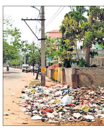
କି ଜନସାଧାରଣଙ୍କ ସହ ସୁସମ୍ପର୍କ ରଖି କରୁନାହାନ୍ତି । ଫଳରେ ସହରରେ ଅନେକ

କାର୍ଯ୍ୟ ଅଧାପଡ଼ିଆ ହୋଇ ପଡ଼ିରହିଛି । ବାସ୍ତବିକ ସହରର ପରିମଳ ଓ ପରିଚ୍ଛନ୍ନତା ପ୍ରତି ଆଦୌ ଦୃଷ୍ଟି ଦେଖନାହାନ୍ତି, ଯାହାକି ସାଧାରଣ ଲୋକ ଅତିଷ୍ଟ ହୋଇପଡ଼ିଛନ୍ତି । ଏପରିକି ସହରରେ ନିର୍ମାଣାଧୀନ କାର୍ଯ୍ୟ ଏବଂ ସମ୍ପନ୍ନ ହୋଇସାରିଥିବା କାର୍ଯ୍ୟ ସ୍ଥାନରେ ଅଗାଡ଼ି ବାଲି, ଗୋଡ଼ି ଆଦି ଜମି ରହିବା ଫଳରେ ଲୋକମାନଙ୍କ ଯିବା ଆସିବା ବେଳେ ଅନେକ ଛୋଟ ବଡ଼ ଦୁର୍ଘଟଣାର ସମ୍ମୁଖୀନ ହେଉଛନ୍ତି । ଏ ଦିଗରେ ବିଭାଗୀୟ ଉଚ୍ଚ କର୍ତ୍ତୃପକ୍ଷ ତଥା ଜିଲ୍ଲାପାଳ ଧ୍ୟାନ ଦେଇ ଏହାର ବିହତ ପ୍ରତିକାର ବ୍ୟବସ୍ଥା ବିଧାନ କରିବାକୁ ଜନସାଧାରଣରେ ଦୃଢ଼ ଦାବି ହେଉଛି ।