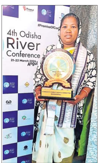
ନମୋଜିନୀଙ୍କୁ ସମ୍ମାନିତ କରାଯାଇଛି।

ଅନୁରୁକ୍ତଠାରେ ଆୟୋଜିତ ୨ ଦିନିଆ ଚତୁର୍ଥ ଓଡ଼ିଶା ନଦୀ ସମ୍ମିଳନୀରେ ଦାରିଙ୍ଗବାଡ଼ି ବ୍ଲକ୍ ମହିଳା ସ୍ୱୟଂ ସହାୟକଙ୍କୁ ପୁରସ୍କୃତ କରାଯାଇଛି।