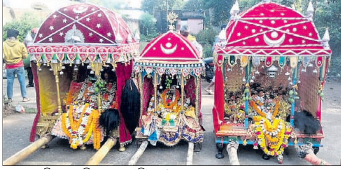
ମେଳଣ ପଡ଼ିଆକୁ ଆସିଥିବା ବୋଲ ବିମାନ ।