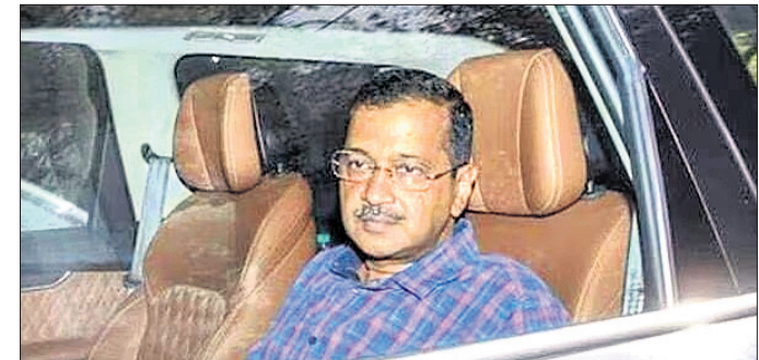
ଦିଲ୍ଲୀ ମୁଖ୍ୟମନ୍ତ୍ରୀ ଅରବିନ୍ଦ କେଜ୍ରିଓଲଙ୍କୁ ଇତି ପକ୍ଷରୁ ଗିରଫ କରି ନିଆଯାଇଛି। ନୂଆଦିଲ୍ଲୀ, ୨୧ମାର୍ଚ୍ଚ

ଲୋକ ସଭା ନିର୍ବାଚନକୁ ମାସେରୁ କମ୍ ସମୟ ଅବଶେଷରେ ଗୁରୁବାର ଭାରତର ୨ ସର୍ବୋଚ୍ଚ ସାମ୍ବିଧାନିକ ସଂସ୍ଥା ସୁପ୍ରିମକୋର୍ଟ ଏବଂ ନିର୍ବାଚନ କମିଶନ (ଇସିଆଇ)ଙ୍କଠାରୁ କେନ୍ଦ୍ର ସରକାରଙ୍କୁ ବଡ଼ ଝଟକା ଲାଗିଛି। ସରକାର ବିରୋଧୀ ଖବରକୁ ଚିହ୍ନଟ କରି ରୋକିବା ସକାଶେ ପତ୍ର ପୁଚନା କାର୍ଯ୍ୟାଳୟ (ପିଆଇବି) ଅଧୀନରେ ଫ୍ୟାକ୍ଟ ଚେକ୍ ମ୍ୟୁନିଟି ପ୍ରତିଷ୍ଠା ପାଇଁ ଇଲେକ୍ଟ୍ରୋନିକ୍ ଏବଂ ଆଇଟି ମନ୍ତ୍ରଣାଳୟ ରୁପସାରି ବିଜ୍ଞପ୍ତି ଜାରି କରିଥିଲା। ଗୁରୁବାର ପ୍ରଧାନ ବିଚାରପତି ଡି.ଓ.ଇ. ଚନ୍ଦ୍ରଚୂଡ଼ଙ୍କ ଖଣ୍ଡପୀଠ ନାଗରିକଙ୍କ ଅଭିବ୍ୟକ୍ତି ସ୍ୱାଧୀନତା ପ୍ରଭାବିତ ହେବା ଦର୍ଶାଇ ଏହା ଉପରେ ସ୍ଥଗିତାଦେଶ ଜାରି କରିଛନ୍ତି। ସେହିପରି ନିର୍ବାଚନ ତାରିଖ ଘୋଷଣା ହେବା ସତ୍ତ୍ୱେ ଇଲେକ୍ଟ୍ରୋନିକ୍ ଏବଂ ଆଇଟି ମନ୍ତ୍ରଣାଳୟ ପକ୍ଷରୁ ପ୍ରଧାନମନ୍ତ୍ରୀ ନରେନ୍ଦ୍ର ମୋଦିଙ୍କ ନାମରେ ଲୋକଙ୍କ ମୋବାଇଲକୁ ହ୍ୟାକ୍ସାପ୍ରେସରେ ମେସେଜ୍ ପଠାଯାଇଥିଲା। 'ବିକଶିତ ଭାରତ ସମ୍ପର୍କ' ବ୍ୟାନରରେ କେନ୍ଦ୍ରୀୟ ଯୋଜନାର ସଫଳତା ବଖାଣୁଥିବା ହ୍ୟାକ୍ସାପ୍ରେସ୍ ବାର୍ତ୍ତା ଆଦର୍ଶ ଆଚରଣ ବିଧିର ଉଲ୍ଲଙ୍ଘନ କରୁଥିବା ଦର୍ଶାଇ କଂଗ୍ରେସ୍ ଏବଂ ଚୁଣମୂଳ କଂଗ୍ରେସ୍ ଇସିଆଇଙ୍କ ଦ୍ୱାରା ହୋଇଥିଲେ ନିର୍ବାଚନ ଆୟୋଗ ଏହାକୁ ତହଲ ବନ୍ଦ କରିବାକୁ କେନ୍ଦ୍ର ସରକାରଙ୍କୁ ନିର୍ଦ୍ଦେଶ ଦେଇଛନ୍ତି।