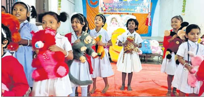
କଣ୍ଠେଇ ସହିତ ଶିଶୁମିତର କୁନି କୁନି ଛାପ୍ରାମାନେ।

ପାରଳାଖେମୁଣ୍ଡି, ୨୧ମା (ଗିରିଧାରା ପରିଜା): ପାରଳାଖେମୁଣ୍ଡି ସହରରେ ଧୂମଧାମରେ ଧୂମଧାମରେ ଦୋଳ ଭସବ ଆରମ୍ଭ ହୋଇଥିଲା।