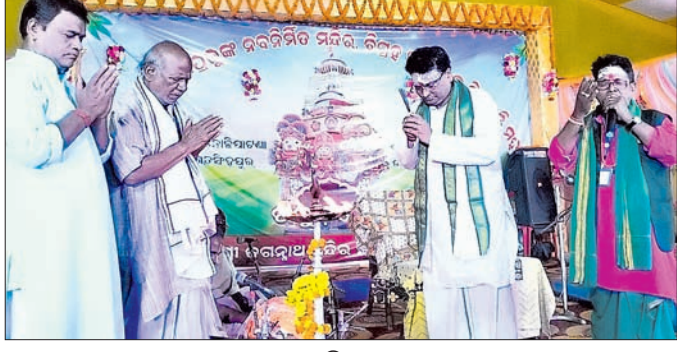
ଉଦ୍‌ଯାପନା ଉତ୍ସବରେ ଯୋଗଦେଇଥିବା ଅତିଥିମାନେ।