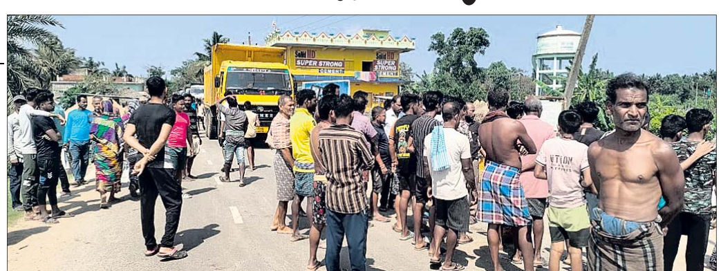
ଉତ୍ତମ ଲୋକେ ରାସ୍ତାରେ ଲୋକେ କରିଛନ୍ତି ।