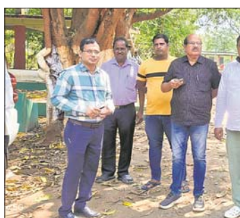
ଉପଜିଲ୍ଲାପାଳ ସୁରକ୍ଷା ବ୍ୟବସ୍ଥା ଯାଞ୍ଚ କରୁଛନ୍ତି ।

ଭଞ୍ଜନଗର, ୨୧ ମା (ବାବୁଲୁ ପ୍ରଧାନ): ଭଞ୍ଜନଗର, ଆସିକା ଓ ସୋରଡ଼ା ନିର୍ବାଚନପଞ୍ଚାୟତରେ ମେ ୨୦ ତାରିଖରେ ମତଦାନ ହେବ । ତେଣୁ ଏହା ପୂର୍ବରୁ ଭଞ୍ଜନଗର କବିସମାଜ ଉପେନ୍ଦ୍ର ଭଞ୍ଜ ମହାବିଦ୍ୟାଳୟରେ ହୋଇଥିବା