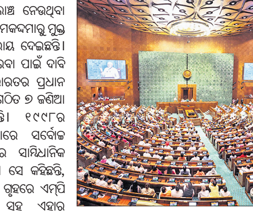
ପୂର୍ଣ୍ଣପତି, ରାଷ୍ଟ୍ରପ୍ରେସ୍‌ହାଳ ସ୍ୱାର୍ଥ ସାଧନ ପାଇଁ ଗୃହରେ ଭାଷଣ ଦେବା, ଆସ୍ତ୍ରା ଅନାସ୍ତ୍ରା ଭୋଟ ସମୟରେ ଲାଞ୍ଚ ନେଇ ସମର୍ଥନ ଯୋଗାଇବା ଭାରତୀୟ ଗଣତନ୍ତ୍ର ପାଇଁ ଯେତିକି ଲଜ୍ଜାଜନକ ନିର୍ବାଚନ ମଇଦାନରେ ମିଥ୍ୟା ପ୍ରତିଷ୍ଠିତ ଦେଇ ଭୋଟମାନଙ୍କୁ ପ୍ରତାରଣ କରିବା ତତୋଧିକ ଲଜ୍ଜାଜନକ ବୋଲି କୁହାଯାଇପାରେ। ଏଭଳି ଆଚରଣର ଅନ୍ତ ଘଟିନାହିଁ। ଏବେ ବି ଗାଳିଛି, ଯାହା ତିରାଜ ବିଷୟ। ଦେଶର ସର୍ବୋଚ୍ଚ ନ୍ୟାୟାଳୟ କହିଛନ୍ତି ଯେ ଲାଞ୍ଚ ଯୋଗୁ ଜଣେ ଏକ ନିର୍ଦ୍ଦିଷ୍ଟ ପକ୍ଷକୁ ଭୋଟ ଦେବାକୁ ପ୍ରେରିତ ହୁଅନ୍ତି ଏବଂ ଏହା ଭାରତୀୟ ଗଣତନ୍ତ୍ରର ଭିତ୍ତିଭୂମିକୁ ନଷ୍ଟ କରିବ। ଲାଞ୍ଚ ସଂସଦୀୟ ଅଧିକାର ଦ୍ୱାରା ସୁରକ୍ଷିତ ନୁହେଁ ବୋଲି ସୁପ୍ରିମକୋର୍ଟ ତାଙ୍କ ରାୟରେ କହିଛନ୍ତି। ଏହି ରାୟ ପରେ ଏଭଳି ଘଟଣାର ଅନ୍ତ ଘଟିବ ବୋଲି ଆଶା କରାଯାଏ। ଦେଶର ସୁରକ୍ଷା ଓ ସାର୍ବଭୌମତ୍ୱକୁ ରକ୍ଷା କରିବା ପାଇଁ ସାମାଜିକ ସେନାମାନେ ନିଜର ପ୍ରାଣବଳି ଦେଉଥିବା ବେଳେ କିଛି ଲୋକପ୍ରତିନିଧି ନିଜକୁ ସୁରକ୍ଷିତ ରଖି ଦେଶକୁ ଦିକ୍‌ଦେବା ନିମନ୍ତେ ଉଦ୍ୟମ କରୁଥିବା ଯେତିକି

ଲୋକ ସଭା ଓ ବିଧାନସଭା ଆସନ ପାଇଁ ୫ ବର୍ଷରେ ଥରେ ନିର୍ବାଚନ ହୁଏ। ସରକାରଙ୍କ ପକ୍ଷରୁ ଏହି ନିର୍ବାଚନ ଖର୍ଚ୍ଚ ଲୋକ ସଭା ପାଇଁ ୭୫ ଲକ୍ଷ, ବିଧାନସଭା ପାଇଁ ୪୦ ଲକ୍ଷ ଟଙ୍କା ପ୍ରାଥୀ ଖର୍ଚ୍ଚ କରିବେ। ଜଣେ ଗରିବ ଆଦିବାସୀ, ଯିଏ ପ୍ରତିନିଧିତ୍ୱ କରିବା ପାଇଁ ଯୋଗ୍ୟ, ଦକ୍ଷ ସିଏ ପ୍ରାଥୀ ହେବା ପାଇଁ କେବେହେଲେ ମନ ବଳାଇବ କି? କାରଣ ସିଏ ଏତେଟା ଆଶିଷ କେଉଁଠୁ? ସେଥିପାଇଁ ଯୋଗ୍ୟ, ଦକ୍ଷ ପ୍ରତିନିଧି ସଂସଦ କିମ୍ବା ବିଧାନସଭାକୁ ଯାଇପାରନ୍ତି ନାହିଁ। କୁହାଯାଏ, ପାର୍ଟି ଏଥିପାଇଁ ୫୦ ଲକ୍ଷ ଭଳି ଆର୍ଥିକ ସହାୟତା ଯୋଗାଇଦିଅନ୍ତି। ଏଠାରେ ପ୍ରଶ୍ନ ଉଠେ, ପାର୍ଟି ଏହି ଟଙ୍କା ଆଶିଷ କେଉଁଠୁ? ଦିନକୁ ଦିନ ନିର୍ବାଚନ ବ୍ୟୟବହୁଳ ହେବାରେ ଲାଗିଛି। କୁହାଯାଏ, ପାର୍ଟି ବିଭିନ୍ନ ଉପାୟରେ ପୂର୍ଣ୍ଣପତି, ଶିଳ୍ପପତିଙ୍କଠାରୁ ଅର୍ଥ ଆଣେ। ସେଥିପାଇଁ ଲୋକଲୋଚନକୁ ବ୍ୟକ୍ତ ସରକାର ଅନୁମୋଦନ କରିଛନ୍ତି। ତେବେ ତିକ୍ତା କରନ୍ତୁ ସେମାନେ ଏହି ଅର୍ଥ କାହିଁକି ବ୍ୟୟ କରିବେ? ସେମାନେ ନିର୍ଦ୍ଦିଷ୍ଟ ସରକାରୀ ଅନୁକୂଳ ଲାଭ କରନ୍ତି। ଦରଦାମ୍ ଦୂରର ଏହା ହେଉଛି ଏକ ବଡ଼ କାରଣ। ତେବେ ଦଳ ପାଇଁ ଦଳୀୟ କର୍ମୀ ବା ସଦସ୍ୟମାନେ କିମ୍ବା ଲୋକପ୍ରତିନିଧିମାନେ ନିଜ ପକେଟରୁ କାହିଁକି ନ ଦେଉଛନ୍ତି? ଏଭଳି ପ୍ରଶ୍ନକୁ ସରକାର ଉପାଦେଇ ଲୋକଙ୍କ ବିକ୍ରମ ଅର୍ଥକୁ ସଂଗ୍ରହରେ କାହିଁକି ଖର୍ଚ୍ଚ ନ କରିବେ? ଏହି ପ୍ରଶ୍ନ ଯାହା ପୂର୍ଣ୍ଣପତିଙ୍କଠାରୁ ଅର୍ଥ ଲାଞ୍ଚ ନେଇ ସଂସଦ ବା ବିଧାନସଭାରେ ସେମାନଙ୍କୁ ସ୍ୱାର୍ଥ ପାଇଁ ଦେଶର ମହତର ଲକ୍ଷ୍ୟକୁ ଭୁଲି ଯିବି କରିବା ବା ଭାଷଣ ଦେବା ଅର୍ଥ ସେଇଆ ନୁହେଁ କି। ତେବେ ସାଂସଦଙ୍କ ଅତିବୁଦ୍ଧି ଭାରତୀୟ ଗଣତନ୍ତ୍ରକୁ ଦୁର୍ବଳ କରୁଛି।