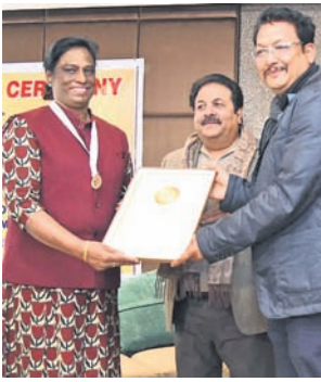
ପୁରସ୍କାର ଗ୍ରହଣ ଅବସରରେ ପିଟି ଉଷା

ଭାରତର ଦୌଡ଼ରାଣୀ ଭାବେ ବିଶେଷ ପରିଚିତ କେରଳର ପ୍ରଖ୍ୟାତ ଆଥଲେଟ୍ ପି.ଟି. ଉଷା। ୧୯୭୯ରୁ ୨୦୦୦ ମସିହା ମଧ୍ୟରେ ସେ ଭାରତ ପାଇଁ ୧୦୩ଟି ଅନ୍ତର୍ଜାତୀୟ ପଦକ ବିଜୟିନୀ ହୋଇଥିଲେ। ସେଥିରେ ୨ଟି ଏସୀୟ କ୍ରୀଡ଼ାର ୪ ସର୍ଣ୍ଣ ଓ ୭ ରୌପ୍ୟ ପଦକ ରହିଛି। ଅଲିମ୍ପିକ୍ କ୍ରୀଡ଼ା ସହିତ ଉଷାଙ୍କ ସମ୍ପର୍କ ଘନିଷ୍ଠ ଥିଲା। ଅଲିମ୍ପିକ୍ ୪ଶହ ମିଟର ଦୈର୍ଘ୍ୟରୁ ପଦକ ଜିତିବାକୁ ତାଙ୍କ ଲକ୍ଷ୍ୟ ସଫଳ ହୋଇ ନ ଥିଲେ ବି ତିନୋଟି ଅଲିମ୍ପିକ୍ ସଂସରଣରେ ଭାରତକୁ ପ୍ରତିନିଧିତ୍ୱ କରିବା ଏକ ଐତିହାସିକ ଘଟଣା। ଦେଶର ପ୍ରଥମ କନିଷ୍ଠ ପ୍ରତିଯୋଗୀ ଭାବେ ମାତ୍ର ୧୬ ବର୍ଷ ବୟସରେ ୧୯୮୨ ମସିହା ଅଲିମ୍ପିକ୍‌ରେ ଭାଗ ନେଇଥିଲେ। ୧୯୮୦ ଦଶକରେ ଭାରତ ସମେତ ଏସିଆରେ ୪ଶହ ମିଟର ଦୌଡ଼ରେ ତାଙ୍କ ପ୍ରାଧାନ୍ୟ ଦେଖିବାକୁ ମିଳିଥିଲା। ଭାରତ ସରକାର ତାଙ୍କୁ ଅର୍ଜୁନ ପୁରସ୍କାର ଓ ପଦ୍ମଶ୍ରୀ ପଦକ ଦେଇ ସମ୍ମାନିତ କରିଥିଲେ। ପିଟି ଉଷା ଏବେ ଭାରତୀୟ ଅଲିମ୍ପିକ୍ ସଂଘର ଅଧ୍ୟକ୍ଷ। ଦୌଡ଼କୁ ସେଥିରେ ତାଙ୍କର ସାମଗ୍ରିକ ଯୋଗଦାନ ପାଇଁ ତାଙ୍କୁ ଜୀବନବ୍ୟାପୀ ସାଧନା