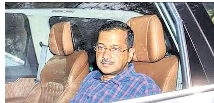
ଦିଲ୍ଲୀ ମୁଖ୍ୟମନ୍ତ୍ରୀ ଅରବିନ୍ଦ କେଜ୍ରିୱାଲଙ୍କୁ ଇତି ପକ୍ଷରୁ ଗିରଫ କରି ନିଆଯାଇଛି। ନୂଆଦିଲ୍ଲୀ, ୨୧ମାର୍ଚ୍ଚ

ଲୋକ ସଭା ନିର୍ବାଚନକୁ ମାସେରୁ କମ୍ ସମୟ ଥିବାରୁ କେନ୍ଦ୍ର ସରକାର ୨ ସର୍ବୋଚ୍ଚ ସାଧିନୀ ନିର୍ବାଚନ (ଇସିଆଇ) କଠାଉ କେନ୍ଦ୍ର ସରକାରଙ୍କୁ ବଡ଼ ଝଟକା ଲାଗିଛି। ସରକାର ବିରୋଧୀ ଖବରକୁ ଚିହ୍ନଟ କରି ରୋକିବା ସକାଶେ ପତ୍ର ପୁସ୍ତକ କାର୍ଯ୍ୟାଳୟ (ପିଆଇବି) ଅଧୀନରେ ଫ୍ୟାକ୍ଟ ଚେକ୍ ଯୁନିଟ୍ ପ୍ରତିଷ୍ଠା ପାଇଁ ଇଲେକ୍ଟ୍ରୋନିକ୍ ଏବଂ ଆଇଟି ମନ୍ତ୍ରାଳୟ ରୁପସାରି ବିଜ୍ଞପ୍ତି ଜାରି କରିଥିଲା। ରୁପସାର ପ୍ରଧାନ ବିଚାରପତି ଡି.ଓ.ଇ. ଚନ୍ଦ୍ରଚୂଡ଼ଙ୍କ ଖଣ୍ଡପାଠ ନାଗରିକଙ୍କ ଅଭିବ୍ୟକ୍ତି ସ୍ୱାଧୀନତା ପ୍ରଭାବିତ ହେବା ଦର୍ଶାଇ ଏହା ଉପରେ ସ୍ଥଗିତାଦେଶ ଜାରି କରିଛନ୍ତି। ସେହିପରି ନିର୍ବାଚନ ତାରିଖ ଘୋଷଣା ହେବା ସତ୍ତ୍ୱେ ଇଲେକ୍ଟ୍ରୋନିକ୍ ଏବଂ ଆଇଟି ମନ୍ତ୍ରାଳୟ ପକ୍ଷରୁ ପ୍ରଧାନମନ୍ତ୍ରୀ ନରେନ୍ଦ୍ର ମୋଦିଙ୍କ ନାମରେ ଲୋକଙ୍କ ମୋବାଇଲକୁ ହାନ୍ତୁଆପରେ ମେସେଜ୍ ପଠାଯାଇଥିଲା। 'ବିକଶିତ ଭାରତ ସମ୍ପର୍କ' ବ୍ୟାନରରେ କେନ୍ଦ୍ରୀୟ ଯୋଜନାର ସଫଳତା ବଖାଣୁଥିବା ହାନ୍ତୁଆପ ବାର୍ତ୍ତା ଆଦର୍ଶ ଆଚରଣ ବିଧିର ଉଲ୍ଲେଖ କରୁଥିବା ଦର୍ଶାଇ କଂଗ୍ରେସ ଏବଂ ଭୁଗମ୍ କଂଗ୍ରେସ ଇସିଆଇଙ୍କ ଦ୍ୱାରା ହୋଇଥିଲେ ନିର୍ବାଚନ ଆୟୋଗ ଏହାକୁ ତହଲ ବନ୍ଦ କରିବାକୁ କେନ୍ଦ୍ର ସରକାରଙ୍କୁ ନିର୍ଦ୍ଦେଶ ଦେଇଛନ୍ତି।