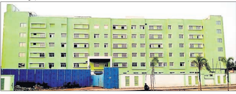
ଯଯାତି କେଶରୀ ମେଡିକାଲ କଲେଜ

କେନ୍ଦ୍ର ସରକାରଙ୍କ ସ୍ୱତନ୍ତ୍ର ଯୋଜନା ବ୍ୟାଲେଊଟ୍ ମୋଡ୍‌ରେ ଯାଜପୁର ଜିଲ୍ଲାରେ ସରକାରୀ ମେଡିକାଲ କଲେଜ ଓ ଅଧ୍ୟାପନା ଡାକ୍ତରଖାନା ଗୃହ ନିର୍ମାଣ ପାଇଁ ଅତିନି ପର୍ଯ୍ୟାୟରେ ପହଞ୍ଚିଛି। ଆସନ୍ତା ୨୦୨୪-୨୫ ଆର୍ଥିକ ଶିକ୍ଷାବର୍ଷରେ ୧୫୫ କୋଟି ଟଙ୍କା ଖର୍ଚ୍ଚ ହେବ। ଏହି ମେଡିକାଲ କଲେଜରେ ନାମ ଲେଖା ଆରମ୍ଭ ହେବ ବୋଲି ସୂଚନା ମିଳିଛି। ତେଣୁ ବିଭିନ୍ନ ମହଲରୁ ଦାବି ଅନୁଯାୟୀ ଏହି କଲେଜର ନାମକରଣ ସମ୍ପର୍କ ଯଯାତି କେଶରୀଙ୍କ ନାମରେ ଯଯାତି କେଶରୀ ମେଡିକାଲ କଲେଜ ଏବଂ ହରିଶଚନ୍ଦ୍ର ରାୟାଙ୍କ ନାମରେ ମେଡିକାଲ କଲେଜ ଏବଂ ଉଚ୍ଚ ନାମକରଣକୁ ସାଧାରଣରେ ସ୍ୱାଗତ କରାଯାଇଛି। ତେବେ ଉଦ୍ଦିଷ୍ଟରେ କଲେଜ ଗୃହର ଅନ୍ୟାନ୍ୟ ନିର୍ମାଣ ପାଇଁ ପୁଣି ୧୦୪ କୋଟି ୧୬ ଲକ୍ଷ ୬୮ ହଜାର ୫୩୨ ଟଙ୍କା ମଞ୍ଜୁର ହୋଇଛି। ଏଥିମଧ୍ୟରୁ ୬୫ କୋଟି ୩୨ ଲକ୍ଷ ୯୦ ହଜାର ୬୦୩ ଟଙ୍କା ଓଡ଼ିଶା ନିର୍ଦ୍ଦେଶାଳା ଦିଅନ୍ତି ଏରିଆ ଡେଭଲପମେଣ୍ଟ କର୍ପୋରେଶନ(ଓଏମ୍‌ବିଏଡିସି) ଆର୍ଥୀ ଓଡ଼ିଶା ଖଣିଜ ପଦାର୍ଥ ଧାରକ ଅଞ୍ଚଳ ଉନ୍ନୟନ ନିଗମ ପାଣ୍ଠିରୁ ପ୍ରଦାନ କରାଯାଇଛି। ଉକ୍ତ ପାଣ୍ଠିରୁ କେଉଁ କେଉଁ ବିଭାଗରେ କେତେ ଖର୍ଚ୍ଚ କରାଯିବ ଏବଂ ଅବଶ୍ୟ ସମୟ ମଧ୍ୟରେ ପାଣ୍ଠି ଖର୍ଚ୍ଚକରିବାକୁ ବିଭାଗ ପକ୍ଷରୁ ନିର୍ଦ୍ଦେଶ ହୋଇଛି। ହେଲେ ଓଏମ୍‌ବିଏଡିସି ପାଣ୍ଠି ଖର୍ଚ୍ଚ ପ୍ରଭାବିତ ଅଞ୍ଚଳର ବିକାଶରେ ଖର୍ଚ୍ଚ କରାଯିବ ବୋଲି ଯେଉଁ ନିଷ୍ପତ୍ତି ନିଆଯାଇଥିଲା ତାହାର ଏଠାରେ ବ୍ୟତିକ୍ରମ ଘଟିଛି। ରାଜ୍ୟ ଓ କେନ୍ଦ୍ର ସରକାରଙ୍କ ବିଭିନ୍ନ ଯୋଜନାରେ ଏଥିପାଇଁ ବିପୁଳ ପାଣ୍ଠି ମହଲରୁ ରହିଥିଲେ ହେଁ ଖର୍ଚ୍ଚ ପ୍ରଭାବିତ ଅଞ୍ଚଳର ବିକାଶ ପାଇଁ ଉଦ୍ଦିଷ୍ଟ ଏହି ପାଣ୍ଠି ଅନ୍ୟ କ୍ଷେତ୍ରରେ କାର୍ଯ୍ୟକାରୀ ନହେଉଛି ବୋଲି ସାଧାରଣରେ ମତ ପ୍ରକାଶ ପାଇଛି।