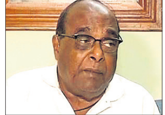
ଭୁବନେଶ୍ୱର, ୨୧ମାର୍ଚ୍ଚ (ଅନିଲ ଦାସ)

ଫ୍ୟାକ୍ଟ ଚେକ୍ ଯୁନିଟ୍ ସ୍ଥାପନ ଉପରେ ସ୍ଥଗିତାଦେଶ ଲଗାଇଲେ ସୁପ୍ରିମକୋର୍ଟ