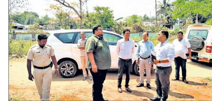
ଜିଲାପାଳ ପିପିଲି ଓ ତେଲାଇ ରୁକ୍ମ ପରିବର୍ତ୍ତନ କରୁଛନ୍ତି ।

ପୁରୀ/ପିପିଲି, ୨୧ମାର୍ଚ୍ଚ (ଅଜିତ ମହାନ୍ତି/ସୁଶାନ୍ତ ମିଶ୍ର) ପୋଖରୀ, ପଞ୍ଚାୟତ ଲାଇଭ୍ରେରି ପରିବର୍ତ୍ତନ କରିଥିଲେ। ବିଭିନ୍ନ ପଦକ୍ଷେପ ମାଧ୍ୟମରେ ପ୍ରକଳ୍ପକୁ କିପରି ଅଧିକ ଆକର୍ଷଣୀୟ କରାଯାଇପାରିବ, ସେ ବିଷୟରେ ଜିଲାପାଳ ସ୍ୱାକ୍ଷର ପରାମର୍ଶ ଦେବା ସହ ଏହାକୁ କାର୍ଯ୍ୟକାରୀ କରିବାକୁ ବିଭାଗୀୟ ଅଧିକାରୀମାନଙ୍କୁ ନିର୍ଦ୍ଦେଶ ଦେଇଥିଲେ। ଏହାପରେ ଜିଲାପାଳ ତେଲାଇ ରୁକ୍ମର ବିଭିନ୍ନ ଅଞ୍ଚଳ ପରିବର୍ତ୍ତନ କରି ଉନ୍ନୟନ ଗ୍ରାମୀଣ ମହିଳା ଏବଂ ଯୁବକମାନଙ୍କ ପାଇଁ କାର୍ଯ୍ୟକାରୀ ହେଉଥିବା ସମ୍ଭାବନାକୁ ଗୁରୁତ୍ୱ ଦେଇ ପିପିଲି ବିଡ଼ଓ ସରୋଜ କେନ୍ଦ୍ର ପରିବର୍ତ୍ତନ କରିଥିଲେ। ପରେ ପରେ ହାତସାହି ଗ୍ରାମୀଣ ପାର୍କ, ମତେଲ ଏବଂ କର୍ମଚାରୀ ଉପସ୍ଥିତ ଥିଲେ।