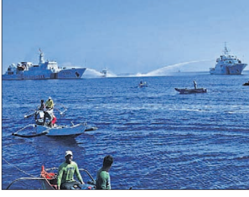
ସାମୁଦ୍ରିକ ପରିବହନ ପାଇଁ ଚାଇନା ନିଜ ପ୍ରାଧିକାରକୁ ଦୃଢ଼ କରିବାକୁ ନିରନ୍ତର କାର୍ଯ୍ୟ କରିଆସୁଛି।

ନିକଟତର ହୋଇଛି। ଅନେକ ବର୍ଷ ଧରି ଦକ୍ଷିଣ ଚାଇନା ସାଗର ଉପରେ ଚାଇନା ନିଜ ପ୍ରାଧିକାରକୁ ଦୃଢ଼ କରିବାକୁ ନିରନ୍ତର କାର୍ଯ୍ୟ କରିଆସୁଛି। ସେହି ଅଞ୍ଚଳର ବିପୁଳ ସମ୍ବଳକୁ ଶୋଷଣ କରିବାରେ ଲାଗିଛି। ଏହାସହ ରଣନୀତିକ ସ୍ଥିତିକୁ ଏକ ଗୁରୁତ୍ୱପୂର୍ଣ୍ଣ କରିବାର ଭାବରେ ବ୍ୟବହାର କରୁଛି, ଯେଉଁଠାରେ ଦେଇ ବିଶ୍ୱର ଏକ ତୃତୀୟାଂଶ ନୌପରିବହନ ହେଉଛି। ଏଥିପାଇଁ ଚାଇନା ପୁରୁଣା କୋରାଲ ରିଫ୍ (ପ୍ରବାଳ ପାଚେରୀ) ଉପରେ କୃତ୍ରିମ