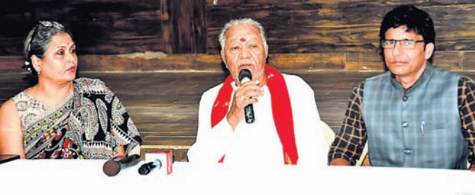
ଖବରଦାତା ସମ୍ପର୍କରେ ବୃନ୍ଦାବନ ମହୋତ୍ସବ ସମ୍ପର୍କରେ ପ୍ରଚାର ଦିଆଯାଇଛି।