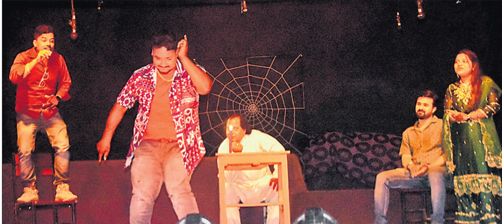
ରଙ୍ଗଶାଳା ପକ୍ଷରୁ ଅନୁଷ୍ଠାନ ରଙ୍ଗମଞ୍ଚରେ ମଞ୍ଚସ୍ଥ ନାଟକ 'ଶବ ବାହକମାନେ' ର ଏକ ଦୃଶ୍ୟ ।