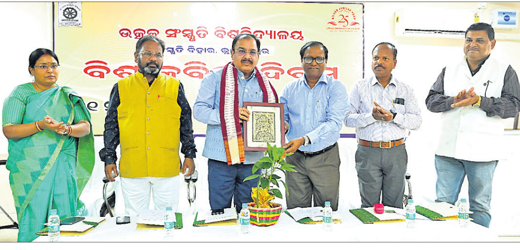
ଉତ୍କଳ ସଂସ୍କୃତି ବିଶ୍ୱବିଦ୍ୟାଳୟରେ ଗୁରୁବାର ବିଶ୍ୱ କବିତା ଦିବସ ପାଳନ କରାଯାଇଛି।