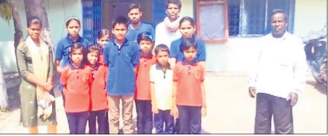
ଅଭିଯୋଗ କରିବାକୁ ଆସିଥିବା ଛାତ୍ରାଛାତ୍ର ଓ ଅଭିଭାବକ।