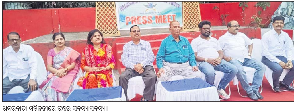
ଖବରଦାତା ସମ୍ମିଳନୀରେ ଗ୍ରନ୍ଥର ସଦସ୍ୟାସଦମାନେ।