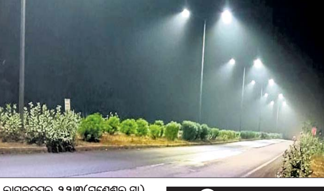
ରାମଚନ୍ଦ୍ରପୁର, ୨୨୩(ଗଣେଶ୍ୱର ସା)