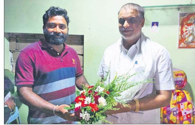
ପ୍ରଭାସକର ମହାପାତ୍ରଙ୍କୁ ସମର୍ଥନ ଦିଆଯାଇଛି।

ମାଲ ବାଘକୁ ପ୍ରବେଶ କରିବାକୁ ଦେଇ ନ ଥାଏ। ଛୁଆ ବଡ଼ ହୋଇ ଆମ୍ବରକାଳ କୌଶଳ ଓ ଶିକାର ଶିଖିବା ପର୍ଯ୍ୟନ୍ତ ବାଘୁଣୀଟି ପୁନର୍ବାର ମା' ହେବାକୁ ଲଢ଼ିଆ କରି ନ ଥାଏ। ୨/୪ ବର୍ଷରେ ଥରେ ବାଘୁଣୀ ଛୁଆ ଜନ୍ମ କରିଥାଏ। ଏକ ବର୍ଷ ଛୁଆମାନଙ୍କୁ ସାଥୀରେ ଧରି ସୁରକ୍ଷା ଯୋଗାଇ ଆସିଥାଏ। କୌଣସି ଛୁଆ ଦୁର୍ବଳ ହୋଇଥିଲେ ବାଘୁଣୀ ତାହାକୁ ଅଣଦେଖା କରିଥାଏ। ଗୋଟିଏ ଛୁଆ ପାଇଁ ଅନ୍ୟ ଛୁଆଙ୍କର ଯେମିତି ମୃତ୍ୟୁ ନ ହେଉ ସେଥିପାଇଁ ଗୋଠଛଡ଼ା କରିଦେଇଥାଏ। ୩ ମାସ ପର୍ଯ୍ୟନ୍ତ ବାଘ ଛୁଆ ମା' କ୍ଷୀର ଖାଇ ବଢ଼ିବା ପରେ ମା' ସାଙ୍ଗା ହୋଇଯାନ୍ତି।