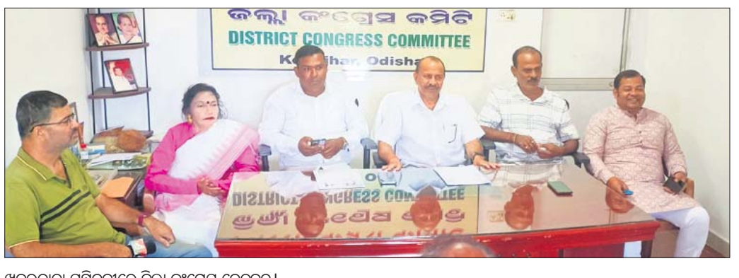
ଖବରଦାତା ସମ୍ମିଳନୀରେ ଜିଲ୍ଲା କଂଗ୍ରେସ ନେତୃବୃନ୍ଦ।

କେନ୍ଦ୍ରରେ, ୨୨୩(ନରେଶ ଚନ୍ଦ୍ର ପଟ୍ଟନାୟକ/ବାପକ ମିଶ୍ର)