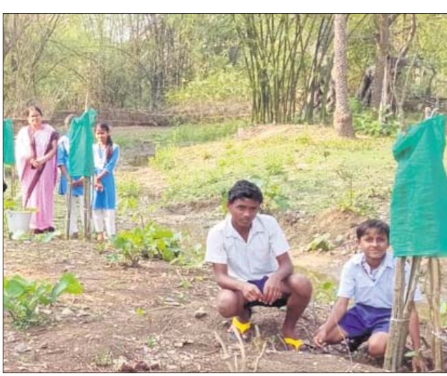
ଛାତ୍ରାଛାତ୍ରୀଙ୍କ ଦ୍ୱାରା ଚାରା ରୋପଣ କରାଯାଇଛି।