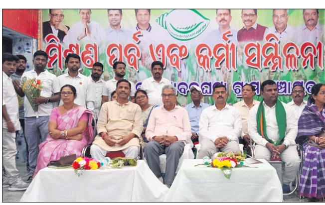
ସମ୍ମିଳନୀରେ ମନ୍ତ୍ରୀ ଅଶ୍ୱିନୀ ପାତ୍ର ଓ ଅନ୍ୟ ବିଜେଡି କର୍ମକର୍ତ୍ତା।