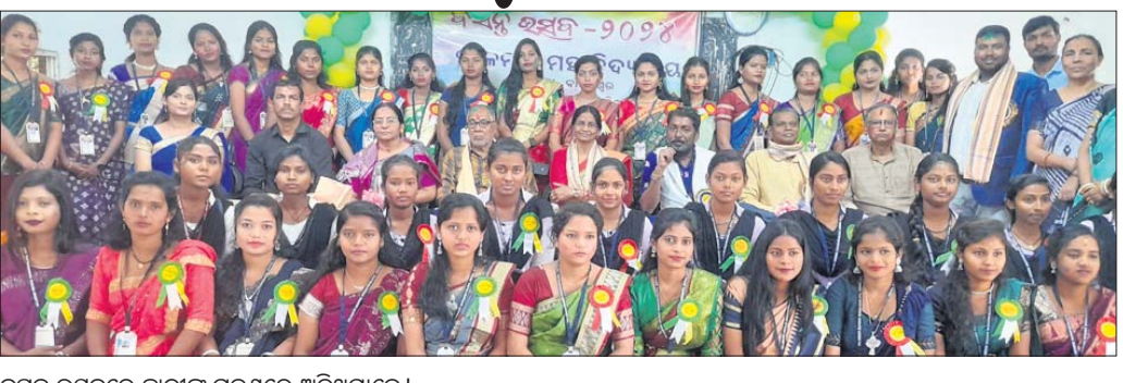
ବସନ୍ତ ଉତ୍ସବରେ ଛାତ୍ରାଛାତ୍ରୀଙ୍କ ଗହଣରେ ଅତିଥିମାନେ।