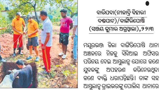
ଖୋଳା ହୋଇଥିଲେ ମଧ୍ୟ କୌଣସି କାର୍ଯ୍ୟ କରାଯାଇନାହିଁ। ଖାଲଗୁଡ଼ିକରେ ଜୀବଜନ୍ତୁ ନେଇ ସମୟରେ ପଡ଼ି ଅଧିକାଂଶ ସମ୍ପୂର୍ଣ୍ଣ ହେଉଛନ୍ତି।

ନାଳଗିରି, ୨୨ମା (ପ୍ରଶାନ୍ତ ବିଶ୍ୱାଳ) ବାଲେଶ୍ୱର ଜିଲା ନାଳଗିରି ରୁକ୍ମ ଅଧୀନ ସଜନାଗଡ଼ ପ୍ରାଥମିକ ସ୍ୱାସ୍ଥ୍ୟକେନ୍ଦ୍ର ପରିସରରେ କୌଣସି ଘର ନିର୍ମାଣ ପାଇଁ ଖୋଳାଯାଇଥିବା ୬ଟି ବଡ଼ ବଡ଼ ଖାଲ ଏବେ ଛୋଟ ଶିଖି ଓ ଜୀବଜନ୍ତୁଙ୍କ ପାଇଁ ମରଣଯତ୍ନ ପାଇଁ ଚିକିତ୍ସିତ। ଗୁରୁବାର ରାତିରେ ଏକ ଗାଈ ଉକ୍ତ ଖାଲରେ ପଡ଼ିଥିବା ବେଳେ ଶୁକ୍ରବାର ସକାଳୁ ସ୍ୱାସ୍ଥ୍ୟକେନ୍ଦ୍ର କର୍ମଚାରୀମାନେ ଡାକ୍ତରଖାନାକୁ ଆସିବା ପରେ ଏହା ଦେଖି ଅଗ୍ରଗଣ୍ୟ ବାହନୀକୁ ଅବଗତ କରିଥିଲେ। ନାଳଗିରି ଅଗ୍ରଗଣ୍ୟ ବାହନୀ ପହଞ୍ଚି ଗାଈଟିକୁ ଉଦ୍ଧାର କରିଥିଲେ। ସ୍ଥାନୀୟ ଲୋକଙ୍କ କହିବା ଅନୁଯାୟୀ ଖାଲଗୁଡ଼ିକ ୬ ମାସ ହେବ ଖୋଳା ହୋଇଥିଲେ ମଧ୍ୟ କୌଣସି କାର୍ଯ୍ୟ କରାଯାଇନାହିଁ। ଖାଲଗୁଡ଼ିକରେ ଜୀବଜନ୍ତୁ ନେଇ ସମୟରେ ପଡ଼ି ଅଧିକାଂଶ ସମ୍ପୂର୍ଣ୍ଣ ହେଉଛନ୍ତି। ଯଦି ଏହି ସ୍ଥାନରେ କୌଣସି କାର୍ଯ୍ୟ ହେବାର ନାହିଁ ତେବେ ତୁରନ୍ତ ଏହାକୁ ପୋଡ଼ାଯାଇ, ନବେତ କାର୍ଯ୍ୟ ତୁରନ୍ତ ଆରମ୍ଭ କରାଯାଇ ବୋଲି ଅଞ୍ଚଳବାସୀ ଦାବି କରିଛନ୍ତି।