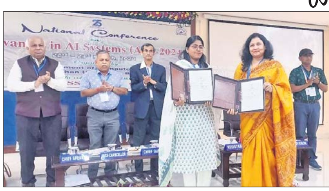
ଅତିଥିକ ଗହଣରେ ବୁଝାମଣାପତ୍ର ସାକ୍ଷରତ କାର୍ଯ୍ୟକ୍ରମ।