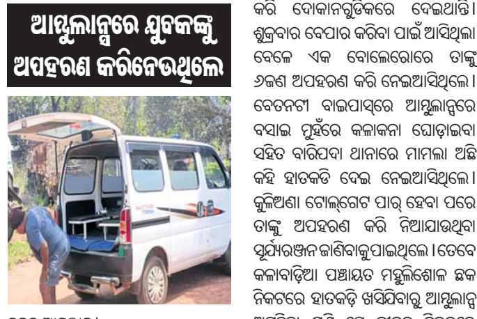
କବଚ ଆୟୁକ୍ତାଳୟ ଉଦ୍ଧାର କରିଥିଲା। ଉଦ୍ଧାର ମୁଦକ ଜଣକ ରୁକ୍ମରୁ ଅଞ୍ଚଳର ସୂର୍ଯ୍ୟରଞ୍ଜନ ପାତ୍ର ବୋଲି ଜଣାପଡ଼ିଛି। ସେ ଚେମ୍ପା ଯୋଗେ ବିଷୁବ, ପାଠପୁଟି ବ୍ୟବସାୟ