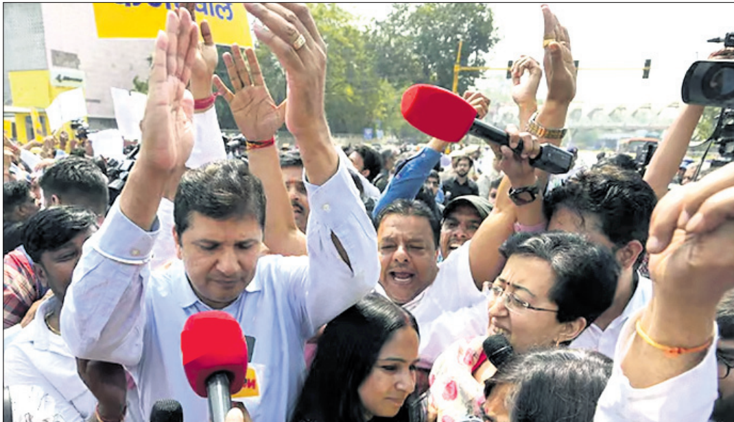
କେନ୍ଦ୍ରୀୟାଳ ଗିରଫଦାରି ପ୍ରତିବାଦରେ ଶୁକ୍ରବାର ମନ୍ତ୍ରୀ ଅତିଶୀ ଏବଂ ସୌରଭ ଭରଦ୍ୱାଜଙ୍କ ସମେତ ଆୟ କର୍ମୀମାନେ ଆଇଟିଓରେ ବିରୋଧ କରୁଛନ୍ତି।