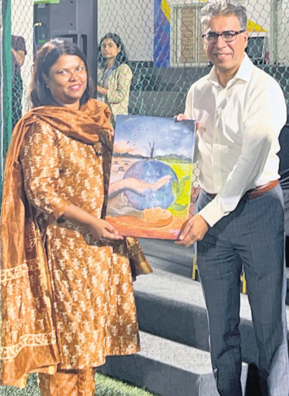
ଓଡ଼ିଶା ଏସିଆ କପ୍ ସଭାପତି ରାଜ ଅଥଲେଟିକ୍ସ ଏକ ସେଣ୍ଟ୍ରାଲ ପ୍ରଦାନ କରୁଛନ୍ତି ଯୁଗ୍ମ ସେଣ୍ଟ୍ରାଲ ଓ ଯୁଗ୍ମ ସେଣ୍ଟ୍ରାଲ ପ୍ରଦାନ କରୁଛନ୍ତି।

ଭୁବନେଶ୍ୱର, ୨୨୩ (ବିଜୟ ରଣା): ବିଶ୍ୱ ଜଳ ବିଶ୍ୱ ବିଦ୍ୟାଳୟରେ ଯୁଗ୍ମ ସେଣ୍ଟ୍ରାଲ ଓ ଯୁଗ୍ମ ସେଣ୍ଟ୍ରାଲ ପୁରସ୍କାର ପାଇଁ ବିଭାଗ-୯ ଓ ୧୦ରେ ଯୁଗ୍ମ ସେଣ୍ଟ୍ରାଲ ପଦକ ପ୍ରଦାନ କରାଯାଇଛି। ସେଣ୍ଟ୍ରାଲ ଓ ସେଣ୍ଟ୍ରାଲ ପଦକ ପ୍ରଦାନ କରାଯାଇଛି।