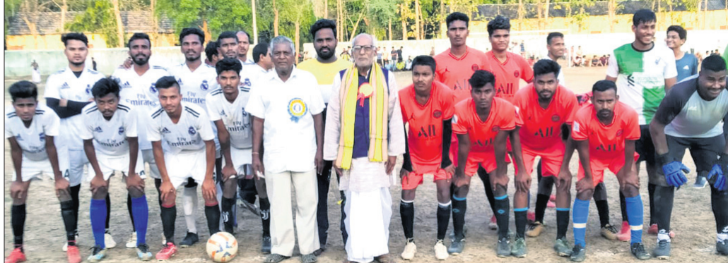
ଅତିଥିକ ଗହଣରେ ଭଣ୍ଡାସ ଦଳର ସେକାଡ଼ି ଅନ୍ୟମାନେ।