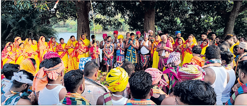
ଶ୍ରୀଲୋକନାଥଙ୍କ ପାଠରେ ବିଶ୍ୱକଲ୍ୟାଣ ମହାଯଜ୍ଞ ଉପଲକ୍ଷେ ଅନୁଷ୍ଠିତ କଳ୍ପ ସାଗ୍ରରେ ସାମିଲ ହୋଇଥିବା ମାନସିକଧାରୀ।

ବେକୁନିଆ, ୨୨ମାର୍ଚ୍ଚ (ହର ପ୍ରସନ୍ନ ପଣ୍ଡା) ଖୋର୍ଦ୍ଧା ଜିଲ୍ଲା ବେକୁନିଆ ନିର୍ବାଚନ ମଣ୍ଡଳୀର ବିଜୁ ଜନତା ଦଳ (ବିଜେଡି) ପକ୍ଷରୁ ଦଳୀୟ କର୍ମୀମାନଙ୍କୁ ନେଇ ଶୁକ୍ରବାର ସମ୍ମିଳନୀ ଅନୁଷ୍ଠିତ ହୋଇଯାଇଛି। ବେକୁନିଆ ସଦର ମହକୁମାସ୍ଥିତ ବାଲୁକେଶ୍ୱର ଦେବଙ୍କ ପାଠ ପରିସରରେ ଆୟୋଜିତ ଉକ୍ତ ସମ୍ମିଳନୀରେ ସଭାପତିଙ୍କୁ ପ୍ରମୁଖ ମିଶ୍ର ଅଧ୍ୟକ୍ଷତା କରିଥିଲେ। ବେକୁନିଆ ବ୍ଲକର ୨୧ ଏବଂ ବୋଲଗଡ଼ ବ୍ଲକର ୧୯ଟି ପଞ୍ଚାୟତରେ ପୁରାତନ ଦଳୀୟ କର୍ମୀମାନେ ଯୋଗଦେଇଥିଲେ। ଏମାନଙ୍କ ସହ ଜିଲ୍ଲାପରିଷଦ ସଭ୍ୟାପଣ, ସରପଞ୍ଚ ଏବଂ ସମ୍ପତ୍ତି ସଭ୍ୟମାନେ ସାମିଲ ଥିଲେ। ଆସପଞ୍ଚାୟତ ଆଧାରରେ ନିର୍ବାଚନ ଗଣାଣନାରେ ନିଜର ଦଳ ସଫଳତା ହାସଲ କରିବେ ଯେ ନେଇ ଆଲୋଚନା କରାଯାଇଛି।