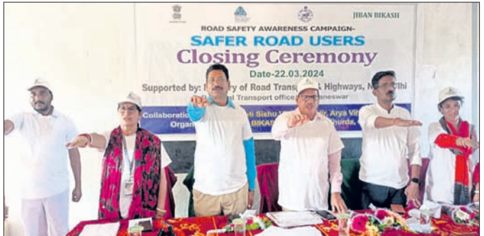
ସଡ଼କ ସୁରକ୍ଷା ପାଇଁ ଶପଥ କରାଯାଇଛି।

ଅଧିକାରୀଙ୍କୁ ନିୟମିତ ଭାବରେ ରିପୋର୍ଟ ଦେବାକୁ ଅନୁରୋଧ କରାଯାଇଛି। ପୁଲିସ୍ ଆରମ୍ଭ ହୋଇଥିବା ଜଣାପଡ଼ିଛି। ଏହାପରେ ଖୋର୍ଦ୍ଧା ଜେଲ ଉପରେ ତଦନ୍ତ ଓ ଫିଲଡ୍ ରିପୋର୍ଟ ଉପରେ ତଦନ୍ତ ପରିସରରେ ଉପଯୋଗୀ ହେବାର ଆଶା ରଖାଯାଇଛି।