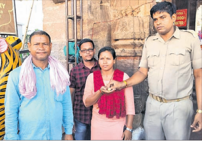
ପୁରୀ, ୨୨୩୩ (ଅକିର ମହାନ୍ତି)

କଟକର ପୂର୍ବତନ ତଥା ଅବସରପ୍ରାପ୍ତ ଆର୍ଥାଭ ଡିଭିଜନ୍ କୋର୍ଟର ଦଣ୍ଡିତ ହୋଇଛନ୍ତି। ଦାସକ ବିରୋଧରେ ରୁକ୍ଷ ଏକ ଲାଞ୍ଚ ମାମଲାରେ ଦିନା କରି ଶୁକ୍ରବାର ଅଢାଳତ ତାଙ୍କୁ ୨ ବର୍ଷ ଜେଲଦଣ୍ଡ ସହ ୧୦ ହଜାର ଟଙ୍କା ଜରିମାନା ଆଦେଶ ଦେଇଛନ୍ତି।