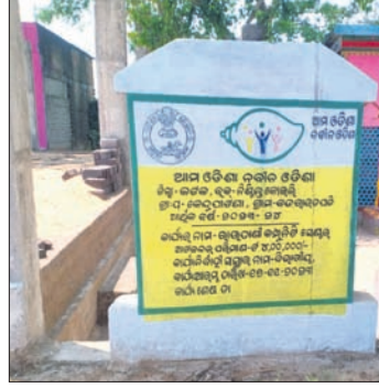
ଗୋଟିଏ ପ୍ରକଳ୍ପ ପାଇଁ ଲଗାଯାଇଥିବା ବୁକ୍ଳିଟ ଭିନ୍ନ ସୂଚନା ଫଳକ।

ନିଷ୍ପତ୍ତକୋଇଲି ରୁକ ପ୍ରଶାସନର ଏକ ବିତିତ୍ର ନୀତି ପଦାରେ ପଡିଛି। ଏହି ରୁକର କେନ୍ଦ୍ରୀୟ ଗ୍ରାମପଞ୍ଚାୟତରେ ଦୁର୍ଗତି ହେଉଥିବା ନେଇ ସନ୍ଦେହ ଦେଖାଯାଇଛି।