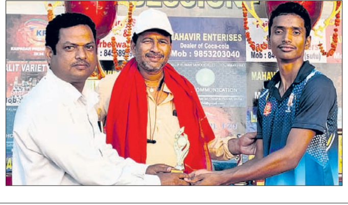
ଉପଲକ୍ଷେ ବିନିମୟରେ ୧୦୫ ରନ ସଂଗ୍ରହ କରିଥିଲା। କବାବରେ ଫିଲ୍ମ ଫାଇଟର ଟିମ୍ ୯୧ ଓଭରରେ ୩ ଓଭରରେ ବିନିମୟରେ ୧୦୮ରୁ ବିଜୟୀ ହୋଇଥିଲା। ବିଜୟୀ ଟିମ୍‌ର ସାଥୀରେ ଫାଇନାଲରେ ବିଜୟୀ ହୋଇଥିବା ଖେଳାଳିମାନେ।

ଖୋର୍ଦ୍ଧା, ୨୨ମାର୍ଚ୍ଚ (ପ୍ରଭାତ ପାଣିଗ୍ରାହୀ) ଖୋର୍ଦ୍ଧା ବ୍ଲକ କାଇପଦର ପଞ୍ଚାୟତ ଅନ୍ତର୍ଗତ ମା'ବେଢ଼ା କ୍ରିକେଟ ଷ୍ଟେଡିଓରେ ଶ୍ରୀଧର କ୍ଲବ ଆୟୁଜ୍ୟରେ ଚଳିଥିବା କାଇପଦର ଫିଲ୍ଡର ଲିଗ୍ କ୍ରିକେଟ ଟର୍ଣ୍ଣାମେଣ୍ଟର ପ୍ରଥମ ସେମିଫାଇନାଲ ମ୍ୟାଚ୍ ଶୁକ୍ରବାର ପାଇକ ଫାଇଟର୍ସ ଓ ବଦମାସ ଏକାଦଶୀ ଟିମ୍ ମଧ୍ୟରେ ହୋଇଥିଲା। ପ୍ରଥମେ ପାଇକ ଫାଇଟର୍ସ ଟିମ୍ ବ୍ୟାଟିଂ କରି ୧୫୭ରୁ ବିଜୟ ହାସଲ କରିଥିଲା। ଦ୍ୱିତୀୟ ପର୍ଯ୍ୟାୟରେ ବଦମାସ ଏକାଦଶୀ ଟିମ୍ ୧୩୯ ରୁଣରେ ସମାପ୍ତ ହୋଇଥିଲା। ଫାଇଟର୍ସ ଟିମ୍ ୧୦୧ରୁ ବିଜୟ ହାସଲ କରିଥିଲା।