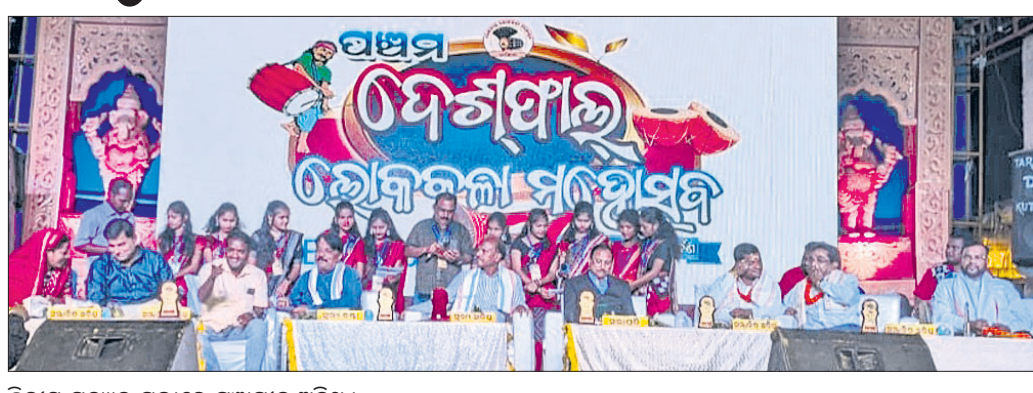
ଦ୍ୱିତୀୟ ସନ୍ଧ୍ୟାରେ ସଭାରେ ମଞ୍ଚାଧୀନ ଅତିଥି ।

ସୁବର୍ଣ୍ଣପୁର ଜିଲ୍ଲା ମହାନଦୀର ଅପରପାର୍ଶ୍ୱରେ ଅବସ୍ଥିତ ବୀରମହାରାଜପୁର ଓ ଉଲୁଣ୍ଡା ଅଞ୍ଚଳକୁ ଦେଖିଲେ ବୋଲି କୁହାଯାଏ । ଏହି ଅଞ୍ଚଳରେ ଅନେକ କଳା ଓ ସଂସ୍କୃତିର ପ୍ରଚାର ପାଇଁ ପ୍ରଚେଷ୍ଟା କରି ବିଶ୍ୱ ଦରବାରରେ ନିଜର ସ୍ୱତନ୍ତ୍ର ପରିଚୟ ସୃଷ୍ଟି କରି ପାରିଛନ୍ତି । ଏହି ଅଞ୍ଚଳର କଳା, ସଂସ୍କୃତି ଓ ପରମ୍ପରାର ଏକପ୍ରକାର ସ୍ୱତନ୍ତ୍ର ଆକର୍ଷଣ ରହିଛି । ମାତ୍ର ପ୍ରଶାସନିକ ଓ ରାଜନୈତିକ ଉପାଦାନ ତାହାକୁ ଏହା ଯେତେ ମାତ୍ରରେ ଲୋକାଭିମୁଖୀ ତଥା ପ୍ରସାର ହୋଇ ପାରିନାହିଁ । ତେଣୁ ଅଞ୍ଚଳର କଳା ଓ ସଂସ୍କୃତିର ସୁରକ୍ଷା ପାଇଁ ଉତ୍ତମ ପ୍ରଶାସନ ଓ ସାଧାରଣ ଲୋକ ତତ୍ପର ହେବା ସହିତ ପ୍ରୟାସ ହେବାର ଆବଶ୍ୟକତା ରହିଛି । ସୁବର୍ଣ୍ଣପୁର ଜିଲ୍ଲା ବୀରମହାରାଜପୁର ଉପଖଣ୍ଡ ଧର୍ମଶାଳାସ୍ଥିତ ବୋଳମଣ୍ଡପ ପଡ଼ିଆରେ ଅନୁଷ୍ଠିତ ୫ମ ଦେଶୀୟ ଲୋକକଳା