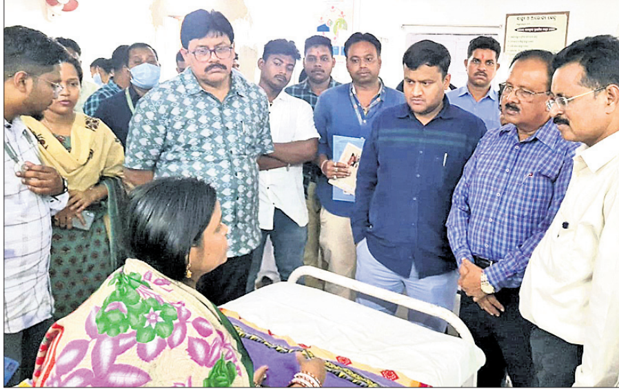
ହୀରାକୁଦ ସ୍ୱାସ୍ଥ୍ୟକେନ୍ଦ୍ରରେ ଚିକିତ୍ସାଧୀନ ଝାଡ଼ାବାନ୍ଧି ଆକ୍ରାନ୍ତଙ୍କ ସ୍ୱାସ୍ଥ୍ୟାବସ୍ଥା ବୁଝିଛନ୍ତି ଆର୍ଡିସି, ଜିଲାପାଳ ଓ ସିଡିଏମ୍‌ଓ ।

ସମ୍ବଲପୁରର ଶିଳ୍ପନଗରୀ ଭାବେ ପରିଚିତ ହୀରାକୁଦ ସହରରେ ଝାଡ଼ାବାନ୍ଧି ବ୍ୟାପିବାରେ ଲାଗିଛି । ବିଗତ ତିନିଦିନ ମଧ୍ୟରେ ଏଠାରେ ଶହେରୁ ଊର୍ଦ୍ଧ୍ୱ ଆକ୍ରାନ୍ତ ହୋଇଛନ୍ତି । ସେମାନଙ୍କ ମଧ୍ୟରୁ ଗୁରୁତର ଥିବା କେତେକଙ୍କ ରୋଗୀକୁ ବୁଲାଇ ଦିଆଯାଇଛି । ତେବେ ଭିମ୍ବାରୁରେ ଚିକିତ୍ସାଧୀନ ଅବସ୍ଥାରେ ଜଣେ ରୋଗୀଙ୍କ ମୃତ୍ୟୁ ଘଟିଛି । ବିଶେଷ କରି ହୀରାକୁଦ ସହରର କାଳୁପଡ଼ା, ଗୁରୁହାପଡ଼ା, ଗୋବିନ୍ଦପଡ଼ା, ନୂଆମାକେଟ୍ ଆଦି ଅଞ୍ଚଳରେ ବସବାସ କରୁଥିବା ଅଧିବାସୀ ଝାଡ଼ାବାନ୍ଧି ଆକ୍ରାନ୍ତ ହୋଇଛନ୍ତି । ହୀରାକୁଦ ତାଳୁରଖାନାରୁ ଅନେକ ରୋଗୀ ସୁସ୍ଥ ହୋଇ ଘରକୁ ଫେରିଥିବା ବେଳେ ବର୍ତ୍ତମାନ ୭ ଜଣ ଚିକିତ୍ସାଧୀନ ଅଛନ୍ତି । ଶନିବାର ହୀରାକୁଦ ତାଳୁରଖାନାରେ ଗୋଟିଏ ଦିନରେ ୪୦ରୁ ଊର୍ଦ୍ଧ୍ୱ ଆକ୍ରାନ୍ତ ଭର୍ତ୍ତି ହୋଇଥିଲେ । ମାତ୍ର ପ୍ରାଥମିକ ଚିକିତ୍ସା ପରେ ସେମାନଙ୍କୁ ଛାଡ଼ି ଦିଆଯାଇଛି । ସେହିପରି ବୁଲାଇ ପୂର୍ବରୁ ଭର୍ତ୍ତି ହୋଇ ଚିକିତ୍ସିତ ହେଉଥିବା ରୋଗୀ ସୁସ୍ଥ ହୋଇ ଘରକୁ ଫେରିଛନ୍ତି । ଶନିବାର ୧୦ରୁ ଅଧିକ ରୋଗୀ ଭର୍ତ୍ତି ହୋଇଥିଲେ । ସେମାନଙ୍କ ମଧ୍ୟରୁ ବର୍ତ୍ତମାନ ମାତ୍ର ୩ଜଣ ଚିକିତ୍ସାଧୀନ ରହିଥିବା ବେଳେ ଅନ୍ୟମାନେ ସୁସ୍ଥ ହୋଇ ଘରକୁ ଫେରିଛନ୍ତି ।