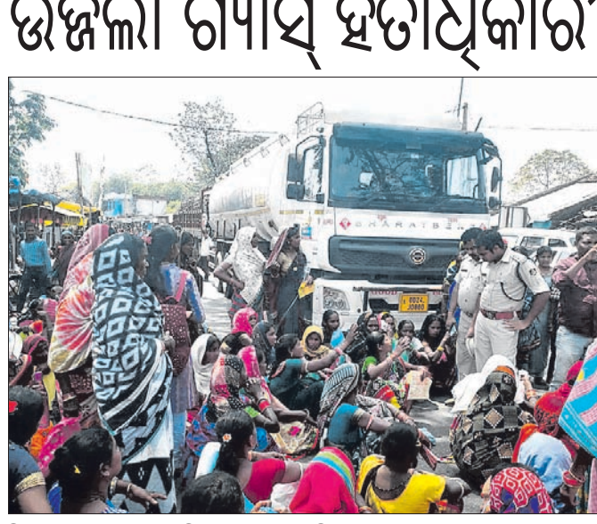
ହିତାଧିକାରୀମାନଙ୍କୁ ପୋଲିସ ବୁଝାଶୁଣା କରୁଛି।

କାଳିଆ ଯୋଜନା, ପ୍ରଧାନମନ୍ତ୍ରୀ କିଷାନ ଯୋଜନାରେ ଯେମିତି ଟଙ୍କା ମିଳୁଛି। ସେହିଭଳି ଯେଉଁମାନଙ୍କ ଉତ୍ପାଦନ ଯୋଜନାରେ ଗ୍ୟାସ୍ ସଂଯୋଗ ରହିଛି ସେହି ହିତାଧିକାରୀମାନେ ଆଧାର କେଣ୍ଟାଲି ଅପଡେଟ କଲେ କେନ୍ଦ୍ର ସରକାର ୫ ହଜାର ଟଙ୍କା ତାଙ୍କ ଏକାଉଥ୍ଟକୁ ଦେଉଛନ୍ତି ବୋଲି ଏକ ଗୁଜବ ଉପଭୋକ୍ତାଙ୍କ ପାଇଁ ୨ ଶହ ଯୁକ୍ତିତ ଦିଆଯାଇଛି।