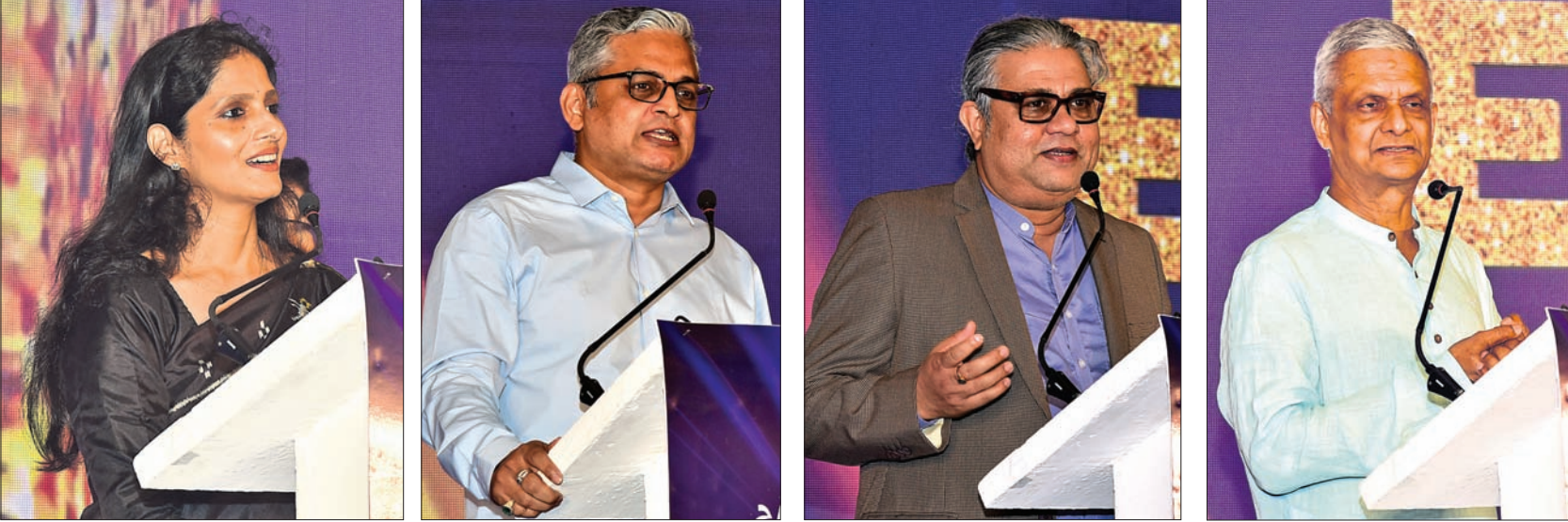
ଧରିତ୍ରୀ ଏବଂ ଡ଼ିଜିଟାଲ ପୋଷ୍ଟ ପକ୍ଷରୁ ଶ୍ରଦ୍ଧାଂଜଳୀ ପ୍ରଦାନ କରାଯାଇଥିବା ବେଳେ ଉପସାହାୟକ ମୁଖ୍ୟମନ୍ତ୍ରୀ ଶ୍ରୀ ଉପେନ୍ଦ୍ର କୁମାର ଘୋଷଙ୍କୁ ଏହି ପୁରସ୍କାର ପ୍ରଦାନ କରାଯାଇଥିଲା।