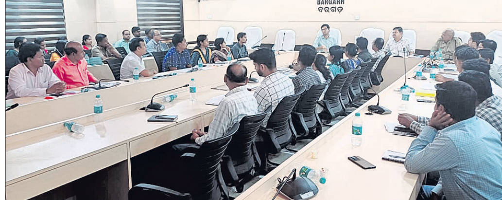
ପ୍ରଶିକ୍ଷଣ ଶିବିରରେ ଉପସ୍ଥିତ ଅଧିକାରୀଙ୍କୁ ।