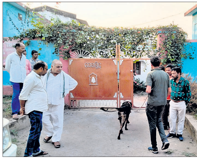
ସାଲିଷ୍ଟିକ ଚିମ୍ପ ସମାଜୀ କୁକୁର ସହାୟତାରେ ଘଟଣାର ତଦନ୍ତ କରୁଛନ୍ତି ।