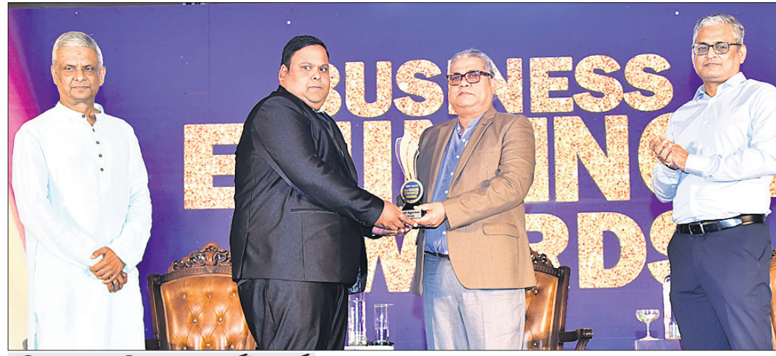
‘ବିଜ୍ଞାନ-ସୂଚକ’ ଆହାରୀ ଉପରେ ଅନୁଷ୍ଠାନର ସମସ୍ତ ସଭ୍ୟମାନଙ୍କର ସହଯୋଗରେ ପ୍ରଦାନ କରାଯାଇଥିବା ଏହି ପୁରସ୍କାର ପ୍ରଦାନ କରାଯାଇଥିଲା।