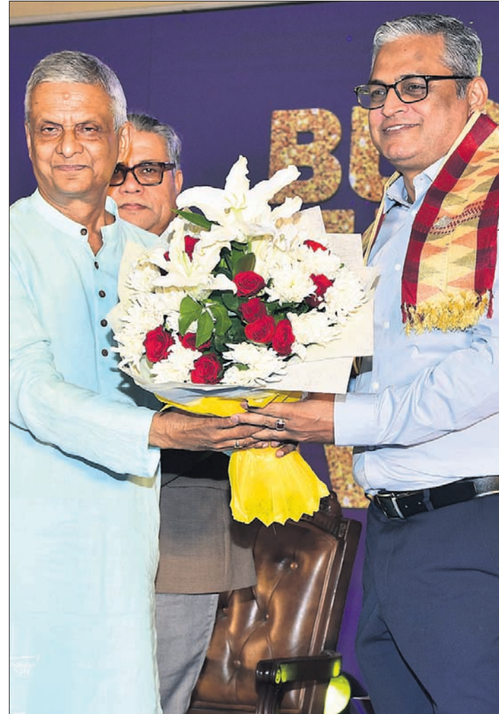
ଉପସାହାୟକ ମୁଖ୍ୟମନ୍ତ୍ରୀ ଶ୍ରୀ ଉପେନ୍ଦ୍ର କୁମାର ଘୋଷଙ୍କୁ ଏହି ପୁରସ୍କାର ପ୍ରଦାନ କରାଯାଇଥିଲା।