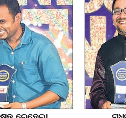
କୁମ୍ଭୀର ବେହେରା ଟ୍ରେଡିଂ