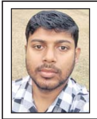
ଶେଷ୍ଟ ଯାକୃତ, ଗୋପ ନିର୍ଦ୍ଦେଶକ ନାଥ, ଘଣ୍ଟେଶ୍ୱର

ପୁରନା: ଆଗାମୀ ଆଶା ପୃଷ୍ଠା ପାଇଁ ଲେଖା ଓ ପଠନା ପଠାଇବା ଲାଗି ଇ-ମେଲ ଠିକଣା: dharitriagamiasha@gmail.com