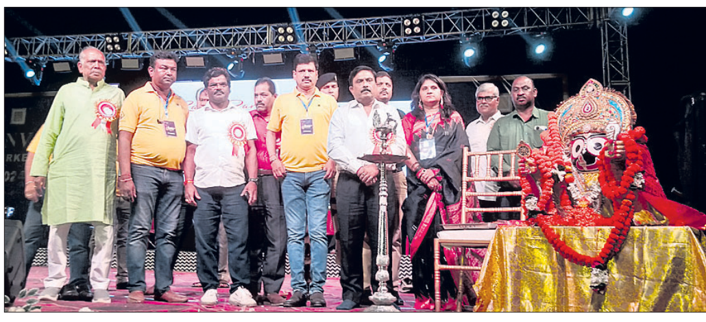
କାର୍ଯ୍ୟକ୍ରମରେ ମହାସାଧନ ଅତିଥିଗଣ।