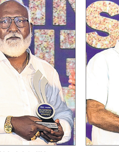
ତ୍ରିନୟନ ରଥ ପ୍ରୋପ୍ରାଇଡର, ପାଷ୍ଟ କମ୍ପାନି ଲିମିଟେଡ୍