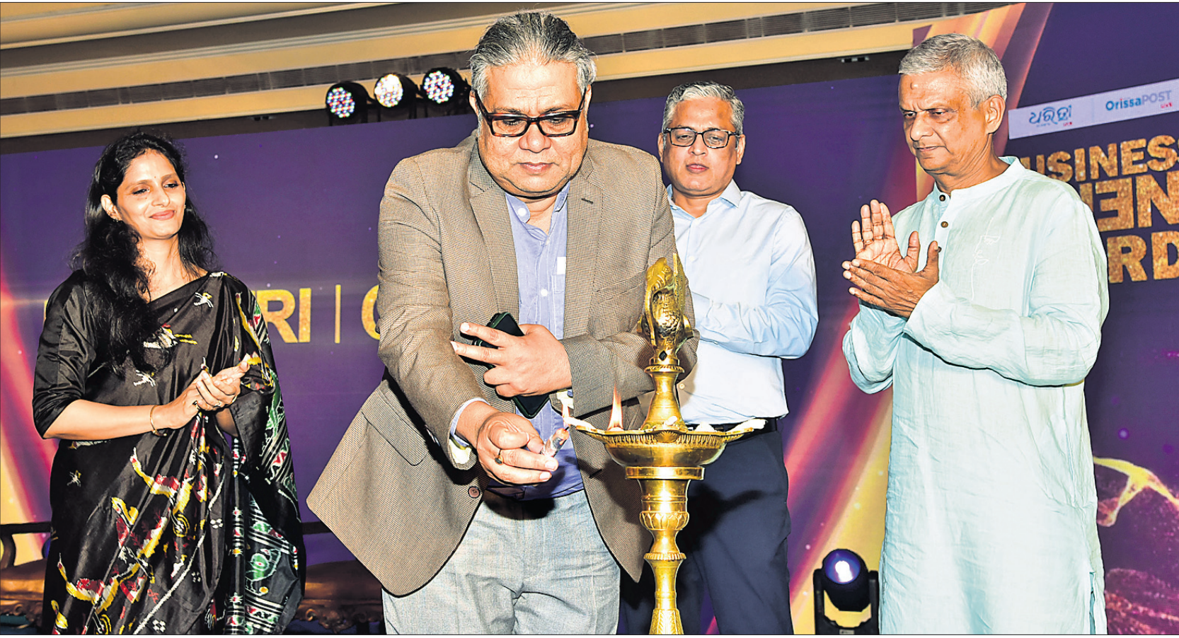
ଧରିତ୍ରୀ ଏବଂ ଡ଼ିଜିଟାଲ ପୋଷ୍ଟ ପକ୍ଷରୁ ଶ୍ରଦ୍ଧାଂଜଳୀ ପ୍ରଦାନ କରାଯାଇଥିବା ବେଳେ ଉପସାହାୟକ ମୁଖ୍ୟମନ୍ତ୍ରୀ ଶ୍ରୀ ଉପେନ୍ଦ୍ର କୁମାର ଘୋଷଙ୍କୁ ଏହି ପୁରସ୍କାର ପ୍ରଦାନ କରାଯାଇଥିଲା। ଉପସାହାୟକ ମୁଖ୍ୟମନ୍ତ୍ରୀ ଶ୍ରୀ ଉପେନ୍ଦ୍ର କୁମାର ଘୋଷଙ୍କୁ ଏହି ପୁରସ୍କାର ପ୍ରଦାନ କରାଯାଇଥିଲା।