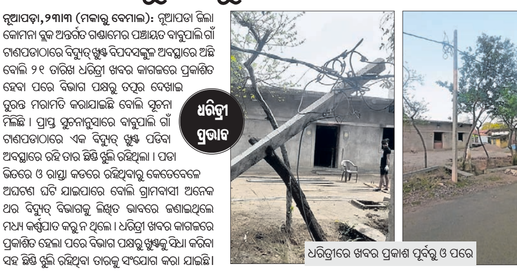
ଧରିଣୀ ପ୍ରଭାବ: ଧରିଣୀରେ ଖବର ପ୍ରକାଶ ପୂର୍ବରୁ ଓ ପରେ