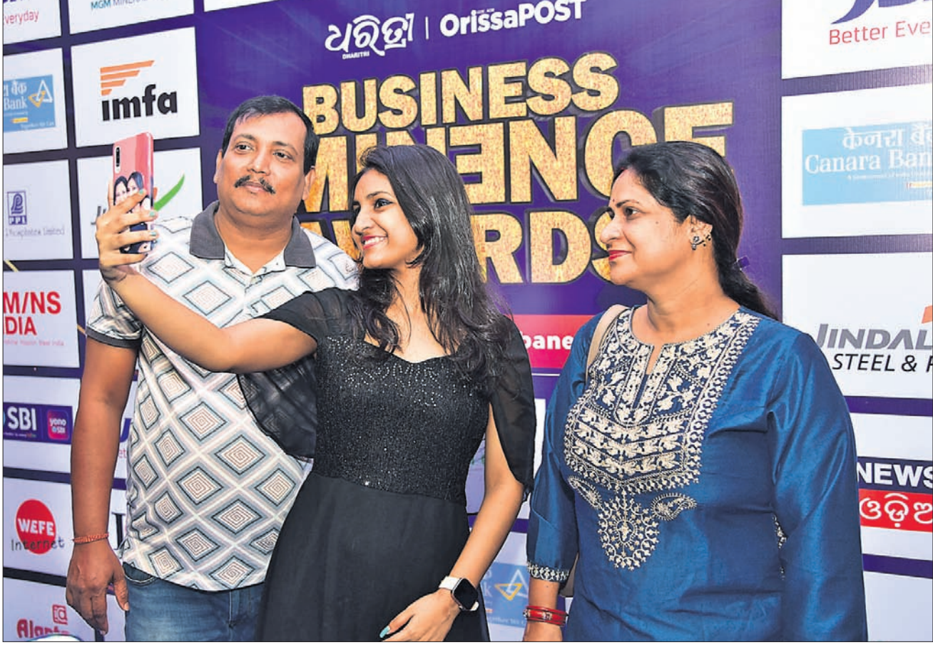
କାର୍ଯ୍ୟକ୍ରମର ସେକ୍ସନର ସଭ୍ୟମାନଙ୍କର ସହଯୋଗରେ ପ୍ରଦାନ କରାଯାଇଥିବା ଏହି ପୁରସ୍କାର ପ୍ରଦାନ କରାଯାଇଥିଲା।