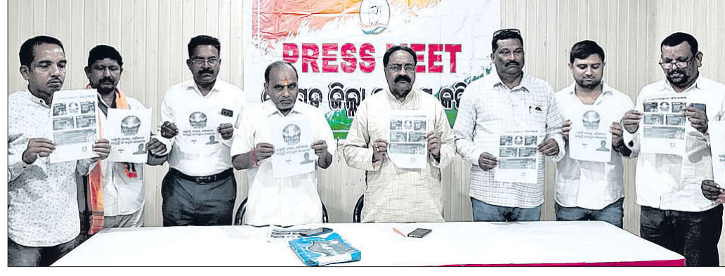
ଜିଲ୍ଲା କଂଗ୍ରେସ ପକ୍ଷରୁ ଗ୍ୟାରେଣ୍ଡି କାର୍ଡ ଉନ୍ମୋଚନ କରାଯାଇଛି ।

କଂଗ୍ରେସ ଶାସନ କାଳରେ ବରଗଡ଼ ଜିଲ୍ଲା ସମେତ ରାଜ୍ୟରେ ବିଭିନ୍ନ ଶିଳ୍ପାନ୍ୱୟାନ ଗଢ଼ି ଉଠିଥିଲା। ଗୁଣାୟ ଅନେକ ଲୋକେ କର୍ମନିମ୍ନୁକ୍ତି ମଧ୍ୟ ପାଇଥିଲେ। ମାତ୍ର ରାଜ୍ୟରେ ବିଜେଡି ଏବଂ କେନ୍ଦ୍ରରେ ଭାଜପା ନେତୃତ୍ୱାଧୀନ ସରକାର ଚାଲିବା ପରେ ଶିଳ୍ପାନ୍ୱୟାନକୁ ଲୋପ ପାଇଥିବାବେଳେ ବେକାରୀ ହାର ମଧ୍ୟ ବଢ଼ି ଚାଲିଛି ବୋଲି ଶନିବାର ବରଗଡ଼ର ଏକ ହୋଟେଲ ସମ୍ମିଳନୀ କକ୍ଷରେ ଅନୁଷ୍ଠିତ ଖବରଦାତା ସମ୍ମିଳନୀରେ ଜିଲ୍ଲା କଂଗ୍ରେସ ଅଭିଯୋଗ କରିଛି । ଏହାସହିତ ଏଭଳି ଅପାରଗତା ନେଇ କଂଗ୍ରେସ ନେତୃତ୍ୱର ରାଜ୍ୟର ବିଜେଡି ଏବଂ କେନ୍ଦ୍ରର ଭାଜପା ସରକାରକୁ କଡ଼ା ସମାଲୋଚନା କରିଥିଲେ। ସେହିପରି ଖବରଦାତା ସମ୍ମିଳନୀରେ ଆଗାମୀ ସାଧାରଣ ନିର୍ବାଚନ ପାଇଁ କଂଗ୍ରେସ ଦଳ ପକ୍ଷରୁ ପ୍ରସ୍ତୁତ ଗ୍ୟାରେଣ୍ଡି କାର୍ଡ ଉନ୍ମୋଚନ କରାଯାଇଥିଲା।