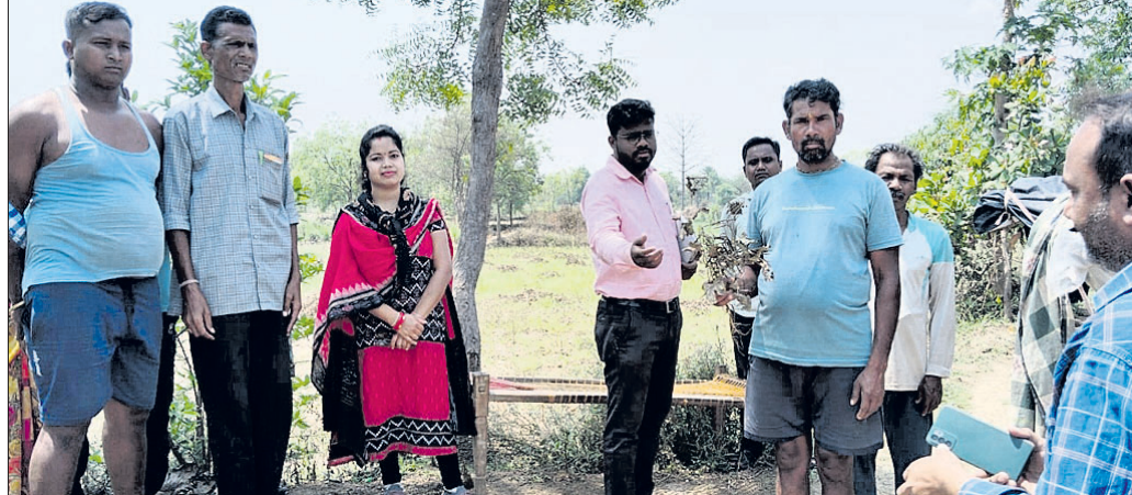
ବିଭାଗୀୟ ଅଧିକାରୀ କ୍ଷେତ୍ର ପରିବର୍ତ୍ତନ କରୁଛନ୍ତି ।

କଳାହାଣ୍ଡି ଜିଲ୍ଲା ଧର୍ମଗଡ଼ ବ୍ଲକ ବେହେରା ଗ୍ରାମ ପଞ୍ଚାୟତସ୍ଥ ଦଳସର୍ତ୍ତୀ ଗ୍ରାମରେ କାଳବେଶାଖୀ ସହ କୁଆପଥର ମାଡ଼ରେ ପରିପରିବା ଓ ତାଲିଜାତୀୟ ଫସଲ କ୍ଷୟକ୍ଷତି ହୋଇଥିବା ଅଭିଯୋଗ ହୋଇଥିଲା । ଶନିବାର ବିଭାଗୀୟ ଅଧିକାରୀମାନେ କ୍ଷେତ୍ର ପରିବର୍ତ୍ତନ କରି କ୍ଷୟକ୍ଷତି ଆକଳନ କରିଥିଲେ । ପ୍ରାୟ ୩୦ରୁ ଅଧିକ ଏକର ଚାଷ ଜମିରେ ଭେଣ୍ଡି ସହ ଅନ୍ୟାନ୍ୟ ପରିପରିବା ତଥା ତାଲିଜାତୀୟ ଚାଷ କରାଯାଇଥିବାବେଳେ ଲଗାତାର ବର୍ଷା ହେବାରୁ ପାଣି ଜମିଯାଇ ଫସଲ ନଷ୍ଟ ହୋଇଛି । ଚାଷୀମାନେ ହଜାର ହଜାର ଟଙ୍କା କ୍ଷତି ସହୁଥିବା ପ୍ରକାଶ କରିଥିଲେ । ପରିପରିବା ଚାଷ ହିଁ ଫେଡ଼ପାଟଣାର ଏକମାତ୍ର ପଇସା ହୋଇଥିବା ବେଳେ ଅର୍ଦ୍ଧିଆ କୁଆପଥର ବର୍ଷା ସେମାନଙ୍କ ଅକ୍ଷାତ ପରିଶ୍ରମ ସହ ବର୍ଷକର ଆୟକୁ ଉଜାଡ଼ି ଦେଇଛି ବୋଲି ପରିବର୍ତ୍ତନକାରୀ ଅଧିକାରୀଙ୍କ ଆଗରେ ଗୁହାରି