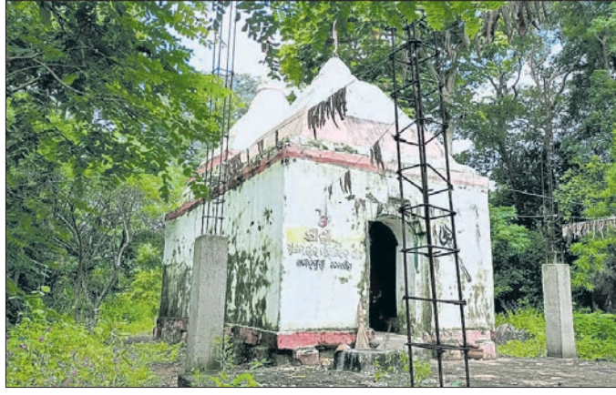
ବିଷ୍ଣୁ ଅବସ୍ଥାରେ ପଡ଼ିରହିଥିବା ଐତିହାସିକ କାର୍ତ୍ତିରାଜି ।

ତେରବିହାର ରାଣୀ ଭୁଜୁରୀ ବା ବାବାଭୁଜୁରୀ ବା ରଘୁନାଥ ମଠ ଐତିହାସିକ ଦୃଷ୍ଟିକୋଣରୁ ଏକ ଗୁରୁତ୍ୱପୂର୍ଣ୍ଣ ପୀଠସ୍ଥଳି । ତେଲ ନଦୀ କୂଳରେ ବିସ୍ତୀର୍ଣ୍ଣ ଅଞ୍ଚଳରେ ପ୍ରତ୍ନତାତ୍ତ୍ୱିକ ଅବଶେଷ ପଡ଼ିରହିଥିଲା । ଏଠାରୁ ପୂର୍ବକୁ ଦ୍ୱାରକ ରାଜ ବଂଶର ବାବା ଭୁଜୁରୀଠାରେ ଅତୀତରେ ଜଣେ ଫେରାର ଅଛନ୍ତି । ଏନେଇ କୋମନା ଥାନାରେ ଏକ ମାମଲା ରୁଜୁ ହୋଇଛି ।