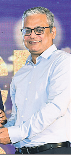
ପାଠକ ଉପାଧ୍ୟକ୍ଷଙ୍କୁ ପୁରସ୍କାର କରାଯାଇଥିବା ଦୃଶ୍ୟ।