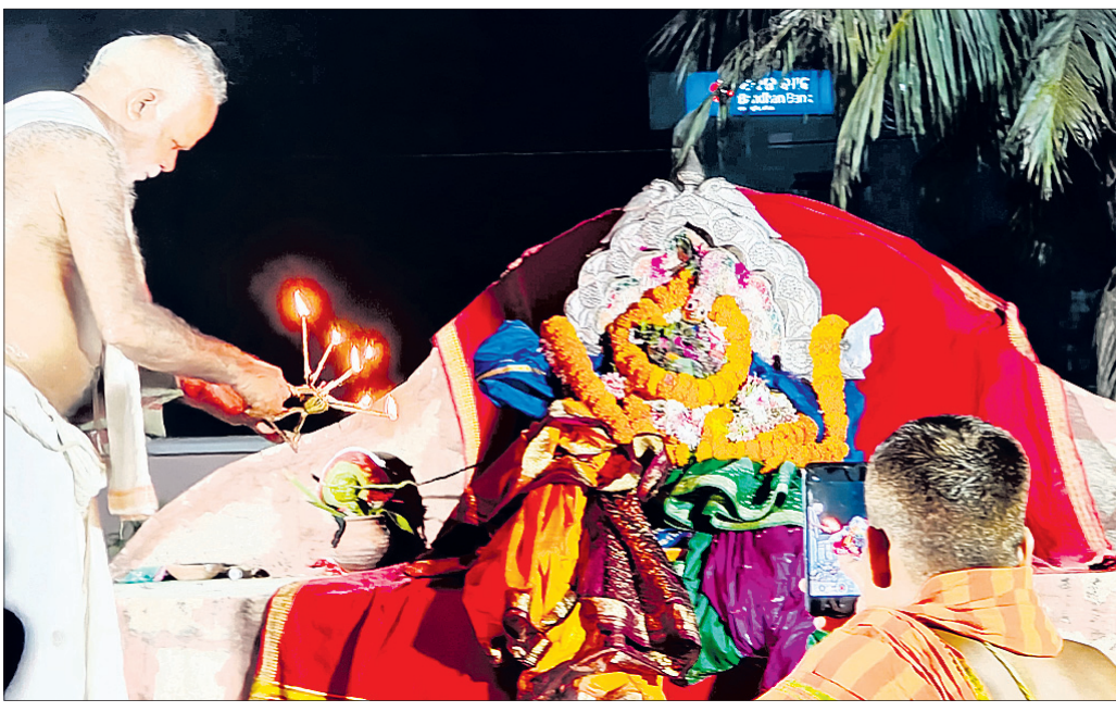
ଶ୍ରୀଜୀଉଙ୍କ ପୂଜାର୍ଚ୍ଚନା କରାଯାଉଛି ।