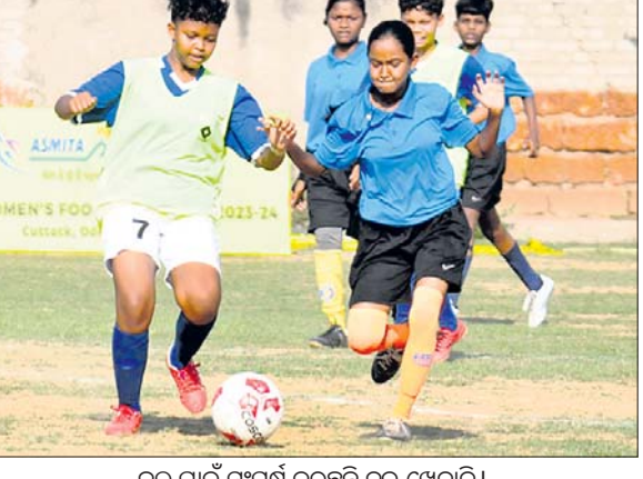
ବଲ୍ ପାଇଁ ସଂଘର୍ଷ କରୁଛନ୍ତି ବୁଲ୍ ଖେଳାଳି।

ଭୁବନେଶ୍ୱର, ୨୩ମା (ବିଜୟ ରଣା) ୧୫ ବର୍ଷରୁ କମ୍ ଖେଳାଳି ଇଣ୍ଡିଆ ମହିଳା ପୁରୁଷ ଲିଗ୍ ୨୦୨୩-୨୪ରେ ଶନିବାର ଖେଳାଯାଇଥିବା ମ୍ୟାଚରୁଡ଼ିକରେ ସ୍କୋର୍ସ ଓଡ଼ିଶା, ଯୁବି-୨ ଆଥଲେଟିକ୍ ଆସୋସିଏସନ ଏବଂ ଓଡ଼ିଶା ଏକାଦଶ ସେମାନଙ୍କ ମ୍ୟାଚରେ ବିଜୟ ଲାଭ କରିଛନ୍ତି। ପ୍ରଥମ ମ୍ୟାଚରେ ସ୍କୋର୍ସ ଓଡ଼ିଶା ୨-୦ ଗୋଲରେ ଯୋଗାଣ କରିଥିବା ବେଳେ ଓଡ଼ିଶା ଏକାଦଶ ୨-୦ ଗୋଲରେ ବିଜୟ ଲାଭ କରିଛନ୍ତି। ପ୍ରଥମ ମ୍ୟାଚରେ ସ୍କୋର୍ସ ଓଡ଼ିଶା ୨-୦ ଗୋଲରେ ବିଜୟ ଲାଭ କରିଛନ୍ତି। ପ୍ରଥମ ମ୍ୟାଚରେ ସ୍କୋର୍ସ ଓଡ଼ିଶା ୨-୦ ଗୋଲରେ ବିଜୟ ଲାଭ କରିଛନ୍ତି। ପ୍ରଥମ ମ୍ୟାଚରେ ସ୍କୋର୍ସ ଓଡ଼ିଶା ୨-୦ ଗୋଲରେ ବିଜୟ ଲାଭ କରିଛନ୍ତି।