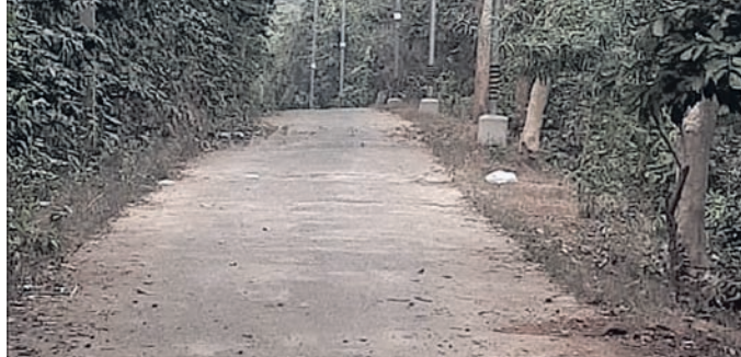
ଗୋକୁଳାନନ୍ଦ ପୀଠକୁ ପହଞ୍ଚିବା ପାଇଁ ରାସ୍ତା ।

ଖଣ୍ଡପଡ଼ା ବ୍ଲକ୍ ଅଧୀନ ସିଧାପୁର ଗୋକୁଳାନନ୍ଦ ପୀଠ ଏବଂ ଚନ୍ଦ୍ରବିହାର ମଧୁକର୍ଣ୍ଣିକା ପାହାଡ଼ରେ ଅବସ୍ଥିତ ଇକୋ ତୁନିକିମ ପରିବେଶ ପର୍ଯ୍ୟଟନସ୍ଥଳୀ କେନ୍ଦ୍ରକୁ ସଂଯୋଗ କରୁଥିବା ରାସ୍ତାରେ ଉତ୍କଳ ଆଲୋକାକରଣ ବ୍ୟବସ୍ଥା ନାହିଁ । ସନ୍ଧ୍ୟା ହେଲେ ରାସ୍ତାଟି ସମ୍ପୂର୍ଣ୍ଣ ଅନ୍ଧାରରେ ରହିଥାଏ । ସାଧାରଣ ଯାତାୟତ ପାଇଁ ଏହା ଏକ ବୃହତ୍ ସମସ୍ୟା ସୃଷ୍ଟି କରିଛି ।