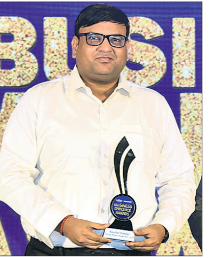
କୌଶଲ ପୋଲଙ୍କୁ ପୁରସ୍କାର କରାଯାଇଥିବା ଦୃଶ୍ୟ।