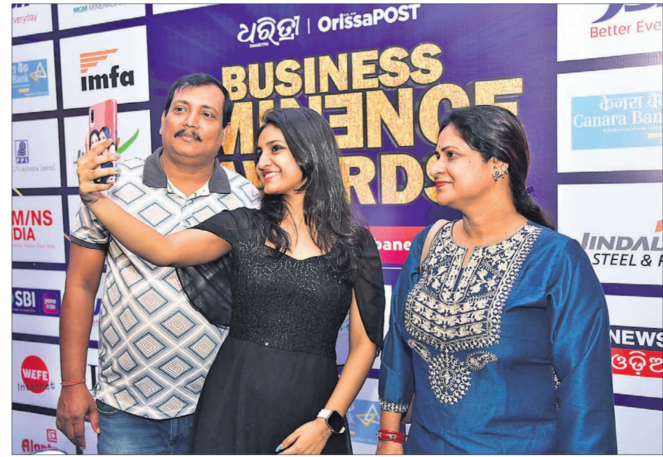
କାର୍ଯ୍ୟକ୍ରମର ସେକ୍ସନ୍ ଦର୍ଶାଉଥିବା ଦୃଶ୍ୟ।