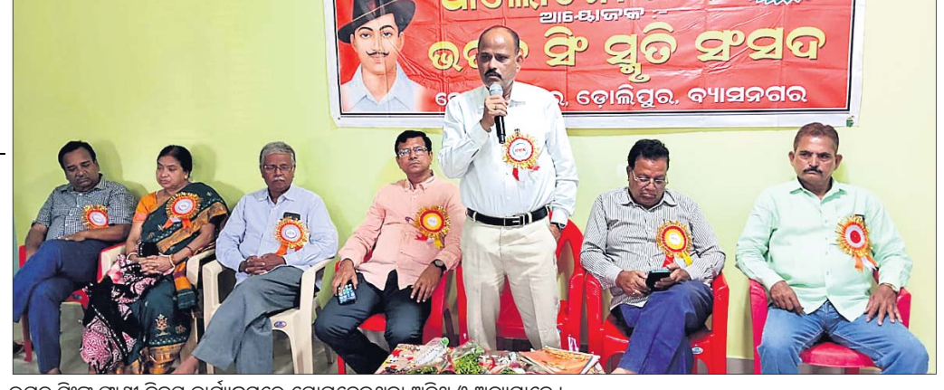
ଭଗତ ସିଂଙ୍କ ପାଶୀ ଦିବସ କାର୍ଯ୍ୟକ୍ରମରେ ଯୋଗଦେଇଥିବା ଅତିଥି ଓ ଅନ୍ୟମାନେ ।

ଯାଜପୁରରୋଡ଼, ୨୩୩୩ (ପବିତ୍ର ରଞ୍ଜନ ମହାନ୍ତି):