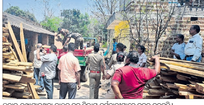
କୁଡ଼ାଇ ରଖାଯାଇଥିବା କାଠକୁ ବନ ବିଭାଗ କର୍ମଚାରୀମାନେ ଜବତ କରୁଛନ୍ତି ।