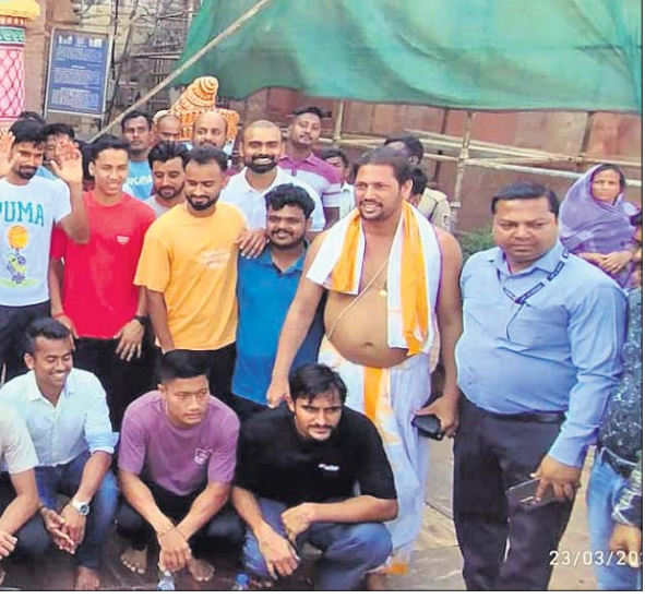
ଶ୍ରୀମନ୍ଦିର ସମ୍ମୁଖରେ ଭାରତୀୟ ହଜି ଦଳର ଖେଳାଳି ଓ କର୍ମଚାରୀ।