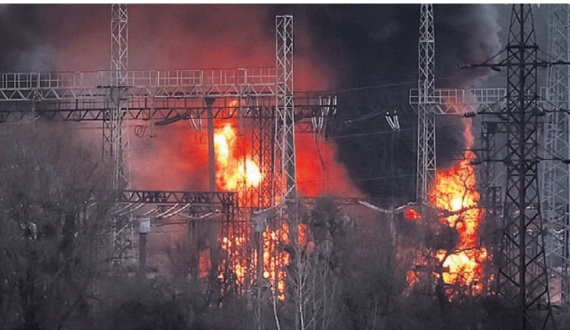
ରୁଷିଆ ସେନାର ମିଶାଇଲ ମାଡ଼ରେ ମୁକ୍ତେନ୍ଦ୍ର ଏକ ଶକ୍ତି ପ୍ରକଳ୍ପ ଜଳିଯାଇଛି।

ରୁଷିଆ ରାଜଧାନୀ ମସ୍କୋସ୍ଥିତ ଏକ ସିଟି ହଲରେ ଶୁକ୍ରବାର ରାତିରେ ଆତଙ୍କବାଦୀ ଆକ୍ରମଣ ହୋଇଥିଲା। ଏଥିରେ ଶତାଧିକ ନିହତ ହୋଇଥିବାବେଳେ ଆକ୍ରମଣ ପାଇଁ ଇସ୍ଲାମିକ ଷ୍ଟେଟ୍ (ଆଇଏସ୍) ନିଜକୁ ଦାୟୀ କରିଛି। ତେବେ ଆକ୍ରମଣ ପାଇଁ ରୁଷିଆ ମୁକ୍ତେନ୍ଦ୍ର