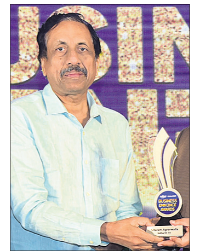
ସାରାଂଶ ଅଧ୍ୟକ୍ଷଙ୍କୁ ପୁରସ୍କାର କରାଯାଇଥିବା ଦୃଶ୍ୟ।