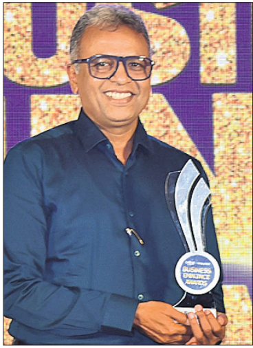
କୋଟନ ଟିକ୍ସଟାଇଲ କୁମାରଙ୍କୁ ପୁରସ୍କାର କରାଯାଇଥିବା ଦୃଶ୍ୟ।