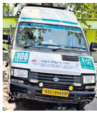
ଅବଳ ହୋଇପଡ଼ିଥିବା ଆୟୁଲାଟୁ ।

ସେବାରୁ ବଞ୍ଚିତ ହୋଇଥିବା ସାଧାରଣରେ ଅସହାୟ ପ୍ରକାଶ ପାଇଛି । ଆକଳୁ ମାସକ ତଳେ ରୋଗୀ ଓ ଚାକ୍ଷୁଷ ସମ୍ପର୍କୀୟ ଧରି ୧୦୮ ଆୟୁଲାଟୁ ନୟାଗଡ଼ରୁ ଭୁବନେଶ୍ୱର ଅଭିଯୁକ୍ତେ ୧୦୮ ଆୟୁଲାଟୁ ସେବା କିପରି ବିପର୍ଯ୍ୟୟ ହୋଇ ପଡ଼ିଛି ତାହା ଖଣ୍ଡପଡ଼ା ଓ କୃଷିଲୋ ଅଞ୍ଚଳରେ ନିୟୋଜିତ ହୋଇଥିବା ୧୦୮ ଆୟୁଲାଟୁ ଅବଳ ହୋଇ ପଡ଼ିଥିବାରୁ ଖଣ୍ଡପଡ଼ା ଅଞ୍ଚଳବାସୀ ଆୟୁଲାଟୁ ସେବାରୁ ବଞ୍ଚିତ ହୋଇଛନ୍ତି । ଅଞ୍ଚଳବାସୀ ଏ ସମ୍ପର୍କରେ ବାରମ୍ବାର ଉକ୍ତ କର୍ତ୍ତୃପକ୍ଷଙ୍କ ଦୃଷ୍ଟି ଆକର୍ଷଣ