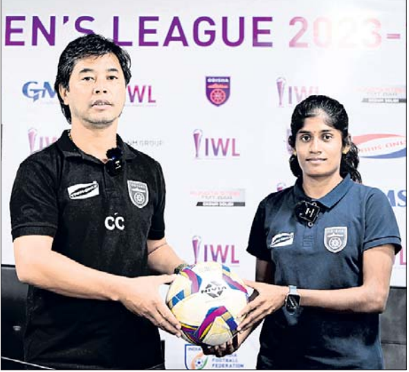
ପୁଣ୍ୟ କୋର୍ କ୍ରିକିଟ୍ ଛେତ୍ରୀ ଓ କାର୍ତ୍ତିକ ଅଙ୍ଗପୁଅ। ପରାଜିତ ହୁଏ କିମ୍ବା ମ୍ୟାଚ ଡ୍ର ରୁହେ ତା' ହେଲେ ଓଏଫସି ପାଇଁ ଏହି ମ୍ୟାଚ ରୁରୁହୀନ ହୋଇଯିବ। ରବିବାର ମ୍ୟାଚ ପୂର୍ବରୁ ଏକ

ଭୁବନେଶ୍ୱର, ୨୩ମା (ସରୋଜ କେନା) ଇଣ୍ଡିଆନ୍ ଓମେନ୍ସ ଲିଗ୍ (ଆଇଡବ୍ଲ୍ୟୁଏଲ)ର ଅନ୍ତିମ ଲିଗ୍ ମ୍ୟାଚ ଭୁବନେଶ୍ୱରର କଳିଙ୍ଗ ଷ୍ଟାଡିୟମରେ ରବିବାର ଖେଳାଯିବ। ଏହି ମ୍ୟାଚ ଜିତିବା ସହିତ ଆଇଡବ୍ଲ୍ୟୁଏଲ ଇତିହାସରେ ପ୍ରଥମ ଟାଇଟଲ ଲକ୍ଷ୍ୟରେ ରହିଛି ଓଡ଼ିଶା ଏଫସି (ଓଏଫସି)। ଓଏଫସି ଏହାର ଅନ୍ତିମ ଲିଗ୍ ମ୍ୟାଚରେ କର୍ନାଟକର କିକ୍ସ୍ପୋର୍ଟ ଏଫସି ବିପକ୍ଷରେ ଖେଳିବ। ଏହି ମ୍ୟାଚରେ ବିଜୟ ହେଲେ ପଏଣ୍ଟ ଟେବୁଲ ଶୀର୍ଷରେ ରହି ଟାଇଟଲ ହାସଲ କରିପାରିବ। ଶନିବାର ଡିପେଣ୍ଡେଣ୍ଟ ଗାମ୍ପିୟନ ଗୋକୁଳନ କେରକର ମ୍ୟାଚ ଇଣ୍ଡିଆନ୍ ଓମେନ୍ସ ଲିଗ୍ ସହିତ ରହିଛି। କେରକର ଏହି ମ୍ୟାଚରେ ବିଜୟ ହେଲେ ଓଏଫସିକୁ ବିଜୟ ନିହାତି ଆବଶ୍ୟକ। ତେବେ ଯଦି ଗୋକୁଳନ