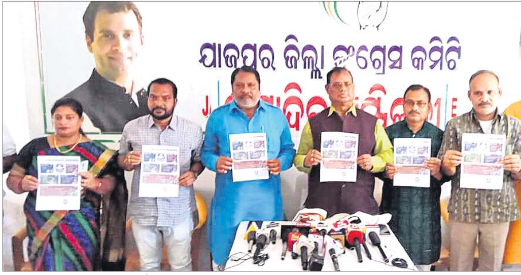
କଂଗ୍ରେସ ନେତାମାନେ ଗ୍ୟାରେଣ୍ଡି କାର୍ଡ ଉନ୍ମୋଚନ କରୁଛନ୍ତି ।

ଯାଜପୁର ଶାଖା, ୨୩୩୩ (ପ୍ରସନ୍ନା ପ୍ରିୟଦର୍ଶିନୀ ମହାନ୍ତି):