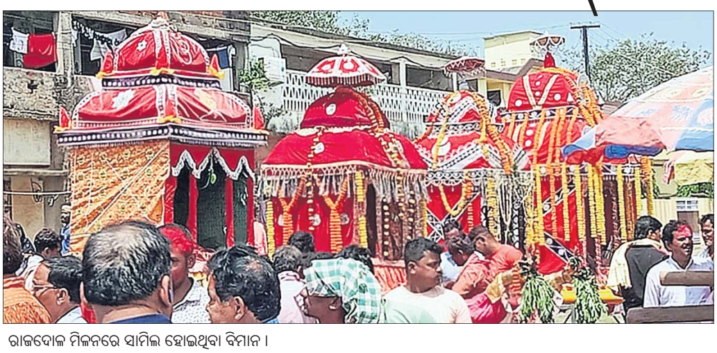
ରାଜଦୋଳ ମିଳନରେ ସାମିଲ ହୋଇଥିବା ବିମାନ ।