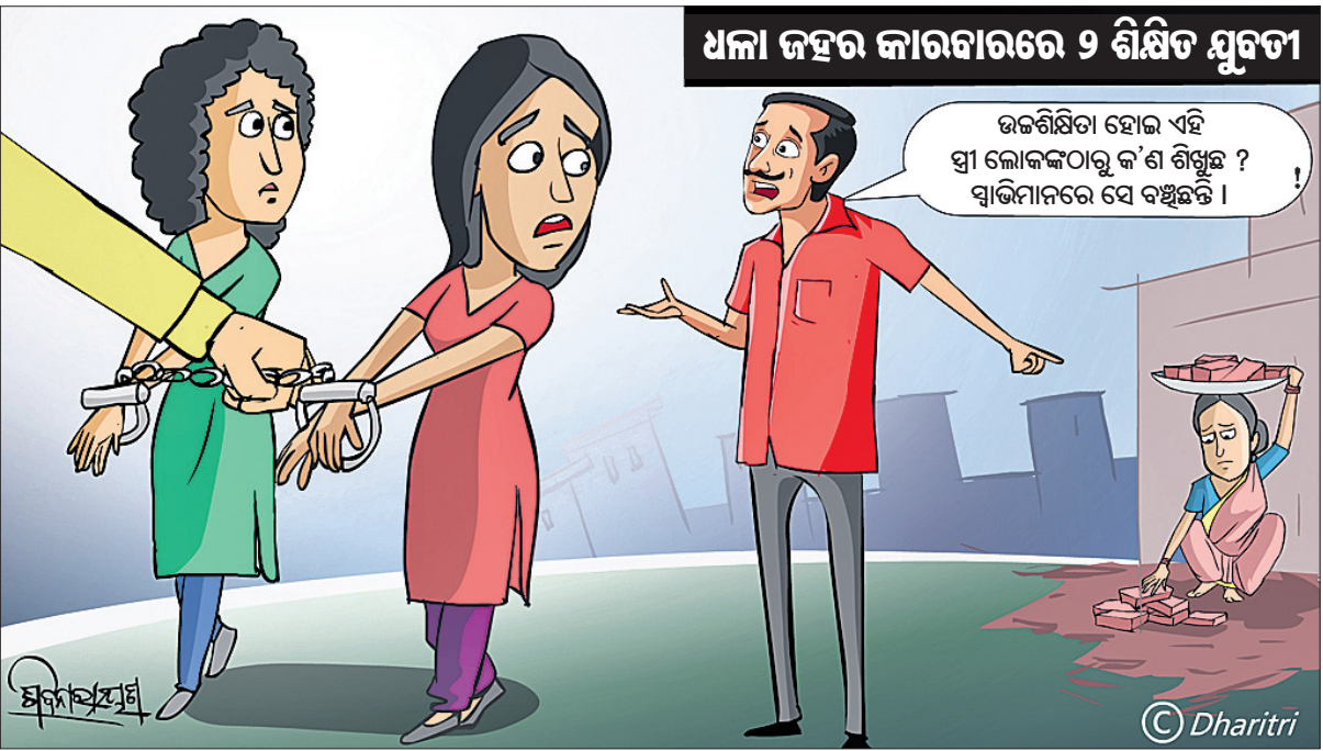
ଧଳା ଜହର କାରବାରରେ ୨ ଶିକ୍ଷିତା ଯୁବତୀ