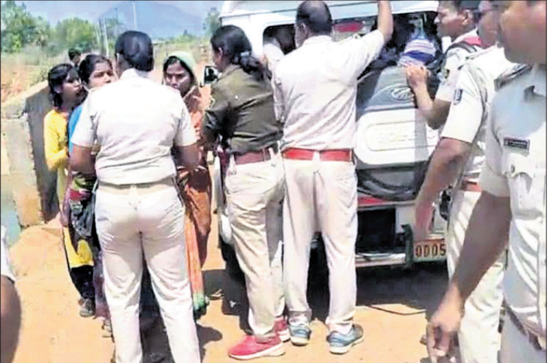
ଅବକାରୀ କର୍ମଚାରୀଙ୍କୁ ମହିଳାମାନେ ଅଟକ ରଖିଛନ୍ତି ।