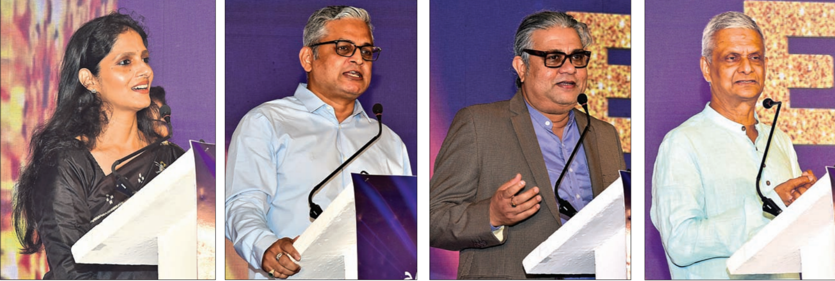
ଧରିତ୍ରୀ ଏବଂ ଡ଼ିଜିଟାଲ ପୋଷ୍ଟ ପକ୍ଷରୁ ଶ୍ରଦ୍ଧାଂଜଳୀ ପ୍ରଦାନ କରାଯାଇଥିବା ବେଳେ ଉପସ୍ଥିତ ଥିବା ଅତିଥିମାନଙ୍କୁ ଉପସ୍ଥାପନ କରିବା ପାଇଁ ପ୍ରମୁଖ ଅତିଥିମାନଙ୍କୁ ଉପସ୍ଥାପନ କରାଯାଇଥିବା ଦୃଶ୍ୟ।