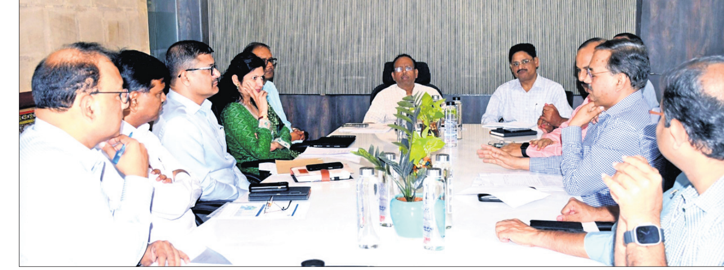
ମୁଖ୍ୟ ଶାସନ ସଚିବ ପ୍ରତୀପ ଜେନାଙ୍କ ଅଧକ୍ଷତାରେ ବସିଥିବା ସମ୍ବନ୍ଧୀୟ ବୈଠକରେ ଉପସ୍ଥିତ ବିଭିନ୍ନ ବିଭାଗର ଅଧିକାରୀ ।