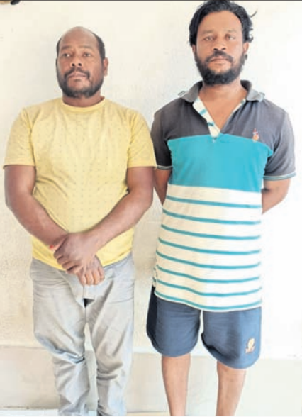
ଗିରଫ ୨ ଅଭିଯୁକ୍ତ । ଜବତ କାଳନୋଟ ଓ ଗୋଟ ପ୍ରମୁଦିରେ ବ୍ୟବହୃତ କମ୍ପ୍ୟୁଟର, ପ୍ରିଣ୍ଟର ।