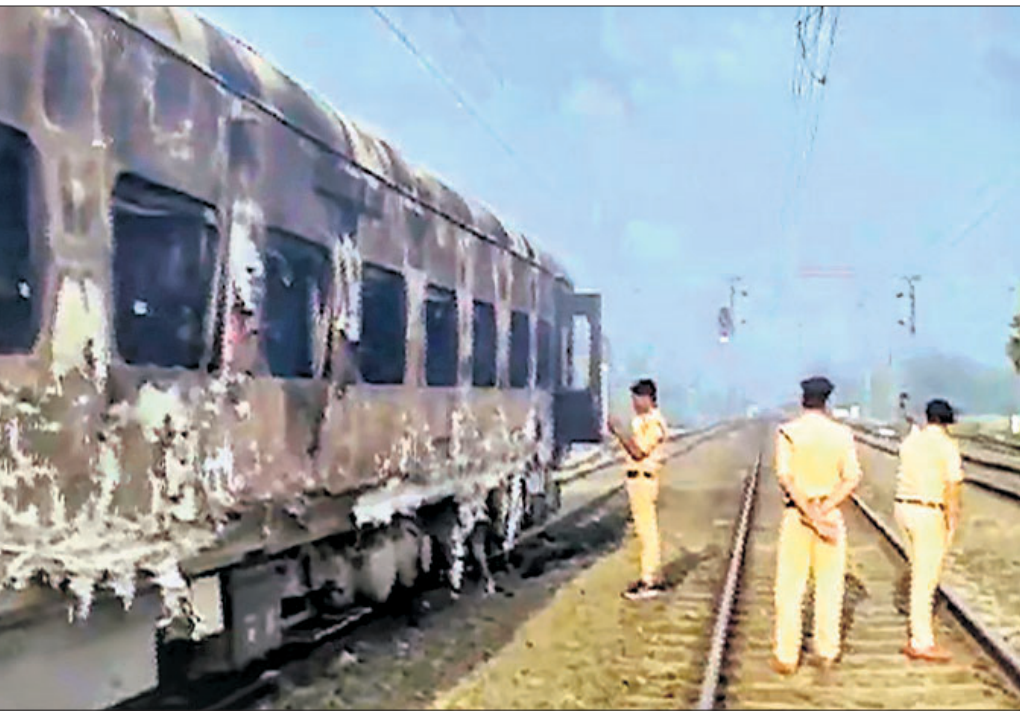
ନିଆଁ ଲାଗିଥିବା ବଗିଚା ରେଲୱେ ଯୋଗ୍ୟ ଅନୁଧ୍ୟାନ କରୁଛି।

ପାଟନା, ୨୭।୩: ବିହାରର ଭୋଜପୁର ଜିଲ୍ଲା କାରିୟାଥ ଷ୍ଟେଶନ ନିକଟରେ ଲୋକମାନ୍ୟ ଡିଲ୍‌କ-ଦାନାପୁର ହୋଲି ସ୍ନେଶାଲ ଟ୍ରେନ୍ (୦୧୪୧୦)ରେ ମଙ୍ଗଳବାର ରାତି ପ୍ରାୟ ୧୨ଟା ୩୦ରେ ନିଆଁ ଲାଗିଯାଇଥିଲା।