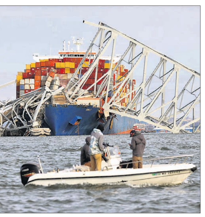
ବଲ୍ଟିମୋରରେ ଭୁଲ୍‌ଡିପ୍‌ଥିବା ପ୍ରାନ୍ତିୟ ଷ୍ଟର୍ କି ବ୍ରିକ୍ ନିକଟରେ ଉଦ୍ଧାର କାର୍ଯ୍ୟରେ ନିଯୋଜିତ ଏମ୍‌ବେଡ୍‌ସ୍ ବୋର୍ଡ।