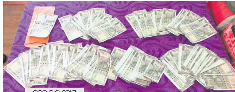
ଜବତ କାଲି ନୋଟ୍

ବଲାଙ୍ଗୀର ଜିଲ୍ଲା ଦେଓଗାଁ ଥାନା ବୁଢ଼ାବାହାଲ ଗାଁରେ ଠାବ ହୋଇଛି କାଲିନୋଟ୍ ଛପା କେନ୍ଦ୍ର। ୫୦୦ଟିଆଁ କାଲିନୋଟ୍ ଛପାଯାଇ ବଜାରକୁ ଛଡ଼ାଯାଉଥିବା ଘଟଣା ଏବେ ଧରାପଡ଼ିଛି। ଏକ ୨୪ ପ୍ରହର ନାମାଞ୍ଜରେ ଗାୟକ ଏବଂ ବାୟକଙ୍କୁ କାଲି ନୋଟ୍ ଉପହାର ଦେଇ ଧରାପଡ଼ିଛି ୨ ଅଭିଯୁକ୍ତ। ଏଥିସହିତ ଏହି କାରବାରରେ ବ୍ୟବହୃତ ହେଉଥିବା କମ୍ପ୍ୟୁଟର, ପ୍ରିଣ୍ଟର, ପେପର ଏବଂ ଅନ୍ୟାନ୍ୟ ସାମଗ୍ରୀକୁ ପୋଲିସ୍ ଜବତ କରିଛି।