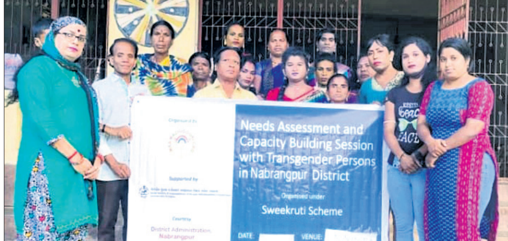
ବୈଠକରେ ଯୋଗଦେଇଥିବା କିନ୍ନର ସଂଘ ସଦସ୍ୟ ଓ ଅନ୍ୟମାନେ।