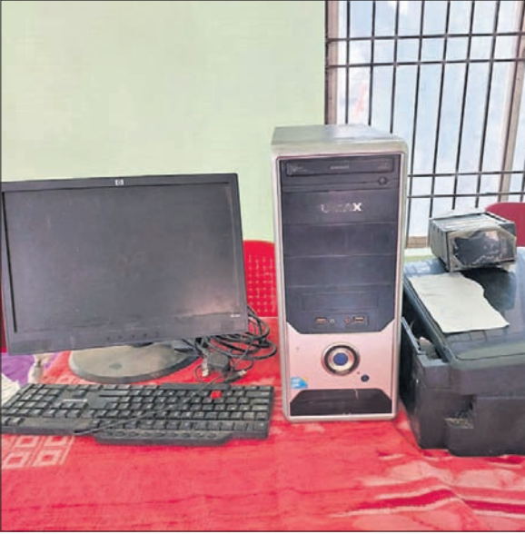
ଗିରଫ ୨ ଅଭିଯୁକ୍ତ । ଜବତ କାଳନୋଟ ଓ ଗୋଟ ପ୍ରମୁଦିରେ ବ୍ୟବହୃତ କମ୍ପ୍ୟୁଟର, ପ୍ରିଣ୍ଟର ।