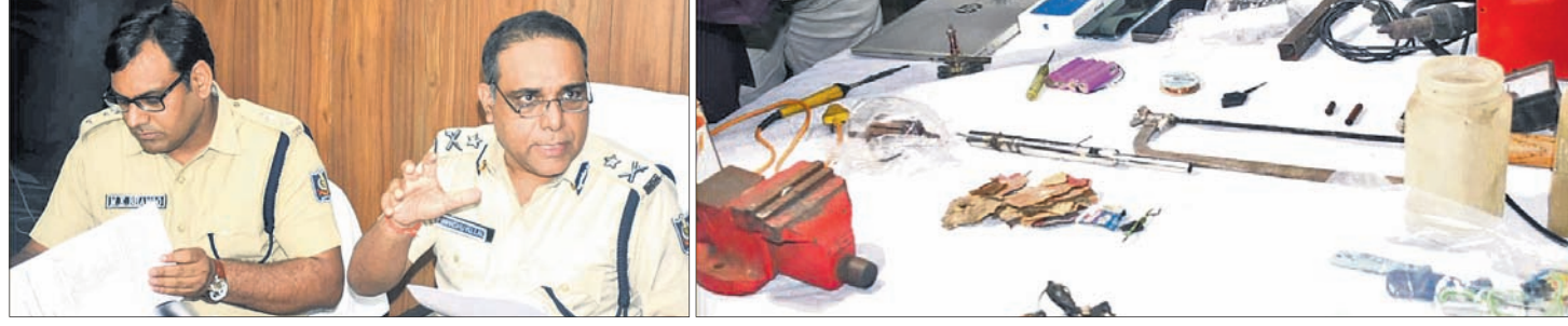
ଖବରଦାତା ସମ୍ବଳନରେ ଆରମ୍ଭ ଅଧ୍ୟାୟକ ଓ ଉତ୍ତରାଧିକାରୀ ଆଇ.ଏ. ଜବତ ହୋଇଥିବା ବୋମା ତିଆରି ସରଞ୍ଚାମା।