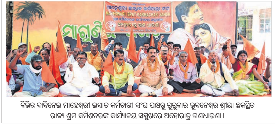
ଭିଜିନ ଦାବିନେଇ ମାହେଶ୍ୱରୀ ଇସ୍ତାତ କର୍ମଚାରୀ ସଂଘ ପକ୍ଷରୁ ଭୁବନେଶ୍ୱର ଶ୍ରୀମାତା ଛକସ୍ଥିତ ରାଜ୍ୟ ଶ୍ରମ କମିଶନରଙ୍କ କାର୍ଯ୍ୟାଳୟ ସମ୍ମୁଖରେ ଅହୋରାତ୍ର ଗଣଧାରଣା।