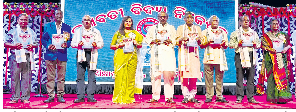
ପୁରୀର ଭଗବତୀ ବିଦ୍ୟା ନିକେତନର ରୌପ୍ୟ ଜୟନ୍ତୀ ଅବସରରେ ଗୁରୁବାର ଅତିଥିମାନେ ଶିକ୍ଷାନୁଷ୍ଠାନର ମୁଖପତ୍ର ଉନ୍ମୋଚନ କରୁଛନ୍ତି।

ଆଗାମୀ ଦିନରେ ଯଦି ବାରମ୍ବାର ନିଷିଦ୍ଧାଞ୍ଚଳକୁ ଚଳାଇ ଅନୁପ୍ରବେଶ କରେ, ତାହାଲୋକେ ଏପରି ବିରଳ ପ୍ରକାରେ ସାମୁଦ୍ରିକ ଜୀବ ଦିନେ ଲୋପ ପାଇଯିବ। ତେଣୁ ଜିଲ୍ଲା ପ୍ରଶାସନ ଏହି ଘଟଣାକୁ ଜରୁରୀ ମନେ କରି ତୁରନ୍ତ କାର୍ଯ୍ୟାନୁଷ୍ଠାନ ନେବାପାଇଁ ଅଞ୍ଚଳବାସୀ ଦାବି କରିଛନ୍ତି। ସେହିପରି ବିଭାଗୀୟ ଅଧିକାରୀଙ୍କ ଅନୁପସ୍ଥିତ ଏବଂ କାର୍ଯ୍ୟରେ ଅବହେଳା କାରଣରୁ ନିଷିଦ୍ଧାଞ୍ଚଳରେ ଶହ ଶହ କଇଁଛଙ୍କ ମୃତଦେହ ଜଳରେ ଲାଭୁଥିବା ଦେଖିବାକୁ ମିଳୁଛି।