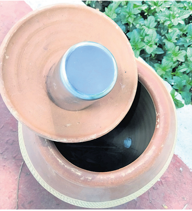
ବିଧାନସଭା ଆୟୁର୍ବେଦିକ ଚିକିତ୍ସାଳୟ ସମ୍ମୁଖ ଜଳସେବା ଶିବିରରେ ଥିବା ମାଠିଆରେ ପାଣି ନାହିଁ। ଚଳା ଖର୍ଚ୍ଚ ଦର୍ଶାଇ ସେସବୁକୁ ହରିଲୁଟ୍ କରୁନାକାଳୀନ ଓ ବିପର୍ଯ୍ୟୟ କରାଯିବ ବୋଲି ଆଲୋଚନା ଚାଲିଛି। ଯୋଗାଯୋଗ କରାଯାଇଥିଲେ ମଧ୍ୟ ଶିବିର ଦାୟିତ୍ୱରେ ଥିବା ବିଏମ୍‌ସିର ପରିଚାଳନା ବିଭାଗର ଅଧିକାରୀଙ୍କୁ ଯୋଗାଯୋଗ କରାଯାଇଥିଲେ ମଧ୍ୟ ଚାକ୍ ପ୍ରତିକ୍ରିୟା ମିଳିପାରିନାହିଁ।

ଦାୟିତ୍ୱ ଦିଆଯାଇଥିଲା। ମାତ୍ର କିଛିଦିନ ପରେ ପ୍ରାୟ ସବୁ ଶିବିର ଫାଙ୍କା ପଡ଼ିବା ସହ ଖାଲି ମାଠିଆ ଦେଖିବାକୁ ମିଳିଥିଲା। ଫାଙ୍କାରେ ବିଏମ୍‌ସିକୁ ନିର୍ଦ୍ଦିଷ୍ଟ ହେବାକୁ ପଡ଼ିଥିଲା। ତେଣୁ ଚଳିତବର୍ଷ ଯେପରି ଏହାର ପୁନରାବୃତ୍ତି ନ ହେବ ସେଥିପାଇଁ ବିଏମ୍‌ସି ନିଜ ପରିଚାଳନା ଦାୟିତ୍ୱ ନେଇଛି। ପ୍ରତି ଜଳସେବା ଶିବିର ନିକଟରେ ୨ଜଣ କର୍ମଚାରୀଙ୍କୁ ବିଏମ୍‌ସି ନିୟୋଜିତ କରିଥିବା ସୂଚନା ରହିଥିବାବେଳେ ଏହା କେବଳ କାଗଜ କଲମରେ ସୀମିତ ରହିଛି। ସେହିପରି ପ୍ରତି ଖୁର୍ଦ୍ଦରେ ୨ଟି ଲୋକାଧିକାରୀ ଖୋଲିବା ପାଇଁ ପ୍ରସ୍ତାବ ଦିଆଯାଇଥିଲା। ମାତ୍ର ମାର୍ଚ୍ଚ ସରିବାକୁ ଦିନିକିଏକେ ଏବେ ସୁଦ୍ଧା ସମସ୍ତ ଖୁର୍ଦ୍ଦରେ ଜଳସେବା ଶିବିର ଖୋଲିପାରି ନାହିଁ। ହେଲେ ଚେଷ୍ଟା, ମାଠିଆ, ପାଣି ଓ ଜଳସେବାରେ ଆବଶ୍ୟକ ବିଭିନ୍ନ ସାମଗ୍ରୀ ସମେତ ଗ୍ରାମ୍ୟ ଶେଷ ପର୍ଯ୍ୟନ୍ତ ୨ଜଣ କର୍ମଚାରୀ ବାଦକୁ ଲକ୍ଷ୍ୟ କରା