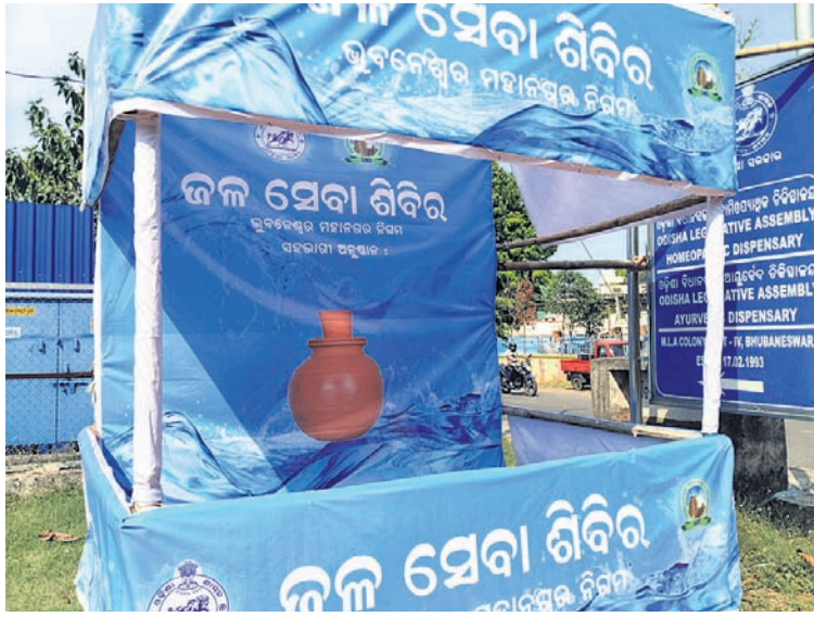
(ବାମରୁ) ମାର୍କେଟ ବିଲ୍ଡିଂ, ବିଧାନସଭା ଆୟୁର୍ବେଦିକ ଚିକିତ୍ସାଳୟ ସମ୍ମୁଖ ଓ ରବାନ୍ତ ମଣ୍ଡପ ନିକଟରେ ଖୋଲିଥିବା ଜଳସେବା ଶିବିରରେ ପାଣି ଦେବାକୁ ଲୋକ ନାହାନ୍ତି।