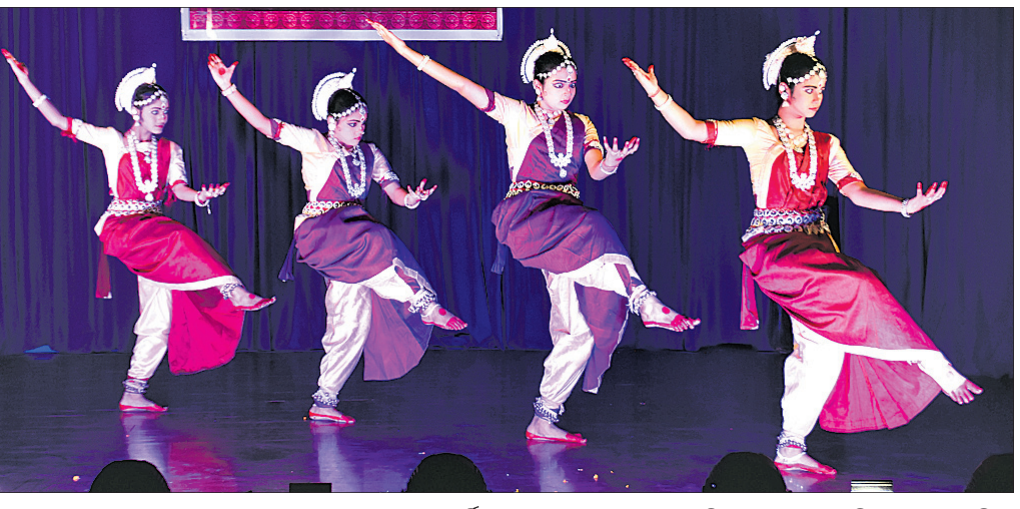
ଭୁବନେଶ୍ୱର ସୂଚନା ଭବନରେ ଗୁରୁବାର ମୋକ୍ଷ ଅନୁଷ୍ଠାନର ବାର୍ଷିକ ଉତ୍ସବ ପାଳନ ଅବସରରେ ଶିଳ୍ପୀମାନେ ନୃତ୍ୟ ପରିବେଷଣ କରୁଛନ୍ତି।