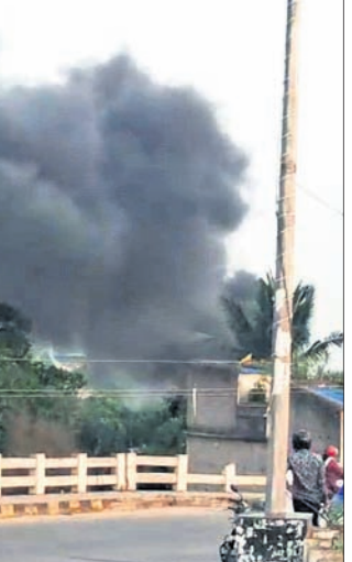
ହୋଇ ନ ଥିଲେ ମଧ୍ୟ ଅଗ୍ନିକାଣ୍ଡରେ କିଛି ସାମଗ୍ରୀ ଓ ଆସବାବପତ୍ର ସୂଚନା ମିଳିଛି।

ଭୁବନେଶ୍ୱର ପଳାଶପଲୀ ପୁନମା ରେଟ୍ ନିକଟରେ ଗୁରୁବାର ଏକ ମୁତ୍ସକି ଫ୍ୟାକ୍ଟିରେ ଅଗ୍ନିକାଣ୍ଡ ଘଟିଛି। ତେଲ କଡ଼ାଳରୁ ନିଆଁ ଲାଗି ଫ୍ୟାକ୍ଟିର ବହୁ ସାମଗ୍ରୀ ପୋଡ଼ିଯାଇଛି। ଅପରାହ୍ନ ପ୍ରାୟ ୫ଟାରେ ଫ୍ୟାକ୍ଟିରେ ନିଆଁ ଲାଗିଥିବା ଖବର ପାଇ କଳ୍ପନା ପାୟାର ସ୍ୱେଶନର ଅଗ୍ନିଶମ ଟିମ୍ ସେଠାରେ ପହଞ୍ଚି ୨୦ ମିନିଟ୍ ମଧ୍ୟରେ ନିଆଁକୁ ଆୟତ୍ତ କରିବାରେ ସକ୍ଷମ ହୋଇଥିଲା। ସୂଚନ ଅନୁଯାୟୀ, ମୁତ୍ସକି ଛଣା ହେଉଥିବାବେଳେ ତେଲ ଅତ୍ୟଧିକ ଗରମ ହୋଇଯାଇଥିଲା। କର୍ମଚାରୀମାନେ ପାଣି ପକାଇ ଦେବାକୁ ତେଲ କଡ଼େଇଟି ଛଳି ଉଠିଥିଲା। ଏପରିକି ବହୁ ଉତ୍କଳୁ ନିଆଁ ଶିଖା ଉଠିଯାଇ ଚାରିଆଡ଼କୁ ବ୍ୟାପିଯାଇଥିଲା। ତେବେ ସମସ୍ତ କର୍ମଚାରୀ ଆହତ ହୋଇନା ଥିଲେ ମଧ୍ୟ ଅଗ୍ନିକାଣ୍ଡରେ କିଛି ସାମଗ୍ରୀ ଓ ଆସବାବପତ୍ର ସୂଚନା ମିଳିଛି।