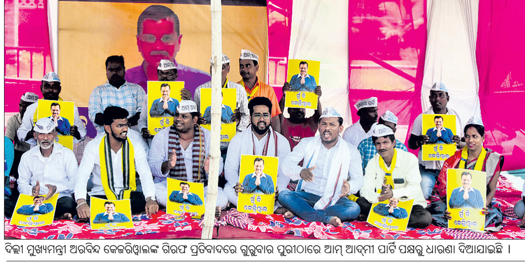
ଦିଲ୍ଲୀ ମୁଖ୍ୟମନ୍ତ୍ରୀ ଅରବିନ୍ଦ କେଜ୍‌ରିୱାଲଙ୍କ ଗିରଫ ପ୍ରତିବାଦରେ ଗୁରୁବାର ପୁରୀଠାରେ ଆମ୍ ଆନ୍ଦୋଳନ ପାଟି ପକ୍ଷରୁ ଧାରଣା ଦିଆଯାଇଛି।