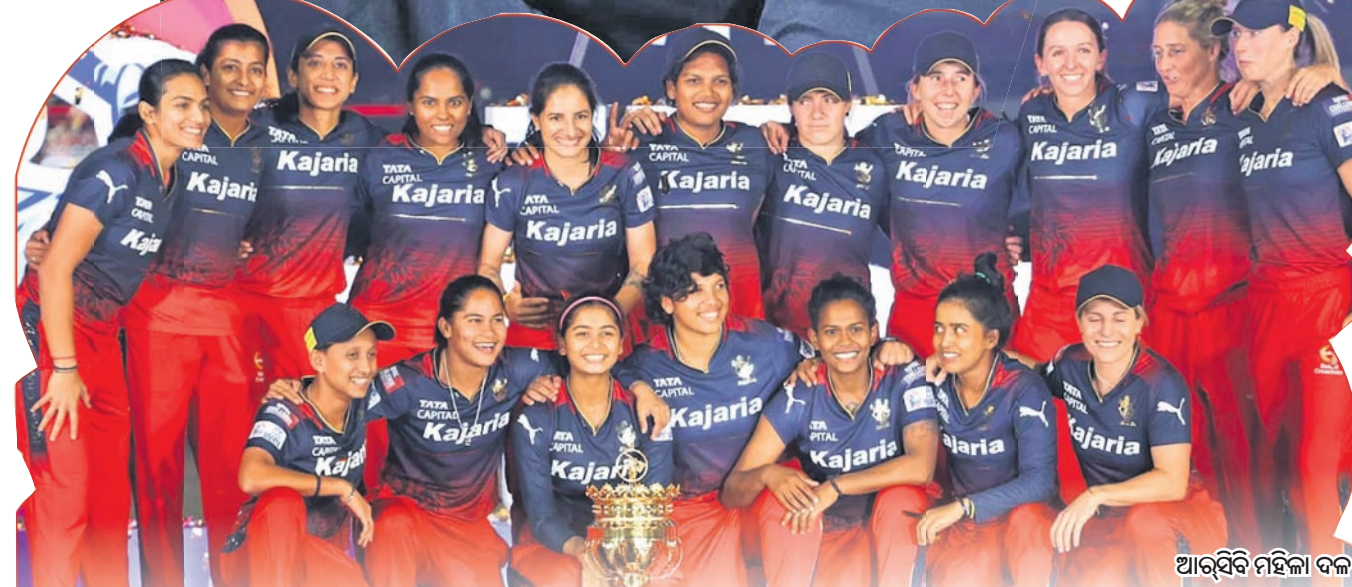
ଆରବି ମହିଳା ଦଳ