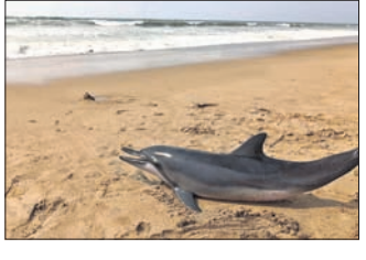
ଦେଖି ବନ ବିଭାଗକୁ ଖବର ଦେବାକୁ ବନ ବିଭାଗ ଏହାକୁ ଜବତ କରିଥିଲା। ବନ ବିଭାଗ ମୃତ ଡଲ୍‌ଫିନର କାରଣ ଅନୁସନ୍ଧାନ କରୁଥିବାବେଳେ ବୁଦ୍ଧିଜୀବୀ ମହଲ

ଅସ୍ତରଙ୍ଗ, ୨୮ ମାର୍ଚ୍ଚ (ପ୍ରବାସ ଦାକ୍ଷିଣ୍ୟ/ମମତା କେନା):