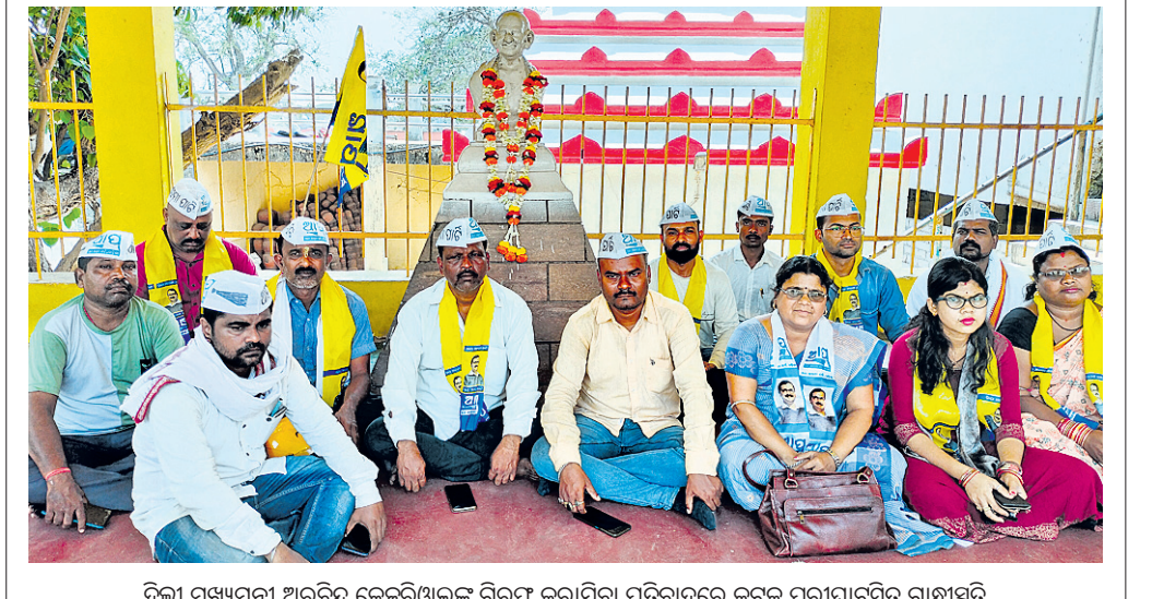
ଦିଲ୍ଲୀ ମୁଖ୍ୟମନ୍ତ୍ରୀ ଅରବିନ୍ଦ କେଜ୍ରିୱାଲଙ୍କୁ ଗିରଫ କରାଯିବା ପ୍ରତିବାଦରେ କଟକ ପୁରୀସ୍ଥିତ ଗାନ୍ଧୀସ୍ମୃତି ପୀଠ ପରିସରରେ ଗୁରୁବାର ଆମ୍ ସାମ୍ପ୍ରଦାୟ ପାର୍ଟି ପକ୍ଷରୁ ଏକଦିବସୀୟ ସାମ୍ବିଧାନ ଉପବାସ ଧାରଣା।

ହେଲେ ୬ ଅର୍ଥ ଏମ୍ପି ହୋଇଥିବା ଭର୍ତ୍ତୃହରି ଗୁରୁବାର ପଦ୍ମ ଧରିବା ପରେ ତାଙ୍କୁ ଭାଜପା ସୁନିଶ୍ଚିତ ରିଜେକ୍ଟ ଦେଇ କଟକରେ ଥିବା ତାଙ୍କ ପ୍ରଭାବକୁ ବଜାୟ ରଖି ବୋଲି ସାଧାରଣ ଲୋକଙ୍କ ଚର୍ଚ୍ଚାକୁ ଏହା ଖୋରାକ୍ତ ଯୋଗାଇଛି। ପୁଣି ଆଲୋଚନା ହେଉଛି, ଯଦି ଦଳ