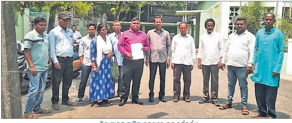
ଜିଲାପାଳଙ୍କ ଅଧିକ ସମ୍ମୁଖରେ ମଞ୍ଚ କର୍ମକର୍ତ୍ତା।