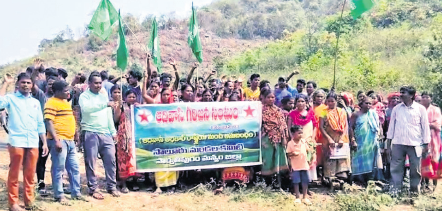
ବୋର୍ଡ଼ିଫ୍ଲେକ୍ ଖନନକୁ ଗ୍ରାମବାସୀ ବିରୋଧ କରୁଛନ୍ତି।

କୋରାପୁଟ ଜିଲା ପଟାଳି ବ୍ଲକ୍ ଅନ୍ତର୍ଗତ କୋଟିଆ ପଞ୍ଚାୟତର ସାମାଜିକ ଗ୍ରାମବାସୀ କିପରି ସୁଖିଆରେ ବିଦ୍ୟୁତ୍ ସେବା ପାଇବେ ଏହାକୁ ଦୃଷ୍ଟିରେ ରଖି ଓଡ଼ିଶା ସରକାରଙ୍କ ନିଷ୍ପତ୍ତି ଅନୁସାରେ ଜିଲା ଓ ବ୍ଲକ୍ ପ୍ରଶାସନ କାର୍ଯ୍ୟ ଆରମ୍ଭ କରିଛି। ଉକ୍ତ ପଞ୍ଚାୟତ ସଦର ମହକୁମାରୁ ଉପରପେସି ଓ ବେରିଡ଼ିବାଲସାକୁ ଯାଇଥିବା ରାସ୍ତାରେ ବିଦ୍ୟୁତ୍ ବିଭାଗ ପକ୍ଷରୁ ସର୍ବଶ୍ରେଷ୍ଠ ଗୃହ ନିର୍ମାଣ ପ୍ରକ୍ରିୟା ଆରମ୍ଭ ହୋଇଛି। ତେବେ ନିର୍ମାଣ କାର୍ଯ୍ୟ ବେଳେ ପାଣିର ଆବଶ୍ୟକତାକୁ ଦୃଷ୍ଟିରେ ରଖି ଏକ ବୋର୍ଡ଼ିଫ୍ଲେକ୍ ଖନନ ପାଇଁ ଗାଡ଼ି ପହଞ୍ଚି ଶନିବାର କାର୍ଯ୍ୟ ଆରମ୍ଭ କରିଥିଲା। ଏହି ସମୟରେ ସେଠାରେ ଗ୍ରାମବାସୀ ପହଞ୍ଚି ଏହି କାର୍ଯ୍ୟକୁ ବିରୋଧ କରିଥିଲେ। ଏଠାରେ ଓଡ଼ିଶା ପକ୍ଷରୁ କୌଣସି ମାଲକ୍