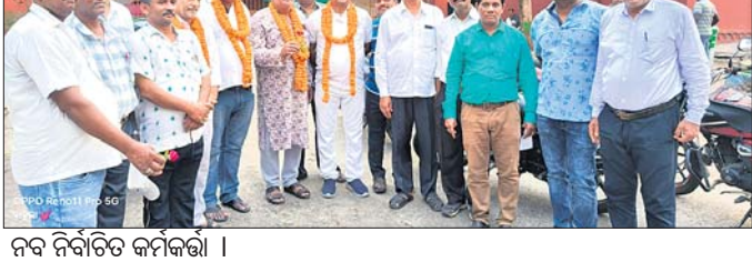
ନବ ନିର୍ବାଚିତ କର୍ମକର୍ତ୍ତା।