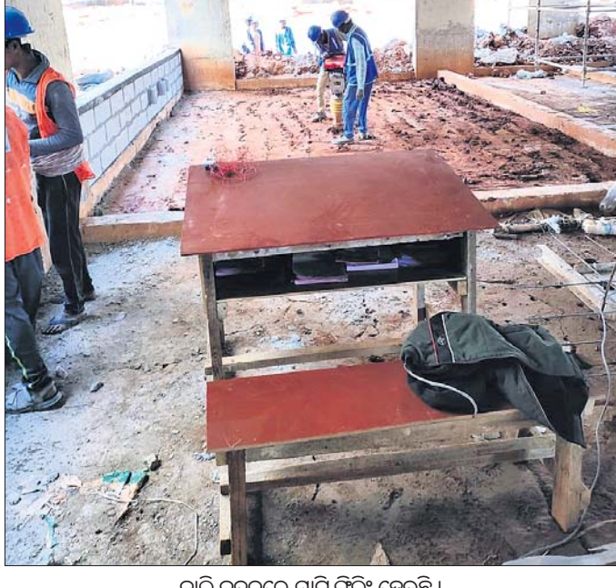
ବାଲି ବଦଳରେ ମାଟି ଫିଲିଂ ହେଉଛି।

ପୁଲବାଣୀ, ୩୦୩(ରାଜେଶ କୁମାର ରାଉତ) କନ୍ଧମାଳ ଜିଲ୍ଲାର ବହୁ ପ୍ରତୀକ୍ଷିତ ମେଡିକାଲ କଲେଜ ନିର୍ମାଣରେ ବ୍ୟାପକ ତୁଟି ପରିଲକ୍ଷିତ ହୋଇଛି। କେହି ତୁଟି କଲେ କାଲେ କିଏ ଧରିବ, ତାହାକୁ ନଜରରେ ରଖି ନିର୍ମାଣାଧୀନ ମେଡିକାଲ କଲେଜ ପରିସରକୁ କାହାରିକୁ ଛାଡ଼ିଯାଇନା। ଏପରିକି ଗଣମାଧ୍ୟମକୁ ମଧ୍ୟ ନିର୍ମାଣକାରୀ ସଂସ୍ଥା ଭିତରକୁ ଛାଡ଼ିନାହିଁ। କହିଲେ ଭୁଷ୍ଟା ଲରେଇ ମାରିବାକୁ ଧମକ ଦେଉଛନ୍ତି। ପୂର୍ବରୁ ମେଡିକାଲ ସମ୍ମୁଖରେ ଏଠାରେ ଫଟୋଗ୍ରାଫି ଏବଂ ଭିଡିଓ ରେକର୍ଡିଂ ମନା ବୋଲି ଏକ ବୋର୍ଡ ମାରିଥିଲେ। ଏ ନେଇ ଗଣମାଧ୍ୟମ ପ୍ରତିନିଧି ପୂର୍ଣ୍ଣ ବିଭାଗକୁ ଜଣାଇବାକୁ ସେହି ଲେଖାକୁ ତ ହଟେଇ ଦେଲେ, ହେଲେ ଭିତରକୁ ଛାଡ଼ିବାକୁ ମନା କଲେ। କହୁଛନ୍ତି, ଆମକୁ ପୁଷ୍ୟାୟତ୍ତା ମନା କରିଛନ୍ତି। କିନ୍ତୁ ଏ ନେଇ ସେମାନେ କୌଣସି ଲିଖିତ ନିର୍ଦ୍ଦେଶନାମା ଦେଖାଇ ପାରୁନାହାନ୍ତି। ମେଡିକାଲ କଲେଜର ନିର୍ମାଣ ଯେଉଁ ହିସାବରେ ହେବା କଥା ସେପରି ହେଉନାହିଁ। ନିର୍ମାଣାଧୀନ କୋଠାକୁ ବାଲିରେ ଫିଲିଂ କରିବାକୁ ଏମ୍ପ୍ଲୟିମେଣ୍ଟ ସ୍ୱାଧିକାରୀଙ୍କୁ ରହିଛି। ହେଲେ ବାଲି ବଦଳରେ ସେଠାରେ ମାଟି ପକାଯାଇ ସାହି ଦିଆଯାଉଛି। ଏହା ଧରାପଡ଼ିବ ବୋଲି ନିର୍ମାଣାଧୀନ ସଂସ୍ଥା ଗଣମାଧ୍ୟମକୁ ଭିତରକୁ ଛାଡ଼ିନାହିଁ। ସେହିପରି ଲିଖିତ ନିର୍ଦ୍ଦେଶନାମା ପ୍ରଦାନକାରୀ ଉକ୍ତ ଦିଆଯାଉନାହିଁ। ବାଲି