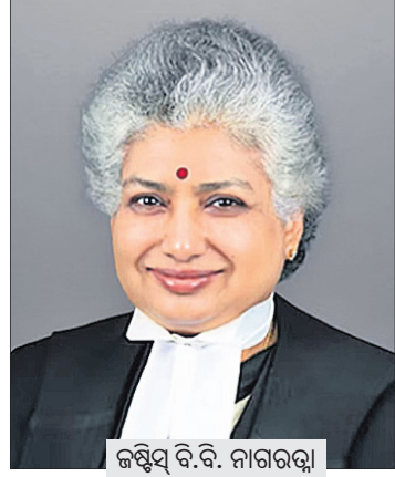
ଜଷ୍ଟିସ୍ ବି.ବି. ନାଗରଠା

କଳାଧର କୁଆଡ଼େ ଗଲା? ବିପୁତ୍ରାକରଣ ଲକ୍ଷ୍ୟ ହାସଲରେ ଆମେ କେଉଁଠି ବୋଲି ବିଚାରପତି ପ୍ରଶ୍ନ ଉଠାଇଛନ୍ତି।