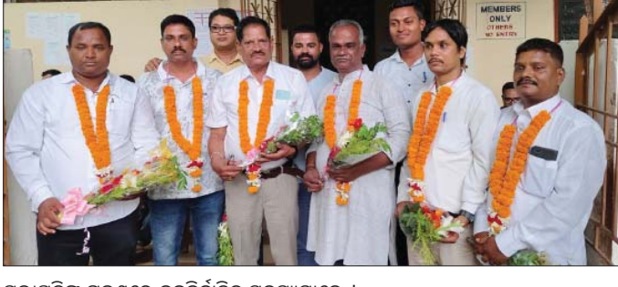
ସଭାପତିଙ୍କ ଗହଣରେ ନବନିର୍ବାଚିତ ସଦସ୍ୟମାନେ।