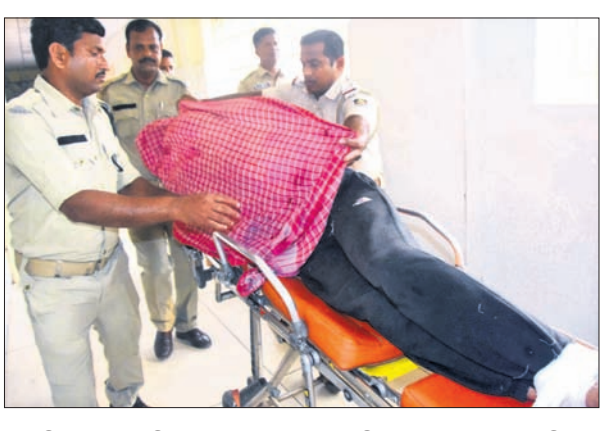
ଶ୍ରୀମନ୍ଦିରରେ ପଶି ବେହେରଣ ସ୍ୱାର ନିକଟ ପର୍ଯ୍ୟନ୍ତ ଯିବା ଓ ତାଙ୍କୁ ବାଟଣା କରିବାକୁ ସେବାୟତ ଓ ନିୟୋଜିତ ପୋଲିସକୁ ଆକ୍ରମଣ କରିଛନ୍ତି। ଏପରି ଘଟଣା ବାରମ୍ବାର ଘଟୁଥିବାରୁ ପୋଲିସର ସୁରକ୍ଷା ବ୍ୟବସ୍ଥା ପ୍ରତି ଅଜଳି ନିର୍ଦ୍ଦେଶ କରୁଛି।

ପୁରୀ ସହରରେ ଶନିବାର ଜଣେ ନିଶାସକ୍ତ ବିଦେଶୀ ନାଗରିକଙ୍କ କାର୍ଯ୍ୟକଳାପ ସମପ୍ରଭୁ ଚକିତ କରିଛି। କଡ଼ା ସୁରକ୍ଷା ବଳୟ ଭେଦକରି ଶ୍ରୀମନ୍ଦିର ଭିତରକୁ ଯାଇ ସୁରକ୍ଷାକର୍ମୀ ଓ ସେବାୟତଙ୍କ ସହ ହାତାହାତି ହୋଇଛନ୍ତି। ଗତ କିଛିଦିନ ତଳେ ବାଂଲାଦେଶର କେତେଜଣ ଅଣଦ୍ୱିଷ୍ଟ ମନ୍ଦିର ମଧ୍ୟରେ ପ୍ରବେଶ କରି ମହାପ୍ରଭୁଙ୍କ ଦର୍ଶନ କରିବା ସହ ମହାପ୍ରସାଦ ସେବନ କରିଥିଲେ। ଏପରି କି ଏହାର କିଛିଦିନ ପରେ ଜଣେ ବିଦେଶୀ ମହିଳା ଲକ୍ଷ୍ମଣ ଭକ୍ତ ଶ୍ରୀମନ୍ଦିରରେ ପ୍ରବେଶ କରିଥିଲେ। ହେଲେ ବାଜଣ ପାହାଚ ନିକଟରେ ସେବାୟତମାନେ ଉକ୍ତ ମହିଳା ଓ ତାଙ୍କର ଜଣେ ସହଯୋଗୀଙ୍କୁ ଅଟକ ରଖି ଶ୍ରୀମନ୍ଦିରକୁ ବାହାର କରିବା ସହ ପୋଲିସ ଜିମାରେ ଦେଇଥିଲେ। ଗୋଟିଏ ମାସରେ ଏହିଭଳି ଦୁଇଟି ଘଟଣା ଘଟିଥିବାବେଳେ ଶନିବାର ପୂର୍ବାହ୍ଣରେ ପୁଣି ଜଣେ ବିଦେଶୀ ନାଗରିକ ନିଶାସକ୍ତ ଅବସ୍ଥାରେ