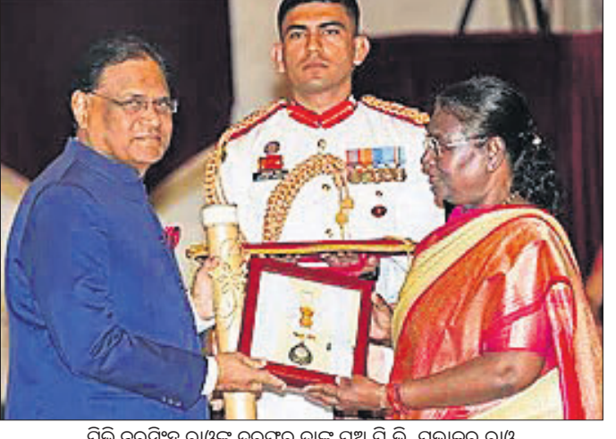
ପି.ଭି. ନରସିଂହ ରାଓଙ୍କ ଚରଣ ସିଂ, ପ୍ରଭାକର ରାଓ ରାଷ୍ଟ୍ରପତିଙ୍କଠାରୁ ଭାରତରତ୍ନ ପୁରସ୍କାର ଗ୍ରହଣ କରୁଛନ୍ତି। ୧୯୯୧ରୁ ୧୯୯୭ ପର୍ଯ୍ୟନ୍ତ ପ୍ରଧାନମନ୍ତ୍ରୀ ବ୍ୟାପକ ସଂସ୍କାର ଆଣିଥିଲେ। ଦକ୍ଷିଣ ଥିଲେ। ସେ ଦେଶର ଅର୍ଥନୀତିରେ ଭାରତରୁ ତଥା ନେହେରୁ-ଗାନ୍ଧୀ

ରାଷ୍ଟ୍ରପତି ଦ୍ରୌପଦୀ ମୁର୍ଦ୍ଦି ଶନିବାର ରାଷ୍ଟ୍ରପତି ଭବନରେ ପୂର୍ବତନ ପ୍ରଧାନମନ୍ତ୍ରୀ ପି.ଭି. ନରସିଂହ ରାଓ, ଚୌଧୁରୀ ଚରଣ ସିଂ, କୃଷିବିଜ୍ଞାନୀ ଏନ.ଏସ୍. ସ୍ୱାମୀନାଥନ ଏବଂ ପୂର୍ବତନ ବିହାର ମୁଖ୍ୟମନ୍ତ୍ରୀ କର୍ପୂରୀ ଠାକୁରଙ୍କୁ ମରଣୋତ୍ତର ଭାବେ ଦେଶର ସର୍ବୋଚ୍ଚ ବେଦାନ୍ତ ଶ୍ରୀମନ୍ତ୍ରୀ ଭାରତରତ୍ନରେ ସମ୍ମାନିତ କରିଛନ୍ତି। ସେମାନଙ୍କ ସମ୍ପର୍କୀୟମାନେ ରାଷ୍ଟ୍ରପତିଙ୍କଠାରୁ ପୁରସ୍କାର ଗ୍ରହଣ କରିଥିଲେ। ଏହି କାର୍ଯ୍ୟକ୍ରମରେ ଉପରାଷ୍ଟ୍ରପତି ଜଗଦୀସ୍ ଧନ୍ଦଙ୍କ, ପ୍ରଧାନମନ୍ତ୍ରୀ ନରେନ୍ଦ୍ର ମୋଦି ଓ ଅନ୍ୟ ମାନ୍ୟଗଣ୍ୟ ବ୍ୟକ୍ତିମାନେ ଉପସ୍ଥିତ ଥିଲେ। ଭାରତୀୟ ରାଜନୀତିରେ ଗଣ୍ୟ କୋର୍ଟ ଅନୁମତି ଦେଇଥିଲେ।