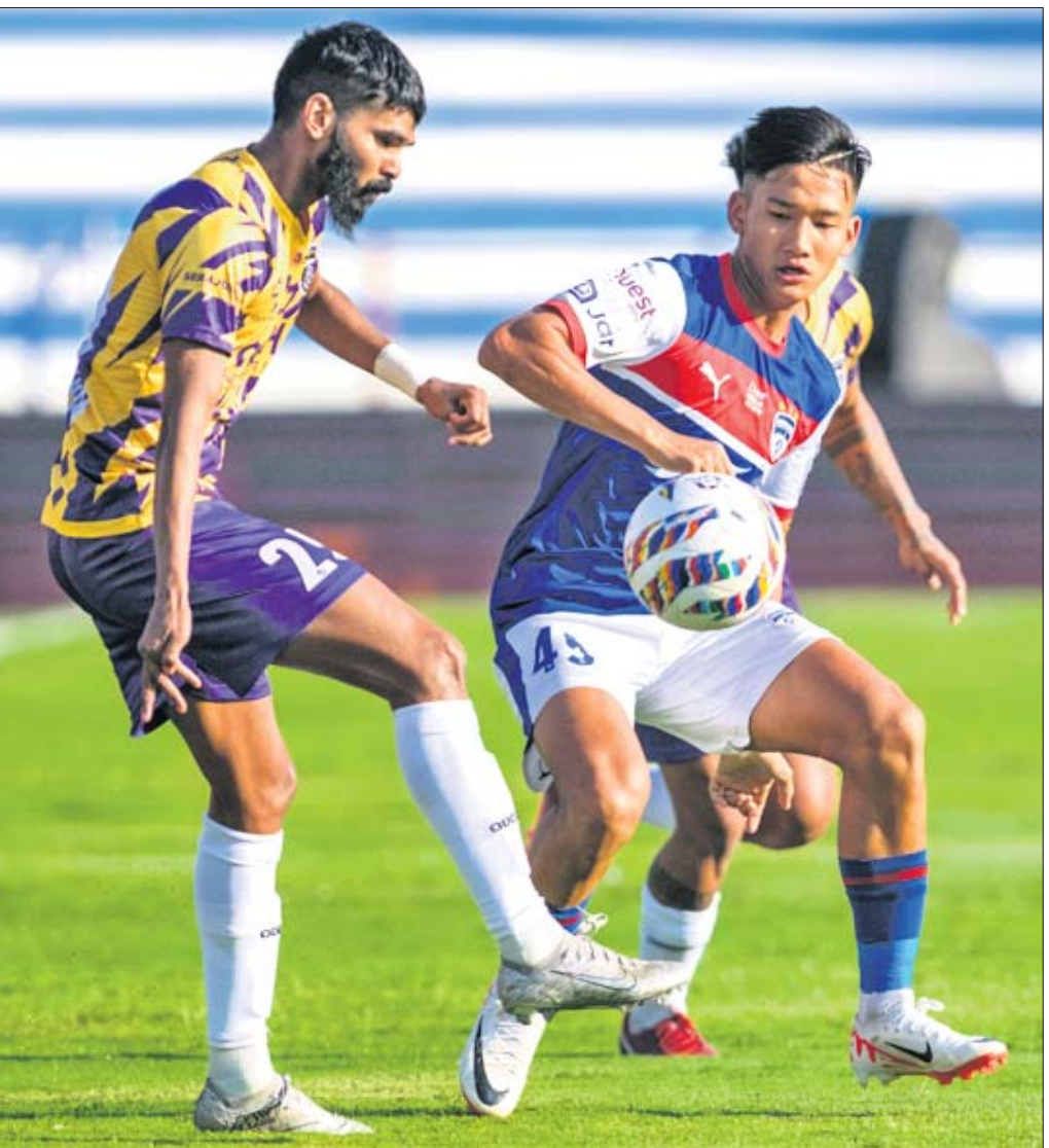
ଏଫ୍‌ସି ଓ ବେଙ୍ଗାଲୁରୁ ମଧ୍ୟରେ ଅନୁଷ୍ଠିତ ମ୍ୟାଚ୍‌ର ଏକ ସଂଘର୍ଷପୂର୍ଣ୍ଣ ମୁହୂର୍ତ୍ତ।