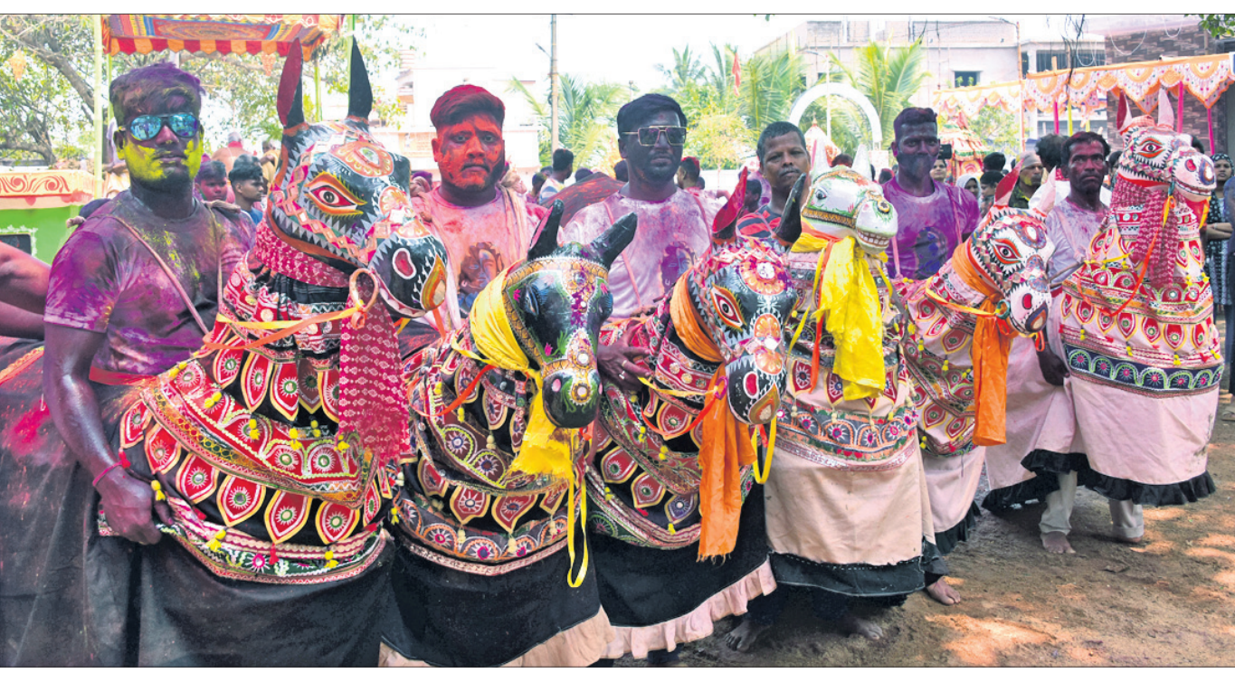
ଭୁବନେଶ୍ୱର ଉପକଣ୍ଠ ସଦନପୁରରେ ଶନିବାର ଶ୍ରୀବତ୍ସଶେଖର ଦେବ ପଞ୍ଚୁଦୋଳ ମେଳଣ ହରିହର ଭେଟରେ ସାମିଲ ହୋଇଥିବା ଯୋଡ଼ାନାଟ।

ପୂର୍ବରୁ ଅନେକଥର ଓଡ଼ିଶା ଆସିଛନ୍ତି। ମାତ୍ର ଏଥରର ଗଣ୍ଡ, ପ୍ରଦର୍ଶନ ସମ୍ପର୍କରେ କ’ଣ କହିବେ? ଯେତେବେଳେ ପ୍ରଦର୍ଶନ କଲେ ବି ଶ୍ରେଣୀଗାୟକ ପାଇଁ ସବୁବେଳେ ନୂଆ ଆଉ ବେଶ୍ ପ୍ରଦର୍ଶନ ପାଇଁ ପ୍ଲାନ ଥାଏ। ମୋ ଟିମ୍ ସହ ମିଶି ସଙ୍ଗ ଲିଷ୍ଟ ପ୍ରସ୍ତୁତ କରିଛି। ଓଡ଼ିଶା ମାଟିରେ ପହଞ୍ଚିଲେ ହିଁ ଜୟ ଜଗନ୍ନାଥ ପାଟିକୁ ବାଜାଉଥାଏ। ଏହି ମାଟି ହିଁ ସେମିତି, ଯେଉଁଠି ଆସିଲେ ରୁଣ୍ଡ ପିଲ୍ ହୁଏ। ଏଠି ସଙ୍ଗୀତ, ସଂସ୍କୃତି, କଳାର ଏକ ସ୍ୱତନ୍ତ୍ର ଚାହିଦା ସବୁବେଳେ ରହି ଆସିଛି। କ୍ୟାରିୟର ପାଇଁ ସଙ୍ଗୀତକୁ କାହିଁକି ବାଛିଲେ? ମୁଁ ଭଲ ଡାନ୍ସ ନୃତ୍ୟ ଓ ଗୀତ ପାଇଁ ଲାଭୁକ ଥିଲି। କେଉଁଠାକୁ ବାଛିବି କାଣ୍ଡାନ୍ତି ପାଉନ ଥିଲା। ବାପା କହିଲେ, ସେକେବେକେ ଜୀବନ ହିଁ ଜୀବିକା ଆଡ଼କୁ ଚାଲିନେଇଯାଏ। ତେଣୁ ହୃଦୟକୁ ଅନୁସରଣ କରିବା ଉଚିତ। ତା’ ପରେ ମୁଁ