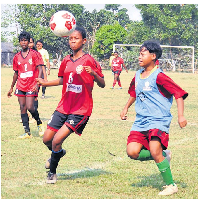
ବଲ୍ ପାଇଁ ଦୁଇ ଖେଳାଳିଙ୍କ ସଂଘର୍ଷ।