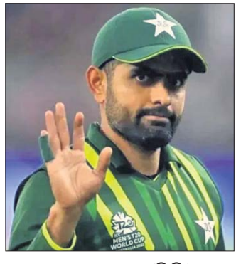
ଲାହୋର, ୩୦/୩ (ପି.ଟି.)