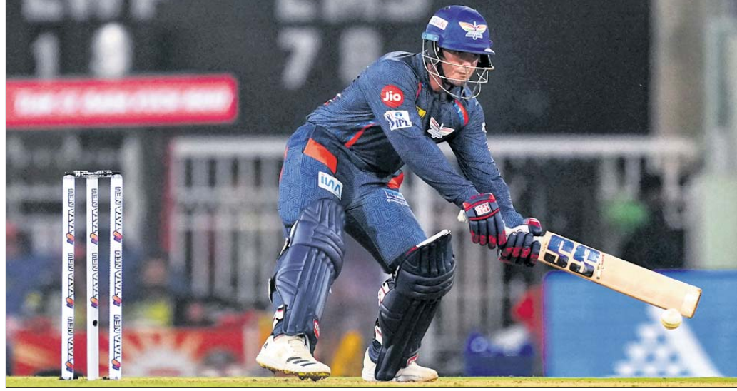
ଏକ ପ୍ୟାଟେଲ୍ ସୁଇଚ୍ ଷ୍ଟେଜୁଇଚ୍ କ୍ରିକେଟ୍ ଟିମ୍ କା।

ଲକ୍ଷ୍ମୀ, ୩୦ (ପି.ଟି.) ଇଣ୍ଡିଆନ୍ ପ୍ରିମିୟର ଲିଗ୍ ଟି-୨୦ ଟୁର୍ନାମେଣ୍ଟରେ ଶନିବାର ପଞ୍ଜାବ କିଙ୍ଗ୍ସ ବିପକ୍ଷରେ ବିଶାଳ ଷ୍ଟୋର କ୍ରିକେଟ୍ ଟିମ୍ ସୁପର ଜାଏଣ୍ଟ ଟିମ୍ ବିପକ୍ଷରେ ହରାଇ ୧୯୯ ରନ୍ କରିଥିଲା। ଆହତ ଥିବା କାରଣରୁ ଲୋକେଶ ରାହୁଲଙ୍କ ସ୍ଥାନରେ ନିକୋଲାସ ପୁରନ ଅଧିନାୟକ ଦାୟିତ୍ୱ ନେଇଥିଲେ। ରାହୁଲ ବ୍ୟାଟିଂ କରି ସାରିବା ପରେ ଡାକ୍ ସ୍ଥାନରେ ନବୀନ ଭଲ ହକ୍ ଜଣାନ୍ତୁ ଲେଉଟିଆ ଭାବରେ ଆସିଥିଲେ। ଦଳ ପକ୍ଷରୁ ଓପନର କ୍ଲିନିକ୍ ଡି କକ୍ ସର୍ବାଧିକ ୫୪ ରନ୍ କରିଥିଲେ। ଜବାବରେ ଖବର ପ୍ରସ୍ତୁତି ସୁଦ୍ଧା ପଞ୍ଜାବ ୯ ଓଭରରେ କୌଣସି ଉଇକେଟ ନ ହରାଇ ୯୦ ରନ୍ କରିଛି।