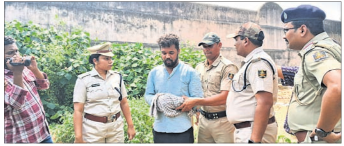
ଅଭିଯୁକ୍ତଙ୍କୁ ନେଇ ପୋଲିସ୍ ସିନ୍ ଡ୍ରାଏଣ୍ଟ କରିଥିଲା।