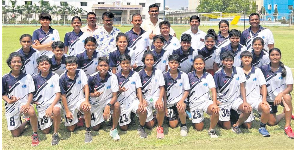
ସପୋର୍ଟ ଷ୍ଟାଫ୍ ସହ ନିତା ଫୁଟବଲ୍ ଏକାଡେମୀର ଖେଳାଳି।