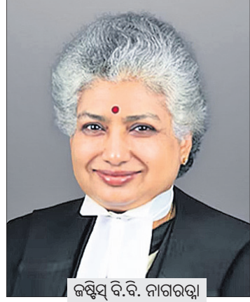
ଜଷ୍ଟିସ୍ ବି.ବି. ନାଗରଠା

୨୦୧୬ ନଭେମ୍ବର ୮ରେ କେନ୍ଦ୍ରର ମୋଦି ସରକାର ବିପ୍ଳବୀକରଣ ଘୋଷଣା କରିଥିଲେ। ଏହି ଘୋଷଣା ସହ ୫୦୦ ଓ ୧,୦୦୦ ଟଙ୍କା ନୋଟ୍ ଅଟକ ହୋଇଯାଇଥିଲା। ଏହାଦ୍ୱାରା ରାଜକୋଷକୁ କଳାଧନ ଫେରିଆଣିବ ବୋଲି ସେତେବେଳେ ସରକାର ଯୁକ୍ତି ବାଢ଼ିଥିଲେ। ଏହା ପରେ ବିପ୍ଳବୀକରଣ ପ୍ରକ୍ରିୟା ଯୋଗୁ ଭାରତୀୟ ରିଜର୍ଭ ବ୍ୟାଙ୍କ (ଆର୍ବିଆଇ)କୁ ୯୮% ପୁରୁଣା ନୋଟ୍ ଫେରିଥିବା କୁହାଯାଇଥିଲା। ଯଦି ଏତେ ପରିମାଣର ନୋଟ୍ ଅର୍ଥ ବ୍ୟବସ୍ଥାକୁ ଫେରିଛି, ତେବେ କଳାଧନ କୁଆଡ଼େ ଗଲା ବୋଲି ଶନିବାର ସୁପ୍ରିମକୋର୍ଟ ବିଚାରପତି ବି.ବି. ନାଗରଠା ପ୍ରଶ୍ନ କରିଛନ୍ତି। ସେତେବେଳେ କଳାଧନକୁ ଧଳା କରିବା ପାଇଁ ନୋଟ୍‌ବନ୍ଦୀ ଏକ ମାଧ୍ୟମ ଥିଲା ବୋଲି ସେ ମନେକରୁଥିବା ମଧ୍ୟ ଜଷ୍ଟିସ୍ ନାଗରଠା ପ୍ରକାଶ କରିଛନ୍ତି।