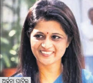
ରାଜ୍ୟ ସମ୍ପାଦକ ଅଛନ୍ତି ଶିବରାଜ ୨୦୦୪-୨୦୦୮ ଉପା ସରକାରରେ ସ୍ୱରାଷ୍ଟ୍ର ମନ୍ତ୍ରୀ ଥିଲେ। ସ୍ୱାଧୀନ ଏନପି ନବନୀତ ରାଜା ମଧ୍ୟ ନାଗପୁରରେ ଭାଜପାରେ ସାମିଲ ହୋଇଛନ୍ତି।