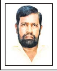
ଶେଖ୍ ମାଜୁର, ଗୋପ