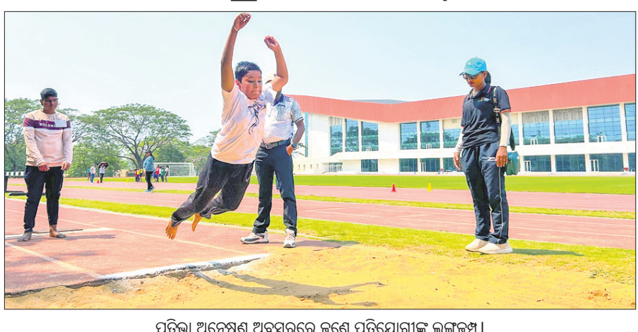
ପ୍ରତିଭା ଅଦ୍ୱେଷଣ ଅବସରରେ ଜଣେ ପ୍ରତିଯୋଗୀଙ୍କ ଲଗଜ୍‌କ୍ୟାମ୍।

କୁବନେଶ୍ୱର, ୩୪ (ତପନ ସ୍ୱାଇଁ): କ୍ରୀଡ଼ା ଓ ଯୁବସେବା ବିଭାଗ ଆନୁକୂଲ୍ୟରେ ରାଜ୍ୟର ବିଭିନ୍ନ ଜିଲାରେ ପ୍ରତିଭା ଅଦ୍ୱେଷଣ କାର୍ଯ୍ୟକ୍ରମ ଶେଷ ହୋଇଛି। ବିଭିନ୍ନ କ୍ରୀଡ଼ା ଇଭେଣ୍ଟ ପାଇଁ ମାର୍ଚ୍ଚ ୨୨ରେ ଆରମ୍ଭ ହୋଇଥିବା ଏହି କାର୍ଯ୍ୟକ୍ରମ ଏପ୍ରିଲ ୧ରେ ଶେଷ ହୋଇଛି। ୮ରୁ ୧୪ ବର୍ଷର ପ୍ରତିଭାକୁ ଏଥିରେ ଚିହ୍ନଟ କରାଯାଇଛି। କାର୍ଯ୍ୟକ୍ରମ ପାଇଁ ଆହାୟୀ ଆଥିଲେଟିକ୍ସ