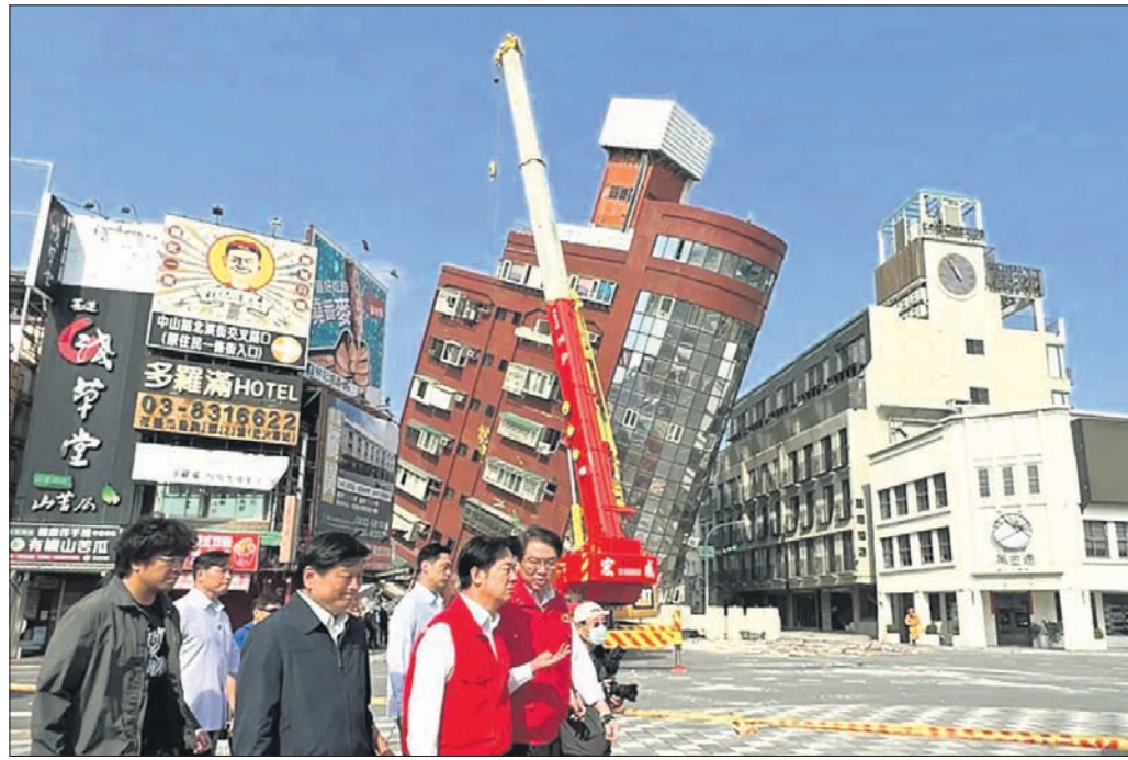
ଭୂକମ୍ପ ପରେ ତାଳଘାଟ ଉପରାଷ୍ଟ୍ରପତି ଲାଲକିଶୋର ଚେ ଏବଂ ଅନ୍ୟ ଅଧିକାରୀ ମାନେ ହୁଏଲିଏନ୍ ସହରର କ୍ଷତିଗ୍ରସ୍ତ ଅଞ୍ଚଳ ବୁଲି ଦେଖିଛନ୍ତି ।