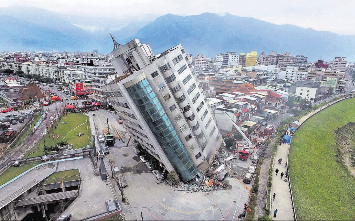
ତାଳଖାନାରେ ରୁଧିରା ହୋଇଥିବା ଭୁବନେଶ୍ୱର ନୂଆଦିଲ୍ଲୀ ଏକ ସ୍ଥିତି ଏକ ବହୁତକବିଶିଷ୍ଟ କୋଠା ଭଙ୍ଗ ପଡ଼ିଛି । (ରିପୋର୍ଟ ଓ ଅଧିକ ଫଟୋ: ପୃଷ୍ଠା-୧୦)

ବିଜେଡିର ବିଧାନସଭା ପ୍ରାର୍ଥୀ ତାଲିକା: ପୃଷ୍ଠା-୩