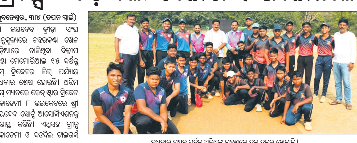
ରୁସୁଦାର ମ୍ୟାଚ ପୂର୍ବରୁ ଅତିଥିକ୍ ଗହଣରେ ରୁଜୁ ଦଳର ଖେଳାଳି।

କୁବନେଶ୍ୱର, ୩୪ (ତପନ ସ୍ୱାଇଁ): ଶ୍ରୀ ଜୟଦେବ କ୍ରୀଡ଼ା ସଂଘ ଆନୁକୂଲ୍ୟରେ ନହରକଣ୍ଠା ଖେଳ ପଡ଼ିଆରେ ଚାଲିଥିବା ଦିଲ୍ଲୀ ପ ଫୁଲ ମେମୋରିଆଲ୍ ୧୫ ବର୍ଷରୁ କମ୍ କ୍ରିକେଟର ଲିଗ୍ ପର୍ଯ୍ୟାୟରୁ ରୁସୁଦାର ଶେଷ ହୋଇଛି। ଅଭିମ ଲିଗ୍ ମ୍ୟାଚରେ ରେଡ୍ ସ୍କାର୍ କ୍ରିକେଟ ଏକାଡେମୀ ୮ ଉଇକେଟରେ ଶ୍ରୀ ଜୟଦେବ ଷ୍ଟାଡ଼ିଆ ଆସୋସିଏସନ୍‌କୁ ପରାସ୍ତ କରିଛି। ଏଥିସହ ଗ୍ରୀସ୍ ଏକାଡେମୀ ଓ ବଡ଼ବିଲ୍ ଟାଇଗର୍ସ ମଧ୍ୟରେ ଶୁକ୍ରବାର ଫାଇନାଲ ହେବା ସ୍ପଷ୍ଟ ହୋଇଯାଇଛି। ଗ୍ରୀସ୍ ଏବଂ ବଡ଼ବିଲ୍ ଟାଇଗର୍ସ ୨ ମ୍ୟାଚରୁ ୪ ପଏଣ୍ଟ ପାଇ ଟେବୁଲରେ ଶୀର୍ଷସ୍ଥାନ ଅଧିକାର କରିଥିବାବେଳେ ଗ୍ରୀସ୍ ବିରେ ଗତି ଯାକ ଦଳ ୨ ପଏଣ୍ଟ ଲେଖାଏ ପାଇଥିବାବେଳେ ବଡ଼ବିଲ୍ ଟାଇଗର୍ସ ଉନ୍ନତ ରନ୍ ହାରରେ ଫାଇନାଲରେ ପହଞ୍ଚିଛନ୍ତି। ଷ୍ଟାର୍ ଦଳ ଗ୍ରୀସ୍ ଏବଂ ବଡ଼ବିଲ୍ ଟାଇଗର୍ସ ଉଭୟରେ ରହି ବିଦାୟ ନେଇଛି। ଶ୍ରୀ ଜୟଦେବ ଷ୍ଟାଡ଼ିଆ ଆସୋସିଏସନ୍ ପ୍ରଥମେ ବ୍ୟାଟ୍ କରି