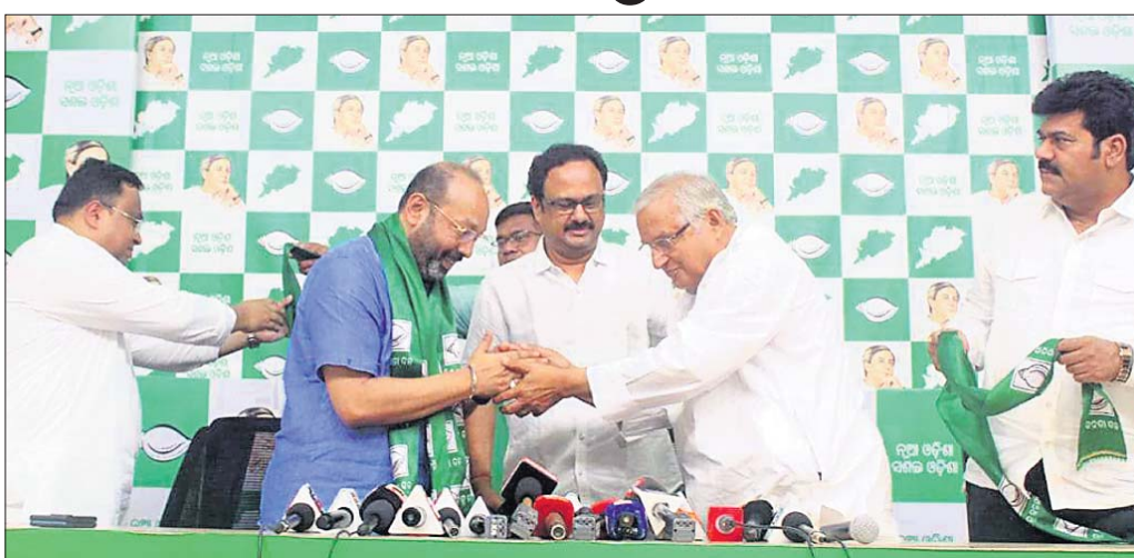
ଶଙ୍ଖ ଭବନରେ ବିଜେଡି ବରିଷ୍ଠ ନେତାଙ୍କ ଗହଣରେ ଭୃଗୁ ବକ୍ସିପାତ୍ର ।