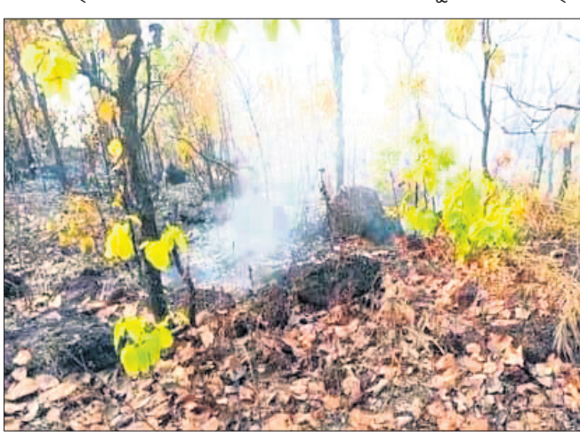
କରୁଥିବା ଜଙ୍ଗଲ ।