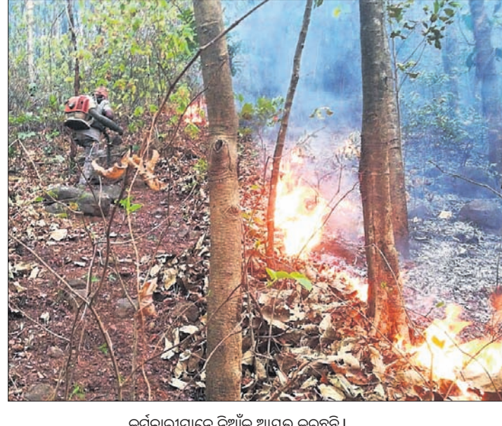
କର୍ମଚାରୀମାନେ ନିଆଁକୁ ଆୟତ୍ତ କରୁଛନ୍ତି ।

ଜୟପୁର, ୪୪ (ସବନ ପାଣିଗ୍ରାହୀ) ଜୟପୁର ବନାଞ୍ଚଳ ଅଧୀନରେ ଥିବା ବିଭିନ୍ନ ଜଙ୍ଗଲ ନିଆଁ ଲାଗିଛି । ତନ୍ମଧ୍ୟରେ, ଜବାକନାତି, ଘାଟବାଗରା, ଗଡ଼ପଦର ପାହାଡ଼ ଓ ମାଳିଗୁଡ଼ା ଜଙ୍ଗଲରେ ନିଆଁ ଲାଗିଛି । ଗଡ଼ପଦର ପାହାଡ଼ରେ ନିଆଁକୁ ଆୟତ୍ତ କରିବାକୁ ବନ ବିଭାଗକୁ ନାକେଦମ ହେବାକୁ ପଡ଼ିଛି । ଏହି ପାହାଡ଼ରେ ୮ ଜଣ ବନ କର୍ମଚାରୀ ନିଆଁକୁ ଆୟତ୍ତ କରିବାକୁ ଉଦ୍ୟମ କରୁଥିବା ବେଳେ ୩ଜଣ କର୍ମଚାରୀ ଅଚେତ ହୋଇଯାଇଥିଲେ । ଏହି ସମୟରେ ହାତୀର ପଦ ହେବାକୁ ନିଆଁ ଚାରିଆଡ଼େ ବ୍ୟାପି ଯାଇଥିଲା । କର୍ମଚାରୀମାନେ ନିଆଁ ମଝିରେ ରହି ଯାଇଥିଲେ । ଫଳରେ ନିଆଁ ଧୂଆଁରେ ରୁଦ୍ଧ ହୋଇ ପାରା ଓ ଫାୟର ସ୍କାଫୋଲ୍ଡର ୩ ଜଣ କର୍ମଚାରୀ ଅଚେତ ହୋଇ ଯାଇଥିଲେ । ରୁଚିକ ଦମକଳ ବାହିନୀ ଓ ଆତ୍ମଲୀନୁତ୍ୱ ଅନ୍ୟ କର୍ମଚାରୀମାନେ ଖବର ଦେଇଥିଲେ । ବହୁ କଷ୍ଟରେ ସେମାନଙ୍କୁ ଉଦ୍ଧାର କରାଯାଇ ଆତ୍ମଲୀନୁତ୍ୱ ଯୋଗେ ଜୟପୁରସ୍ଥିତ ଜିଲ୍ଲା ମୁଖ୍ୟ