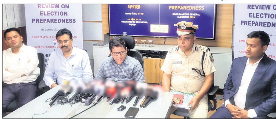
ଖବରଦାତା ସମ୍ମିଳନୀରେ ଅନ୍ୟମାନଙ୍କ ସହ ମୁଖ୍ୟ ନିର୍ବାଚନ ଅଧିକାରୀ ।