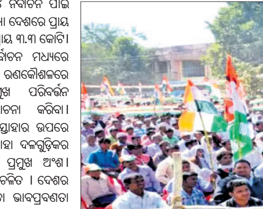
ମାଲକୋ (ନିର୍ବାଚନୀକ୍ଷେତ୍ର) ସ୍ତରରେ ମଧ୍ୟ ସର୍ବୋତ୍ତମ କରାଯାଉଛି।

ଗଣମାଧ୍ୟମର ଗୁରୁତ୍ୱ ବୃଦ୍ଧି। ଏବେ ପ୍ରତ୍ୟେକ ଦଳ, ପ୍ରଧାନମନ୍ତ୍ରୀ, ପୁଣ୍ୟମନ୍ତ୍ରୀ, ବିଧାୟକ, ସାଂସଦ ପ୍ରମୁଖ ସାମ୍ପ୍ରାମିକ ଗଣମାଧ୍ୟମର ବ୍ୟବହାର କରୁଛନ୍ତି। ଦଳଗୁଡ଼ିକରେ ଆଇ.ଟି. ସେଲ୍ ବା ସ୍ୱାଭିମତ୍ୟ ପ୍ରକାଶଣ ଖୋଲାଯାଇ ସାମ୍ପ୍ରାମିକ ଗଣମାଧ୍ୟମକୁ ବ୍ୟବହାର କରାଯାଉଛି। ଏକ୍ସ, ଫେସ୍‌ବୁକ୍, ସ୍ୱାସ୍ଥ୍ୟଆପ୍, ଇନ୍‌ଷ୍ଟାଗ୍ରାମ୍, ରିଲ୍ ଆଦି ସାମ୍ପ୍ରାମିକ ଗଣମାଧ୍ୟମର କେଉଁ ରାଜ୍ୟରେ ବା କେଉଁ ନିର୍ବାଚନୀକ୍ଷେତ୍ରରେ କିପରି ବ୍ୟବହାର କଲେ ଦଳକୁ ଅଧିକ ଲାଭ ମିଳିବ, ତାହା ଦଳଗୁଡ଼ିକର ପ୍ରମୁଖ ବିଦ୍ୟା ପ୍ରକାଶଣ ସ୍ଥିର କରୁଛନ୍ତି। ତେବେ ଏଥିରେ ଦୁଇଟି ସମସ୍ୟା ଅଛି। ପ୍ରଥମତଃ, ବିଷୟବସ୍ତୁ ଠିକ୍ ନ ଥିଲେ ଲୋକେ ପଢ଼ିବେ ନାହିଁ। ଏଥିପାଇଁ ସ୍ୱତନ୍ତ୍ର କଣ୍ଠେଟିଂ ରହିବା ଆବଶ୍ୟକ। ବିତାଡ଼ି ସମସ୍ୟା ହେଲା ନକାରାତ୍ମକ ମତ ଦେଉଥିବା ସଂକ୍ରମାଣକୁ ପ୍ରତିରୋଧ କରାଯାଏ। ଏଥିପାଇଁ ସ୍ୱତନ୍ତ୍ର କଣ୍ଠେଟିଂ ରହିବା ଆବଶ୍ୟକ। ସାମ୍ପ୍ରାମିକ ଗଣମାଧ୍ୟମର ପୁଣ୍ୟ ଅଧିକାରୀ ହେଲା ଏମାନେ ମିଛ କହି ଅଧିକାଂଶ ମତଦାତାକୁ ନିର୍ବାଚନ ବେଳେ ପ୍ରଭାବିତ କରନ୍ତି। କୃତ୍ରିମ ବୁଦ୍ଧିଗତୀର ବ୍ୟବହାର ପରିସ୍ଥିତିକୁ ଜିତିବା କଷ୍ଟ। ଜଣକ ବିରୁଦ୍ଧରେ ବା ଗୋଟିଏ ଦଳ ବିରୋଧରେ ପ୍ରଚାର କରିବାକୁ ଅଧିକ ସମୟ ଲାଗୁନାହିଁ। ତତ୍ପୂର୍ଣ୍ଣ ପରିବର୍ତ୍ତନ କ୍ଷେତ୍ର ହେଲା ନିର୍ବାଚନରେ କଳାକାରୀର ବହୁଳ ବ୍ୟବହାର। ୧୯୫୧-୫୨ ନିର୍ବାଚନରେ ଟଙ୍କା ଦେଇ ଭୋଟ କିଣାଯାଇ ନ ଥିଲା। ଏବେ ନିର୍ବାଚନରେ ଦଳଗୁଡ଼ିକ ମତଦାତାମାନଙ୍କୁ ଟଙ୍କା, ବସ୍ତୁ, ଭୋଜି, ସୁନାହଣ୍ଡା ଓ ମାଦକଦ୍ରବ୍ୟ ଆଦି ବଣ୍ଟନ କରିବା ଦେଖାଯାଉଛି। ଗତ ୫ଟି ବିଧାନସଭା ନିର୍ବାଚନରେ କେବଳ ନିର୍ବାଚନ କମିଶନ ପ୍ରାୟ ୧୭୦୦ କୋଟି ଟଙ୍କାର ନଗଦ ଆସନୀୟ ଲାଞ୍ଜ ସାମଗ୍ରୀ ଜବତ କରିଥିଲେ, ଯାହାକି ଦେଶର ସର୍ବାଧିକମ ରେକର୍ଡ ଥିଲା।