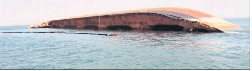
ପାରାଦ୍ୱୀପ ସମୁଦ୍ରରେ ଲୁଚିଯାଇ ଚାଲି ଯାଇଥିବା ଜାହାଜ ଚଳାଚଳ ମନ୍ତ୍ରଣାଳୟ ହାଇକୋର୍ଟରେ ହାଜର ହୋଇ ନିଜର ପକ୍ଷ ରଖିଛି ।

ସମୁଦ୍ରରେ ତେଲ ଭାସିଥିଲା । ହେଲେ ଜାହାଜକୁ ଲୁଚିଯାଇ ପାଇଁ କୌଣସି ବ୍ୟତ୍ୟାସ କରାଯାଇ ନ ଥିଲା । ଜାହାଜଟି ଏବେ ପାଣିରେ ସମ୍ପୂର୍ଣ୍ଣ ବୁଡ଼ିଯାଇଛି । ଜାହାଜଟି ଭାରତୀୟ ସମୁଦ୍ର ସୀମାରେ ବୁଡ଼ିଯାଇଥିବାରୁ ଦେଶର ଆଖ୍ୟାନ୍ତରୀଣ ସୁରକ୍ଷାକୁ ଦୃଷ୍ଟିରେ ରଖି ଉକ୍ତ ଜାହାଜ ସମ୍ପର୍କରେ ବିସ୍ତୃତ ତଥ୍ୟ ସଂଗ୍ରହ କରିବା ପାଇଁ ଏହି ଘଟଣାର ସିବିଆଇ ତଦନ୍ତ କରିବାକୁ ଭାରତ ସରକାରଙ୍କ ଜାହାଜ ମନ୍ତ୍ରଣାଳୟ ୨୦୧୮ରେ ନିଷ୍ପତ୍ତି ନେଇଥିଲା । ଏନେଇ ପାରାଦ୍ୱୀପ ପୋର୍ଟ ଟ୍ରଷ୍ଟ ପକ୍ଷରୁ ହାଇକୋର୍ଟକୁ ଅବଗତ କରାଯାଇଥିଲା । ସିବିଆଇ ପକ୍ଷରୁ ରାଜ୍ୟ ସରକାରଙ୍କୁ ୨୦୧୯ ନଭେମ୍ବରରେ ଚିଠି ଲେଖାଯାଇଥିଲା । କିଛି ମାସ ପରେ ଫୁନର୍ଗର ଆଉ ଏକ ଚିଠି ମଧ୍ୟ ଦିଆଯାଇଥିଲା । ହେଲେ ରାଜ୍ୟ ସରକାର ଏନେଇ କୌଣସି ଅନୁମତି ଦେଇ ନ ଥିଲେ । ଏପରି କି ଜାହାଜ ସମ୍ପର୍କରେ ଅଧିକ ଖୋଜତାଡ଼ କରିବାକୁ ରାଜ୍ୟ ସରକାର ତତ୍ପରତା ପ୍ରକାଶ କରି ନ ଥିଲେ । ରାଜ୍ୟ ସରକାର ଅନୁମତି ନ ଦେବା ଫଳରେ ସିବିଆଇ ତଦନ୍ତ ଆରମ୍ଭ ହୋଇପାରିନି ବୋଲି ସିବିଆଇ ପକ୍ଷରୁ ସତ୍ୟପାଠ ମାଧ୍ୟମରେ ଗତ ମାର୍ଚ୍ଚ ୧୯ ତାରିଖରେ ହାଇକୋର୍ଟକୁ ଅବଗତ କରାଯାଇଥିଲା । ଏହି ମାମଲାର ତଦନ୍ତ ଅନୁମତି ପାଇଁ ରାଜ୍ୟ ସରକାରଙ୍କୁ ରୁଜ୍ଜୁ ପର ଆନୁରୋଧ କରାଯାଇଥିଲେ ମଧ୍ୟ ରାଜ୍ୟ ସରକାର ଅନୁମତି ଦେଇନାହାନ୍ତି ବୋଲି ସିବିଆଇ ନିଜ ସତ୍ୟପାଠରେ ଦର୍ଶାଇଥିଲେ ।