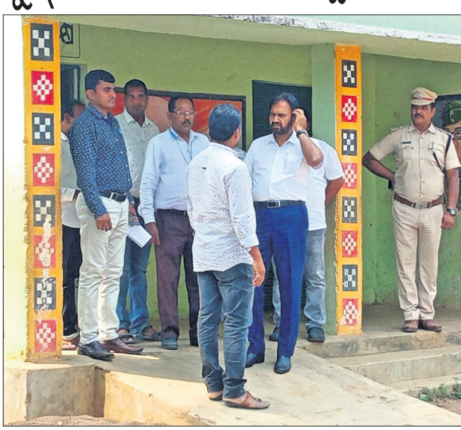
ଜିଲ୍ଲାପାଳ ଅଧିକାରୀଙ୍କ ସହ ଆଲୋଚନା କରୁଛନ୍ତି ।