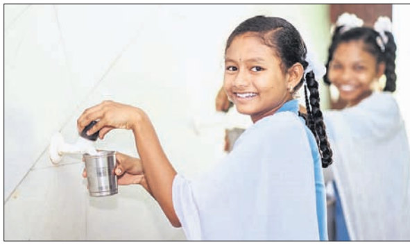
ତାପମାତ୍ରା ବୃଦ୍ଧି ପାଇଛି। ଗୁରୁବାର ଦିନ ତାପମାତ୍ରା ୪୧ ଡିଗ୍ରୀ ପାର୍ ସର୍ବୋଚ୍ଚ ତାପମାତ୍ରା ୪୨ ଡିଗ୍ରୀ ହୋଇଛି। ଆଗକୁ ମଧ୍ୟ ଆହୁରି ବୃଦ୍ଧି ବାଏ। ଏହାକୁ ଦୃଷ୍ଟିରେ ରଖି ରାଜସ୍ୱ

ରାଜ୍ୟର ସମସ୍ତ ବିଦ୍ୟାଳୟରେ 'ଜଳ ବିରତି ଘଣ୍ଟି' ବାଜିବ। ଏହି ସ୍ୱତନ୍ତ୍ର ଘଣ୍ଟି ଉଭୟ ଶିକ୍ଷୟିତ୍ରୀ, ଶିକ୍ଷକ ଏବଂ ଛାତ୍ରାଛାତ୍ରୀଙ୍କୁ ପାଣି ପିଇବାର ସମୟ ମନେପକାଇବେ। ଏବେ ସକାଳୁଆ ସ୍କୁଲ ଚାଲିଥିବାବେଳେ ସୈନିକ ଗୃହର ଜଳ ବିରତି ଘଣ୍ଟି ବାଜିବ। ଏଭଳି ଏକ ଅଭିନବ ପଦକ୍ଷେପ ନେଇ ବିଦ୍ୟାଳୟ ଓ ଗଣଶିକ୍ଷା ବିଭାଗ। ରାଜ୍ୟରେ ଦିନକୁ ଦିନ