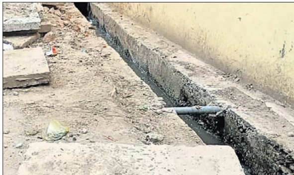
କଟକ ନୂଆବଜାର ମହିମାନଗରରେ ମୁକୁଳା ପଡ଼ିଥିବା ତ୍ରେନ୍।

■ ଅଧ୍ୟକ୍ଷ ଘରେ ଡରନ୍‌ଆ ଭାବେ ସ୍ଥାନ ପଡ଼ିଲା ■ ପକ୍ଷୋକ୍ଷୀର ପାଇଁ ସ୍ଥାନ ଖୋଲାଯାଇଥିଲା: ମେୟର