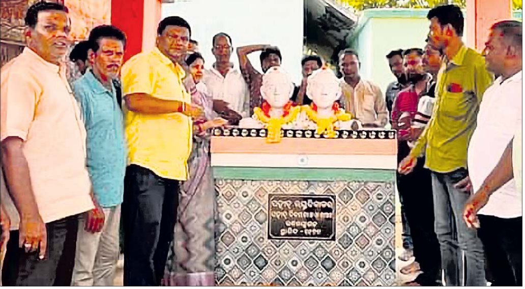
ରଘୁ ଦିବାକରଙ୍କ ପ୍ରତିମୂର୍ତ୍ତିରେ ଅତିଥିଙ୍କ ସହ ସ୍ଥାନୀୟ ଲୋକେ ଶ୍ରଦ୍ଧାଞ୍ଜଳି ଅର୍ପଣ କରୁଛନ୍ତି ।