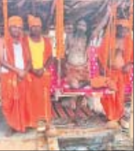
ଯଜ୍ଞସ୍ଥଳରେ ଷ୍ଟାଣ୍ଡିଂ ବାବା ।