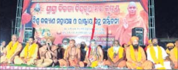
ବିରଜା ବିଶ୍ୱରୂପା ବିଶ୍ୱକଲ୍ୟାଣ ମହାଯଜ୍ଞରେ ସାମିଲ ହୋଇଥିବା ସାଧୁସାଧିକ ।