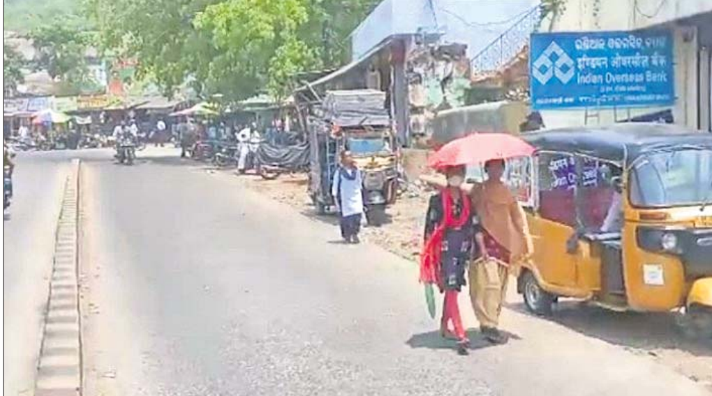
ପ୍ରବଳ ଖରା ଯୋଗୁ ବୁଲି ଯିବାକୁ ଲୋକମାନେ ସମସ୍ତ ଉପାୟ ଗ୍ରହଣ କରୁଛନ୍ତି ।

ପ୍ରଚଣ୍ଡ ରୌଦ୍ରତାପରେ ଜଳୁଛି ଗଜପତି ଜିଲ୍ଲା । ଗ୍ରୀଷ୍ମପ୍ରବାହ ସାଙ୍ଗକୁ ଗୁରୁଗୁଳିରେ ଅପ୍ରବଣ ହୋଇପଡ଼ିଛି ସାଧାରଣ ଜନଜୀବନ । ଗୁରୁବାର ସନ୍ଧ୍ୟା ମହକୁମା ପାରଳାଖେମୁଣ୍ଡିଠାରେ ଚାପମାତ୍ରା ୪୦ ଡିଗ୍ରୀରୁ ଅଧିକ ରହିଛି । ପ୍ରଚଣ୍ଡ ଖରା ଯୋଗୁ ନାହିଁ ନ ଥିବା ଅସୁବିଧାର ସମ୍ମୁଖୀନ ହେଉଛନ୍ତି ଲୋକେ । ଗଜପତି ଜିଲ୍ଲା ଏମିତି ଏକ ଭୌଗୋଳିକ ଦ୍ୱିତୀୟ ଅବସ୍ଥିତ, ଯାହାଦ୍ୱାରା ସମସ୍ତ ଋତୁର ପ୍ରଭାବ ଏଠି ସମାନ ଭାବରେ ପଡ଼େ ତେଣୁ ଏଠାରେ ପ୍ରତ୍ୟେକ ବର୍ଷ ପୃଷ୍ଠ ଫଗାଖରା ଅନୁଭୂତ ହୁଏ । ଗତ ଏକ ସପ୍ତାହ ଧରି ପାରଳାଖେମୁଣ୍ଡି ସହରର ଚାପମାତ୍ରା ୪୦ ଡିଗ୍ରୀ ଉପରେ ରହୁଛି । ଖରା ଚାଟିକୁ ରକ୍ଷା ପାଇବା ପାଇଁ କିଏ ମୁଣ୍ଡରେ ଚୋପି, ଚଷମା ପିନ୍ଧୁଛି ତ କିଏ ଛତା, ଓଦା କପଡ଼ା, ଚଷମା ବ୍ୟବହାର କରୁଛି ତ ଆଉ କିଏ ଆଖୁରସ, ଲସି, ତରଳୁକ ଖାଇ ଖରା ସାମ୍ନା କରୁଛନ୍ତି । ବେପାରୀଙ୍କ ପାଇଁ ଖରା ସେମାନଙ୍କ ବ୍ୟବସାୟକୁ ଦ୍ୱିଗୁଣିତ କରୁଥିବା ବ୍ୟବସାୟୀମାନେ କହିଛନ୍ତି । ଖରାରେ ଶ୍ରମିକମାନେ କାମ କରିବା ପାଇଁ ଯିବାକୁ ବାଧ୍ୟ