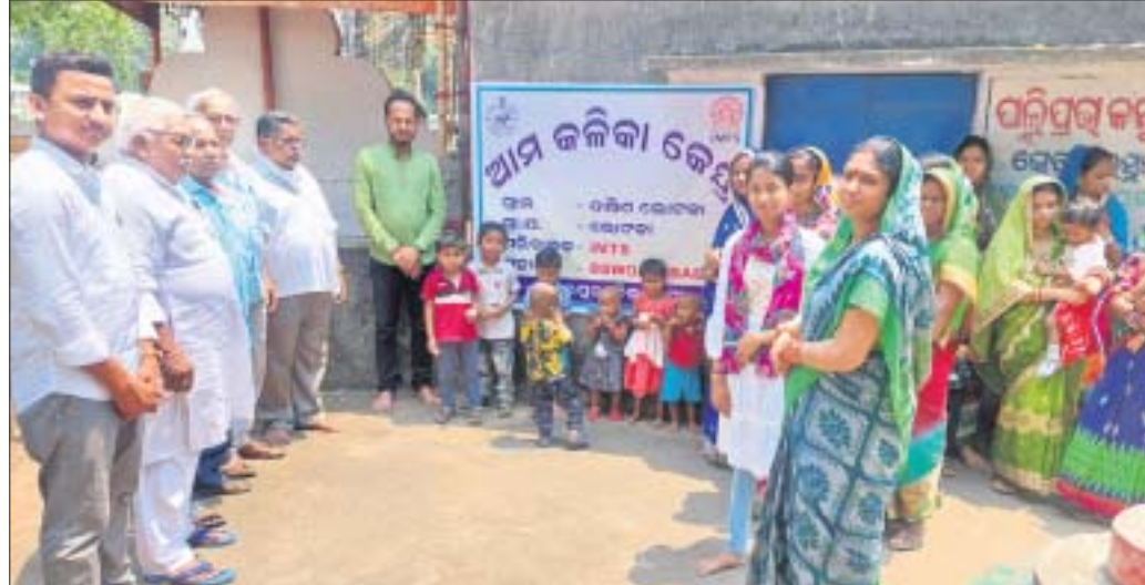
ଆମ କଳିକା କେନ୍ଦ୍ର ଉଦ୍ଘାଟନା ଉତ୍ସବରେ ଯୋଗଦେଇଥିବା ଅତିଥି ଓ ଅନ୍ୟମାନେ ।

ଶିଶୁମାନଙ୍କ ଶାରୀରିକ, ମାନସିକ, ଚୌରିକ ବିକାଶକୁ ଗୁରୁତ୍ୱ ଦିଆଯିବ