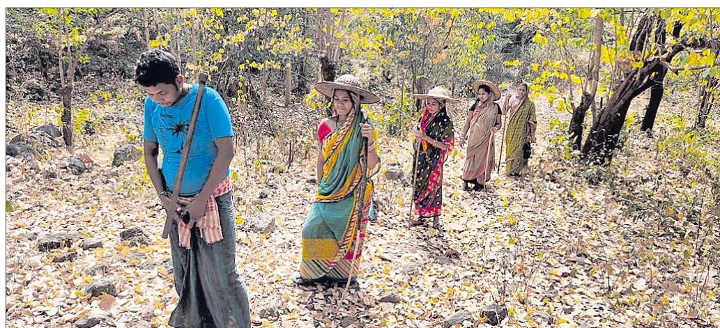
ଗ୍ରାମବାସୀ ଜଙ୍ଗଲକୁ ସୁରକ୍ଷା ଦେଉଛନ୍ତି ।

ଜଙ୍ଗଲ ସୁରକ୍ଷାକାରୀଙ୍କୁ ଘାରିଛି ନିଆଁ ଚିନ୍ତା । ଜଙ୍ଗଲରେ ନିଆଁ ନ ଲାଗିବା ପାଇଁ ନୟାଗଡ଼ ଜିଲ୍ଲା ଦଶପଲ୍ଲୀ ବ୍ଲକର ଆଦିବାସୀମାନେ ଗାଁରେ ଆରୁଆ ସଭା କରି ସଚେତନତା ସୃଷ୍ଟି କରିଛନ୍ତି । ପୁଣି ପାଳି କରି ଜଙ୍ଗଲ ସୁରକ୍ଷାକୁ କଡ଼ାକଡ଼ି କରିଛନ୍ତି । ସେହିପରି ଜଙ୍ଗଲର ବିଭିନ୍ନ ପଥରରେ ନିଆଁ ନ ଲାଗିବା ପାଇଁ ସଚେତନତା ବାର୍ତ୍ତା ଲେଖିଛନ୍ତି । ଏପରି କି ଗଛରୁ ପଡ଼ିଥିବା ପତରକୁ ପ୍ରାୟ ୫ ଫୁଟ ଲେଖାଏ ଓଲଟା ଫାୟାର ଲାଇନ୍ ସୃଷ୍ଟି କରିଛନ୍ତି । ଫାୟାର ଲାଇନ୍ ଦ୍ୱାରା ଜଙ୍ଗଲରେ ନିଆଁ ଯେପରି ନ ଲାଗିବ ସେଥିପାଇଁ ଆରୁଆ ପଦକ୍ଷେପ ନେଇଛନ୍ତି । ଆଦିବାସୀଙ୍କ ଏପରି ପଦକ୍ଷେପ ଯୋଗୁ ଚଳିତ ବର୍ଷ ନିଆଁ ଲାଗି ନାହିଁ । ତେବେ ଚଳିତ ବର୍ଷ ଯେପରି ଜଙ୍ଗଲରେ ନିଆଁ ନ ଲାଗିବ ସେଥିପାଇଁ ସବୁ ପ୍ରକାରର ବ୍ୟବସ୍ଥା କରିଛନ୍ତି ଆଦିବାସୀ । ଦଶପଲ୍ଲୀ ବ୍ଲକର ବାକ୍ସତଳା, ମଞ୍ଜାରୀ, ନିରୁକୁଳି, ଚାକରା, ଘୁରୁଡ଼ିପଡ଼ା, କଦଳୀବାରୀ ଆଦି ଆଦିବାସୀ ଅଧିଷ୍ଠିତ ଅଞ୍ଚଳରେ ଆଦିବାସୀମାନେ ୨୦୧୯ରୁ