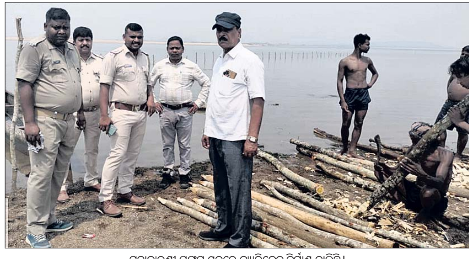
ମହାବାବୁଣୀ ସଙ୍ଗମ ସ୍ଥଳରେ ବ୍ୟାରିକେଡ଼ ନିର୍ମାଣ ଚାଲିଛି।

ଖଣ୍ଡପଡ଼ା, ୪୪ (ଅକ୍ଷୟ କୁମାର ମହାରଣା) ଦୀର୍ଘ ୬ ବର୍ଷର ପ୍ରତୀକ୍ଷା ପରେ ଆସନ୍ତା ୬ ମଇ ଖଣ୍ଡପଡ଼ା ପଞ୍ଜିକା ଅନୁସାରେ ଶ୍ରୀନାଳମଧ୍ୟାଧିକ ପାଠରେ ହେବ ମହାବାବୁଣୀ ବୁଡ଼। ଏହି ଅଭିଯାନ ଯୋଗ ଲାଗୁ ନିର୍ଦ୍ଦିଷ୍ଟ ଅନୁସାରେ ଆସନ୍ତା ଶନିବାର ଶତଭିକ୍ଷା ନକ୍ଷତ୍ର ଚିତ୍ରେ ମାସ କୃଷ୍ଣପକ୍ଷ ବାଦଶା ଦିପ୍ତରେ ଜଗନ୍ନାଥ ସଂସ୍କୃତିର ଆଦିପୀଠ ତିରସ୍ରୋତା ଚିତ୍ରୋପକା ମହାନଦୀ କମଳେ ସଙ୍ଗମସ୍ଥଳରେ ଅନୁଷ୍ଠିତ ହେବ। ଏହି ବୁଡ଼ରେ ରାଜ୍ୟ ତଥା ରାଜ୍ୟ ବାହାରୁ ଲକ୍ଷାଧିକ ଶ୍ରଦ୍ଧାଳୁଙ୍କ ସମାଗମ ହେବ ବୋଲି ପ୍ରଶାସନ ପକ୍ଷରୁ ଆକଳନ କରାଯାଇଛି। ଏ ସମୟରେ ପିତୃ ପୁରୁଷଙ୍କ ଅନ୍ତି ବିଦର୍ଭନ ଓ ପିଣ୍ଡଦାନ କର୍ମ କରାଯିବାର ନୀତି ରହିଛି। ଏହି ଅବସରରେ ବୁଡ଼ସ୍ଥଳରେ ଶ୍ରଦ୍ଧାଳୁଙ୍କ ଶୁଖିଳିତ ସ୍ନାନ ନିମନ୍ତେ ମୁହକାଳୀନ ଭିତ୍ତିରେ ମହାନଦୀରେ ବାରିକେଡ଼ ନିର୍ମାଣ କାର୍ଯ୍ୟ ଚାଲିଛି। ଏଥିପାଇଁ ଖଣ୍ଡପଡ଼ା ଦେବୋତ୍ତର ବିଭାଗ ତତ୍ତ୍ୱାବଧାନରେ ଓ ନୟାଗଡ଼ ଜିଲ୍ଲା ପ୍ରଶାସନ ତଥା ଜିଲ୍ଲାପାଳ ସ୍ୱାଧେବ୍ୟ ବିଏସ୍ ନିର୍ଦ୍ଦେଶ କ୍ରମେ ପୂର୍ବ ବିଭାଗ, ଜଳ ସମ୍ପଦ ବିଭାଗ, ଜଳ ସମ୍ପଦ ବିଭାଗ, ପାନୀୟ ଜଳ ଯୋଗାଣ ଓ ପରିମଳ ବିଭାଗ, ପୋଲିସ ବିଭାଗ, ଅଗ୍ନିଶମ ବିଭାଗ, ବିଦ୍ୟୁତ ବିଭାଗ ଓ ସୂଚନା ଓ ଲୋକ ସମ୍ପର୍କ ବିଭାଗଙ୍କ ସହଯୋଗ କ୍ରମେ ବିଭିନ୍ନ ପଦକ୍ଷେପମାନ ଗ୍ରହଣ କରାଯାଇଛି। ମହାନଦୀର ଗଭୀର ପାଣିକୁ ନ ଯିବା ପାଇଁ ତଥା ସୁରକ୍ଷିତ ସ୍ନାନ ପାଇଁ ବାରିକେଡ଼ ନିର୍ମାଣ ଚାଲିଛି। ପୋଲିସ ପ୍ରଶାସନ ଓ ନାଳମଧ୍ୟ ମହାବିଦ୍ୟାଳୟ ପକ୍ଷରୁ ୫୦ ଜଣ ସେଲୋସ୍ତେସୀଙ୍କୁ ଦାୟିତ୍ୱ ଦିଆଯାଇଛି। ଏହି ଅବସରରେ ଖଣ୍ଡପଡ଼ା ଦେବୋତ୍ତର କାର୍ଯ୍ୟ ନିର୍ବାହୀ ଅଧିକାରୀ ତଥା ତତ୍ତ୍ୱାବଧାନ ଯୋଗେଇ ନାଏକ, ଜଳ ସମ୍ପଦ ବିଭାଗ ସହକାରୀ ଯନ୍ତ୍ରୀ ଇ. ମୋହନ ବେହେରା, ପୂର୍ବ ବିଭାଗ ସହକାରୀ ଯନ୍ତ୍ରୀ ଇ. ରାଧେଶ୍ୟାମ କାଲୋ, ଦେବୋତ୍ତର ମ୍ୟାନେଜର ହରିହର ଦାଶ, କର୍ମିକାଳୀ ପାଣି ଅଧିକାରୀ ରମେଶ ଚନ୍ଦ୍ର ଜେନା, ସହଯୋଗୀ ସତ୍ୟେଶ କୁମାର ବେହେରାଙ୍କ ସମେତ ବିଭାଗୀୟ କର୍ମଚାରୀ ମାନେ ପ୍ରତ୍ୟେକ ସ୍ନାନ ସ୍ଥଳରେ ଉପସ୍ଥିତ ରହି କାର୍ଯ୍ୟର ସମାପ୍ତ କରୁଛନ୍ତି।