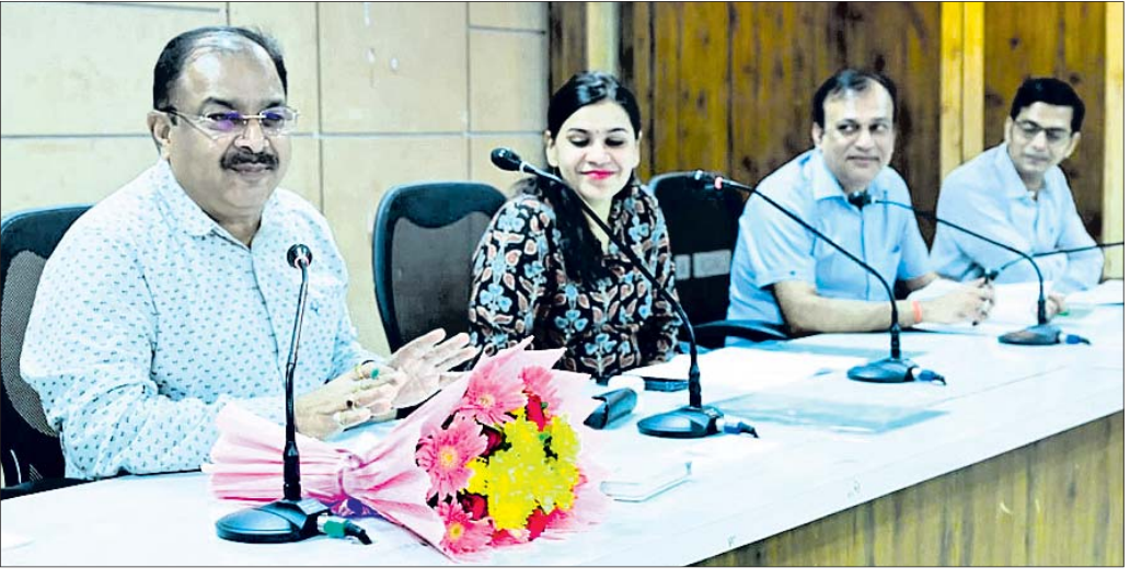
ସମୀକ୍ଷା ବୈଠକରେ ଆରଡିସି, ଜିଲ୍ଲାପାଳ ଓ ଅନ୍ୟମାନେ ।