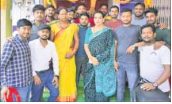
ଶୋ'ରୁମ ଉଦ୍ଘାଟନା କାର୍ଯ୍ୟକ୍ରମରେ ଯୋଗଦେଇଥିବା ଅତିଥି ଓ ଅନ୍ୟମାନେ ।