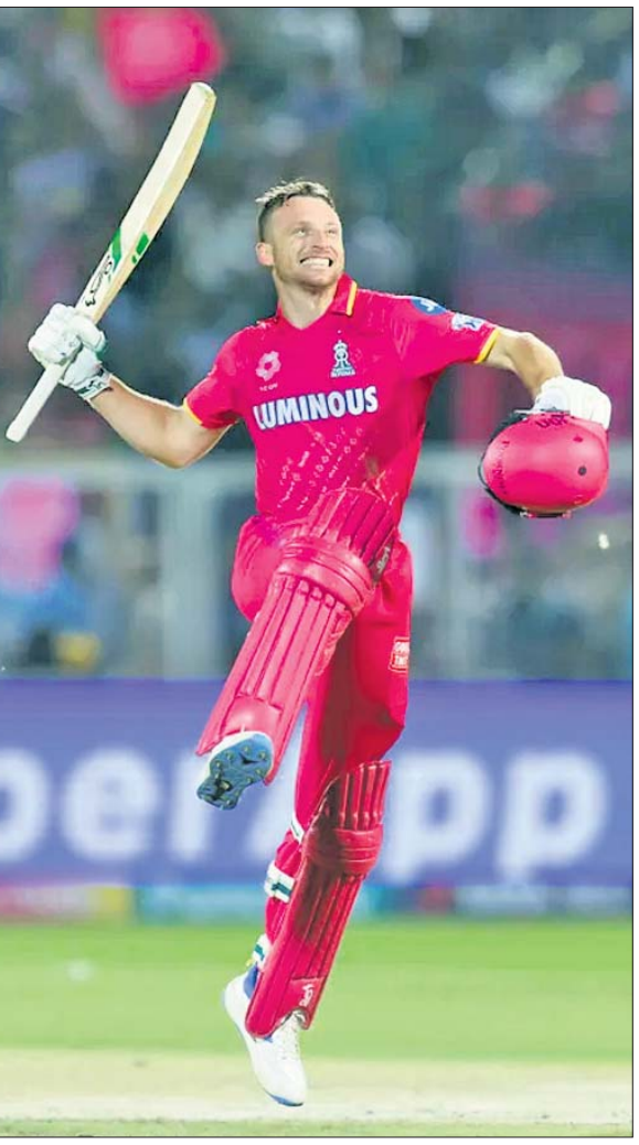
ଶତକ ହାସଲ ପରେ ଉଲ୍ଲାସିତ ରାଜସ୍ଥାନ ବଟଲର ।

ଇଣ୍ଡିଆନ୍ ପ୍ରିମିୟର ଲିଗ୍ (ଆଇପିଏଲ୍) ୧୨୦ କ୍ରିକେଟ ଟୁର୍ନାମେଣ୍ଟରେ ବିରାଟ କୋହଲି ଅଷ୍ଟମ ଶତକ ସତ୍ତ୍ୱେ ପରାଜିତ ହୋଇଛି ରୟାଲ ଚ୍ୟାଲେଞ୍ଜର୍ସ ବେଙ୍ଗାଳୁରୁ (ଆରସିବି) । ଶତକାୟ ମ୍ୟାଚରେ କୋଶି ବଟଲରଙ୍କ ୧୦୦* ରନ ବଳରେ ରାଜସ୍ଥାନ ରୟାଲ୍ ୬ ଉଇକେଟରେ ବିଜୟୀ ହୋଇଛି । ଶନିବାର କୋହଲିଙ୍କ ୧୧୩* ରନ ବଳରେ ଆରସିବି ୩ ଉଇକେଟରେ ୧୮୩ ରନ କରିଥିଲା । ଜବାବରେ ରାଜସ୍ଥାନ ୧୯.୧ ଓଭରରେ ୪ ଉଇକେଟ ହରାଇ ୧୮୯ ରନ କରିଥିଲା । କ୍ରମାଗତ ଚତୁର୍ଥ ମ୍ୟାଚ୍ ଜିତି ପଏଣ୍ଟ ଟେବୁଲ୍ ଶୀର୍ଷରେ ପହଞ୍ଚିଛନ୍ତି ରାଜସ୍ଥାନ । ଏହା ସହିତ ରାଜସ୍ଥାନ ଅଧିନାୟକ ସଞ୍ଜୁ ସାମସନ୍