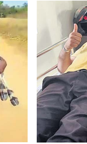
ଅବସ୍ଥାରେ ପଡ଼ିଥିବା ଯେକୌଣସି ରୋଗୀର ହଠାତ୍ ରକ୍ତ ଅବଶ୍ୟକ ହେଲେ ସେ ବୁରୁଡ଼ ସାହାଯ୍ୟ ପାଇଁ ପହଞ୍ଚିଥାନ୍ତି। ସେ ବ୍ରହ୍ମପୁରରେ ଥିବା ଅଗ୍ରଣୀ ସ୍ୱେଚ୍ଛାସେବୀ ସଂଗଠନ ସଭୁଜ ବାହିନୀର ସଭାପତି। ସେ କୁହନ୍ତି, 'ପ୍ରାୟ ୧୦ ବର୍ଷ ତଳେ ଘଟଣା। ତା'ଙ୍କ ଦେହ ଅସୁସ୍ଥ ଥିବାରୁ ରକ୍ତ ଆବଶ୍ୟକ ହୋଇଥିଲା। ନିଜେ ମା'ଙ୍କୁ ରକ୍ତ ଦେବାପରେ ସେ ଯେତେବେଳେ ହୋଇଥିଲେ ମନରେ ଯେଉଁ ଆନନ୍ଦ ଥିଲା, ତାହା ଭାଷାରେ ପ୍ରକାଶ

ହୋଇଥିବା ଖବରପାଇଲେ ସେ ବୁରୁଡ଼ ସେଠାରେ ପହଞ୍ଚି ତା'ର ସେବା ଶୁଣୁଥିବାର ଲାଗି ପଢ଼ନ୍ତି। ସମ୍ପୂର୍ଣ୍ଣ ସ୍ତମ୍ଭ ନ ହେବା ପର୍ଯ୍ୟନ୍ତ ସେବା ଓ ଚିକିତ୍ସା କରିଥାନ୍ତି। ଏଭଳି ଅସହାୟ ଗୋରୁଗାଈଙ୍କ ସେବା ପାଇଁ ସହଯୋଗୀମାନଙ୍କୁ ନେଇ ସେ ପୁରୁସାହିଠାରେ ଶ୍ରୀକୃଷ୍ଣ ଗୋ ସେବା କେନ୍ଦ୍ରଟିଏ ଗଠନ କରିଛନ୍ତି। ବର୍ତ୍ତମାନ ବିଶ୍ୱକର୍ମୀ ଏବଂ ସହ ଜଡ଼ିତ ରହି ଅନେକ