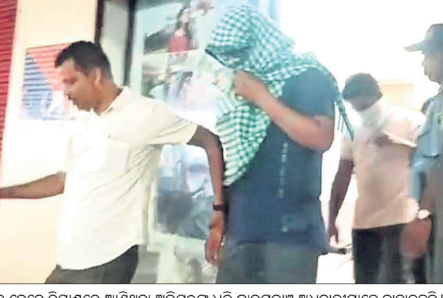
ଦେଈନାଳ ବ୍ୟାଙ୍କରେ ଠକେଇ ଘଟଣାରେ ଅପମୂଲ୍ୟ ଧରି କ୍ରୀତମତ୍ରାଞ୍ଚ ଅଧିକାରୀମାନେ ବାହାକୁଛନ୍ତି ।

ଆଇସିଆଇସିଆଇ ବ୍ୟାଙ୍କ ଦେଈନାଳ ଶାଖାରେ ଠକେଇ ଘଟଣାରେ ଅପମୂଲ୍ୟ ଧରି କ୍ରୀତମତ୍ରାଞ୍ଚ ଅଧିକାରୀମାନେ ବାହାକୁଛନ୍ତି ।