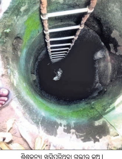
ଶିଶୁକନ୍ୟା ଖସିପଡ଼ିଥିବା ଗଭୀର କୂଅ ।

ଦେଈନାଳ ପୌରାଞ୍ଚଳ ୨୨୩ ଏକ୍ସଟେନ୍ସନ ଆକ୍ରମଣରେ ଶନିବାର ଅଞ୍ଚଳରେ ଘଟଣା ଘଟିଥିଲା । ୧୯ ବର୍ଷର କୂଅରେ ପଡ଼ି ପ୍ରାଣ ହରାଇଛନ୍ତି । ଶିଶୁକନ୍ୟାଟି କୂଅରେ ପଡ଼ିବା ପରେ ଖବରପାଇ ଅଗ୍ନିଶମ କର୍ମଚାରୀ ଘଟଣାସ୍ଥଳରେ ପହଞ୍ଚି ସ୍ଥାନୀୟ ଲୋକଙ୍କ ସହାୟତାରେ ଶିଶୁ କନ୍ୟାକୁ ଉଦ୍ଧାର କରି ଜିଲ୍ଲା ପିଆଇଏସ୍ ପଠାଇଥିଲେ । ସେଠାରେ ତାହାକୁ ମୃତ୍ୟୁର ଶିଶୁକନ୍ୟାକୁ