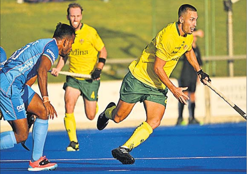
ଭାରତ ଓ ଅଷ୍ଟ୍ରେଲିଆ ମ୍ୟାଚର ଏକ ସଂଘର୍ଷପୂର୍ଣ୍ଣ ମୁହୂର୍ତ୍ତ।