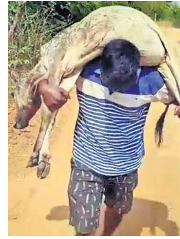
ହୋଇଥିବା ଖବରପାଇଲେ ସେ ବୁରୁଡ଼ ସେଠାରେ ପହଞ୍ଚି ତା'ର ସେବା ଶୁଣୁଥିବାର ଲାଗି ପଢ଼ନ୍ତି। ସମ୍ପୂର୍ଣ୍ଣ ସ୍ତମ୍ଭ ନ ହେବା ପର୍ଯ୍ୟନ୍ତ ସେବା ଓ ଚିକିତ୍ସା କରିଥାନ୍ତି। ଏଭଳି ଅସହାୟ ଗୋରୁଗାଈଙ୍କ ସେବା ପାଇଁ ସହଯୋଗୀମାନଙ୍କୁ ନେଇ ସେ ପୁରୁସାହିଠାରେ ଶ୍ରୀକୃଷ୍ଣ ଗୋ ସେବା କେନ୍ଦ୍ରଟିଏ ଗଠନ କରିଛନ୍ତି। ବର୍ତ୍ତମାନ ବିଶ୍ୱକର୍ମୀ ଏବଂ ସହ ଜଡ଼ିତ ରହି ଅନେକ

କରିଛନ୍ତି ମା'ବାପା ସେବାଶ୍ରମ। ଏଠାରେ ୪୯ଜଣ ବୃଦ୍ଧାବୁଦ୍ଧ ରହୁଛନ୍ତି। ବର୍ତ୍ତମାନ ନିଜ ମାତାପିତାଙ୍କ ଭଳି ସେ ତାଙ୍କ ସେବା କରୁଛନ୍ତି। ଗୌତମ ପେସାରେ ଜଣେ କାଠିମିସ୍ତ୍ରୀ। ଏଥିରୁ ଯାହା ରୋଜଗାର କରନ୍ତି, ତାହାର ୫୦% ସେ ବୃଦ୍ଧାଶ୍ରମ ଏବଂ ସମାଜସେବାର ଖର୍ଚ୍ଚ କରନ୍ତି। ଦୀର୍ଘ ୫ବର୍ଷ ହେବ ନିଜସ୍ୱ ଉଦ୍ୟମରେ ସେ ଏହି ବୃଦ୍ଧାଶ୍ରମ ଚଳାଇଥିବା ବେଳେ ବର୍ତ୍ତମାନ ଅନ୍ୟମାନେ ମଧ୍ୟ ତାଙ୍କୁ ସାହାଯ୍ୟର ହାତ ବଢ଼ାଇଛନ୍ତି। ଏତଦ୍‌ବ୍ୟତୀତ ସେ ଆରାଧିତର ଜଣେ ଯୁବ ସାମାଜିକ କର୍ମୀ। ଅସହାୟ ଗୋରୁଗାଈଙ୍କ ସେବା, ଚୋକୋଲେଟ୍ ଅସହାୟ ଲୋକଙ୍କୁ ଚିକିତ୍ସା, ଆର୍ଥିକ ସହଯୋଗଠାରୁ ଆରମ୍ଭ କରି ଦୁର୍ଭିକ୍ଷ ଶ୍ରେଣୀର ପିଲାଙ୍କୁ ପାଠପଢ଼ା ତଥା ଅଭାବୀ ପରିବାରର ଝିଅ ବାହାଘରରେ ଆର୍ଥିକ ସହଯୋଗ କରନ୍ତି। ଏଥିସହ ସେ ଜଣେ ରକ୍ତଦାନୀ ଭାବେ ନିୟମିତ ରକ୍ତଦାନ, ପରିବେଶ ସୁରକ୍ଷା ଦିଗରେ ତାଙ୍କ କାର୍ଯ୍ୟ ବେଶ ପ୍ରଶଂସନୀୟ। ସେ ନିଖୁଣ ଭଲ୍‌କି ବିଶ୍ୱକର୍ମୀ ଏବଂ ସହ ଜଡ଼ିତ ରହି ଅନେକ