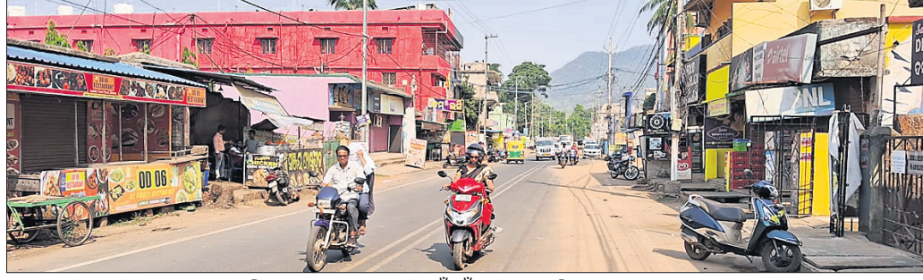
ଦେଈନାଳ ସହରରେ ତାପମାତ୍ରା ବୃଦ୍ଧି ପାଇଥିବା ବେଳେ ରାସ୍ତା ଖାଁ ଖାଁ ହୋଇଯାଇଛି ।