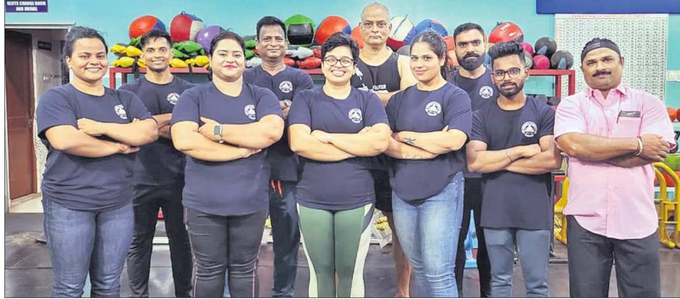
କର୍ମଚାରୀଙ୍କ ସହଯୋଗରେ ଓଡ଼ିଶା ଶକ୍ତି ଉତ୍ତୋଳନ ଦଳ।