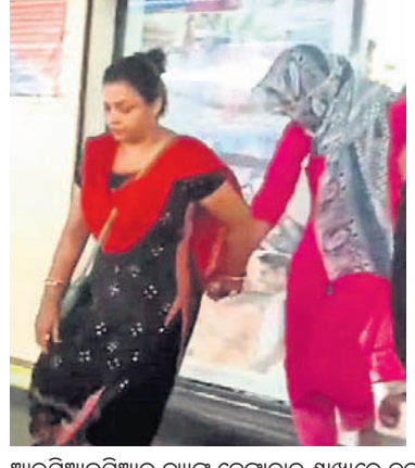
ଆଇସିଆଇସିଆଇ ବ୍ୟାଙ୍କ ଦେଈନାଳ ଶାଖାରେ ଠକେଇ ଘଟଣାରେ ଅପମୂଲ୍ୟ ଧରି କ୍ରୀତମତ୍ରାଞ୍ଚ ଅଧିକାରୀମାନେ ବାହାକୁଛନ୍ତି ।

ଦେଈନାଳ ସହରରେ କରାଯାଇଥିବା ଆଇସିଆଇସିଆଇ ବ୍ୟାଙ୍କ ଶାଖାରେ ୧.୦୪ କୋଟିରୁ ଊର୍ଦ୍ଧ୍ୱ ଟଙ୍କା ଠକେଇ ଘଟଣାର ପର୍ଯ୍ୟାୟ ବିଚାର କରାଯାଇଥିବା ବେଳେ ଏହି ଘଟଣାରେ ଠକେଇ କରାଯାଇଥିବା ପ୍ରମାଣିତ ହୋଇଛି ।