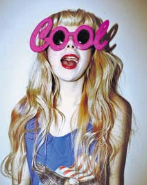
ଫଳରେ କେବଳ ଆଖି ନୁହେଁ, ମୁହଁରେ ଏହା ପୂରା ମୁହଁକୁ ଘୋଡ଼ାଇ ରଖିଥାଏ।

ନ ଥାଏ। ଏହା ଧୂଳି, ଧୂଆଁ, ବର୍ଷାପାଣିରୁ ବି ସୁରକ୍ଷା ଦେବାରେ ସାହାଯ୍ୟ କରିଥାଏ। ତେବେ ଅଜବ ବ୍ୟୋଜାୟାଭିତ୍ତୀ ଏହି ସନ୍ତୁସ୍ ଲାପାନ୍‌ର ଏକ କମ୍ପାନି ପ୍ରସ୍ତୁତ କରିଛି। ବର୍ତ୍ତମାନ ସନ୍ତୁସ୍: ଷ୍ଟାଇଲିଶ୍ ତଥା ଫଳ କୁଲ୍ ପାଇଁ ଅଧିକାଂଶ ମୁଦପିଡ଼ି ଅଜବ ଭାବ ତିଆରି ଯେମିତି ବର୍ତ୍ତମାନ ବା ପ୍ରକାପତି ତିଆରିର ସନ୍ତୁସ୍, ବ୍ୟବହାର କରୁଥିବା ଦେଖିବାକୁ ମିଳୁଛି। ଏଥିରେ ବିଭିନ୍ନ ପ୍ରକାରର କଲରସ୍ତର ବର୍ତ୍ତମାନ ସେପର ଫ୍ରେମ୍ ରହିଛି, ଯାହାକି ବେଶ୍ ଆକର୍ଷଣୀୟ ଲାଗୁଛି। ନିଜ ପୂର୍ଣ୍ଣକିରଣର ହାଲିକାରକ ପ୍ରଭାବ ପଡ଼ି