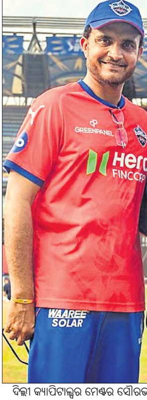
ଦିଲ୍ଲୀ କ୍ୟାପିଟାଲ୍ସ ମେଣ୍ଡର ସୌରଭ ଗାଙ୍ଗୁଲିଙ୍କ ସହ ସତ୍ତନ ଡେଭିଲ୍ସ ।

କରିବାକୁ ଚେଷ୍ଟା କରିବ ଲକ୍ଷ୍ନୋ । ୧୨୦ ବଲ୍ରେ ପାଇଁ ଦଳ ରୟନ ଲାଗି ଆଇପିଏଲ୍ ଉପରେ ନଜର ରଖୁଥିବା ଚୟନକର୍ତ୍ତାମାନେ ମଧ୍ୟ ଏହା ଉପରେ ନଜର ରଖୁଛନ୍ତି । ଲକ୍ଷ୍ନୋ ପକ୍ଷରୁ ଲୋକେଶ ରାସୁଲ ଓ କ୍ୱିଣ୍ଟିନ୍ ଡି କକ୍ ଓପନ କରୁଥିବା ବେଳେ ଚମଲ୍ଲୀ ଫର୍ମା ରହି ରହିଛନ୍ତି । ନିକୋଲାସ୍ ପୁରନ୍ ତେପ ଓଭରରେ ଚମଲ୍ଲୀର ବ୍ୟାଟ୍ କରୁଥିବା ବେଳେ ଶେଷ ମ୍ୟାଚ୍ରେ କୁନାଲ ପାଣ୍ଡା ମଧ୍ୟ ଉପଯୋଗୀ ବ୍ୟାଟ୍ କରିଛନ୍ତି । ତେବେ ଦଳ ପାଇଁ ସମସ୍ୟା ହେଉଛି ଧନସ୍ତର ବ୍ୟାଟର ଦେବଦତ୍ତ ପତିଲ ଓ ଅଷ୍ଟେଲାଇ ଫର୍ମା । ଉଭୟ ଖେଳାଳିଙ୍କ ବ୍ୟାଟ୍ ଏଯାବତ୍ ନାବକ ରହିଛି । ବୋଲିଂରେ ଲକ୍ଷ୍ନୋ ନିକେଟରେ କୁନାଲ ପାଣ୍ଡା ମଧ୍ୟ ଉପଯୋଗୀ ବ୍ୟାଟ୍ କରିଛନ୍ତି । ତେବେ ଦଳ ପାଇଁ ସମସ୍ୟା ହେଉଛି ଧନସ୍ତର ବ୍ୟାଟର ଦେବଦତ୍ତ ପତିଲ ଓ ଅଷ୍ଟେଲାଇ ଫର୍ମା । ଉଭୟ ଖେଳାଳିଙ୍କ ବ୍ୟାଟ୍ ଏଯାବତ୍ ନାବକ ରହିଛି । ବୋଲିଂରେ ଲକ୍ଷ୍ନୋ ନିକେଟରେ କୁନାଲ ପାଣ୍ଡା ମଧ୍ୟ ଉପଯୋଗୀ ବ୍ୟାଟ୍ କରିଛନ୍ତି । ତେବେ ଦଳ ପାଇଁ ସମସ୍ୟା ହେଉଛି ଧନସ୍ତର ବ୍ୟାଟର ଦେବଦତ୍ତ ପତିଲ ଓ ଅଷ୍ଟେଲାଇ ଫର୍ମା । ଉଭୟ ଖେଳାଳିଙ୍କ ବ୍ୟାଟ୍ ଏଯାବତ୍ ନାବକ ରହିଛି । ବୋଲିଂରେ ଲକ୍ଷ୍ନୋ ନିକେଟରେ କୁନାଲ ପାଣ୍ଡା ମଧ୍ୟ ଉପଯୋଗୀ ବ୍ୟାଟ୍ କରିଛନ୍ତି । ତେବେ ଦଳ ପାଇଁ ସମସ୍ୟା ହେଉଛି ଧନସ୍ତର ବ୍ୟାଟର ଦେବଦତ୍ତ ପତିଲ ଓ ଅଷ୍ଟେଲାଇ ଫର୍ମା । ଉଭୟ ଖେଳାଳିଙ୍କ ବ୍ୟାଟ୍ ଏଯାବତ୍ ନାବକ ରହିଛି । ବୋଲିଂରେ ଲକ୍ଷ୍ନୋ ନିକେଟରେ କୁନାଲ ପାଣ୍ଡା ମଧ୍ୟ ଉପଯୋଗୀ ବ୍ୟାଟ୍ କରିଛନ୍ତି । ତେବେ ଦଳ ପାଇଁ ସମସ୍ୟା ହେଉଛି ଧନସ୍ତର ବ୍ୟାଟର ଦେବଦତ୍ତ ପତିଲ ଓ ଅଷ୍ଟେଲାଇ ଫର୍ମା । ଉଭୟ ଖେଳାଳିଙ୍କ ବ୍ୟାଟ୍ ଏଯାବତ୍ ନାବକ ରହିଛି ।