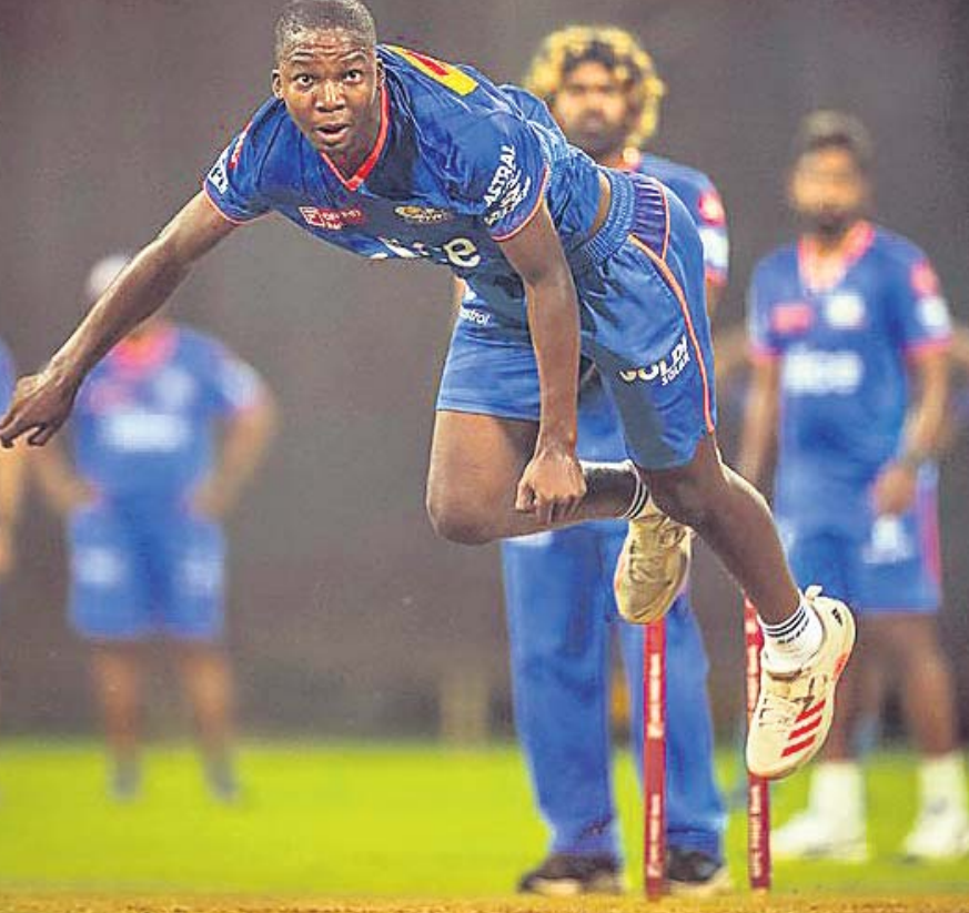
ମୁମ୍ବାଇ ବେଟ୍ ସେସନ୍ରେ କୋଶି ମ୍ୟାଚ୍ ।

ଲକ୍ଷ୍ନୋ, ୭ (ପି.ଟି.) ଇଣ୍ଡିଆନ୍ ପ୍ରିମିୟର ଲିଗ୍ (ଆଇପିଏଲ୍) ୧୨୦ କ୍ରିକେଟ ଟୁର୍ନାମେଣ୍ଟରେ ରବିବାର ଡେବ୍ ହେଡରେ ପରସ୍ପରକୁ ଭେଟିବେ ଲକ୍ଷ୍ନୋ ପୁପର ବାଏଣ୍ଟ୍ସ-ଗୁଜରାଟ ଟାଇଟନ୍ସ ଓ ଦିଲ୍ଲୀ କ୍ୟାପିଟାଲ୍ସ-ମୁମ୍ବାଇ ଇଣ୍ଡିଆନ୍ସ ମ୍ୟାଚ୍ ଯୋଜ୍ୟା ରହିଛି । ପଞ୍ଜାବ କିଙ୍ଗ୍ସ ବିପକ୍ଷ ମ୍ୟାଚ୍ରେ ପରାସ୍ତ ହୋଇ ୩/୨୭ରେ ପିରା ହାସଲ କରିଥିବା ବେଳେ ଆରସିବି ବିପକ୍ଷରେ ୩/୧୪ ହାସଲ କରିଥିଲେ । ପ୍ରଥମ ଲୀଗ୍ରେ ପରାଜୟ ପରେ ଲକ୍ଷ୍ନୋ ଲୀଗାତର ଦୁଇଟି ମ୍ୟାଚ୍ରେ ବିଜୟୀ ହୋଇଛି । ରବିବାର ମ୍ୟାଚ୍ କିଛିବା ସହ ବିଜୟରେ ହାସଲ କରିବେ