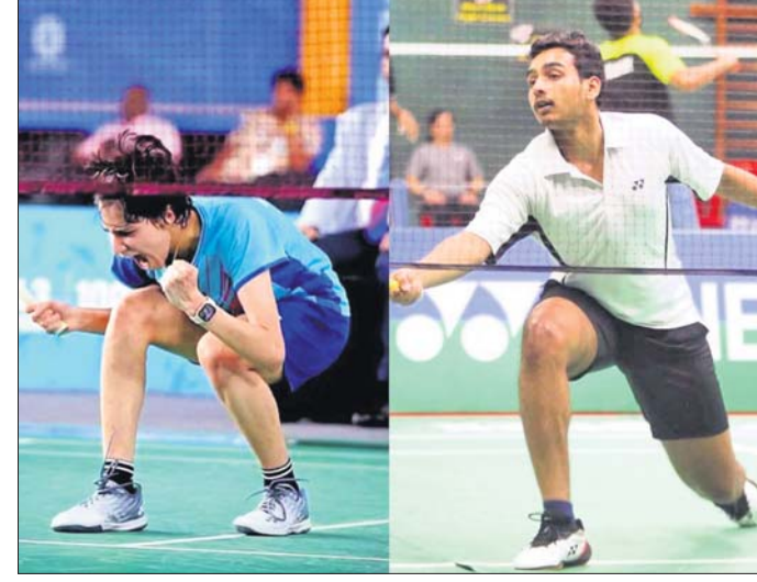
ଅଷ୍ଟମା, ୬/୪ (ପି.ଟି.)