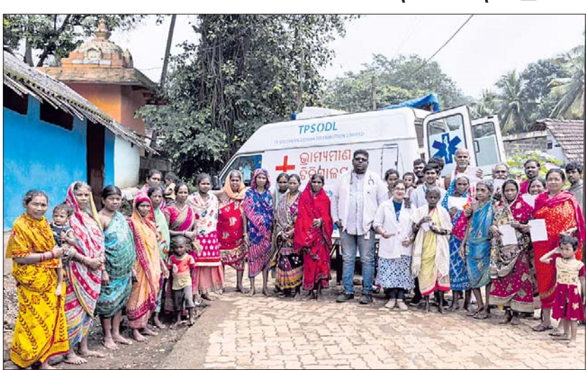
ଟିପିଏସ୍‌ଓଡିଏଲ୍ ପକ୍ଷରୁ ଭ୍ରାମ୍ୟମାଣ ଚିକିତ୍ସା ସେବା ପ୍ରଦାନ କରାଯାଇଛି।