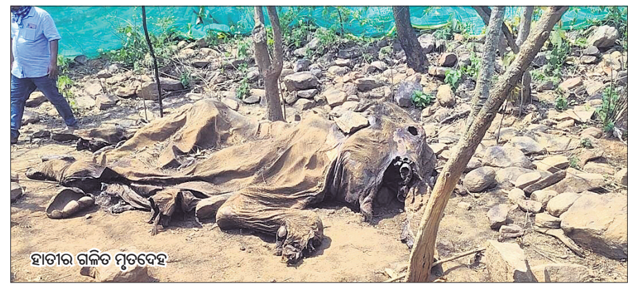
ହାତୀର ଗଳିତ ମୃତଦେହ

କେନ୍ଦୁଝର(ନରେଶ ଚନ୍ଦ୍ର ପଟ୍ଟନାୟକ)/ ଯୋଡ଼ା(ମାନ୍ୟ ମହାନ୍ତି)/ ଝୁମୁରା(ଶଶିକାନ୍ତ ସାହୁ), ୬/୪