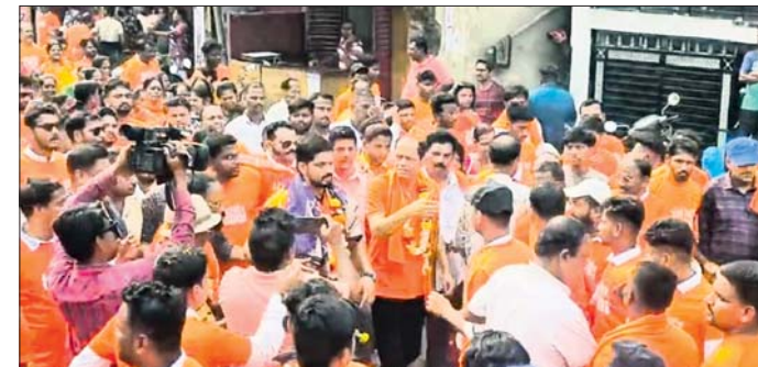
ବ୍ରହ୍ମପୁର, ୬୪ (ନରସିଂହ ସାହୁ) ବ୍ରହ୍ମପୁର ଭାଜପା ପକ୍ଷରୁ ଶନିବାର ଦଳର ପ୍ରତିଷ୍ଠା ଦିବସ ପାଳିତ ହୋଇଯାଇଛି।