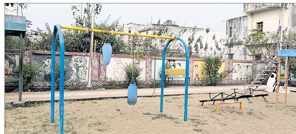
ପକ୍ଷରୁ କୁହାଯାଉଥିଲା ମଧ୍ୟ ସେଭଳି କିଛି ସେଖାବାକୁ ମିଳୁନି।

ସହରବାସୀଙ୍କ ଆମୋଦପ୍ରମୋଦ ପାଇଁ ବ୍ରହ୍ମପୁର ଉନ୍ନୟନ କର୍ତ୍ତୃପକ୍ଷ (ବିଜିଡିଏ)ପକ୍ଷରୁ ନିଜସ୍ୱ ଗ୍ରାମରେ ଏକ ପାର୍କ ନିର୍ମାଣ କରାଯାଇଛି, ଯେଉଁଠାରେ ବ୍ୟାୟାମ ଉପକରଣ ଓ ଶିଶୁଙ୍କ ଖେଳିବା ନିମନ୍ତେ କ୍ରୀଡ଼ା ଉପକରଣ ରହିଛି।