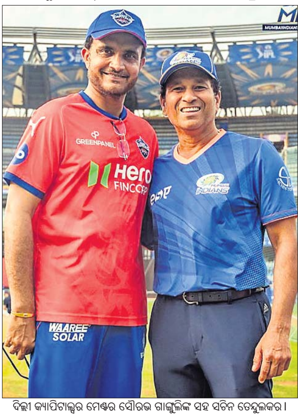
ଦିଲ୍ଲୀ କ୍ୟାପିଟାଲର ମେଣ୍ଟର ସୌରଭ ଗାଙ୍ଗୁଲିଙ୍କ ସହ ସଚିନ ଟେଣ୍ଡୁଲକର।