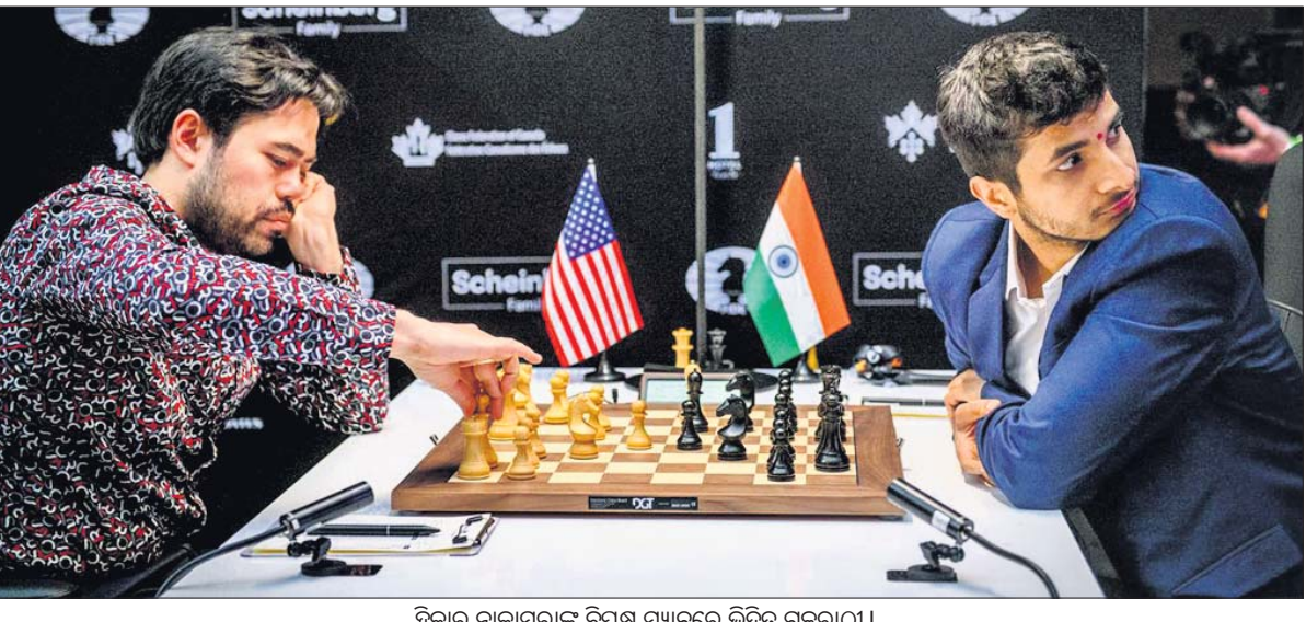
ହିକାରୁ ନାକାମୁରାଙ୍କ ବିପକ୍ଷ ମ୍ୟାଚରେ ଭିଦିତ ଗୁଜେଶ।

କୋହଲିଙ୍କ ଅଷ୍ଟମ ଶତକ। କୋହଲି ଗୋଟିଏ ପଟରୁ ଇନିଂସ୍ ଅବସରରେ ବିରାଟ କୋହଲି। ଶତକୀୟ ଇନିଂସ୍ ଅବସରରେ ବିରାଟ କୋହଲି।