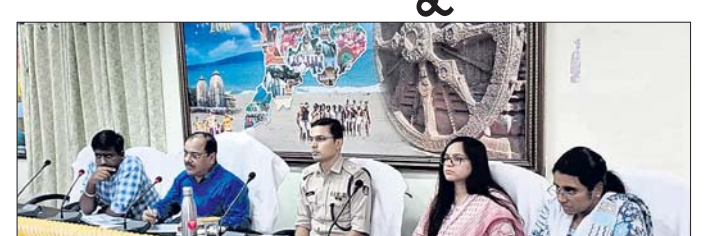
ବୈଠକରେ ଉପସ୍ଥିତ ରାଜସ୍ୱ କମିଶନରଙ୍କ ସହ ଅନ୍ୟାନ୍ୟ ଅଧିକାରୀ।

ବ୍ରହ୍ମପୁର, ୬୪ (ଅଶୋକ କୁମାର ସାହୁ): ଦକ୍ଷିଣାଞ୍ଚଳ ରାଜସ୍ୱ କମିଶନରଙ୍କ ସମ୍ମିଳନୀ କକ୍ଷରେ ଗଞ୍ଜାମ ଜିଲାର ନିର୍ବାଚନ ପ୍ରସ୍ତୁତି ସମାପ୍ତ ହୋଇଛି।