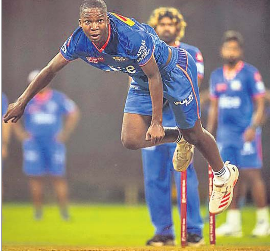
ମୁମ୍ବାଇ ରେନ୍ ସେସନ୍ରେ କୋହଲି ମ୍ୟାଚ।