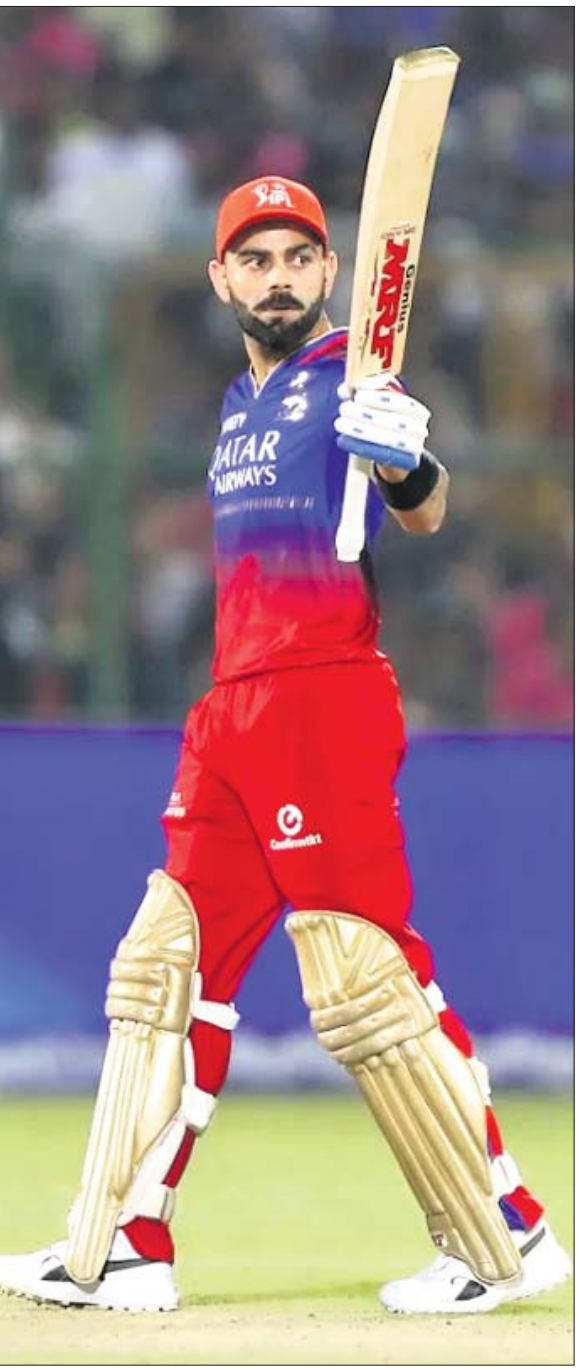
ଶତକୀୟ ଇନିଂସ୍ ଅବସରରେ ବିରାଟ କୋହଲି।