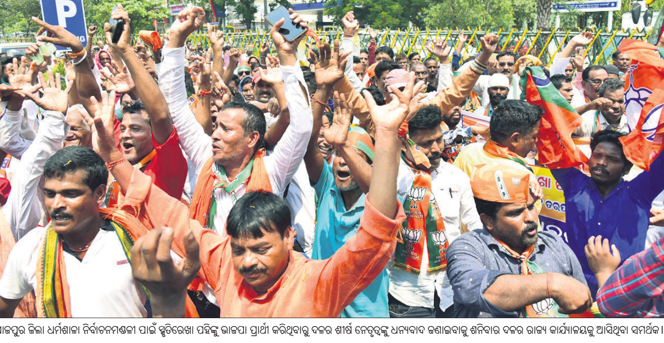
ଯାକପୁର ଜିଲା ଧର୍ମଶାଳା ନିର୍ବାଚନମଣ୍ଡଳୀ ପାଇଁ କ୍ଷୁଦ୍ରିତରେ ପ୍ରାର୍ଥା କରୁଥିବା ପ୍ରାର୍ଥୀ କରୁଥିବା ଦଳର ଶୀର୍ଷ ନେତୃତ୍ୱ ପ୍ରଦାନ କରୁଥିବା ଧର୍ମଶାଳା ନିର୍ବାଚନମଣ୍ଡଳୀରେ ଦଳର ରାଜ୍ୟ କାର୍ଯ୍ୟାଳୟକୁ ଆସିଥିବା ସମର୍ଥକ।