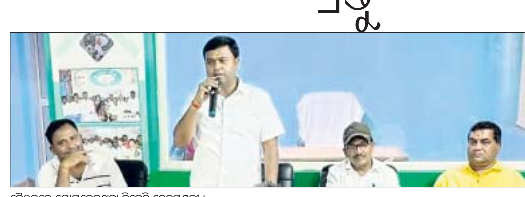
ବୈଠକରେ ଯୋଗଦେଇଥିବା ବିଜେଡି ନେତୃମଣ୍ଡଳୀ।