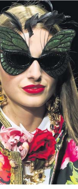
ଫଳରେ କେବଳ ଆଖି ନୁହେଁ, ମୁହଁରେ ଏହା ପୂରା ମୁହଁକୁ ଘୋଡ଼ାଇ ରଖିଥାଏ।

ପ୍ରେମ୍ ଥିବା ସନ୍ତୋଷ ଏବେ ଅଧିକାଂଶ ମୁସିକି ପାଇଁ ଲାଭଦାୟକ ଫ୍ୟାଶନ୍ ଟ୍ରେଣ୍ଡ ପାଲଟିଛି। କୁଲ୍ ସନ୍ତୋଷ: ଏହି ସନ୍ତୋଷ ଏବେ ଫଳି ଲୁହ ପାଇଁ ଅନେକ ମୁସିକି ଅଜବ ବ୍ୟବହାର କରୁଥିବା ଦେଖିବାକୁ ମିଳୁଛି। ଏହାର ପ୍ରେମକୁ କୁଲ୍(COOL) ଲେଖା ବା ପ୍ରକାଶିତ ତିକାଲନ୍ଦର ସନ୍ତୋଷ, ବ୍ୟବହାର କରୁଥିବା ଦେଖିବାକୁ ମିଳୁଛି। ଏଥିରେ ବିଭିନ୍ନ ପ୍ରକାରର କଲରଫୁଲ୍ ବରଫୁଲ୍ ସେପର ପ୍ରେମ୍ ରହୁଛି, ଯାହାକି ବେଶ୍ ଆଲୋକାତି ଲାଗୁଛି। ନିଜ ପୂର୍ଣ୍ଣକିରଣର ହାଲିକାରକ ପ୍ରଭାବ ପଡ଼ି