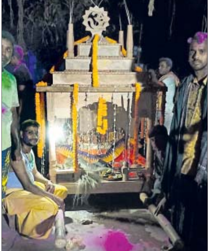
ରାଧାକୃଷ୍ଣ ବିନା ଗ୍ରାମ ପରିକ୍ରମା କରୁଛି।