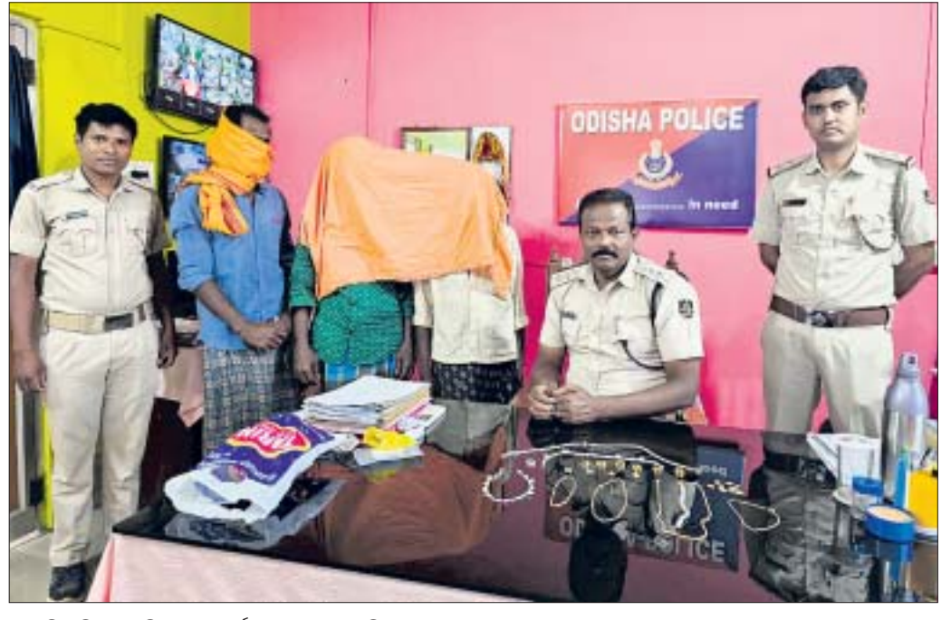
ପୋଲିସ୍ ଗିରଫ ଅଭିଯୁକ୍ତଙ୍କ ସମ୍ପର୍କରେ ସୂଚନା ଦେଉଛି।