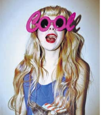
ଫଳରେ କେବଳ ଆଖି ନୁହେଁ, ମୁହଁରେ ଏହା ପୂରା ମୁହଁକୁ ଘୋଡ଼ାଇ ରଖିଥାଏ।

ନ ଥାଏ। ଏହା ଧୂଳି, ଧୂଆଁ, ବର୍ଷପାଣିରୁ ବି ସୁରକ୍ଷା ଦେବାରେ ସାହାଯ୍ୟ କରିଥାଏ। ତେବେ ଅଜବ ବେଶାକାରଥିବା ଏହି ସନ୍ତୋଷ ଫ୍ୟାଶନ୍ ଏକ କମ୍ପାନି ପ୍ରସ୍ତୁତ କରିଛି। ବରଫୁଲ୍ ସନ୍ତୋଷ: ଷ୍ଟାଇଲିଶ୍ ତଥା ଫଳି ଲୁହ ପାଇଁ ଅଧିକାଂଶ ମୁସିକି ଅଜବ ଅଜବ ତିକାଲନ୍ ଯେମିତି ବରଫୁଲ୍ ବା ପ୍ରକାଶିତ ତିକାଲନ୍ଦର ସନ୍ତୋଷ, ବ୍ୟବହାର କରୁଥିବା ଦେଖିବାକୁ ମିଳୁଛି। ଏଥିରେ ବିଭିନ୍ନ ପ୍ରକାରର କଲରଫୁଲ୍ ବରଫୁଲ୍ ସେପର ପ୍ରେମ୍ ରହୁଛି, ଯାହାକି ବେଶ୍ ଆଲୋକାତି ଲାଗୁଛି। ନିଜ ପୂର୍ଣ୍ଣକିରଣର ହାଲିକାରକ ପ୍ରଭାବ ପଡ଼ି