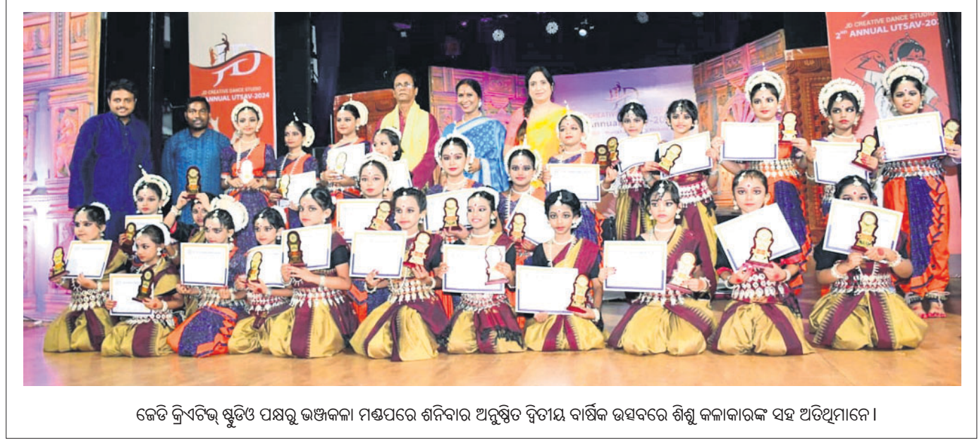
କେତି କ୍ରୀଡ଼ା ଶୁଭିତ ପକ୍ଷରୁ ଉତ୍ତମ ଶିକ୍ଷା ମନ୍ତ୍ରାଳୟର ଅନୁମତି ସ୍ୱୀକାର କରି ଉତ୍ତମ ଶିକ୍ଷା କଳାକାରଙ୍କ ସହ ଅତିଥିମାନେ।