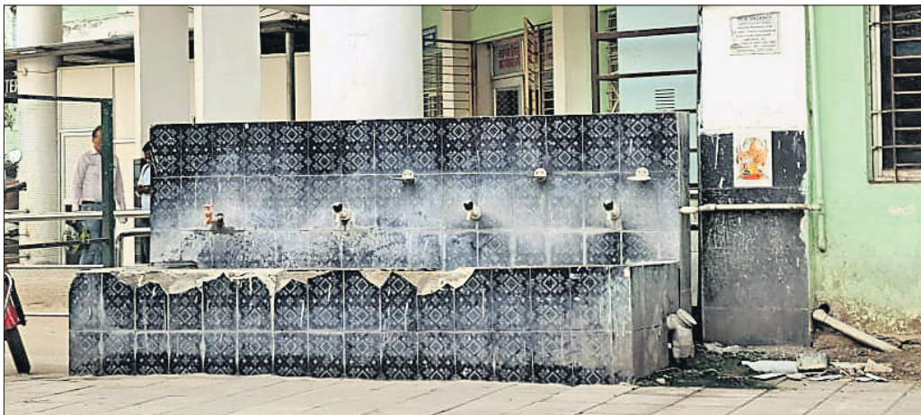
ଏସିବି ମେଡିକାଲର ରଞ୍ଜନରଞ୍ଜି ବିଭାଗ ନିକଟରେ ଥିବା ପାଣିଟ୍ୟାପ ଅବଳ ହୋଇପଡିଛି।

ରାଜ୍ୟ ସମେତ କଟକ ସହରରେ ଗ୍ରାମ୍ୟ ପ୍ରବାହ କାନ୍ଦୁ ରହିଛି। ଅଂଶୁଯାତ ମୂଳାବଳୀ ପାଇଁ ରାଜ୍ୟ ସରକାର ବିଭିନ୍ନ ହସ୍ତିକାଳରେ ସ୍ୱତନ୍ତ୍ର ବ୍ୟବସ୍ଥା କରିବାକୁ ନିର୍ଦ୍ଦେଶ ଦେଇଛନ୍ତି। ହେଲେ ରାଜ୍ୟର ସର୍ବବୃହତ ଏସିବି ମେଡିକାଲରେ ଅବ୍ୟବସ୍ଥା ଦେଖିବାକୁ ମିଳିଛି। ଏଠାରେ ପାଣି ପାଇଁ ରୋଗୀ ଓ ସେମାନଙ୍କ ସମ୍ପର୍କୀୟ ହୃଦୟ ହେଉଛନ୍ତି। ଏହାକୁ ନେଇ ସେମାନଙ୍କ ମଧ୍ୟରେ ଅସନ୍ତୋଷ ପ୍ରକାଶ ପାଇଛି।