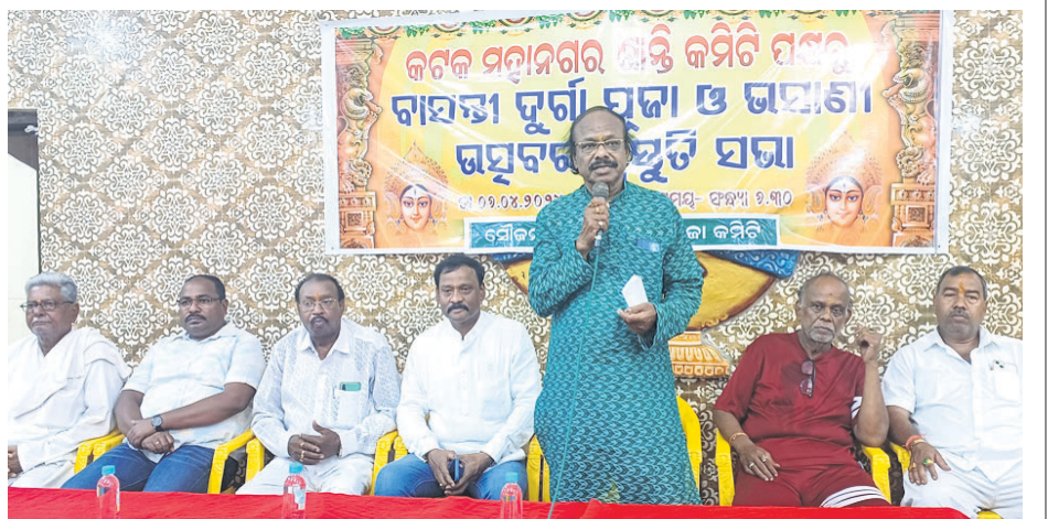
କଟକ ମହାନଗର ଶାନ୍ତି କମିଟି ପକ୍ଷରୁ ମଙ୍ଗଳାବାଗସ୍ଥିତ ଏକ ମଣ୍ଡପରେ ବାସନ୍ତକ ଦୁର୍ଗାପୂଜା ଓ ଭବାଣୀ ଉତ୍ସବ ପାଇଁ ପ୍ରସ୍ତୁତି ସଭା।