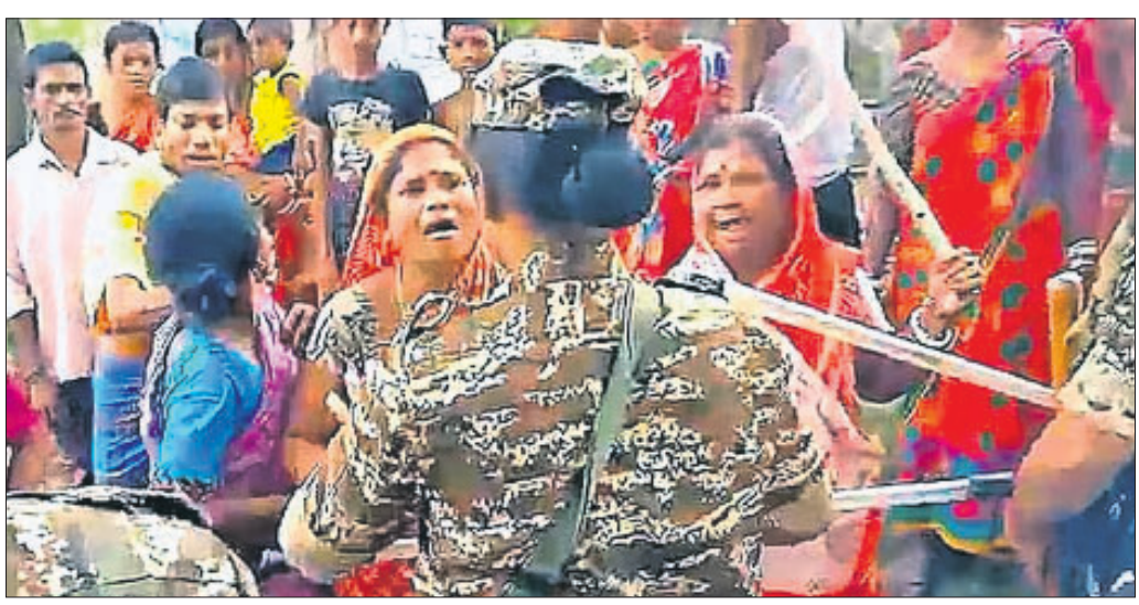
ଭୁପତିନଗର ଅଞ୍ଚଳରେ ଉଦ୍ଦେଶ୍ୟକ ଲାଭ ରହିଥିବାବେଳେ ସୁରକ୍ଷା ଯବାନମାନେ ଘାଆନ୍ତ ଲୋକଙ୍କୁ ବୁଝାଖୁଣି କରୁଛନ୍ତି।

ପଶ୍ଚିମବଙ୍ଗର ପୂର୍ବ ମେଦିନିପୁର ଜିଲ୍ଲାର ଭୁପତିନଗର ଅଞ୍ଚଳରେ ଜାତୀୟ ତଦନ୍ତକାରୀ ସଂସ୍ଥା (ଏନ୍ଆଇଏ) ଅଧିକାରୀମାନଙ୍କ ଗାଡ଼ି ଉପରେ ଶନିବାର ଆକ୍ରମଣ ହୋଇଛି। ସେମାନେ ୨୦୨୨ ବୋମା ବିସ୍ଫୋରଣ ମାମଲାରେ ତଦନ୍ତ ପାଇଁ ଉକ୍ତ ଗାଡ଼ି ଯାଇଥିଲେ ବୋଲି ପୋଲିସ କହିଛି। ସେମାନେ ଉକ୍ତ ମାମଲାରେ ୨ ଜଣଙ୍କୁ ଗିରଫ କରି କୋଲକାତା ଫେରୁଥିବାବେଳେ ଆକ୍ରମଣର ସମ୍ପୂର୍ଣ୍ଣାନ୍ତ ହୋଇଥିଲେ। ଘାଆନ୍ତ ଲୋକେ ସେମାନଙ୍କ ଗାଡ଼ିକୁ ଘେରାଇ କରିବା ସହ ଚେକାମାଡ଼ କରିଥିଲେ। ସେମାନଙ୍କ ଆକ୍ରମଣରେ ଏନ୍ଆଇଏର ଜଣେ ଅଧିକାରୀ ଆହତ ହୋଇଛନ୍ତି। ଏନେଇ ତଦନ୍ତକାରୀ ସଂସ୍ଥା ପୋଲିସରେ ଅଭିଯୋଗ କରିଛି। ଅଭିଯୋଗ ପାଇବା ପରେ କେନ୍ଦ୍ରୀୟ ପୋଲିସ ବଳ ଭୁପତିନଗରରେ ପହଞ୍ଚିଛି। ସୂଚନାଯୋଗ୍ୟ, ୨୦୨୨ କଂଗ୍ରେସର ୪୦ ବିଧାୟକ ଥିବାବେଳେ ୩ ସାଧାରଣ ବିଧାୟକଙ୍କ ସମର୍ଥନ ରହିଛି। କଂଗ୍ରେସର ୬ ବିରୋଧୀ ଏବଂ ୩ ସାଧାରଣ ବିଧାୟକଙ୍କ ଭୋଟ ନାକଟ ହେବାରୁ ଉଭୟ ଭାଜପା ଓ କଂଗ୍ରେସ ପ୍ରାର୍ଥୀ ୩୪ ଲେଖାଏ ଭୋଟ ପାଇଥିଲେ।