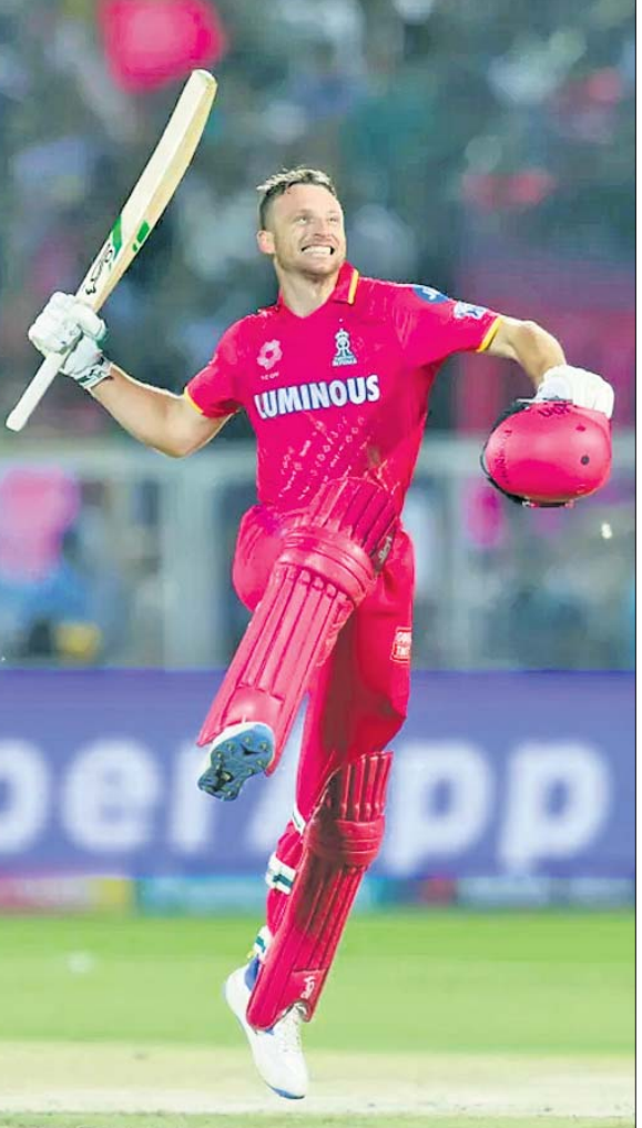
ଶତକ ହାସଲ ପରେ ଉଲ୍ଲାସିତ ଖୋଶ ବଟଲର ।

ଇଣ୍ଡିଆନ ପ୍ରିମିୟର ଲିଗ୍ (ଆଇପିଏଲ୍) ୧୨୦ କ୍ରିକେଟ ଟୁର୍ନାମେଣ୍ଟରେ ବିରାଟ କୋହଲି ଅଷ୍ଟମ ଶତକ ସହ ପରାଜିତ ହୋଇଛନ୍ତି ରୟାଲ ଚ୍ୟାଲେଞ୍ଜର୍ସ ବେଙ୍ଗାଲୁରୁ (ଆରସିବି) । ଶତକାୟ ମ୍ୟାଚରେ ଖୋଶ ବଟଲରଙ୍କ ୧୦୦* ରନ ବଳରେ ରାଜସ୍ଥାନ ରୟାଲ୍ ୬ ଉଇକେଟରେ ବିଜୟୀ ହୋଇଛି । ଶନିବାର କୋହଲିଙ୍କ ୧୧୩* ରନ ବଳରେ ଆରସିବି ୩ ଉଇକେଟରେ ୧୮୩ ରନ କରିଥିଲା । ଜବାବରେ ରାଜସ୍ଥାନ ୧୯.୧ ଓଭରରେ ୪ ଉଇକେଟ ହରାଇ ୧୮୯ ରନ କରିଥିଲା । କ୍ରମାଗତ ଚତୁର୍ଥ ମ୍ୟାଚ୍ ଜିତି ପଏଣ୍ଟ ଟେବୁଲ୍ ଶୀର୍ଷରେ ପହଞ୍ଚିଛନ୍ତି ରାଜସ୍ଥାନ । ଏହା ସହିତ ରାଜସ୍ଥାନ ଅଧିନାୟକ ସଞ୍ଜୁ ସାମ୍ବତ୍ ସହ