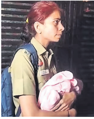
ଓଡ଼ିଶାରେ ଏବଂ କେତେଜଣ ମହିଳା ଅଛନ୍ତି। ଜାତୀୟ ରାଜଧାନୀ ଅଞ୍ଚଳରେ ୭୦୮ ଶିଶୁ ବିକ୍ରିରେ ସେମାନେ ସମ୍ପୂର୍ଣ୍ଣ ଶିଶୁ ଚାଲାଣ ଗ୍ୟାଙ୍ଗ୍ ଫେସ୍‌ବୁକ୍ ପେଜ୍, ତଦନ୍ତରେ ସାମିଲ କରିଛନ୍ତି। ବ୍ୟବସାୟରେ ତେର ଦିଲ୍ଲୀ ବାହାରକୁ ଲାଗିଥିବା ବିଭିନ୍ନ ରାଜ୍ୟରେ ତଦନ୍ତ ଜାରି ରହିଛି। ଗିରଫ ୬ ଜଣଙ୍କ ମଧ୍ୟରେ ହସ୍ତିନାଲରେ ଜଣେ