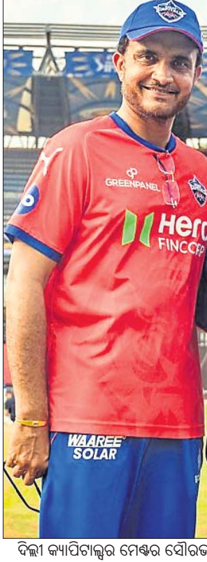
ଦିଲ୍ଲୀ କ୍ୟାପିଟାଲ୍ସର ମେଣ୍ଡର ସୌରଭ ଗାଙ୍ଗୁଲିଙ୍କ ସହ ସତନ ଟେଣ୍ଟଲକର ।

ହୋଇଛି । ରବିବାର ମ୍ୟାଚ୍ରେ ଜିତିବା ସହ ବିଜୟରେ ହାସଲିକ ଅର୍ଜନ କରିବାକୁ ଚେଷ୍ଟା କରିବ ଲକ୍ଷ୍ନୋ । ୧୨୦ ବିଶ୍ୱକପ ପାଇଁ ଦଳ ଚୟନ ଲାଗି ଆଇପିଏଲ୍ ଉପରେ ନଜର ରଖିଥିବା ଚୟନକର୍ତ୍ତାମାନେ ମଧ୍ୟ ଏହା ଉପରେ ନଜର ରଖିଛନ୍ତି । ଲକ୍ଷ୍ନୋ ପକ୍ଷରୁ ଲୋକେଶ ରାୟୁଲ ଓ କ୍ୱିଣ୍ଟିନି କେ କେ ପ୍ରଥମ କରୁଥିବା ବେଳେ ଚମ୍ପକାର ପର୍ଯ୍ୟନ୍ତ ରହିଛନ୍ତି । ନିକୋଲାସ୍ ପୁରନ୍ ତଥେ ଓଭରରେ ଚମ୍ପକାର ବ୍ୟାଟ୍ କରୁଥିବା ବେଳେ ଶେଷ ମ୍ୟାଚ୍ରେ କୁନାଲ ପାଣ୍ଡା ମଧ୍ୟ ଉପଯୋଗୀ ବ୍ୟାଟ୍ କରିଛନ୍ତି । ତେବେ ଦଳ ପାଇଁ ସମସ୍ୟା ହେଉଛି ଶେଷ ମ୍ୟାଚ୍ରେ ଦେବଦର ପତିକାଲ ଓ ଅଷ୍ଟେଲାଇ ପର୍ଯ୍ୟନ୍ତ ଉଭୟ ଖେଳାଳିଙ୍କ ବ୍ୟାଟ୍ ଏଯାଏ ନାହିଁ ବୋଲି କହିଛନ୍ତି । ବୋଲିଂରେ ଲକ୍ଷ୍ନୋ ନିକେଟରେ କୁନାଲ ପାଣ୍ଡା ମଧ୍ୟ ଉପଯୋଗୀ ବ୍ୟାଟ୍ କରିଛନ୍ତି । ତେବେ ଦଳ ପାଇଁ ସମସ୍ୟା ହେଉଛି ଶେଷ ମ୍ୟାଚ୍ରେ ଦେବଦର ପତିକାଲ ଓ ଅଷ୍ଟେଲାଇ ପର୍ଯ୍ୟନ୍ତ ଉଭୟ ଖେଳାଳିଙ୍କ ବ୍ୟାଟ୍ ଏଯାଏ ନାହିଁ ବୋଲି କହିଛନ୍ତି । ବୋଲିଂରେ ଲକ୍ଷ୍ନୋ ନିକେଟରେ କୁନାଲ ପାଣ୍ଡା ମଧ୍ୟ ଉପଯୋଗୀ ବ୍ୟାଟ୍ କରିଛନ୍ତି । ତେବେ ଦଳ ପାଇଁ ସମସ୍ୟା ହେଉଛି ଶେଷ ମ୍ୟାଚ୍ରେ ଦେବଦର ପତିକାଲ ଓ ଅଷ୍ଟେଲାଇ ପର୍ଯ୍ୟନ୍ତ ଉଭୟ ଖେଳାଳିଙ୍କ ବ୍ୟାଟ୍ ଏଯାଏ ନାହିଁ ବୋଲି କହିଛନ୍ତି । ବୋଲିଂରେ ଲକ୍ଷ୍ନୋ ନିକେଟରେ କୁନାଲ ପାଣ୍ଡା ମଧ୍ୟ ଉପଯୋଗୀ ବ୍ୟାଟ୍ କରିଛନ୍ତି । ତେବେ ଦଳ ପାଇଁ ସମସ୍ୟା ହେଉଛି ଶେଷ ମ୍ୟାଚ୍ରେ ଦେବଦର ପତିକାଲ ଓ ଅଷ୍ଟେଲାଇ ପର୍ଯ୍ୟନ୍ତ ଉଭୟ ଖେଳାଳିଙ୍କ ବ୍ୟାଟ୍ ଏଯାଏ ନାହିଁ ବୋଲି କହିଛନ୍ତି ।