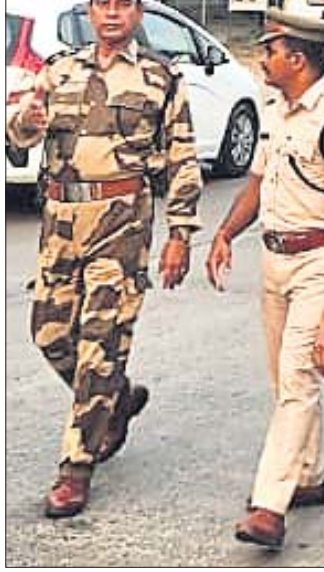
ସାଲେପୁର ପୋଲିସ ପକ୍ଷରୁ ସହରରେ ଫ୍ଲୋରମାର୍ଚ୍ଚ କରାଯାଇଛି।