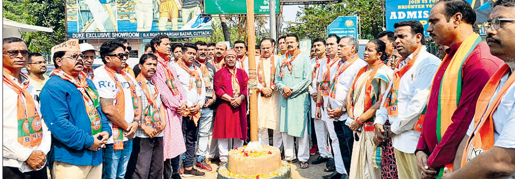
କାର୍ଯ୍ୟକ୍ରମରେ ଭାଜପା କଟକ ଲୋକ ସଭା ପ୍ରାର୍ଥୀ ଭର୍ତ୍ତୁହରି ମହତାବଙ୍କ ସମେତ ଦଳୀୟ ନେତୃବୃନ୍ଦ।