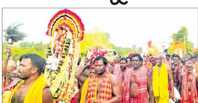
ହୋଇଥିଲେ। ପାଟପଞ୍ଚୁଆରେ ବାହାରି ନୂଆଗାଁ ଠାକୁର ଗ୍ରାମ ପରିଚ୍ଛମା କରିଥିଲେ।

ପୁରୀ ଜିଲ୍ଲା କୃଷ୍ଣପ୍ରସାଦ ବ୍ଲକ୍ ଅନ୍ତର୍ଗତ ତିଡି ପଞ୍ଚାୟତରା ନୂଆଗାଁ ଗ୍ରାମବାସୀଙ୍କ ସହଯୋଗରେ ପଞ୍ଚଶତାବ୍ଦୀ ମହାମିଳନ କାର୍ଯ୍ୟକ୍ରମ ଅନୁଷ୍ଠିତ ହୋଇଯାଇଛି।