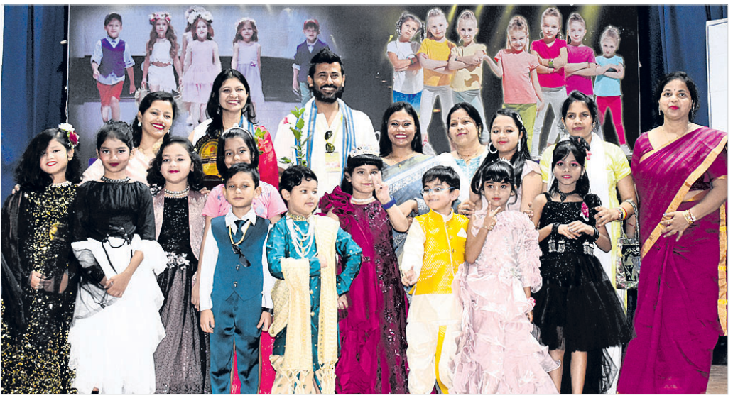
ପାନସିଆ ଚାରିଟେବୁଲ ଗ୍ରନ୍ଥ ପକ୍ଷରୁ ଭୁବନେଶ୍ୱର ସୂଚନା ଭବନରେ ଶନିବାର ଆୟୋଜିତ ଫାଣିନ ଶୋ’ ପ୍ରତିଯୋଗିତାରେ ଅତିଥିଙ୍କ ସହ ପ୍ରତିଯୋଗୀମାନେ।