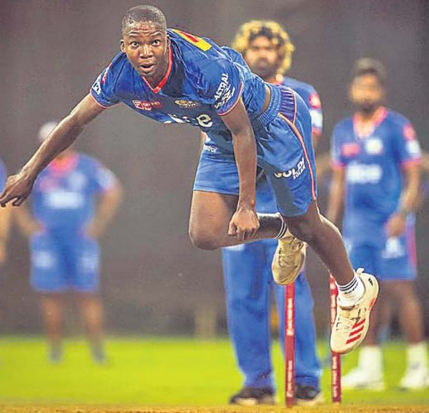
ମୁମ୍ବାଇ ନେଟ୍ ସେସନ୍ରେ କ୍ଲେମ୍ ମ୍ୟାଚ୍ ।

ଇଣ୍ଡିଆନ ପ୍ରିମିୟର ଲିଗ୍ (ଆଇପିଏଲ୍) ୧୨୦ କ୍ରିକେଟ ଟୁର୍ନାମେଣ୍ଟରେ ରବିବାର ତଦ୍ଦଳ ହେତୁରେ ପରସ୍ପରକୁ ଭେଟିବେ ଲକ୍ଷ୍ନୋ ପୁଅର କାଏଣ୍ଟ୍ସ-ଗୁଜରାଟ ଟାଇଟନ୍ସ ଓ ଦିଲ୍ଲୀ କ୍ୟାପିଟାଲ୍ସ-ମୁମ୍ବାଇ ଇଣ୍ଡିଆନ୍ସ ମ୍ୟାଚ୍ ଯୋଡ଼ାଯାଇଛି । ୨୧ ବର୍ଷୀୟ ମୟଙ୍କ ଉଦୟ ମ୍ୟାଚ୍ରେ ୩ ଉଇକେଟ ସଫଳତା ହାସଲ କରିଥିବା ବେଳେ ଗ୍ରେନ୍ ଡେବିଡ୍ ମ୍ୟାଚ୍ ହୋଇଥିଲେ । ପଞ୍ଜାବ କିଙ୍ଗ୍ସ ବିପକ୍ଷ ମ୍ୟାଚ୍ରେ ପରାପର୍ଯ୍ୟ କରି ୩/୨୭ର ପିର ହାସଲ କରିଥିବା ବେଳେ ଆରସିବି ବିପକ୍ଷରେ ୩/୧୪ ହାସଲ କରିଥିଲେ । ପ୍ରଥମ ଲଗାତର ଦୁଇଟି ମ୍ୟାଚ୍ରେ ବିଜୟୀ