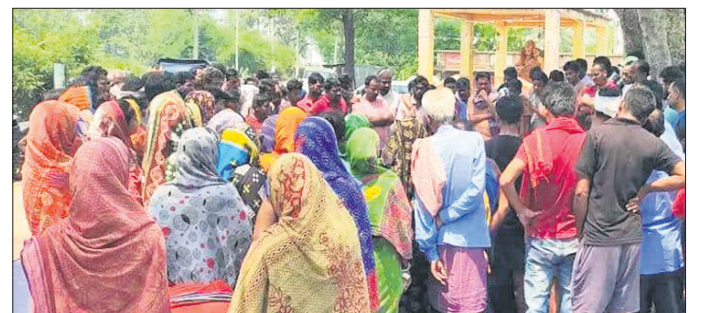
ଜେନାପତିଠାରେ ଏକାଠି ହୋଇଥିବା ବିଜେଡି କର୍ମୀ।