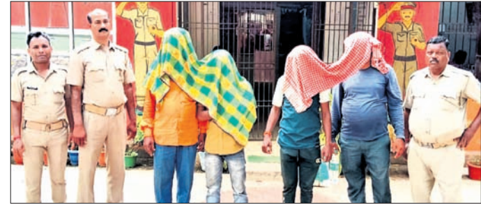
ଗିରଫ ହୋଇଥିବା ୪ ବ୍ରାହ୍ମଣମାନେ।

ହସ୍ତେମ୍ବକ ଅଭିଯୋଗକ୍ରମେ ଏକ ମାମଲା (ନଂ.୧୨୭/୨୪) ରୁଚ୍ଛ ପରେ ଅଭିଯୁକ୍ତମାନଙ୍କୁ କୋର୍ଟୋଲାଣ କରାଯାଇଥିଲା।