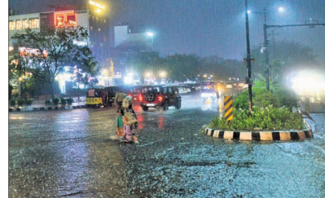
ରବିବାର ସନ୍ଧ୍ୟାରେ ଭୁବନେଶ୍ୱରରେ ବର୍ଷା ।

ନ ଥିଲେ । ଏପରିସ୍ଥିତିରେ ବଜ୍ରପାତ ଝଡ଼ବର୍ଷା ଓ ପାଗରେ ପରିବର୍ତ୍ତନ ଚିନ୍ତା ବଢ଼ାଇଥିଲା । ରାଜ୍ୟର ବିଭିନ୍ନ ସ୍ଥାନରେ ବଜ୍ରପାତ ହୋଇଥିବାବେଳେ ବାଲେଶ୍ୱରରେ ୩ ପର୍ଯ୍ୟଟକ ଗୁରୁତର ଆହତ ହୋଇଥିବା ସୂଚନା ମିଳିଛି ।