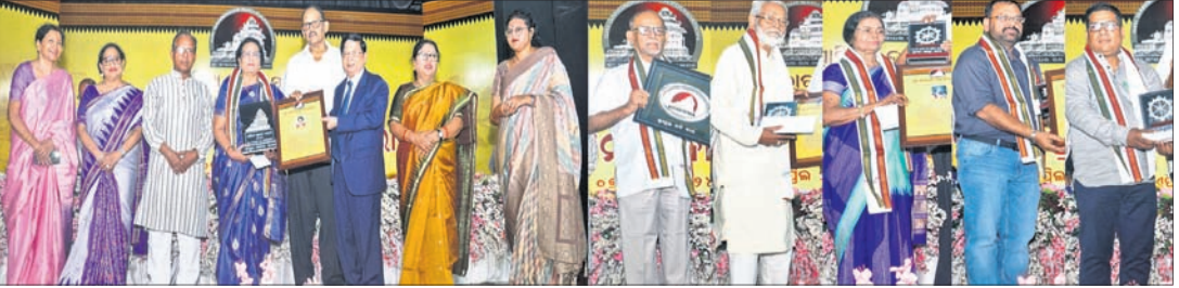
ସମ୍ମାନ ପ୍ରଦାନ ସମାରୋହରେ ଅତିଥିଙ୍କ ଗହଣରେ ସମ୍ମାନିତ ପ୍ରତିଭାଧାରୀ ।