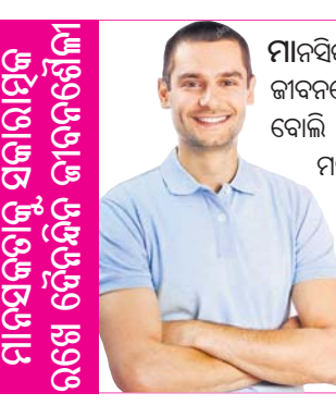
ମାନସିକତାକୁ ସମାନ୍ତରାଳରେ ଚଳେ ଦୈନନ୍ଦିନ ଜୀବନଶୈଳୀ

କଥାରେ ଅଧିକାଂଶ ଖାଏ ହାଣ୍ଡି, ଚିନ୍ତା ଖାଏ ଗଣ୍ଡି । ତେଣୁ ଅଧିକାଂଶ ସମୟ ଚିନ୍ତାଗ୍ରସ୍ତ ରହୁଥିଲେ ତାହାର ପ୍ରତିକାର କରନ୍ତୁ । ପ୍ରତିଦିନ ସକାଳୁ କିଛି ସମୟ ଯୋଗ, ପ୍ରାଣାୟାମ କରନ୍ତୁ । ଏହା ମାନସିକ ଶାନ୍ତି ପ୍ରଦାନ କରିଥାଏ । ଅଧିକାଂଶ ସମୟ ଚିନ୍ତାଗ୍ରସ୍ତ ରହୁଥିବା କେତେକ ବ୍ୟକ୍ତିଙ୍କୁ ଯୁନିଭର୍ସିଟିର ବିଶେଷଜ୍ଞମାନେ ଅଧିକାଂଶରେ ବିଶେଷଜ୍ଞମାନେ ସର୍ବୋତ୍ତମ ସେମାନଙ୍କ ମଧ୍ୟରୁ ପ୍ରାୟ ୪୫ ପ୍ରତିଶତ ପରିମାଣରେ ସହଜରେ ପୃଷ୍ଠ ପାଇବେ ସେମାନଙ୍କ ସେମାନଙ୍କୁ ନିମନ୍ତେ କିଛି ସମୟ ଯୋଗ, ପ୍ରାଣାୟାମ କରିବାକୁ ପରାମର୍ଶ ଦିଆଯାଇଥିଲା । ଅନ୍ୟତମରେ କିଛି ନିୟମିତ ସମୟ ଅନ୍ତରାଳରେ ସେମାନେ