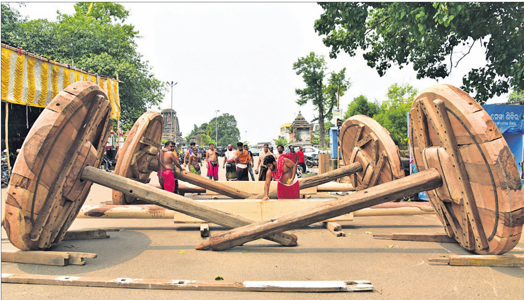
ଶ୍ରାମିକମାନଙ୍କ ମହାପ୍ରଭୁଙ୍କ ରୁକ୍ଷଣା ଯାତ୍ରା ପାଇଁ ରବିବାର ରଥ ନିର୍ମାଣ ନିମନ୍ତେ ଅଖ ଅନୁକୂଳ କରାଯାଇଛି ।

କଳାକାର ଜିଲ୍ଲା ଚିତଳାଗଡ଼ ଉପକାରାଗାରରୁ ୨ ବିଚାରାଧୀନ କର୍ମଚାରୀ ଜେଲ ବାଡ଼ି ଡେଇଁ ଫେରାର ହୋଇଯିବାର କିଛି ଦିନ ମଧ୍ୟରେ ଉଦ୍‌ବିଗ୍ନ କଳାକାର ଜିଲ୍ଲା ଭବାନୀପାଟଣାସ୍ଥିତ ଜିଲ୍ଲା ମୁଖ୍ୟ କାରାଗାରରେ ଅନୁରୂପ ଘଟଣା ଘଟିଛି । ସକାଳୁ ବଗିଚା କାମ କରୁଥିବା ସମୟରେ ୨ ବିଚାରାଧୀନ ବନ୍ଦୀ ଜେଲ ପାଟେରି ଡେଇଁ ଫେରାର ହୋଇଥିବା ଜେଲ ସୁପରିଣ୍ଡେଣ୍ଡେଣ୍ଟ ସୂଚନା ଦେଇଛନ୍ତି । ତେବେ ଜେଲ କର୍ତ୍ତୃପକ୍ଷଙ୍କ ଅବହେଳାରୁ ବିଚାରାଧୀନ ବନ୍ଦୀମାନେ ଫେରାର ହୋଇଯିବାରେ ସମର୍ଥ ହେଉଛନ୍ତି । ସୂଚନା ଯେ, ଫେରାର ୨ ବନ୍ଦୀ ହେଲେ ସିକନ୍ଦର ଜାଲ ଓ ନାକମଣି ବିଭାର । ସେମାନଙ୍କ ମଧ୍ୟରୁ ଜଣେ ନୂଆପଡ଼ାର, ଅନ୍ୟ ଜଣେ ଧର୍ମଗଡ଼ ଅଞ୍ଚଳର ବୋଲି ଜଣାପଡ଼ିଛି । ଉଭୟ ଯୋକ୍ତସୋ ପୃଷ୍ଠା-୪