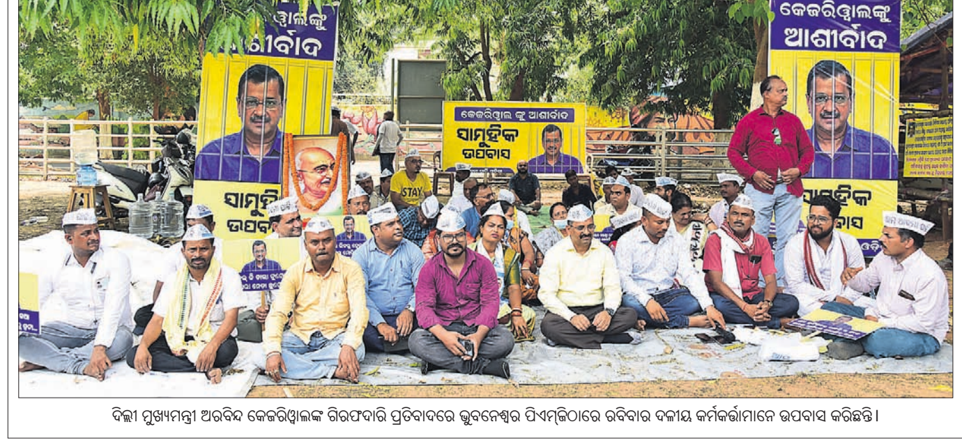
ଦିଲ୍ଲୀ ମୁଖ୍ୟମନ୍ତ୍ରୀ ଅରବିନ୍ଦ କେଜରିୱାଲଙ୍କ ଗିରଫଦାରି ପ୍ରତିବାଦରେ ଭୁବନେଶ୍ୱର ପିଏମ୍‌ସିଠାରେ ରବିବାର ଦଳୀୟ କର୍ମଚାରୀମାନେ ଉପବାସ କରିଛନ୍ତି।