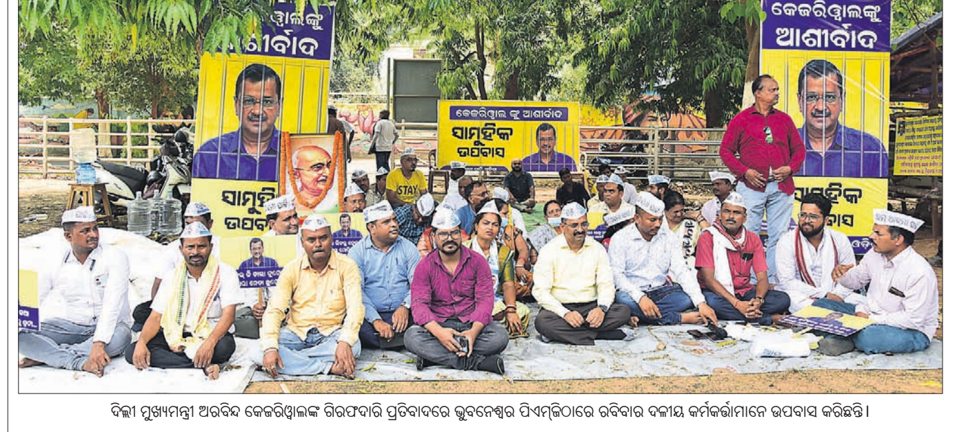
ଦିଲ୍ଲୀ ମୁଖ୍ୟମନ୍ତ୍ରୀ ଅରବିନ୍ଦ କେଜ୍ରିୱାଲଙ୍କ ଗିରଫଦାରି ପ୍ରତିବାଦରେ ଭୁବନେଶ୍ୱର ପିଏମ୍‌ସିଠାରେ ରବିବାର ଦଳୀୟ କର୍ମଚାରୀମାନେ ଉପବାସ କରିଛନ୍ତି।