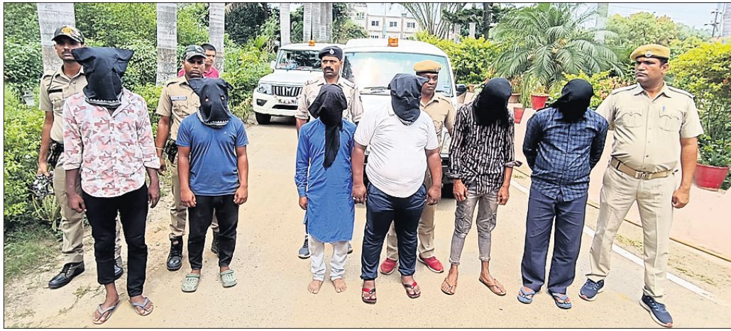
ଅଭିଯୁକ୍ତମାନଙ୍କୁ କୋର୍ଟଚାଲାଣ କରାଯାଉଛି ।