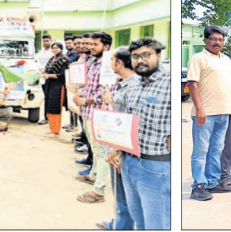
ଗୁଡ଼ାରିରେ ବିଡିଓ ଭୋଟର ସଚେତନତା ରଥର ଶୁଭାରମ୍ଭ କରୁଛନ୍ତି ।

ରାୟଗଡ଼ା ଜିଲ୍ଲା ଗୁଡ଼ାରିରେ କାଳବୈଶାଖୀ ପ୍ରଭାବରେ ରବିବାର ବର୍ଷାରେ ଏଠାରେ ପାଣି ଜମି ରାସ୍ତାରେ ଯାତାୟତ ନିମନ୍ତେ ଅସୁବିଧା ସୃଷ୍ଟି ହୋଇଛି । ଗୁମ୍ଫାପୁର ପ୍ରଶାସନ ଏ ଦିଗରେ ବଂଶଧାରୀ ସେତୁ ନିକଟରେ ରାସ୍ତାର ଅବସ୍ଥା ଶୋଚନୀୟ ହୋଇପଡ଼ିଛି । ଏହି