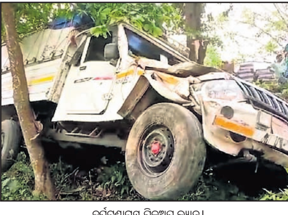
ଭୁବନେଶ୍ୱରସ୍ଥ ପିକ୍‌ଅପ୍ ଭ୍ୟାନ ।