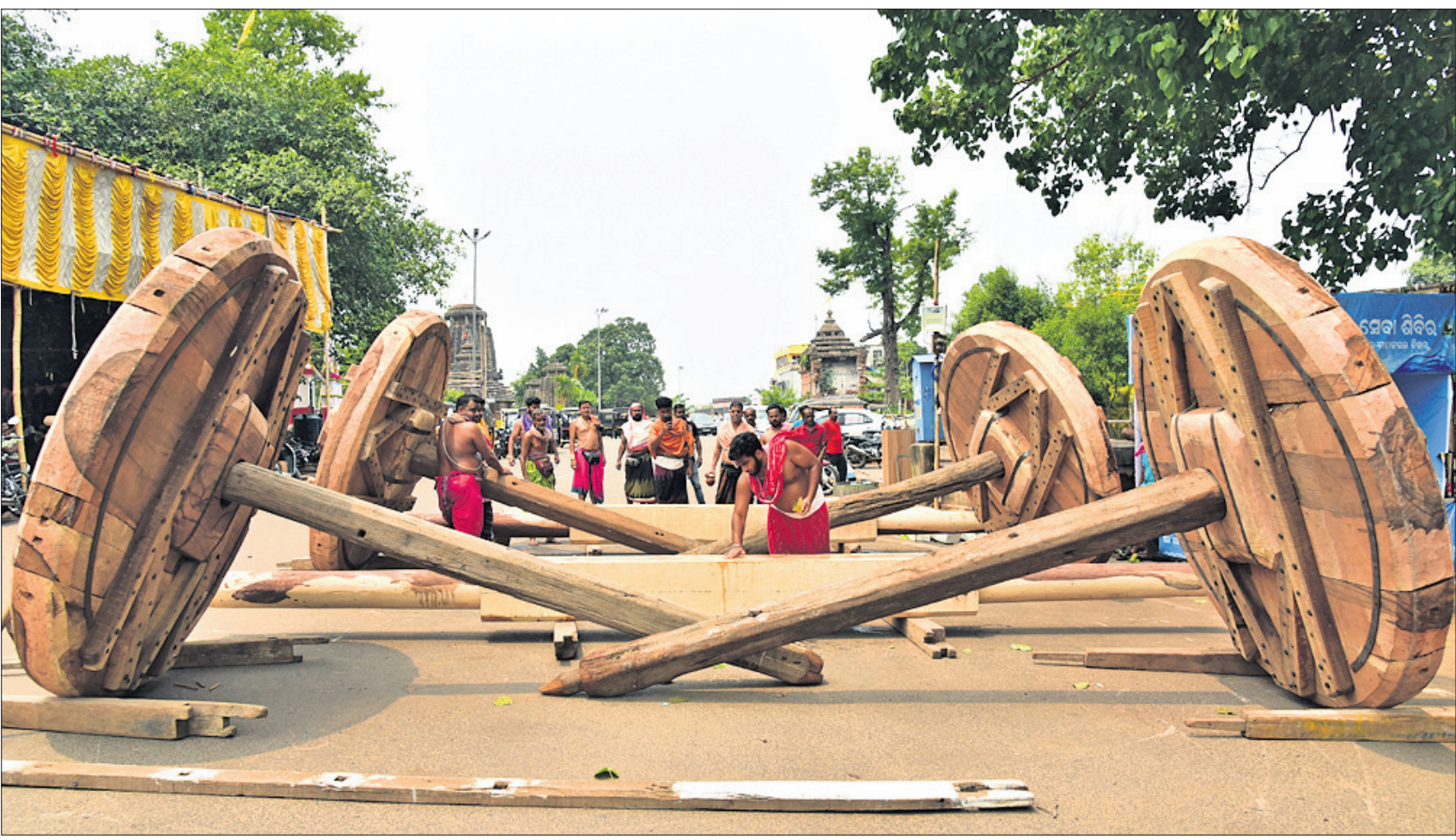
ଶ୍ରୀଲିଙ୍ଗରାଜ ମହାପ୍ରଭୁଙ୍କ ରୁକ୍ମଣୀ ଯାତ୍ରା ପାଇଁ ରବିବାର ରଥ ନିର୍ମାଣ ନିମନ୍ତେ ଅଖ ଅନୁକୂଳ କରାଯାଇଛି ।

କଳାକାର ଜିଲ୍ଲା ଚିତ୍ତଲାଗଡ଼ ଉପକାରାଗାରରୁ ୨ ବିଚାରାଧୀନ କର୍ମଚାରୀ ଜେଲ ବାଡ଼ି ଫେରାର ହୋଇଥିବାର ଜଣା ପଡ଼ିଥିବା ପରେ ଗିରଫ କରାଯାଇଥିବା ଜଣା ପଡ଼ିଛି । ଭବାନୀପାଟଣାସ୍ଥିତ ଜିଲ୍ଲା ମୁଖ୍ୟ କାରାଗାରରେ ଅନୁରୂପ ଘଟଣା ଘଟିଛି । ସକାଳୁ ବନ୍ଦୀ କାମ କରୁଥିବା ସମୟରେ ୨ ବିଚାରାଧୀନ ବନ୍ଦୀ ଜେଲ ପାଟେରି ତଳେ ଫେରାର ହୋଇଥିବା ଜେଲ ସୁପରିଣ୍ଡେଣ୍ଡେଣ୍ଟ ସୂଚନା ଦେଇଛନ୍ତି । ତେବେ ଜେଲ କର୍ତ୍ତୃପକ୍ଷଙ୍କ ଅବହେଳାରୁ ବିଚାରାଧୀନ ବନ୍ଦୀମାନେ ଫେରାର ହୋଇଥିବାର ସମର୍ଥ ହେଉଛି । ସୂଚନା ଯେ, ଫେରାର ୨ ବନ୍ଦୀ ହେଲେ ସିକନ୍ଦର ଜାଲ ଓ ନାକମଣି ବିଭାର । ସେମାନଙ୍କ ମଧ୍ୟରୁ ଜଣେ ନୂଆପଡ଼ାର, ଅନ୍ୟ ଜଣେ ଧର୍ମଗଡ଼ ଅଞ୍ଚଳର ବୋଲି ଜଣାପଡ଼ିଛି । ଉଭୟ ଯୋକ୍ତସା ପୃଷ୍ଠା-୪