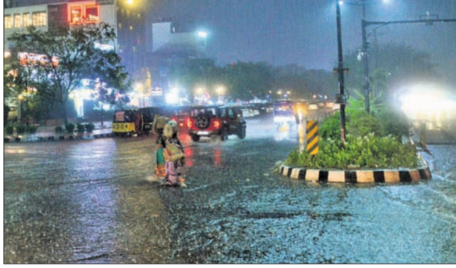
ରବିବାର ସନ୍ଧ୍ୟାରେ ଭୁବନେଶ୍ୱରରେ ବର୍ଷା ।

ନ ଥିଲେ । ଏପରିସ୍ଥିତିରେ ବଜ୍ରପାତ ଝଡ଼ବର୍ଷା ଓ ପାଗରେ ପରିବର୍ତ୍ତନ ଚିନ୍ତା ବଜ୍ରପାତ । ରାଜ୍ୟର ବିଭିନ୍ନ ସ୍ଥାନରେ ବଜ୍ରପାତ ହୋଇଥିବାବେଳେ ବାଲେଶ୍ୱରରେ ୩ ପର୍ଯ୍ୟଟକ ଗୁରୁତର ଆହତ ହୋଇଥିବା ସୂଚନା ମିଳିଛି ।