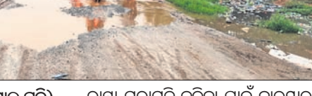
ଗୁଡ଼ାରି, ୭/୪ (ପ୍ରମୋଦ କୁମାର ପତି)

ରାୟଗଡ଼ା/ଗୁମ୍ଫାପୁର/ଗୁଡ଼ାରି, ୭/୪ (ପ୍ରମୋଦ କୁମାର ପତି)