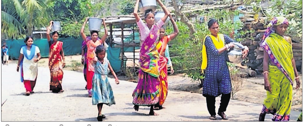
ମହିଳାମାନେ ଝରଣାକୁ ପାଣି ସଂଗ୍ରହ କରି ଆଣୁଛନ୍ତି ।

ଗ୍ରାମପୁରୁ ଆରମ୍ଭରୁ ରାୟଗଡ଼ା ଜିଲ୍ଲାରେ ପାନୀୟ ଜଳ ସଙ୍କଟ ଉତ୍ତମ ହେବାରେ ଲାଗିଛି । ସାଧାରଣତଃ ୭୫ ବର୍ଷ ପରେ ଆଜି ବି ରାୟଗଡ଼ା ଜିଲ୍ଲାର ଅନେକ ଗ୍ରାମରେ ଲୋକେ ବିଶୁଦ୍ଧ ପାନୀୟ ଜଳ ପାଇପାରୁନାହାନ୍ତି । ଏପରିକି ଜାତୀୟ ରାଜପଥ କଡ଼ରେ ରହିଥିବା ପଞ୍ଚାୟତ ମହକୁମାର ଗ୍ରାମପୁରୁରେ ମଧ୍ୟ ପହଞ୍ଚି ପାରୁନି ପାନୀୟ ଜଳର ବ୍ୟବସ୍ଥା । ଫଳରେ ଗ୍ରାମବାସୀ ନିକଟରେ ଥିବା ଝରଣା ପାଣି ବ୍ୟବହାର କରିବାକୁ ବାଧ୍ୟ ହେଉଛନ୍ତି । ଦୂଷିତ ପାଣି ବ୍ୟବହାର କରି ବିଭିନ୍ନ ରୋଗରେ ପୀଡ଼ିତ ହେଉଥିବା ଗ୍ରାମର ଲୋକେ ଅଭିଯୋଗ କରିଛନ୍ତି । ପାନୀୟ ଜଳ ସମସ୍ୟା ନେଇ ବହୁବାର ପଞ୍ଚାୟତସଭା ଆରମ୍ଭ କରି ପ୍ରଶାସନିକ ଅଧିକାରୀ ଓ ଲୋକ ପ୍ରତିନିଧିଙ୍କୁ ଜଣାଇଥିଲେ ମଧ୍ୟ କିଛି ପୁଫଳ ମିଳୁ ନ ଥିବା ଗ୍ରାମବାସୀ କହିଛନ୍ତି । ଏଭଳିକି ବିରୁଦ୍ଧ