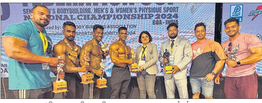
ଓଡ଼ିଶାର ପଦକ ବିଜୟୀ ପ୍ରତିଯୋଗୀମାନେ ପୁରସ୍କାର ସହ କର୍ମକର୍ତ୍ତାଙ୍କ ସମ୍ମୁଖରେ।