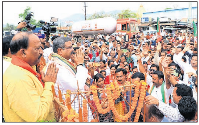
ରେଡ଼ାଖୋଲରେ ଦଳୀୟ ନେତା ଓ କର୍ମକର୍ତ୍ତା ଗହଣରେ ଧର୍ମେନ୍ଦ୍ର ପ୍ରଧାନ।

ରେଡ଼ାଖୋଲ, ୮୪ (ଅଭ୍ୟୁତ୍ଥାନ ସୁଭୋଦିତ) ପୂର୍ବ ନିର୍ଦ୍ଧାରିତ କାର୍ଯ୍ୟକ୍ରମ ଅନୁଯାୟୀ ସୋମବାର ରେଡ଼ାଖୋଲ ଛକରେ କେନ୍ଦ୍ରମନ୍ତ୍ରୀ ଧର୍ମେନ୍ଦ୍ର ପ୍ରଧାନ ପହଞ୍ଚିବା ପରେ ଶତାଧିକ ଦଳୀୟ କର୍ମକର୍ତ୍ତା ବାଣୀ ପୁସ୍ତକ ଚାଳୁସ୍ୱାଗତ କରିଥିଲେ। ସେଠାରୁ କର୍ମକର୍ତ୍ତାଙ୍କ ସହ ଯାଇ ସେ ବସ୍ତ୍ରାଶୁରେ ଥିବା ସଭକବି ଭାମ ଭୋଇଙ୍କ ପ୍ରତିମୂର୍ତ୍ତିରେ ମାଲ୍ୟାପର୍ଣ୍ଣ କରିଥିଲେ। ପରେ ରେଡ଼ାଖୋଲର ଆରାଧ୍ୟ ଦେବତା ପଞ୍ଚଖଣ୍ଡା ମନ୍ଦିର ଓ ରାମ ମନ୍ଦିରକୁ ଯାଇ ପୂଜାର୍ଚ୍ଚନା କରିଥିଲେ। ପରେ କଲେକ ଛକ ନିକଟ ବିଜୁ ପଟ୍ଟନାୟକ କଲ୍ୟାଣ ମଠପଠାରେ ଦଳୀୟ କର୍ମକର୍ତ୍ତାଙ୍କୁ ମନ୍ତ୍ର ଦେଇ ପ୍ରଧାନମନ୍ତ୍ରୀଙ୍କ ବିକାଶ ଓ ମୋଦି ଗ୍ୟାଭେଣ୍ଟିଭ ଲୋକଙ୍କ ନିକଟରେ