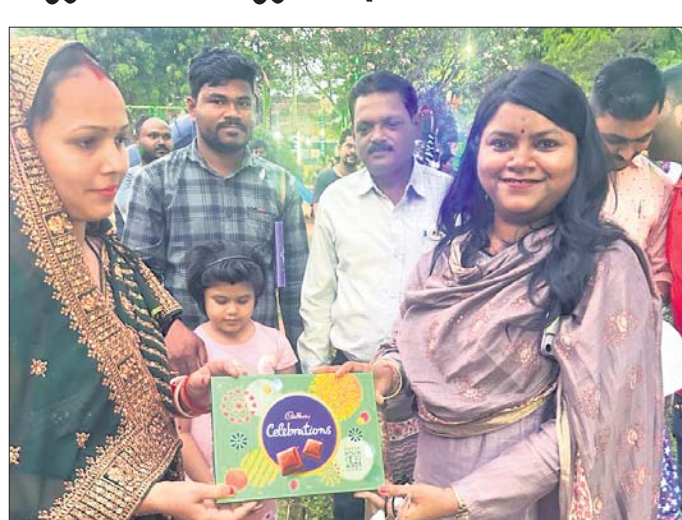
ଜଣେ ମହିଳା ପ୍ରତିଯୋଗୀଙ୍କୁ ପୁରସ୍କୃତ କରାଯାଇଛି।

ମୟୂରଭଞ୍ଜ ଜିଲ୍ଲା ସଦର ମହକୁମା ବାରିପଦାଠାରେ ନିର୍ବାଚନ କମିଶନଙ୍କ ନିର୍ଦ୍ଦେଶ କ୍ରମେ ମୁକ୍ତ ଭୋଟରଙ୍କ ମଧ୍ୟରେ ନିର୍ବାଚନ ସମ୍ପର୍କିତ ସଚେତନତା ଏବଂ ମତଦାନ ପ୍ରକ୍ରିୟାକୁ ନେଇ ପ୍ରଶାସନ ପକ୍ଷରୁ ତତକ୍ଷଣାତ୍ ସାଧାରଣଜ୍ଞାନ ପରୀକ୍ଷା ବା ଇନଷ୍ଟାଣ୍ଟ କୁଇଜ୍ ପ୍ରତିଯୋଗିତା ଅନୁଷ୍ଠିତ ହୋଇଛି। କୁଇଜ୍ ଦିନ ସନ୍ଧ୍ୟା ସମୟରେ ସହରର ପାର୍କ କ୍ଷେତ୍ର ମନୋରଞ୍ଜନ ସ୍ଥାନମାନଙ୍କରେ ଏହି କୁଇଜ୍ ପ୍ରତିଯୋଗିତା ଅନୁଷ୍ଠିତ ହେଉଛି। ଜିଲ୍ଲା ପ୍ରଶାସନ ଏବଂ ବାରିପଦା ପୌରପାଳିକା ଦ୍ୱାରା ଆୟୋଜିତ ଏହି ପ୍ରଞ୍ଚାଳନା କାର୍ଯ୍ୟକ୍ରମରେ ସାନ ପିଲାଙ୍କଠାରୁ ଆରମ୍ଭ କରି ବୟୋଜ୍ୟେଷ୍ଠ ବ୍ୟକ୍ତିମାନେ ମଧ୍ୟ ଅଂଶଗ୍ରହଣ କରୁଛନ୍ତି। ମତଦାନ ନାଗରିକଙ୍କର ମୌଳିକ ଅଧିକାର। ଏହି ବିଷୟକୁ ଜନାଦୃତ କରିବାପାଇଁ ବାରିପଦାସ୍ଥିତ ଶିଶୁ ପାଠକଠାରେ କୁଇଜ୍ ପ୍ରତିଯୋଗିତା କରାଯାଇଥିଲା। ବାରିପଦା ପୌରପାଳିକା କାର୍ଯ୍ୟନିର୍ବାହୀ