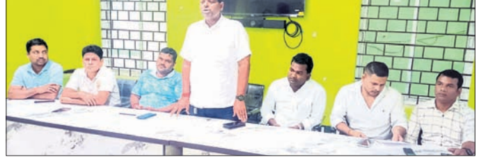
ଖବରଦାତା ସମ୍ମିଳନୀରେ ଯୋଗଦେଇଥିବା ବିଭୂ ଯୁବ ଓ ଛାତ୍ର ବିଜେଡିର ନେତୃମଣ୍ଡଳ ।

ପାରାଦୀପ ନିର୍ବାଚନ ମଣ୍ଡଳୀରେ ବିଧାୟକ ପ୍ରାର୍ଥୀଙ୍କୁ ନେଇ ବିଜେଡିରେ ଗୋଷ୍ଠୀ କନ୍ଦକ ଦେଖାଦେଇଛି । ଗୋଟିଏ ଗୋଷ୍ଠୀ ଚଳିତ ନିର୍ବାଚନରେ ବିଧାୟକ ସମିତି ରାଉତରାୟଙ୍କୁ ପୁନର୍ବାର ବିଜେଟ ନ ଦେବା ପାଇଁ ଦାବି କରୁଥିବାବେଳେ ସୋମବାର ସମ୍ମାନରେ ଯୁବ ବିଜେଡି ଓ ଛାତ୍ର ବିଜେଡି ପକ୍ଷରୁ ଏକ ଖବରଦାତା ସମ୍ମିଳନୀ ଡକାଯାଇ ବିଧାୟକଙ୍କୁ ସମର୍ଥନ କରିଛନ୍ତି । ଏଥିସହ ତାଙ୍କୁ ବିରୋଧ କରୁଥିବା ଅସଫଳ କର୍ମୀମାନଙ୍କୁ ସମାଲୋଚନା କରିଥିଲେ । ଜଗତ୍ ସିଂହପୁର ଜିଲ୍ଲା କୁଳଙ୍ଗ ପଞ୍ଚାୟତ ସଭାଗୃହରେ ଆୟୋଜିତ ଏହି ଖବରଦାତା ସମ୍ମିଳନୀରେ ପାରାଦୀପ ନିର୍ବାଚନ ମଣ୍ଡଳୀ ଯୁବ ବିଜେଡି ସଭାପତି