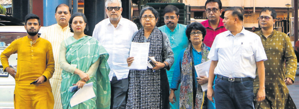
ଟିଏମ୍‌ସି ନେତାମାନଙ୍କ ୧୦ ଜଣିଆ ପ୍ରତିନିଧି ଦଳ ନିର୍ବାଚନ କମିଶନର ଅଧିକାରୀଙ୍କୁ ଭେଟିବା ପରେ ଫେରୁଛନ୍ତି।