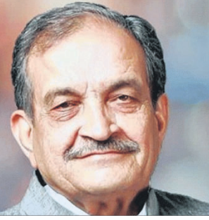
ନୂଆଦିଲ୍ଲୀ, ୮୪: ପୂର୍ବତନ କେନ୍ଦ୍ରମନ୍ତ୍ରୀ ବୀରେନ୍ଦ୍ର ସିଂ ସୋମବାର ଭାଜପା ଛାଡ଼ିଛନ୍ତି। ସେ ଖୁବ୍‌ଶୀଘ୍ର କଂଗ୍ରେସରେ ପୁନର୍ବାର ଯୋଗଦେବେ ବୋଲି ଜଣାଯାଇଛି। ମାସେ ପୂର୍ବରୁ ତାଙ୍କ ପୁଅ ତ୍ରିକେନ୍ଦ୍ର ସିଂ ଲୋକ ସଭା ଏବଂ ଭାଜପାକୁ ଛାଡ଼ିଛନ୍ତି। ସେ ଖୁବ୍‌ଶୀଘ୍ର କଂଗ୍ରେସରେ ପୁନର୍ବାର ଯୋଗଦେବେ ବୋଲି ଜଣାଯାଇଛି। ମାସେ ପୂର୍ବରୁ ତାଙ୍କ ପୁଅ ତ୍ରିକେନ୍ଦ୍ର ସିଂ ଲୋକ ସଭା ଏବଂ ଭାଜପାକୁ ଛାଡ଼ିଛନ୍ତି। ସେ ଖୁବ୍‌ଶୀଘ୍ର କଂଗ୍ରେସରେ ପୁନର୍ବାର ଯୋଗଦେବେ ବୋଲି ଜଣାଯାଇଛି।

ଭାଜପା ଛାଡ଼ିଲେ ପୂର୍ବତନ କେନ୍ଦ୍ରମନ୍ତ୍ରୀ ବୀରେନ୍ଦ୍ର ସିଂ