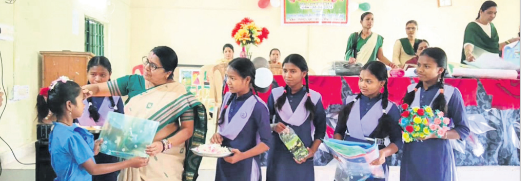
ପ୍ରଧାନ ଶିକ୍ଷୟତ୍ରୀ ଛାତ୍ରୀମାନଙ୍କୁ ଉପହାର ଦେଉଛନ୍ତି ।

ନବରଙ୍ଗପୁର ଜିଲ୍ଲା ଚେନ୍ଦୁଳିଖୁଣ୍ଟି ବ୍ଲକ୍ ଖାତିଗୁଡ଼ାରେ ଗ୍ରାମ୍ୟ ଜଳଯୋଗଣ ଓ ପରିମଳ ବିଭାଗ ପକ୍ଷରୁ ବସୁଧା ଯୋଜନାରେ ପଞ୍ଚ ହାଉସ୍ ଗୃହ ନିର୍ମାଣ କରାଯାଇଛି । ମୋଟର ଲାଗିବା ସହ ଓଭର ହେବ ଟାଙ୍କି ମଧ୍ୟ ରହିଛି । ପାଣି ଟାଙ୍କି ଅଛି, ମୋଟର ଗାଢ଼ୁଛି, ମୋଟର ଟାଙ୍କି ନିରୂପ ଅଛି କିନ୍ତୁ କୌଣସି ବ୍ୟାପରେ ପାଣି ବାହାରୁନାହିଁ । ନୂତନ ବାରଞ୍ଚପଦର, ଖାତିଗୁଡ଼ା ଗ୍ରାମରେ