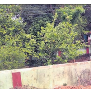
ବସୁଧା ଯୋଜନା ଆଣ୍ଡେଇଛି ବର୍ଷ ତମାମ ଜଳକଣ୍ଠ ଦେଖୁବାକୁ ମିଳିଛି ଏହି ବ୍ଲକ୍ ଖାତିଗୁଡ଼ାରେ । ଚୋପେ ପିଇବା ପାଣି ଲାଗି ଗାଁ ଲୋକେ କଳବଳ ହେଉଛନ୍ତି । ଏବେ ପ୍ରଚଣ୍ଡ ଗୋଟୁଟାପ ସହ ଉତ୍କଳ ପାନୀୟ ଜଳ ସମସ୍ୟାରେ ଅଞ୍ଚଳବାସୀ ଛବଟ ହେଉଛନ୍ତି । ପରଜାତବାନପଦର ପଞ୍ଚାୟତ ଖାତିଗୁଡ଼ା ଉପର ଶିବ ମନ୍ଦିର ନିକଟରେ ଥିବା ପାଣି ଟାଙ୍କି ଦୀର୍ଘ ବର୍ଷ ହେଲା ଅଟକ ହୋଇପଡ଼ିଛି । ବହୁ ଦିନ ଅଟକ ରହିବା ଦ୍ୱାରା ଭିତରେ ଅନାବନା ଗଛ ମାଡ଼ିବା ସହ ବିଷାକ୍ତ କାଟ ବସା ବାନ୍ଧିଥିବା ଓ ଘାଣ୍ଟିରେ ପାଣି ବାହାରୁନାହିଁ । ନୂତନ ବାରଞ୍ଚପଦର, ଖାତିଗୁଡ଼ା ଗ୍ରାମରେ

ନବରଙ୍ଗପୁର ଜିଲ୍ଲା ଚେନ୍ଦୁଳିଖୁଣ୍ଟି ବ୍ଲକ୍ ଖାତିଗୁଡ଼ାରେ ବସୁଧା ଯୋଜନାରେ ପଞ୍ଚ ହାଉସ୍ ଗୃହ ଅଛି । ୨ଟି ମୋଟର ଲାଗିଛି । ଓଭର ହେବ ଟାଙ୍କି ଅଛି । କିନ୍ତୁ ବ୍ୟାପରେ ପାଣି ନାହିଁ । ପାନୀୟ ଜଳ ସମସ୍ୟା ସମ୍ପର୍କରେ ବାରମ୍ବାର ଅଭିଯୋଗ କରିବା ପରେ ୨ଟି ପର୍ଯ୍ୟାୟରେ ଅର୍ଥ ଦ୍ୟୟ କରି ଗ୍ରାମ୍ୟ ଜଳ ଯୋଗଣ ଓ ପରିମଳ ବିଭାଗ ଏହି ସବୁ ନିର୍ମାଣ ଗ୍ରାମ କରିଛି । କିନ୍ତୁ ଫଳ ଶୁନ । ଖାତିଗୁଡ଼ା ଗ୍ରାମର କୌଣସି ବ୍ୟାପରେ ପାଣି ବାହାରୁ ନ ଥିବା ଗ୍ରାମବାସୀ ଅଭିଯୋଗ କରିଛନ୍ତି ।