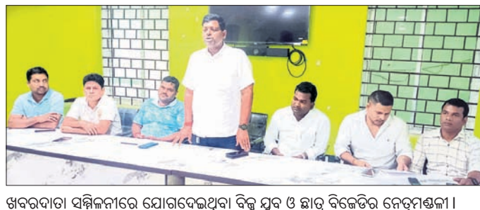
ଖବରଦାତା ସମ୍ମିଳନୀରେ ଯୋଗଦେଇଥିବା ବିଭୁ ଯୁବ ଓ ଛାତ୍ର ବିଜେଡିର ନେତୃମଣ୍ଡଳୀ ।