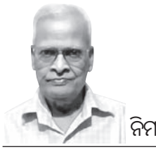
ନିମାଇଁ ଚରଣା ଲୋକା

ଏନ୍‌ସିଇଆରଟି ଓ ସିବିଏସଇ ଶିକ୍ଷା ବ୍ୟବସ୍ଥାରେ ଭାରତର ଭବିଷ୍ୟତ ପିଢ଼ି ସୃଷ୍ଟି କରିବାରେ ଏକ ଶୁଭ ଉଦ୍ଦେଶ୍ୟ ରହିଛି ବୋଲି ମନେହୁଏ ନାହିଁ। ବରଂ ଧାରଣା ସୃଷ୍ଟି ହେଉଛି ଯେ, ପ୍ରତ୍ୟେକ ବର୍ଷ ପାଠ୍ୟପୁସ୍ତକ ବଦଳାଇ ଭାରତର ଭବିଷ୍ୟତ ସାଙ୍ଗରେ କେନ୍ଦ୍ର ସରକାରଙ୍କ ମାନବ ସମ୍ବଳ ମନ୍ତ୍ରଣାଳୟର ଏହି ବିଭାଗଗୁଡ଼ିକ ଖେଳୁଛନ୍ତି।