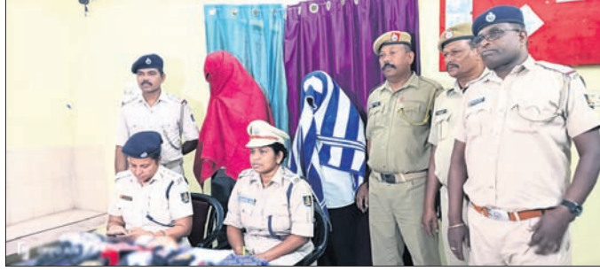
ଗିରଫ ୨ ଅଭିଯୁକ୍ତ ସମ୍ପର୍କରେ ଏକତ୍ର ପଠା ହେଉଛି।

ସୁନା ଶଙ୍ଖ ଦେବାକୁ କହି ଜଣେ ବ୍ୟକ୍ତିଙ୍କଠାରୁ ୪.୩୫ ଲକ୍ଷ ୦ କେଇ ଦେବାକୁ କହିଥିବା ୨୦ କେଇ ଯୋଗଦାନୀ କୋରାପୁଟ ସଦର ଥାନା ପୋଲିସ ଠାରୁ ଜବତ ହୋଇଛନ୍ତି।