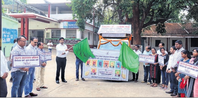
ଭୋଟର ସଚେତନତା ରଥକୁ ଜିଲ୍ଲାପାଳ ଉଦ୍ଘାଟନ କରୁଛନ୍ତି।

ମତଦାନ ନେଇ ପ୍ରଥମେ ଦସ୍ତଖତ କରି ଏକ ଦସ୍ତଖତ ଅଭିଯାନର ମଧ୍ୟ ଆରମ୍ଭ କରିଥିଲେ। ସୁଚନାଯୋଗ୍ୟ, ଆସନ୍ତା ମେ ୧୩ରେ କୋରାପୁଟ ଜିଲ୍ଲାରେ ନିର୍ବାଚନ ହେବ।