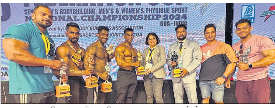
ଓଡ଼ିଶାର ପଦକ ବିଜୟୀ ପ୍ରତିଯୋଗୀମାନେ ପୁରସ୍କାର ସହ କର୍ମକର୍ତାଙ୍କ ଗହଣରେ।