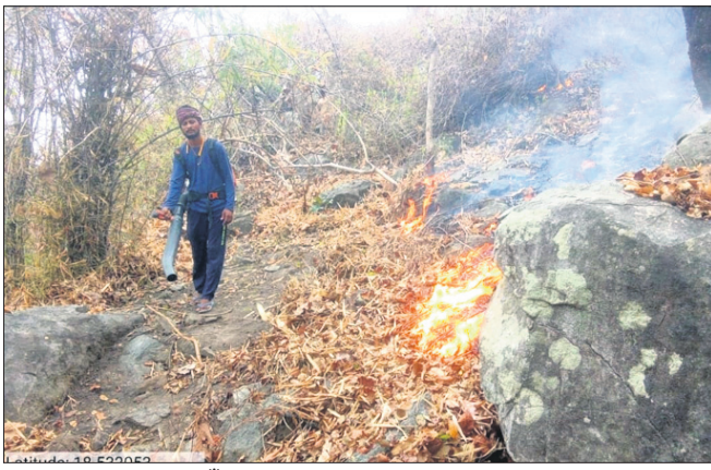
ଜଙ୍ଗଲରେ ଲାଗିଥିବା ନିଆଁ ।

କରିବା ସହ ଏହା ହେଲେ କି କି ଅପୁରୁଷା ହେବ ସେନେଇ ସଚେତନ କରାଉଥିଲେ ମଧ୍ୟ ଲୋକେ ତାହା ଭୁଲି ପୁଣି ନିଆଁ ଲଗାଉଛନ୍ତି । ନିଆଁ ଲିଭାଇବା ପାଇଁ ମାଥୁଲି ବନ କର୍ମଚାରୀ ନାକେଦମା ହେଲେଣି । ରାତିତମାମ ଜଙ୍ଗଲରେ ନିଆଁ ଛୁଟୁ ଛୁଟୁ ହୋଇ ଜଳୁଥିବା ବେଳେ କେଉଁ ଘାଣ୍ଟି ଯାଇ ନିଆଁ ଲିଭାଇବେ ତାହା ସମସ୍ୟା ହେଉଛି । ଜିଲାର ଏବେ ସମଗ୍ର ବନାଞ୍ଚଳରେ ଜଙ୍ଗଲ ଜଳୁଛି । ଜନ ଜୀବନ ଅସୁବିଧା ହେଲେଣି ଲୋକେ ଘରୁ ପଦାକୁ ବାହାରିବା କଷ୍ଟକର ହୋଇପଡ଼ିଛି । ସେପଟେ ଜଙ୍ଗଲ ଜଳୁଥିବା ବେଳେ ଦିନରେ ସହରରେ ଗ୍ରୀଷ୍ମ ପ୍ରବାହରେ ନିଆଁ ବାହାଉଛି । ୧୦ଟା ପରେ ଲୋକେ ଘରୁ ବାହାରକୁ ବାହାରିବା ନାହିଁ । ଦେବାନ ବନ୍ଦର ମଧ୍ୟ ଏକ ପ୍ରକାର ବନ୍ଦ ହୋଇଯାଇଛି ।