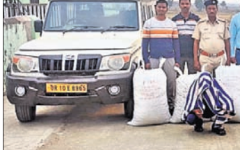
ଜବତ ଗଞ୍ଜେଇ ସହ ଗିରଫ ଅଭିଯୁକ୍ତ ।