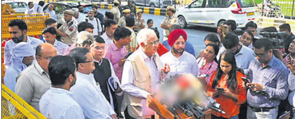
ନିର୍ବାଚନ କମିଶନରେ ଫେରାଦ ହେବା ପରେ ବରିଷ୍ଠ କଂଗ୍ରେସ ନେତା ସଲମାନ ଖୁସିଦି ଗଣମାଧ୍ୟମକୁ ସୂଚନା ଦେଉଛନ୍ତି।