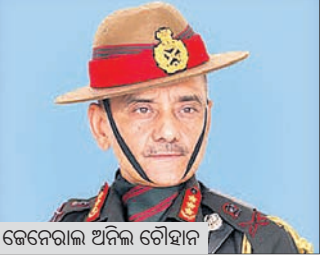
ଜେନେରାଲ ଅନିଲ ଚୌହାନ

ସଶସ୍ତ୍ର ବଳରେ ମିଳିତ କାର୍ଯ୍ୟ ସଂସ୍କୃତିର ବିକାଶ ପାଇଁ ଚିପ୍ ଅଫ୍ ଡିଫେନ୍ସ ଷ୍ଟ୍ରାଟ୍ (ସିଡିଏସ୍) ଜେନେରାଲ ଅନିଲ ଚୌହାନ ସୋମବାର ଆହ୍ଲାଦ ଦେଇଛନ୍ତି। ରାଷ୍ଟ୍ରର ସମୂହ ଯୁଦ୍ଧ ଲଢ଼ିବା ସାମର୍ଥ୍ୟ ବଦ୍ଧାଉଥିବା ତାହା ସୃଷ୍ଟି ହେବା ପ୍ରତି ସାହଜୀବ ସାମର୍ଥ୍ୟରେ