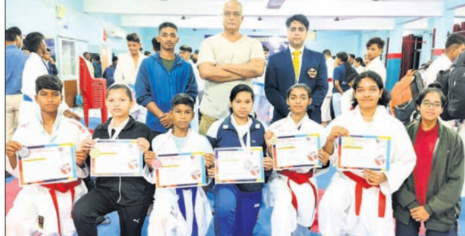
କୃତିତ୍ୱ ଅର୍ଜନ କରିଥିବା କରାଟେକାମାନେ।

ହେଲେ ଫୁଲିଆକୁ ସେ ପାଇପାରେ ନାହିଁ। ପରେ କରନ ମାଓବାଦୀ ସଙ୍ଗଠନରୁ ବୃତ୍ତେଇ ଯାଏ। ଏକାକି ଏକ କାହାଣୀକୁ ଯୋଜନା ହୋଇଛି ସେଥିରେ କରନର ପ୍ରେମିକା ଫୁଲିଆ ଗାଁକୁ ଆସୁଛି।