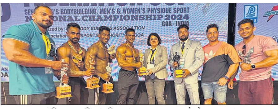
ଓଡ଼ିଶାର ପଦକ ବିଜୟୀ ପ୍ରତିଯୋଗୀମାନେ ପୁରସ୍କାର ସହ କର୍ମକର୍ତାଙ୍କ ସମ୍ମାନରେ।

ସଂକ୍ଷିପ୍ତ ସ୍ୱାଲର କୋଲକାତା ନାଇଟ୍ ରାଇଡର୍ସ ୨୦ ଓଭରରେ ୧୩୭/୯ (ଶ୍ରେୟସ୍ ଆୟର-୩୪, ସୁନୀଲ ନାରିନ୍-୨୭, ଅଜିତ୍ କୁମାର ରାୟ-୨୪, ରବୀନ୍ଦ୍ର ଜାଡେଜା-୧୮, ଚୁଷ୍ଟାର ଦେଶପାଣ୍ଡେ-୩/୩୩, ପ୍ରସାଦ୍ କୁମାର ରହମାନ-୨/୨୨, ମହେଶ୍ ଥୁକ୍ତା-୧/୨୮)। ଚେନାଇ ସୁପର କିଙ୍ଗ୍ସ ୧୨.୪ ଓଭରରେ ୧୪୧/୩(ରତ୍ନରାଜ ଗାଏକ୍ୱାଡ-୬୭, ଶିବପ ଦୁବେ-୨୮, ତାରିଲ୍ ମିଚେଲ-୨୫, ଦେଭଦ ଅରୋରା-୨/୨୮, ସୁନୀଲ ନାରିନ୍-୧/୩୦)।