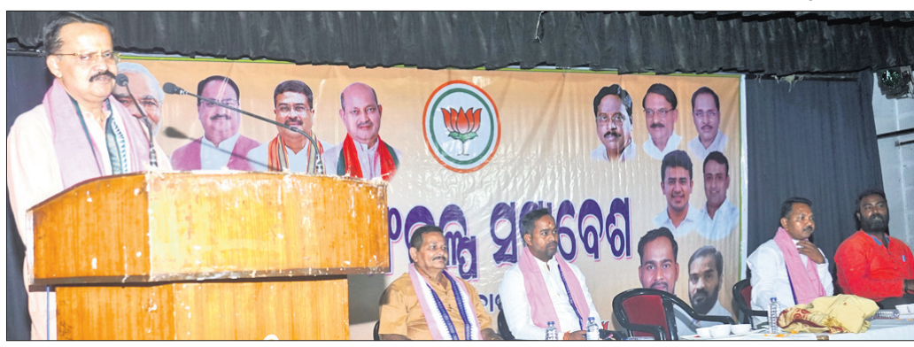
ସମାବେଶରେ ଲୋକ ସଭା ପ୍ରାର୍ଥୀ ଭର୍ତ୍ତୃହରି ମହତାବ ବକ୍ତୃତା ଦେଉଛନ୍ତି ।