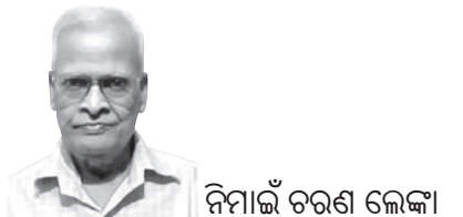
ନିମାଇଁ ଚରଣା ଲୋକା

ଏନ୍‌ସାଇଆରଟି ଓ ସିବିଏସ୍‌ଇ ଶିକ୍ଷା ବ୍ୟବସ୍ଥାରେ ଭାରତର ଭବିଷ୍ୟତ ପିଢ଼ି ସୃଷ୍ଟି କରିବାରେ ଏକ ଶୁଭ ଉଦ୍ଦେଶ୍ୟ ରହିଛି ବୋଲି ମନେହୁଏ ନାହିଁ । ବରଂ ଧାରଣା ସୃଷ୍ଟି ହେଉଛି ଯେ, ପ୍ରତ୍ୟେକ ବର୍ଷ ପାଠ୍ୟପୁସ୍ତକ ବଦଳାଇ ଭାରତର ଭବିଷ୍ୟତ ସାଙ୍ଗରେ କେନ୍ଦ୍ର ସରକାରଙ୍କ ମାନବ ସମ୍ବଳ ମନ୍ତ୍ରଣାଳୟର ଏହି ବିଭାଗଗୁଡ଼ିକ ଖେଳୁଛନ୍ତି ।