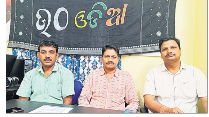
ଖବରଦାତା ସମ୍ମିଳନୀରେ ସଂକଳ୍ପ ଯାତ୍ରା ସମ୍ପର୍କରେ ସୂଚନା ଦେଇଛନ୍ତି।