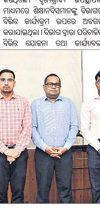
ଆଇଏଏସ୍ ଶିକ୍ଷାନୁସଙ୍ଗ ଉନ୍ନୟନ ସମ୍ମିଳନୀର ବିଭାଗ ପରିଦର୍ଶନ।