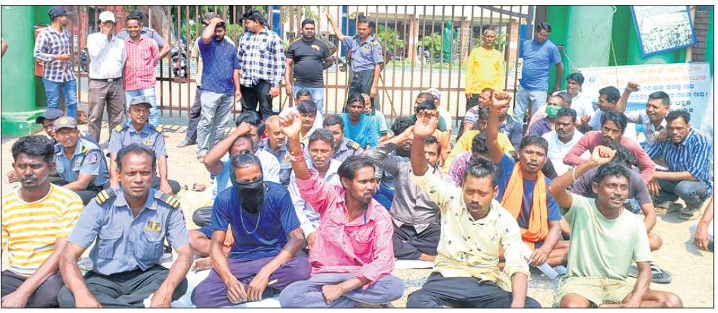
ବକେୟା ଦରମା ପ୍ରଦାନ ଦାବିରେ କଟକ ମହାନଗର ନିଗମ କାର୍ଯ୍ୟାଳୟ ସମ୍ମୁଖରେ ସୋମବାର କର୍ମଚାରୀମାନେ ବିକ୍ଷୋଭ କରୁଛନ୍ତି ।

କଟକ, ୮୪ (କାର୍ତ୍ତିକ ସାହୁ) କଟକ ମହାନଗର ନିଗମ (ସିଏମ୍‌ସି) ପକ୍ଷରୁ ନିୟୋଜିତ ଏକ ନିର୍ଦ୍ଦିଷ୍ଟ ଠିକା ସଂସ୍ଥା ଅଧୀନରେ କାର୍ଯ୍ୟ କରୁଥିବା କର୍ମଚାରୀଙ୍କୁ ସମ୍ପୂର୍ଣ୍ଣ ସଂସ୍ଥା ଠକ୍କଣା ମାଧ୍ୟମରେ