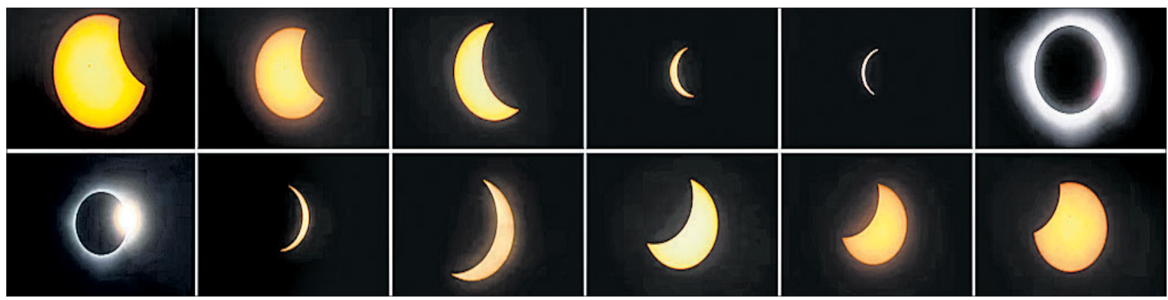
ସୋମବାର ରାତିରେ ସୂର୍ଯ୍ୟୋପରାଗ ଆରମ୍ଭରୁ ଶେଷ ପର୍ଯ୍ୟନ୍ତ ମେକ୍ସିକୋର ମାକାଭୁଲାନ୍ସରେ ନିଆଯାଇଥିବା ଫଟୋ ।