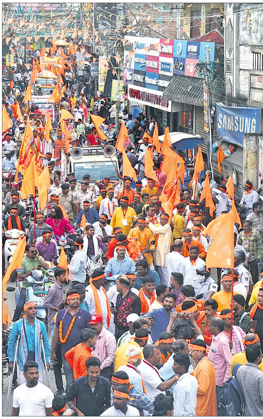
ହିନ୍ଦୁ ରାଷ୍ଟ୍ରୀୟ ନବବର୍ଷ ମହୋତ୍ସବ ପାଳନ ଅବସରରେ ସୋମବାର କଟକ ପିଠାପୁର ମଦନ ମୋହନ ମନ୍ଦିର ନିକଟରୁ ବାହାରିଥିବା ଶୋଭାଯାତ୍ରା ସହର ପରିକ୍ରମା କରୁଛି।

କରିବା ପରେ ଇଡି ଚାକ୍ସ ରିଟ୍‌ପଦାଧିକାରୀ ଚ୍ୟାଲେଞ୍ଜ କରିଥିଲେ। ରିମାଣ୍ଡ ଅବଧିରେ ହେବା ପରେ ରାଉଲ୍ ଆଭେନ୍ୟୁ କୋର୍ଟ ଚାକ୍ସ ଏପ୍ରିଲ ୧୫ ପର୍ଯ୍ୟନ୍ତ ବିଚାରବିଭାଗୀୟ ହାଜରକୁ ପଠାଇଥିଲେ। କେନ୍ଦ୍ରିତ୍ୱାଳ ନିଜ ରିଟ୍‌ପଦାଧିକାରୀ ଏବଂ ଇଡି ରିମାଣ୍ଡକୁ ହାଇକୋର୍ଟରେ ଚ୍ୟାଲେଞ୍ଜ କରିଥିଲେ। ଅନୁପ୍ରାପ୍ତ ଭାବେ ଚାକ୍ସ ରିଟ୍‌ପଦାଧିକାରୀ ଚ୍ୟାଲେଞ୍ଜ କରି ଆଉ ଏକ ରିଟ୍ ପିଟିଶନ୍ ମଧ୍ୟ ଦାଖଲ ହୋଇଥିଲା। କିଷ୍କିନ୍ଦ୍ ସ୍ୱରାଜାକାନ୍ତ ଶର୍ମା କେନ୍ଦ୍ରିତ୍ୱାଳଙ୍କ ଆବେଦନର ଶୁଣାଣି କରି କହିଛନ୍ତି, ଇଡି ନିକଟରେ 'ପର୍ଯ୍ୟାୟ ପ୍ରମାଣ' ରହିଛି, ଯାହାକୁ ନେଇ ଏକ୍ସିସ୍ ଚାକ୍ସ ରିଟ୍‌ପଦାଧିକାରୀ ଏହି ପ୍ରମାଣ ବଳରେ ଚକ କୋର୍ଟ ଇଡିକୁ ରିମାଣ୍ଡ ଅନୁମତି ଦେଇଥିଲେ। ରିମାଣ୍ଡକୁ ବେଆଇନ ଦର୍ଶାଯାଇପାରିବ ନାହିଁ ବୋଲି ୨୫ ମିନିଟ୍ ଧରି ରାୟ ଶୁଣାଇବା ବେଳେ ବିଚାରପତି ଶର୍ମା କହିଥିଲେ। କିଷ୍କିନ୍ଦ୍ ଶର୍ମା ଆହୁରି କହିଥିଲେ, ଅପାଲଟ କେନ୍ଦ୍ରିତ୍ୱାଳଙ୍କ ଜାମିନ ଆବେଦନର ଶୁଣାଣି କରି ନାହାନ୍ତି, ବରଂ ରିଟ୍‌ପଦାଧିକାରୀ ଚ୍ୟାଲେଞ୍ଜ କରି ସେ ଦାଖଲ କରିଥିବା ରିଟ୍ ପିଟିଶନ ଉପରେ ଏହି ରାୟ ଦେଇଛନ୍ତି। ଆଇନ ସମାନ ଭାବେ ସମସ୍ତ ଅପାଲଟରେ ଲାଗୁ ହୋଇଥାଏ। କୋର୍ଟରୁଟିକ ରାଜନୈତିକ ନୈତିକତା ପରିବର୍ତ୍ତେ ସାମ୍ପାଦିକ ନୈତିକତାକୁ ଗୁରୁତ୍ୱ ଦେଇଆଣ୍ଡି। ଲୋକ ସଭା ନିର୍ବାଚନରେ କେନ୍ଦ୍ରିତ୍ୱାଳ ପ୍ରଚାର କରାଇ ନ ଦେବା ପାଇଁ ଚାକ୍ସ ରିଟ୍‌ପଦାଧିକାରୀ ବୋଲି ଆର୍. ଦାମ୍ ପକ୍ଷରୁ କୁହାଯାଇଛି। ଏହାକୁ ନେଇ ଆଇନଗତ ପ୍ରକ୍ରିୟା ଉଲ୍ଲେଖ ହୋଇ ନ ଥିବା ଦର୍ଶାଇ ଅପାଲଟ ଉକ୍ତ ଆବେଦନକୁ ଖାରଜ କରିଦେଇଛନ୍ତି। କେନ୍ଦ୍ରିତ୍ୱାଳ ହାଇକୋର୍ଟଙ୍କ ରାୟକୁ ସୁପ୍ରିମକୋର୍ଟରେ ଚ୍ୟାଲେଞ୍ଜ କରିବେ ବୋଲି ଆର୍. ଆର୍. ଦାମ୍ ପାର୍ଟି (ଆପ୍) ପକ୍ଷରୁ କୁହାଯାଇଛି। ଗତ ମାର୍ଚ୍ଚ ୧୧ରେ ହାଇକୋର୍ଟ କେନ୍ଦ୍ରିତ୍ୱାଳଙ୍କୁ ସୁରକ୍ଷା ଦେବାକୁ ମନା