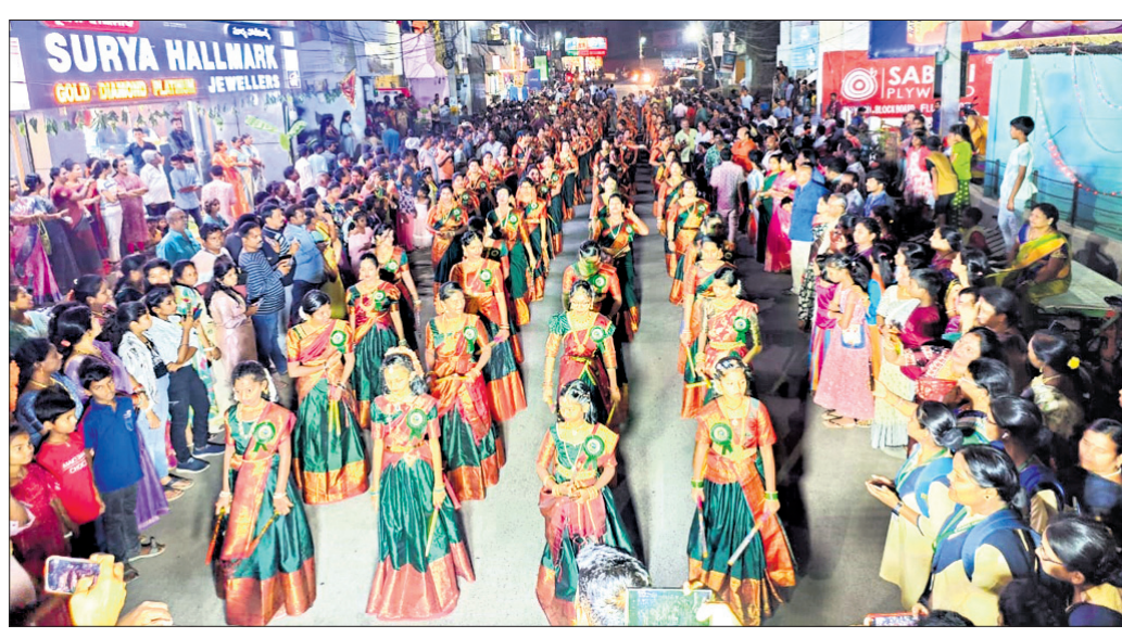
ଉତ୍ସାହୀ ଉତ୍ସବ ପାଳନ ଅବସରରେ ଗୁଣପୁର କନକା ପରମେଶ୍ୱରୀ ମନ୍ଦିରଠାରେ ମହିଳାଙ୍କ ଦ୍ୱାରା ଦାଣ୍ଡିଆ ନୃତ୍ୟ ପରିବେଷଣ କରାଯାଇଛି ।