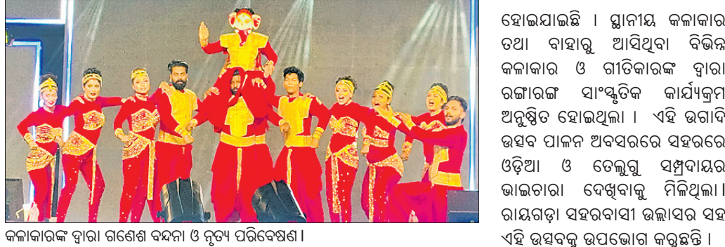
କଳାକାରଙ୍କ ଦ୍ୱାରା ଗଣେଶ ବନ୍ଦନା ଓ ନୃତ୍ୟ ପରିବେଷଣ ।