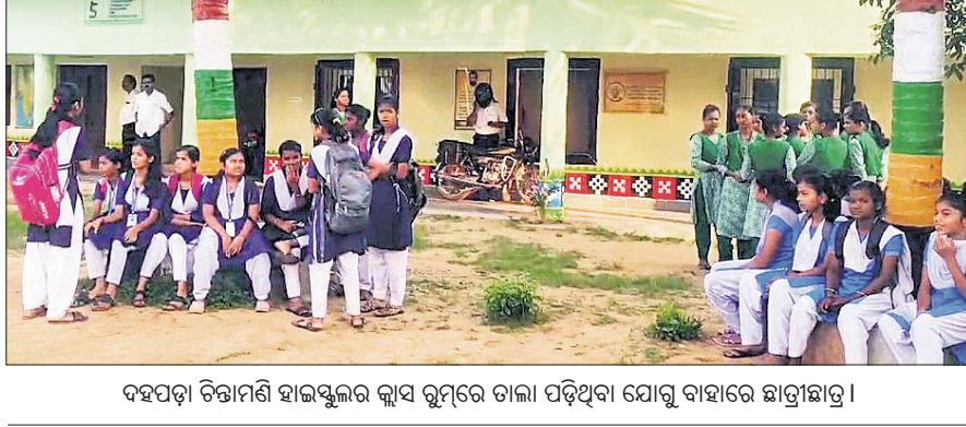
ଦହପଡ଼ା ବିତ୍ତାମଣି ହାଇସ୍କୁଲର କ୍ଲାସ ରୁମ୍‌ରେ ତାଲା ପଡ଼ିଥିବା ଯୋଗୁ ବାହାରେ ଛାତ୍ରାଛାତ୍ରୀ।

ନ ଥିବାରୁ ଠିକାଦାର ଅସନ୍ତୋଷ ପ୍ରକାଶ କରିବା ସହ ମଙ୍ଗଳବାର ସ୍କୁଲ ଗୃହରେ ତାଲା ପକାଇ ଦେଇଥିଲେ। ଅଷ୍ଟମ, ନବମ ଏବଂ ଦଶମ ଶ୍ରେଣୀର ଛାତ୍ରାଛାତ୍ରୀମାନେ ଆସି ବାହାରେ ଭୁଲିବା ସହ ଶିକ୍ଷକମାନେ ବାହାରେ ଛିଡ଼ା ହୋଇଥିଲେ। ଖବର ପାଇ ଗ୍ଲାମାୟ ଏବିଡିଓ, କୁଳ ଆସିଷ୍ଟଣ୍ଟ