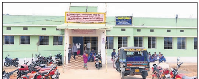
ରାୟଗଡ଼ା ଜିଲ୍ଲା କାଶୀପୁର ବ୍ଲକ୍ ଚିକିତ୍ସା ନୂତନ ପ୍ରାଥମିକ ସ୍ୱାସ୍ଥ୍ୟକେନ୍ଦ୍ରରେ କର୍ମଚାରୀ ଅଭାବରୁ ରାତି ସମୟରେ ରୋଗୀ ସ୍ୱାସ୍ଥ୍ୟସେବାକୁ ବଞ୍ଚିତ ହେଉଥିବା ଅଭିଯୋଗ ହେଉଛି ।