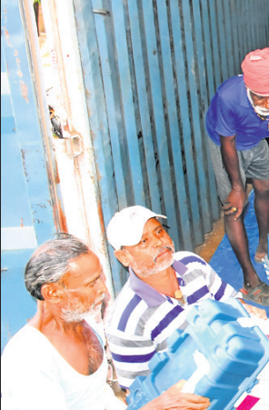
ଭୁବନେଶ୍ୱର, ୧୦।୪(ଅସମାପିକା ସାହୁ)

ଚଳିତ ଏକକ ସାଧାରଣ ନିର୍ବାଚନକୁ ସ୍ୱଳ୍ପ, ଅବାଧ ଓ ନିରାପେକ୍ଷ କରିବା ନିମନ୍ତେ ଖୋର୍ଦ୍ଧା ଜିଲ୍ଲା ପ୍ରଶାସନ ପକ୍ଷରୁ ବ୍ୟାପକ ବନ୍ଦୋବସ୍ତ କରାଯାଇଛି। ଏନେଇ ଜିଲ୍ଲା ପ୍ରଶାସନର ପ୍ରଭୃତି ଦୃଢ଼ାନ୍ତ ପର୍ଯ୍ୟାୟରେ ପହଞ୍ଚିଛି। ନିର୍ବାଚନରେ ବ୍ୟବହାର ହେବାକୁ ଥିବା ଇତିଏମ୍ (ଇଲେକ୍ଟ୍ରୋନିକ୍ ଭୋଟିଂ ମେଶିନ) ଓ ଭିଭିପିଏଟି ମେଶିନ ଖୋର୍ଦ୍ଧାସ୍ଥିତ ପଣ୍ୟାଗାରକୁ ବିକେଟି ସ୍ୱୟଂଶାସିତ ମହାବିଦ୍ୟାଳୟରେ ହୋଇଥିବା ସ୍ତାଲୁମ୍‌ରେ ପହଞ୍ଚିଛି। ଏହି ଇତିଏମ୍‌ଗୁଡ଼ିକୁ କଡ଼ା ସୁରକ୍ଷା ମଧ୍ୟରେ ଏଠାକୁ ଅଣାଯାଇଛି। ଏହାକୁ ୨୪ ଘଣ୍ଟିଆ ସୁରକ୍ଷା ବ୍ୟବସ୍ଥା ମଧ୍ୟରେ ରକ୍ଷାଯିବ। ସମସ୍ତ ପୋଲିସ୍ କର୍ମଚାରୀ ସ୍ତାଲୁମ୍ ସୁରକ୍ଷାରେ ମୃତୟନ ହୋଇଛନ୍ତି। ଏଥିସହ ସିସିଟିଭି ମଧ୍ୟ ବ୍ୟବସ୍ଥା କରାଯାଇଛି। ପ୍ରଥମ ପର୍ଯ୍ୟାୟ