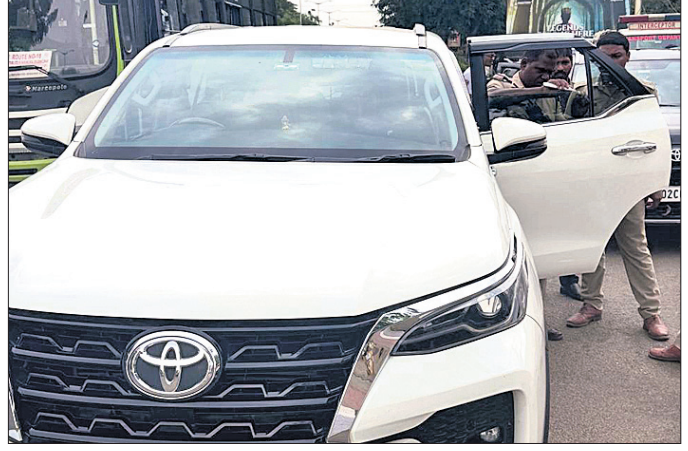
ପୋଲିସ୍ କାରରୁ କଳା କରି ବାହାର କରୁଛି।

ଗାଡ଼ିରେ କଳାକାର ଲଗାଯିବାକୁ ନେଇ ସୁପ୍ରିମକୋର୍ଟ ରୋକ୍ ଲଗାଇବା ସହ ବେଆଇନ ବୋଲି ଘୋଷଣା କରିଥିଲେ। ଏହାକୁ ବିଭିନ୍ନ ରାଜ୍ୟ ସରକାର ଲାଗୁ କରିଥିବାବେଳେ ଓଡ଼ିଶାରେ ଉଭୟ ପରିବହନ ବିଭାଗ ଓ ପୋଲିସ୍‌କୁ ଯାଞ୍ଚ କ୍ଷମତା ଦିଆଯାଇଛି। ନିୟମ ଲାଗୁ ପରେ କିଛିଦିନ ଧରି ତପୁରତା ଦେଖାଯାଇଥିଲା ଉଭୟ ବିଭାଗ। ହେଲେ ନିୟମିତ ଯାଞ୍ଚ ଓ ପକ୍ଷେପ ନ ହେବାକୁ ଗାଡ଼ି ମାଲିକମାନେ ପୁଣି ଗାଡ଼ିରେ କଳାକାର ବା କାଚରେ ସ୍ଲୁକ୍ ଫିଲ୍ଲ ବ୍ୟବହାର କରୁଥିବା ଦେଖାଯାଇଛି। ଏବେ ନିର୍ବାଚନକୁ ଦୃଷ୍ଟିରେ ରଖି କଳାକାର ଧରପଗଡ଼କୁ ଜୋରଦାର କରିଛି ପୋଲିସ୍। କଳାକାର ଯୋଗୁ ଗାଡ଼ିରେ କଳାକାରୀ ପରିବହନ ସହ ପୋଲିସ୍ ନକରକୁ ଆପରାଧିକ ତକ୍ ସତୀକାରୀର ଆଶଙ୍କା ରହିଛି। ଏହି ପରିପ୍ରେକ୍ଷାରେ ରାଜଧାନୀରେ କମିଶନରେଟ ପୋଲିସ୍ ଓ ଆରଟିଓ ପକ୍ଷରୁ ନିଜେ ଭାବେ ବିଭିନ୍ନ ସ୍ଥାନରେ ପୋଲିସ୍ ଲିଗାଯାଇଥିବା ସୂଚନା ମିଳିଛି। ଏ କଳାକାର ଲଗାଯାଇଥିବା ଗାଡ଼ିଗୁଡ଼ିକୁ ଚିହ୍ନଟ କରି ଧରିବା ସହ ଅନାମିଆଳଠାରୁ