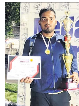
ପୁରସ୍କାର ସହ ଦୀନବନ୍ଧୁ

ସ୍ୱପ୍ନ। ଶତପୁଟ କ୍ରୀଡ଼ାରେ ଜିଲାରେ ତାଙ୍କର ନାଁ ରହିଛି। ଏଥିସହ ଦୌଡ଼, କବାଡ଼ି, ଖୋ ଖୋ, ଭରୋଭୋଲନ କ୍ଷେତ୍ରରେ ମଧ୍ୟ ସେ ପାରଙ୍ଗମ। ହେଲେ ଉପଯୁକ୍ତ ଚାଲିନ ପାଇପାଉ ନ ଥିବାରୁ ନିରାଶ ହୋଇଛନ୍ତି। ନୂଆପଡ଼ା ଗ୍ରାମର