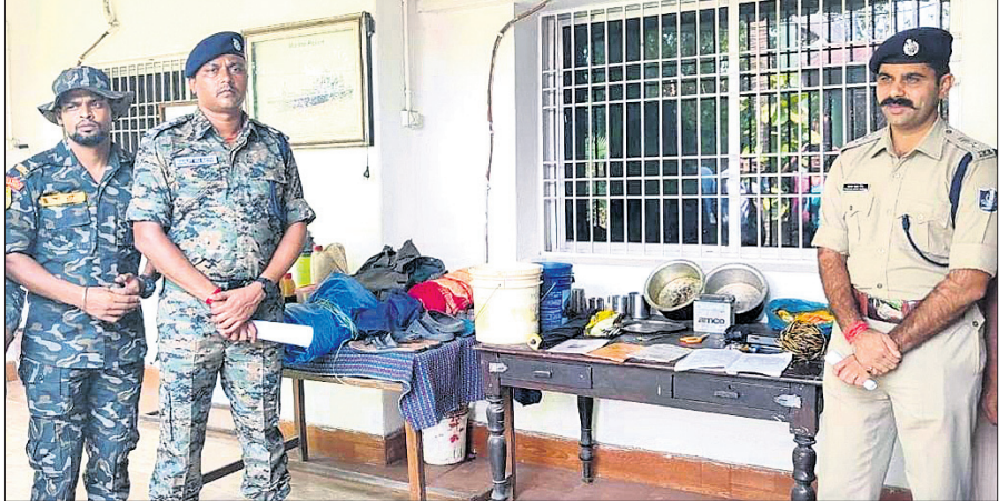
ମାଓବାଦୀ କ୍ୟାମ୍ପରୁ ଜବତ ସାମଗ୍ରୀକୁ ଏସିପି ଦେଖାଉଛନ୍ତି।

ଭୁବନେଶ୍ୱର, ୧୦।୪ (ପ୍ରେମାନନ୍ଦ ଖମାଗା) ଭରଗଡ଼ ଜିଲ୍ଲା ପାଇକମାଳ ଥାନା ଗଣମାର୍ଦ୍ଦନ ପର୍ବତରେ ସେମାନଙ୍କ ଉପସ୍ଥିତି ସାବ୍ୟସ୍ତ କରିଛନ୍ତି। ଗତ ୨ମାସ ମଧ୍ୟରେ ପୋଲିସ୍ ଏବଂ ଯବାନମାନେ କୋହି ଅପରେଶନ କରୁଥିବାବେଳେ ୨ଥର ପୁହାଁପୁହାଁ ହେବା ସହିତ ଗୁଳିବିନିମୟ ହୋଇଛି। ତେବେ ଏଥୁରେ କେହି ମୃତ୍ୟୁହତ ହୋଇ ନ ଥିବାବେଳେ ୨ମାଓବାଦୀ କ୍ୟାମ୍ପକୁ ଧ୍ୱଂସ କରିବାରେ ପୋଲିସ୍ ସକ୍ଷମ ହୋଇଛି। ଅନ୍ୟପଟେ ମାଓବାଦୀମାନେ ମଧ୍ୟ ଖସିଯିବାରେ ସଫଳ ହୋଇଥିବାବେଳେ ପୋଲିସ୍ ସେଠାରୁ ବ୍ୟବହୃତ ବିଭିନ୍ନ ସାମଗ୍ରୀ ଜବତ କରିଛି। ସାଧାରଣ ନିର୍ବାଚନ ଅବ୍ୟବହୃତ ପୂର୍ବରୁ ମାଓବାଦୀଙ୍କ ଏଭଳି ଉପସ୍ଥିତି ଓ କାର୍ଯ୍ୟକଳାପ ବର୍ତ୍ତମାନ ବିଷୟ ପାଇଛି। ନିର୍ବାଚନକୁ ପ୍ରଭାବିତ କରିବା ପାଇଁ ମାଓବାଦୀମାନେ ସେମାନଙ୍କ