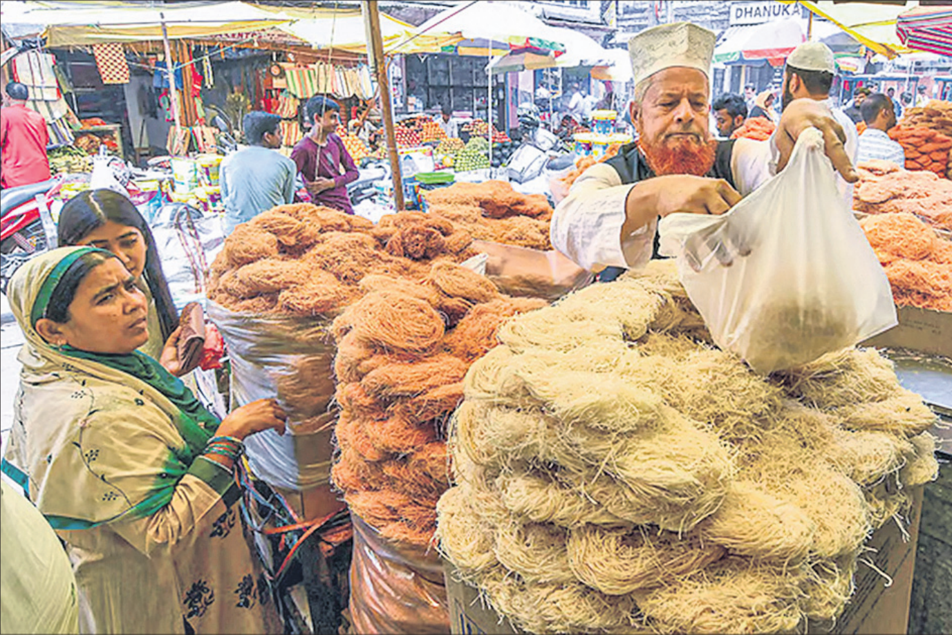
ଆଜି ଇନ୍ଦ୍ର: ଇନ୍ଦ୍ର ପର୍ବର ଅନ୍ୟବହିତ ପୂର୍ବରୁ ବୁଧବାର ଗୁଆହାଟୀର ଏକ ମାର୍କେଟରେ ମହିଳାମାନେ ଲଢ଼ା କିଣୁଛନ୍ତି।