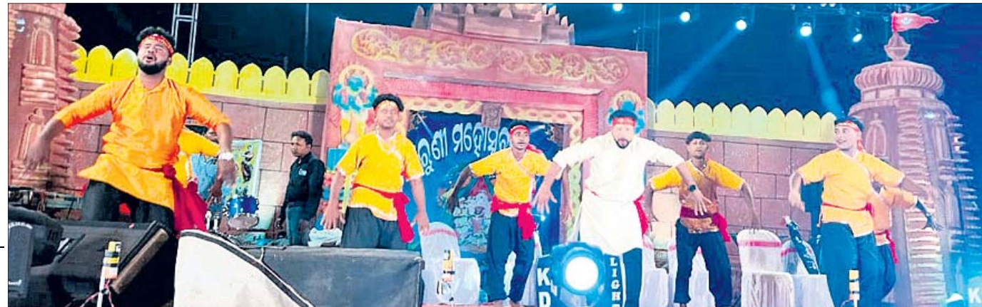
ଲହୁପୁର ବାଲୁଣୀ ମହୋତ୍ସବ ଉତ୍ସାହରେ କଳାକାରମାନେ ସାଂସ୍କୃତିକ କାର୍ଯ୍ୟକ୍ରମ ପରିବେଷଣ କରୁଛନ୍ତି ।