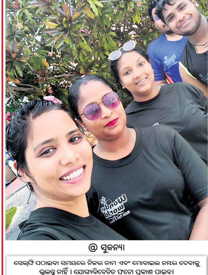
ସେଲ୍ଫି ପଠାଇବା ସମୟରେ ନିଜର ନାମ ଏବଂ ମୋବାଇଲ ନମ୍ବର ଦେବାକୁ ଭୁଲୁଛୁ ନାହିଁ । ଯୋଗ୍ୟବିବେଚିତ ପତ୍ନୀ ପ୍ରକାଶ ପାଲବ ।