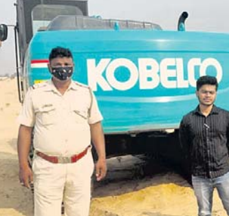
ବାଲି ଚୋରାଚାଲାଣବେଳେ ଜବତ ହୋଇଥିବା ଏସ୍ୱାଭେଟର ।

ଯାଇଛି । ଯେହେତୁ ଏହି ଦେଆଇନ ଘାଟକୁ ଯିବାରେ ଯାତାୟାତରେ ଅସୁବିଧା ଥିଲା ତେଣୁ ଟ୍ରାକ୍ଟରଗୁଡ଼ିକୁ ଧରିବା ସମ୍ଭବ ହୋଇ ନ ଥିଲା । ତେବେ ଦେଆଇନ ଭାବେ ଏସ୍ୱାଭେଟର ବ୍ୟବହାର କରାଯାଇଥିବାରୁ ଏହାକୁ ପୋଲିସକୁ ହସ୍ତାନ୍ତର ସହ ରେକର୍ଡ଼ ପରିମାଣର ଅର୍ଥାତ୍ ୨.୫ ଲକ୍ଷ ଟଙ୍କା ଜରିମାନା ଧାର୍ଯ୍ୟ କରାଯାଇଛି । ଏହି ଜରିମାନା ରାଶିକୁ ନେଇ ସାଧାରଣରେ ଆଲୋଚନା ଜୋର ଧରିଛି । ଖଣି ବିଭାଗ ଏକଲି ଚଢ଼ାଇ କାରି ରଖିବା ସହ ଜରିମାନା ଧାର୍ଯ୍ୟ କଲେ ବାଲି ଚୋରା ଚାଲାଣ ସହ ସରକାରଙ୍କ ରାଜସ୍ୱହାନି ହୋଇଛି । ମିଳିଥିବା ସୂଚନା ଅନୁଯାୟୀ ମଧ୍ୟଶାସନ ସମେତ ଏହି ବ୍ଲକ୍ ଅନ୍ୟ