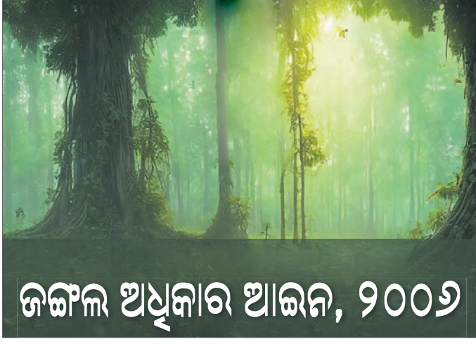
ଜଙ୍ଗଲ ଅଧିକାର ଆଇନ, ୨୦୦୬

ଦେଶର ୧୫୩ ଲୋକ ସଭା ଆସନରେ ଜଙ୍ଗଲ ଅଧିକାର ଆଇନ (ଏମ୍ଆର୍ଏ), ୨୦୦୬ ଏକ ଗୁରୁତ୍ୱପୂର୍ଣ୍ଣ ପ୍ରସଙ୍ଗ ରହିଛି। ଏଥିମଧ୍ୟରୁ ୧୦୩ ଆସନରେ ଭାଜପା ଏମ୍ପି ପ୍ରତିନିଧିତ୍ୱ କରୁଛନ୍ତି ବୋଲି ଦିଲ୍ଲୀର ସ୍ୱାଧୀନ ସଙ୍ଗଠନ ବସୁନ୍ଦରୀ ପକ୍ଷରୁ ସୂଚନା ପ୍ରକାଶିତ ଏକ ରିପୋର୍ଟକୁ ଜଣାପଡ଼ିଛି। ଏହି ଆଇନ ପ୍ରଣୟନ କରିଥିବା କଂଗ୍ରେସର ଏମ୍ପିମାନେ ୧୧ ଆସନରେ ପ୍ରତିନିଧିତ୍ୱ କରୁଛନ୍ତି। ବିଜୁ ଜନତା ଦଳ (ବିଜେଡି) ମଧ୍ୟ ୧୧ ଆସନରେ ରହିଛି। ସେହିପରି ଶିବସେନା ୬, ଭାରତ ଗଣ୍ଠ ସମିତି (ବିଆର୍ଏସ୍), ଖିଲ୍ଲାସମାଜ କଂଗ୍ରେସ ପାର୍ଟି (ଏମ୍ଏସିପି) ୪ ଆସନରେ ରହିଛନ୍ତି। ୨୦୦୬ ଡିସେମ୍ବର ୧୮ରେ ପାର୍ଲିମେଣ୍ଟରେ ଚର୍ଚ୍ଚାପତ୍ରକୁ ଜନଜାତି ଏବଂ ଅନ୍ୟ ପାରମ୍ପରିକ ଜଙ୍ଗଲ ଅଧିକାରୀ(ଜଙ୍ଗଲ ଅଧିକାର ସ୍ୱୀକୃତି) ଆଇନ ଗୃହୀତ ହୋଇଥିଲା। ଏହା ଜଙ୍ଗଲ ଅଧିକାର ଆଇନ, ଆଦିବାସୀ ବିଲ୍ ଏବଂ