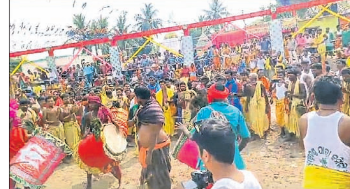
ପଞ୍ଚଦଶ ମହାମିଳନ ପର୍ବରେ ଯୋଗଦେଇଥିବା ଦଣ୍ଡୁଆ ଓ ଶୁଖାକୁ।