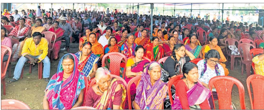
କଳିଙ୍ଗନଗରରେ ଆନ୍ଦୋଳନ ପାଇଁ ଏକାଠି ହୋଇଥିବା ବିଭିନ୍ନ ସଂଗଠନର କର୍ମକର୍ତ୍ତା, ସଭ୍ୟା ସଭ୍ୟା ।