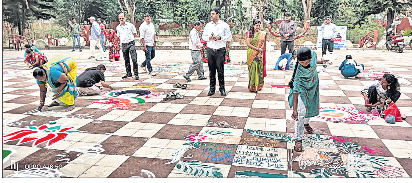
ଜିଲ୍ଲାପାଳ ଓ ଅନ୍ୟ ଅଧିକାରୀଙ୍କ ଉପସ୍ଥିତିରେ ପ୍ରତିଯୋଗୀମାନେ ଝୋଟି ପକାଉଛନ୍ତି।

କୋରାପୁଟ ଜିଲ୍ଲାରେ ଆସନ୍ତା ମେ ମାସ ୧୩ ତାରିଖରେ ସାଧାରଣ ନିର୍ବାଚନ ହେବ। ଏହି ନିର୍ବାଚନରେ ମତଦାନ ସ୍ଥାନ ବୃଦ୍ଧି ଏବଂ ନୂତନ ଭୋଟରଙ୍କୁ ଉତ୍ସାହିତ କରିବା ଉଦ୍ଦେଶ୍ୟରେ ଗୁରୁବାର ସ୍ଥାନୀୟ ସଂସ୍କୃତି ଭବନରେ ଏକ ଭୋଟର ସଚେତନତା କାର୍ଯ୍ୟକ୍ରମ ଜିଲ୍ଲା ପ୍ରଶାସନ ପକ୍ଷରୁ କରାଯାଇଛି। ମତଦାନ ଉପରେ ସଚେତନତା ସୃଷ୍ଟି ନେଇ ଝୋଟି ପ୍ରତିଯୋଗିତା ଓ ବରିଷ୍ଠ ନାଗରିକଙ୍କ ସହ ଆଲୋଚନା କରାଯାଇଥିଲା। କାର୍ଯ୍ୟକ୍ରମରେ କୋରାପୁଟ ଜିଲ୍ଲାପାଳ ଭି.କାର୍ତ୍ତିକା ଭାସନ ମୁଖ୍ୟ ଅତିଥିଭାବେ ଯୋଗଦେଇ ଝୋଟି ପ୍ରତିଯୋଗିତାର କୃତୀ ପ୍ରତିଯୋଗୀଙ୍କୁ ପୁରସ୍କୃତ କରିଥିଲେ।