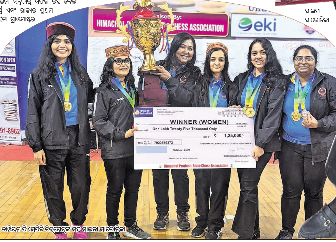
ଚାମ୍ପିୟନ ପିଏସ୍‌ପିଏ ଚିମ୍ପରେ ବହୁ ସାଇନା ସାଲୋନିକା