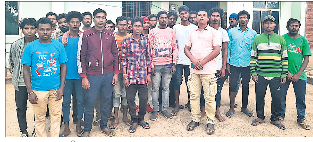
ଉଦ୍ଧାର ହୋଇଥିବା ଦାଦନ ଶ୍ରମିକ ।