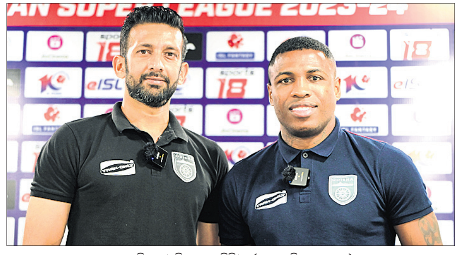
ପୂର୍ଣ୍ଣାଙ୍ଗ ସିଟି ଓ ଡିଏସିଏ ମିଶ୍ର

କାରଣ ଓଡ଼ିଶା ଏୟସ୍ ଦ୍ୱେ-ଅୟରେ ପ୍ରବେଶ କରିଥିବାବେଳେ ନର୍ଥଇଣ୍ଟ ଏଥର ସଫଳ ହୋଇନାହିଁ। ପୂର୍ଣ୍ଣାଙ୍ଗ ସିଟି ଏୟସ୍ ବିପକ୍ଷରେ