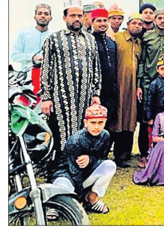
ଚନ୍ଦ୍ରହାଣ୍ଡି କବରସ୍ଥାନରେ ପ୍ରାର୍ଥନା କରିବାକୁ ଆସିଥିବା ମୁସଲିମ ଧର୍ମାବଲମ୍ବୀମାନେ।