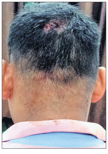
ଆକ୍ରମଣର ଶିକାର ବୁଲି ପୋଲିସ କର୍ମଚାରୀ ।