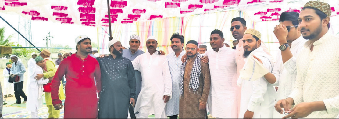
ଇଦ-ଉଲ-ଫିତରରେ ପରସ୍ପରକୁ ଆଲିଙ୍ଗନ କରି ଶୁଭେଚ୍ଛା ଜଣାଉଛନ୍ତି ।

ମାଲକାନଗିରି, ୧୧୪(ଦୁର୍ଯ୍ୟୋଧନ ପାତ୍ର) ମାଲକାନଗିରି ସଦର ମହକୁମାସ୍ଥିତ ସୁନି କାମା ମସଜିଦ୍ ଇମ୍ବୁମିୟା କମିଟି ଓ ଇଦ୍ଦାର ପୂର୍ବ ପାଳନ ମିଳିତ ଭାବେ ଇଦ୍ - ଉଲ-ଫିତର ପର୍ବ ପାଳିତ ହୋଇଯାଇଛି । ଏଥିରେ ସମସ୍ତ ପୂର୍ବକମାନ ଭାଇମାନେ ଏକତ୍ର ହୋଇ