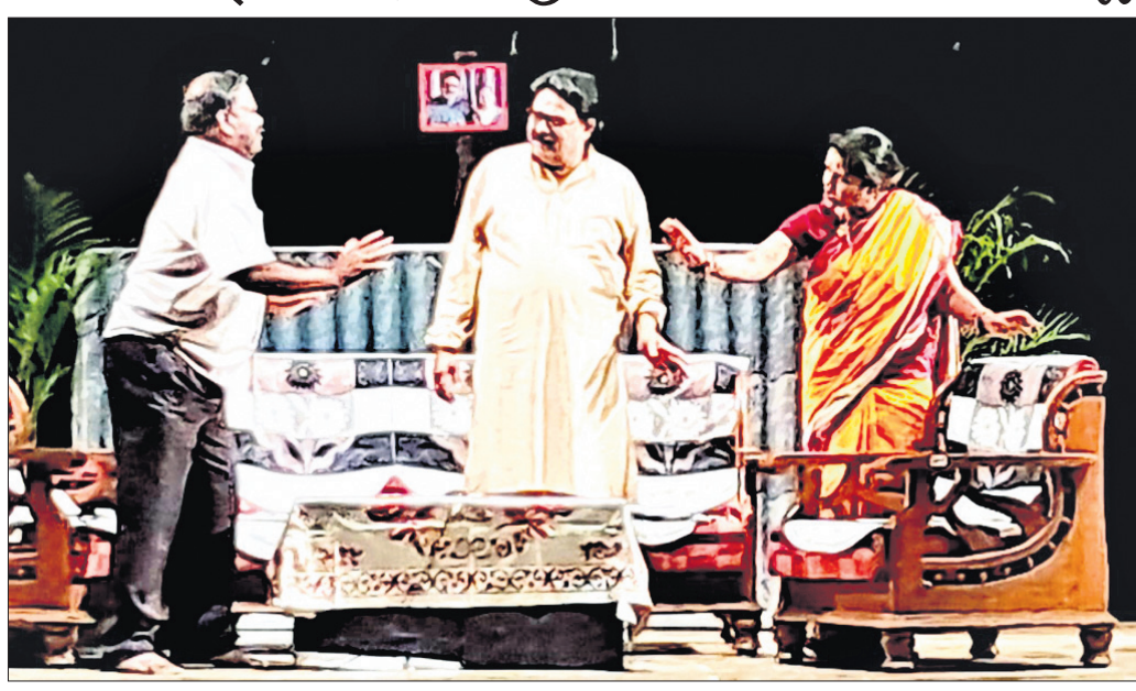
‘ବିଶ୍ୱାସର ଆତ୍ମଲିପି’ ନାଟକର ଏକ ଦୃଶ୍ୟ ।