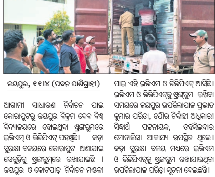
କର୍ମଚାରୀ, ୧୧/୪ (ପବନ ପାଣିଗ୍ରାହୀ)

ଆଗାମୀ ସାଧାରଣ ନିର୍ବାଚନ ପାଇଁ କୋରାପୁଟରୁ ଜୟପୁର ବିକ୍ରମ ଦେବ ଦିଶୁ ବିଦ୍ୟାଳୟରେ ହୋଇଥିବା ଷ୍ଟାଫ୍‌ରୁ ମୂଲ୍ୟରେ ଇତିସମ୍ପାଦ ଓ ଭିତ୍ତିପିଏଚ୍ ପହଞ୍ଚିଲା । କଡ଼ା ସୁରକ୍ଷା ବ୍ୟବସ୍ଥାରେ କୋରାପୁଟ ଅଣ୍ଡରଗ୍ରାଉଣ୍ଡ ସେକ୍ଟରରୁ ଷ୍ଟାଫ୍‌ରୁ ମୂଲ୍ୟରେ ଉଦ୍ଧାର ହୋଇଥିଲା । ଇତିସମ୍ପାଦ ଓ ଭିତ୍ତିପିଏଚ୍ ନିର୍ବାଚନ ମଣ୍ଡଳୀ