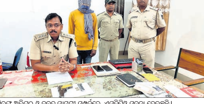
ଗିରଫ ଅଭିଯୁକ୍ତ ଓ କବଚ ସାମଗ୍ରୀ ସମ୍ପର୍କରେ ଏସ୍ପିସିଓ ସୂଚନା ଦେଉଛନ୍ତି।