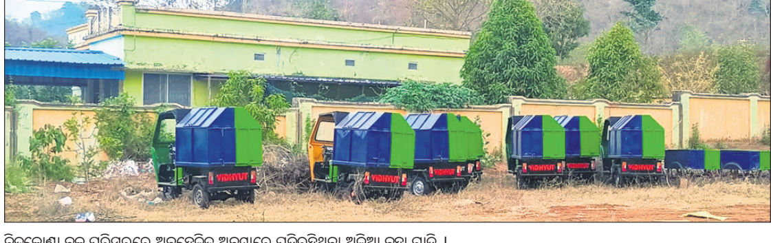
ଚିତ୍ରକୋଣ୍ଡା ବ୍ଲକ ପରିସରରେ ଅବହେଳିତ ଅବସ୍ଥାରେ ପଡ଼ିରହିବା ଅଳିଆ ବୁସ୍ତା ଗାଡ଼ି ।

ମାଲକାନଗିରି ଜିଲା ଚିତ୍ରକୋଣ୍ଡା ବ୍ଲକ ପରିସରରେ ଅବହେଳିତ ଭାବେ ପଡ଼ିରହିଛି ଅଳିଆ ସଫେଇ ଗାଡ଼ି ଓ ଟ୍ରାଲି । ଦୀର୍ଘ ବର୍ଷ ହେଲା ଚିତ୍ରକୋଣ୍ଡା ବ୍ଲକ କାର୍ଯ୍ୟକାରୀ ହେବା ସତ୍ତ୍ୱେ ମଧ୍ୟ ସହରର ସେମିତି କୌଣସି ଉନ୍ନତି ହୋଇପାରି ନାହିଁ । ପରିମଳ ବ୍ୟବସ୍ଥା ଓ ପରିବେଶ ସୁନ୍ଦର ଉପରେ ଗୁରୁତ୍ୱ ଦିଆଯାଉଛି । ଚିତ୍ରକୋଣ୍ଡା ବ୍ଲକରେ ଅଳିଆ ଆବର୍ଜନା ଉଠାଇବା ପାଇଁ ବ୍ୟାଚେରା ଚାଳିତ ଅଟେ ଓ ଚଳି ରିକ୍ତା ଯୋଗାଇ ଦିଆ ଯାଇଥିଲେ