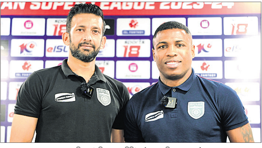
ପୂର୍ଣ୍ଣାଙ୍ଗ ସିଟି ଓ ଡିଏସ୍‌ଏଲ୍ ମ୍ୟାଚରେ

କାରଣ ଓଡ଼ିଶା ଏଫ୍ସି ପ୍ଲେ-ଅଫରେ ପ୍ରବେଶ କରିଥିବାବେଳେ ନର୍ଥଇଷ୍ଟ ଏଥର ସଫଳ ହୋଇନାହିଁ। ପୂର୍ଣ୍ଣାଙ୍ଗ ସିଟି ଏଫ୍ସି ବିପକ୍ଷରେ