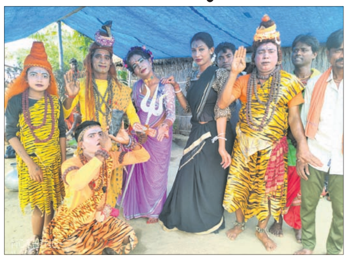
ଚଢ଼କ ଯାତ୍ରା ଅବସରରେ ଶୈବ ସମ୍ପ୍ରଦାୟ ଦଳର ନୃତ୍ୟ, ସଙ୍ଗୀତ ପରିବେଷଣ ।

ପଣା ସଂକ୍ରାନ୍ତିରେ ପାରମ୍ପରିକ ଭାବେ ଏହି ଶୈବ ସମ୍ପ୍ରଦାୟର ସଦସ୍ୟମାନେ ଚଢ଼କ ଯାତ୍ରା ପରିବେଷଣ କରି ଲୁଣା ଘେରି ଗ୍ରାମ ମନ୍ଦିର ପରିସରରେ ସମାପନ ହେବାର କାର୍ଯ୍ୟକ୍ରମ ରହିଛି । ଏହି ନୃତ୍ୟ ସଙ୍ଗୀତ ପରିବେଷଣ ବଳରେ ମନତୋଷ ପଣ୍ଡଳ, ପବିତ୍ର ମଣ୍ଡଳ, ବିଶ୍ୱଜିତ ମଣ୍ଡଳ, ଗୌରପଦ ମଣ୍ଡଳ, ହରେନ ମଣ୍ଡଳ, କୌସିକ ମଣ୍ଡଳଙ୍କ ସମେତ ମହିଳା