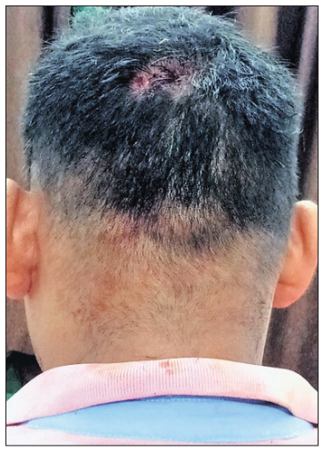
ଆକ୍ରମଣର ଶିକାର ହୁଇଁ ପୋଲିସ କର୍ମଚାରୀ ।