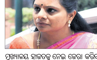
ମୁଖ୍ୟାଳୟ ହାଇଦ୍ରାବାଦରେ କେଜା କରିବା ପାଇଁ ଆପରାଧିକାରୀ ସତ୍ତ୍ୱେ ଏହା ଆକାରକୁ ଖଡ଼ୁଥିବା ସୁଲତାନ ବାଥେରୀର ନାମ ପରିବର୍ତ୍ତନ କରିବାକୁ ଦାବି କରିଛନ୍ତି।

ମନିଲଣ୍ଡର, ପ୍ରମାଣ ନଷ୍ଟ କରିବା ଏବଂ ସାକ୍ଷୀଙ୍କୁ ପ୍ରଭାବିତ କରିବାର ସମ୍ଭବ ଥିବାର ପ୍ରାରମ୍ଭିକ ଅନୁଧ୍ୟାନରୁ ଜଣାପଡ଼ିଥିବାରୁ ତାଙ୍କୁ କବିତା ଦେବାକୁ ସୋପାନର ଅଧିକାର ମନା କରିଦେଇଥିଲେ। ଦକ୍ଷିଣା ମଦ କମ୍ପାନୀଗୁଡ଼ିକ ସପକ୍ଷରେ ଅବକାରୀ ନୀତି ପ୍ରସ୍ତୁତି କରିବା ଦିଲ୍ଲୀରେ ସରକାରରେ ଥିବା ଆର୍ ଆର୍‌ଏମ୍ ପାର୍ଟିରୁ ୧୦୦ କୋଟି ଟଙ୍କା ଲାଷ୍ଟ ଦେବା ମାମଲାରେ କବିତା ଗାଳିଆଡି ନେଇ ଆଇପିସି ଏବଂ ଚୁଲ୍‌ତି ସିଦ୍ଧିଆଲ ତାଙ୍କୁ ଜେଲରେ କେଜା କରିଥିଲା। ଗିରଫ ପରେ କବିତାକୁ ସିଦ୍ଧିଆଲ ଏହାର