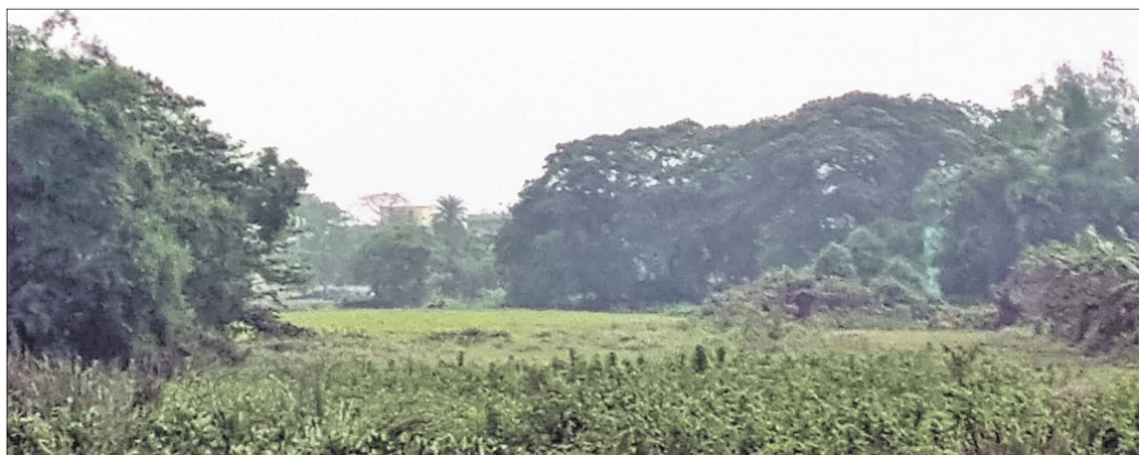
ଗୋବରୀ ନଦୀରେ ବଳ ପୂର୍ଣ୍ଣ ହୋଇଛି ।

ସେଲ୍ଫି ପଠାଇବା ସମୟରେ ନିଜର ନାମ ଏବଂ ମୋବାଇଲ ନମ୍ବର ଦେବାକୁ ଭୁଲନ୍ତୁ ନାହିଁ । ଯୋଗ୍ୟବେତନ ଫଟୋ ପ୍ରକାଶ ପାଇବ ।