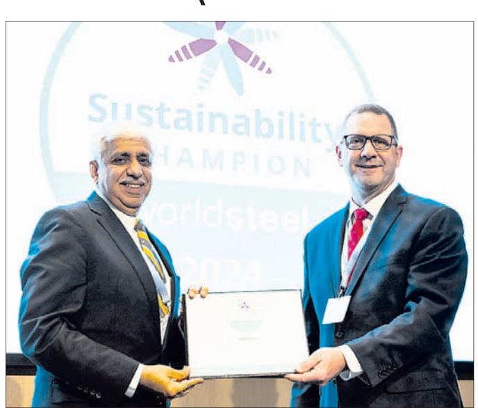
ଟାଟା ଷ୍ଟିଲର ବରିଷ୍ଠ ଅଧିକାରୀଙ୍କୁ ସଷ୍ଟେନେବିଲିଟି ଚାମ୍ପିୟନ ଫଳକ ପ୍ରଦାନ କରାଯାଇଛି ।

ଶାସନ ଅଭ୍ୟାସକୁ ପ୍ରାଥମିକତା ଦେଉଛି । ସଷ୍ଟେନେବିଲିଟି ଚାମ୍ପିୟନ ଭାବେ ଯୋଗ୍ୟତା ଅର୍ଜନ କରିବା ପାଇଁ କମ୍ପାନିରୁଦ୍ଧିକ କଠୋର ମାନବସ୍ତ୍ର ପୁରଣ କରିବା ଆବଶ୍ୟକ । ଏଥିରେ ବିଶ୍ୱସ୍ତ୍ରୀୟ ଗ୍ଲୋବ୍ ଚାର୍ଟର ସ୍ୱାକ୍ଷର କରିବା ଏବଂ ପରିବେଶ ପରିଚାଳନା, ସାମାଜିକ ଦାୟିତ୍ୱବୋଧ ଏବଂ ପ୍ରଶାସନିକ ଉତ୍କର୍ଷତା ଉପରେ ଗୁରୁତ୍ୱ ଦେଉଥିବା ନୀତି ପ୍ରତି ପ୍ରତିବଦ୍ଧତା ଅର୍ଥକ୍ଷୁଦ୍ଧ ରହିଛି । ଏହାପରେ ପଦାର୍ଥ ଦକ୍ଷତା, ପରିବେଶ ପରିଚାଳନା ପ୍ରଣାଳୀ, ଆଘାତ ପାଇଁ ସମୟ ନଷ୍ଟ ବାରମ୍ବାରତା ହାର, କର୍ମଚାରୀ ପ୍ରଶିକ୍ଷଣ, ନୂତନ ପ୍ରକ୍ରିୟା ଏବଂ ଉତ୍ପାଦରେ ପୁଞ୍ଜନବେଶ ଏବଂ ବିତରଣ ହୋଇଥିବା ଅର୍ଥନୈତିକ ମଲ୍ୟ