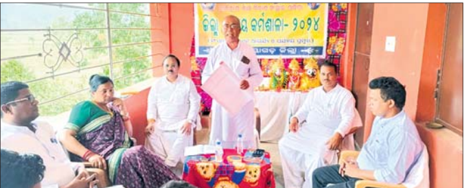
କର୍ମଶାଳାରେ ଯୋଗଦେଇଥିବା ଅତିଥି ।