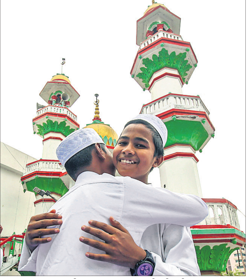
ଇଦ୍-ଉଲ-ଫିତର ଅବସରରେ ଗୁରୁବାର ଭୁବନେଶ୍ୱର ଯୁନିଟ୍-୩ରୁ ଗଠିତ ମସଜିଦ୍‌ରେ ପୂଜାମାନ ସମ୍ପ୍ରଦାୟର ୨ ପିଲା ପରସ୍ପରକୁ ଶୁଭେଚ୍ଛା ଜଣାଉଛନ୍ତି।