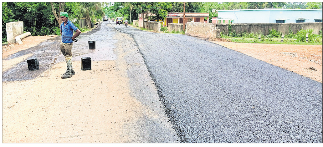
ଜାତିଆ-ବୈଷପାନ ରାସ୍ତା ନିର୍ମାଣ କାମ ଚାଲିଛି ।

ସାମଗ୍ରୀ ବ୍ୟବହାର କରାଯାଇଥିବା ଦେଖାଯାଇଛି । ଏହି ରାସ୍ତା କାର୍ଯ୍ୟରେ ୭୫ ଏମ୍.ଏମ୍ ମୋଟେରର ପିଚୁ ବିଛା ଯିବାର ଏଣ୍ଟିମେଟ ରହିଥିବା ଜଣାପଡ଼ିଛି । କିନ୍ତୁ ଏଠାରେ ତା'ର ବ୍ୟତିକ୍ରମ କରାଯାଇ କେଉଁଠି ୪୦ ଚ' ଅନ୍ୟ କେଉଁଠି ୫୦ ଏମ୍.ଏମ୍ ପିଚୁ ବିଛାଯାଉଥିବା ଦେଖିବାକୁ