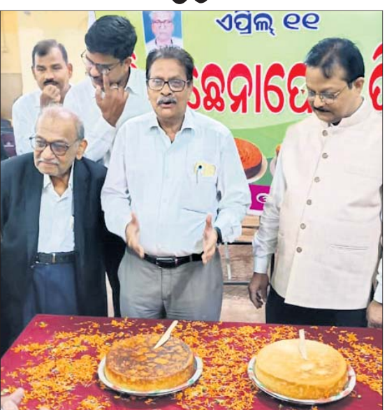
ବିଭିନ୍ନ ଅନୁଷ୍ଠାନ ପକ୍ଷରୁ ଛେନାପୋଡ଼ ଦିବସ ପାଳନ କରାଯାଇଛି ।