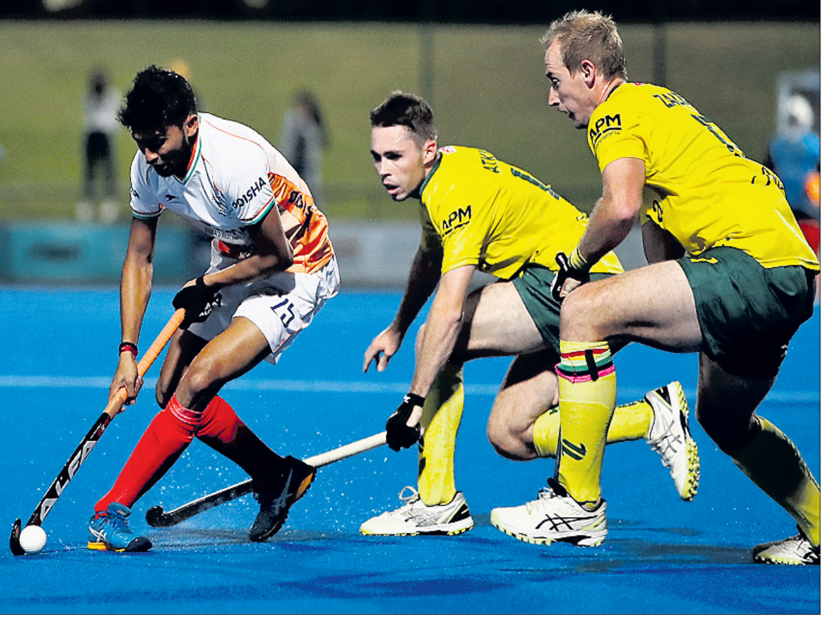
ପର୍ଥରେ ଶୁକ୍ରବାର ଭାରତ ଓ ଅଷ୍ଟ୍ରେଲିଆ ମଧ୍ୟରେ ଅନୁଷ୍ଠିତ ହକି ମ୍ୟାଚର ଏକ ସଂଘର୍ଷପୂର୍ଣ୍ଣ ମୁହୂର୍ତ୍ତ।

କର୍ନରକୁ ଗୋଲରେ ପରିଣତ କରି ଦଳର ବିଜୟକୁ ନିଶ୍ଚିତ କରି ଦେଇଥିଲେ। ଚଳିତ ସିରିଜରେ ଭାରତର ଏହା କ୍ରମାଗତ ୪ର୍ଥ ପରାଜୟ। ଫଳରେ ୫ ମ୍ୟାଚ ବିଶିଷ୍ଟ ସିରିଜରେ ଅଷ୍ଟ୍ରେଲିଆ ୪-୧ରେ ଅଗ୍ରଣୀଭାବ କରିଛି। ପ୍ରଥମ ୩ଟି ମ୍ୟାଚରେ ଅଷ୍ଟ୍ରେଲିଆ ଯଥାକ୍ରମେ ୫-୧, ୪-୨ ଓ ୨-୧ ଗୋଲରେ ବିଜୟ ହାସଲ କରିଥିଲା। ଦୁଇ ଦଳ ମଧ୍ୟରେ ୫ମ ତଥା ଅନ୍ତିମ ମ୍ୟାଚ ଶନିବାର ଅନୁଷ୍ଠିତ ହେବ।