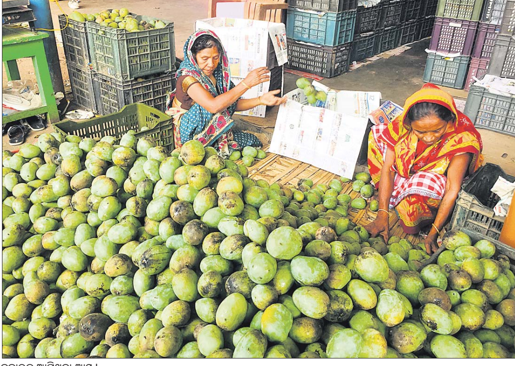
ବକାରକୁ ଆସିଥିବା ଆୟ।

ଆୟ ପାଟିବା ସମୟ ଆସିଯାଇଛି। ବ୍ରହ୍ମପୁର ସହରର ମାନାକ୍ଷୀନଗରରେ ଥିବା ନୀଳକଣ୍ଠେଶ୍ୱର ଆୟ ବଜାର ଚଳଚ୍ଚିତ୍ର ହୋଇଉଠିଛି। ଏହା ଦକ୍ଷିଣ ଓଡ଼ିଶାର ପ୍ରମୁଖ ଆୟ ବଜାର ଭାବେ ପରିଚିତ। ଏବେ ଦୈନିକ ଏଠାକୁ ୬୦ ଚନ୍ ଆୟ ଆମଦାନୀ ହେଉଥିବା ବ୍ୟବସାୟୀ ମହଲକୁ ଜାଣିବାକୁ ମିଳିଛି। ଏହା ହୋଇଥିଲେ ବଜାର ହୋଇଥିବାରୁ ଏହି ମାର୍କେଟକୁ ଭୁବନେଶ୍ୱର, କଟକ, ଖୋର୍ଦ୍ଧା ଓ କେନ୍ଦ୍ରାପଡ଼ା ଓ ଗଞ୍ଜାମ ଜିଲାର ଆସିବା, ଭଞ୍ଜନଗର ଓ ଶେରଗଡ଼ ଆଦି ଅଞ୍ଚଳକୁ ଆୟ ପଠାଯାଉଛି। ତେବେ ଦେଶୀ ଆୟ ଉତ୍ପାଦନ ସେଭଳି ଆଖୁପୁଷିଆ ହୋଇ ନ ଥିବାରୁ ଦର ବଢ଼ିବା ସମ୍ଭାବନା ରହିଛି ବୋଲି ବ୍ୟବସାୟୀମାନେ ପ୍ରକାଶ କରିଛନ୍ତି।