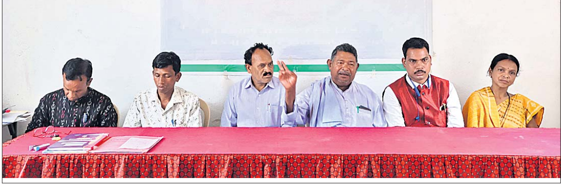
ଖବରଦାତା ସମ୍ମିଳନୀରେ କୁଇ ସମାଜ କାର୍ଯ୍ୟକର୍ତ୍ତା।