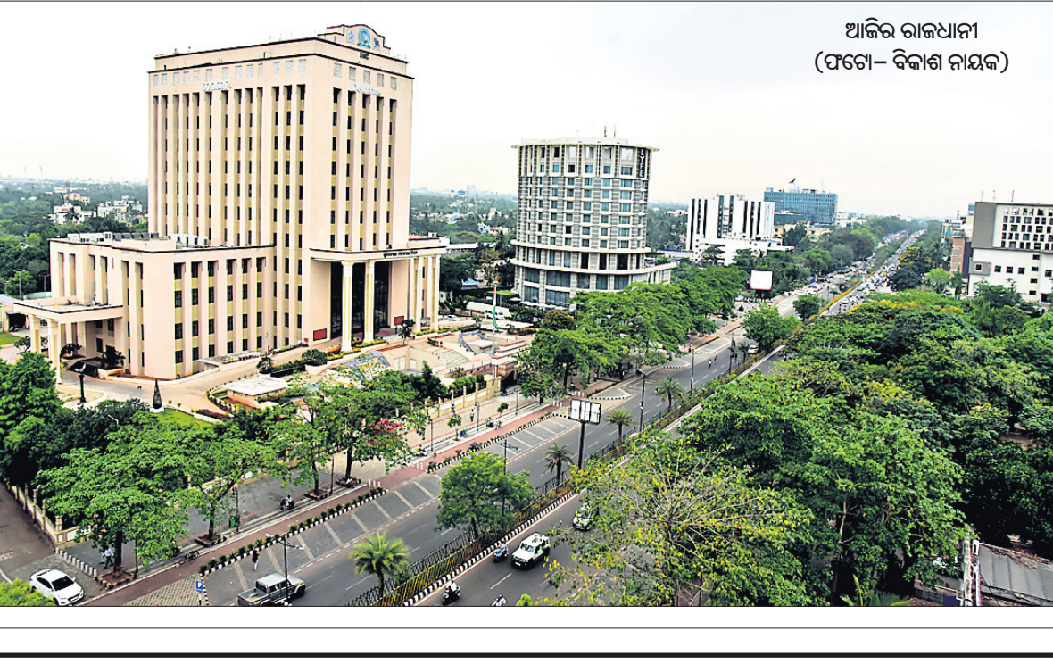
ଆଜିର ରାଜଧାନୀ