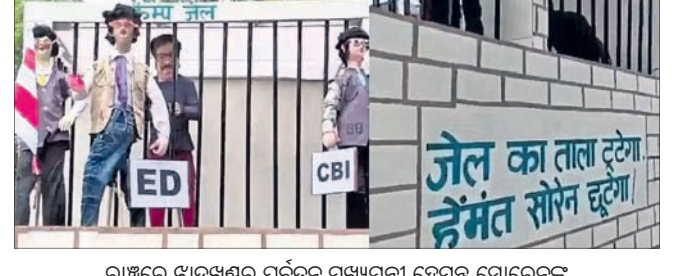
ରାଷ୍ଟ୍ରରେ ଝାଡ଼ଖଣ୍ଡର ପୂର୍ବତନ ମୁଖ୍ୟମନ୍ତ୍ରୀ ହେମନ୍ତ ସୋରେନ୍ଙ୍କ ସମର୍ଥନରେ ଶୋଭାଯାତ୍ରା ଗାଡ଼ି।