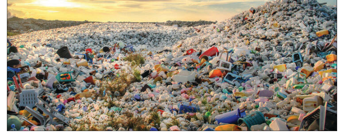
୧୨ ଦେଶ ମଧ୍ୟରେ ଭାରତ ରହିଥିବା ଉଚ୍ଚ ରିପୋର୍ଟରେ କୁହାଯାଇଛି।

ବୃକ୍ଷା, ବ୍ରାଜିଲ, ମେକ୍ସିକୋ, ଭିଏଟ୍ନାମ, ଇରାନ, ଇଣ୍ଡୋନେସିଆ, ଇଟି, ଓଡ଼ାହାରା, ଆମେରିକା ଏବଂ ଟୁର୍କି।