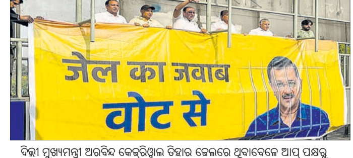
ଦିଲ୍ଲୀ ମୁଖ୍ୟମନ୍ତ୍ରୀ ଅରବିନ୍ଦ କେଜ୍ରିୱାଲ ତିହାର ଜେଲରେ ଥିବାବେଳେ ଆପ୍ ପକ୍ଷରୁ...