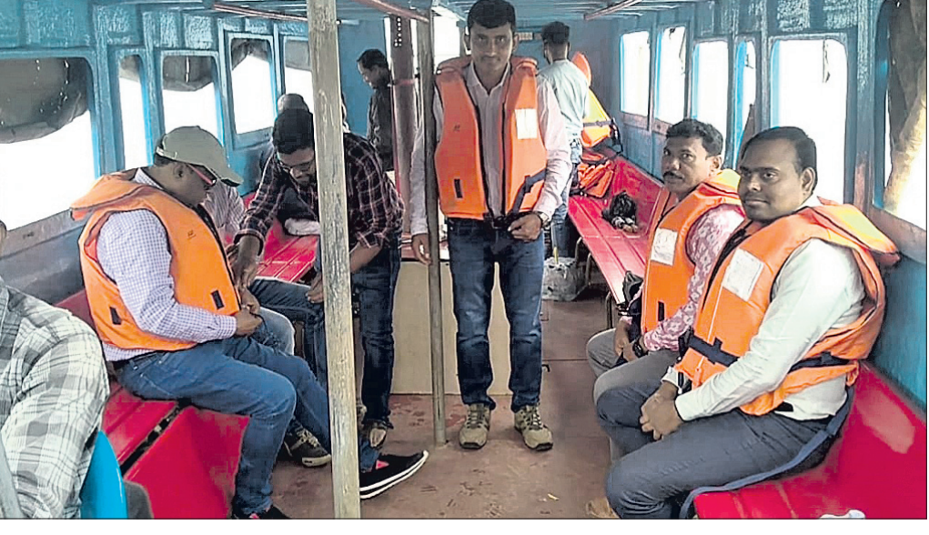
ଅଧିକାରୀମାନେ ରୁଥ୍ ମାଞ୍ଚ କରିବାକୁ ବୋର୍ଡରେ ସାଜାଉଛନ୍ତି ।

ଚେକ୍‌ସ୍ଟାଫ୍, ୧୨୧୪ (ବିଜୟ ସାହୁ) ନବରଙ୍ଗପୁର ଜିଲ୍ଲା ଚେକ୍‌ସ୍ଟାଫ୍ ବିଚ୍ଛିନ୍ନାଞ୍ଚଳରେ ୨ଟି ରୁଥ୍ କରାଯାଇଛି । ଏହି ୨ଟି ରୁଥ୍ କରାଯାଇଥିବାବେଳେ ୨୯ଟି ରୁଥ୍ କରାଯାଇଛି । ନବରଙ୍ଗପୁର ଜିଲ୍ଲା ଚେକ୍‌ସ୍ଟାଫ୍ ବିଚ୍ଛିନ୍ନାଞ୍ଚଳରେ ୨ଟି ରୁଥ୍ କରାଯାଇଛି । ଏହି ୨ଟି ରୁଥ୍ କରାଯାଇଥିବାବେଳେ ୨୯ଟି ରୁଥ୍ କରାଯାଇଛି ।