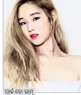
ପାର୍କି ବୋ ରାମ୍