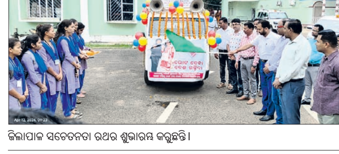
ଜିଲାପାଳ ସଚେତନତା ରଥର ଶୁଭାରମ୍ଭ କରୁଛନ୍ତି ।