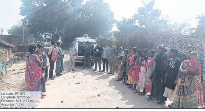
ଜଙ୍ଗଲରେ ନିଆଁ ନ ଲାଗାଇବା ନେଇ ଗାଁରେ ବୈଠକ କରି ସଚେତନ କରାଯାଉଛି ।

କଳ୍କି ଜଙ୍ଗଲ। ବିପଦରେ ବନ୍ୟପ୍ରାଣୀ ଗତ ବର୍ଷ ଜଙ୍ଗଲ ଜଳିବା କ୍ଷେତ୍ରରେ ସାରା ଦେଶରେ ଓଡ଼ିଶା ପ୍ରଥମ ହୋଇଥିବାବେଳେ ସେଥିମଧ୍ୟରୁ ନବରଙ୍ଗପୁର ବନଖଣ୍ଡ ଅଧୀନ ଝରିଗାଁ ବନାଞ୍ଚଳରେ ସର୍ବାଧିକ ୨୧୩୮.୮୪ ନିୟୁତ ଚର୍ଚ୍ଚ ବୃଦ୍ଧି ସଚେତନତା ଅଭାବରେ ଅଧିକାଂଶ ଗ୍ଲାସରେ ଲୋକମାନେ ହିଁ ଜଙ୍ଗଲ ନିଆଁ ଲାଗାଉଛନ୍ତି। ନିଆଁ ନ ଲଗାଇବାକୁ ଲୋକମାନଙ୍କୁ ସଚେତନ କରାଯାଉଛି । ଫରେଷ୍ଟ ସର୍ଭେ ଅଫ ଇଣ୍ଡିଆର ତଥ୍ୟ ଅନୁଯାୟୀ, ୨୦୨୦ ନଭେମ୍ବରରୁ ୨୦୨୧ ଫେବୃଆରୀ ୨୦୨୧ ମଧ୍ୟରେ ଦେଶରେ ୩ ଲକ୍ଷ ୪୫ ହଜାର ୯୮୯୯ ବନାଗ୍ନି ଘଟଣା ଘଟିଥିଲା । ସେଥିମଧ୍ୟରୁ ଓଡ଼ିଶାରେ ୫୧ ହଜାର ୯୨୮ ଜଙ୍ଗଲରେ ନିଆଁ ଲାଗିଥିଲା, ଯାହା ସମଗ୍ର ଦେଶରେ ସର୍ବାଧିକ । ଅଗ୍ନିଶାଖ ଯୋଗୁଁ ବାୟୁମଣ୍ଡଳରେ