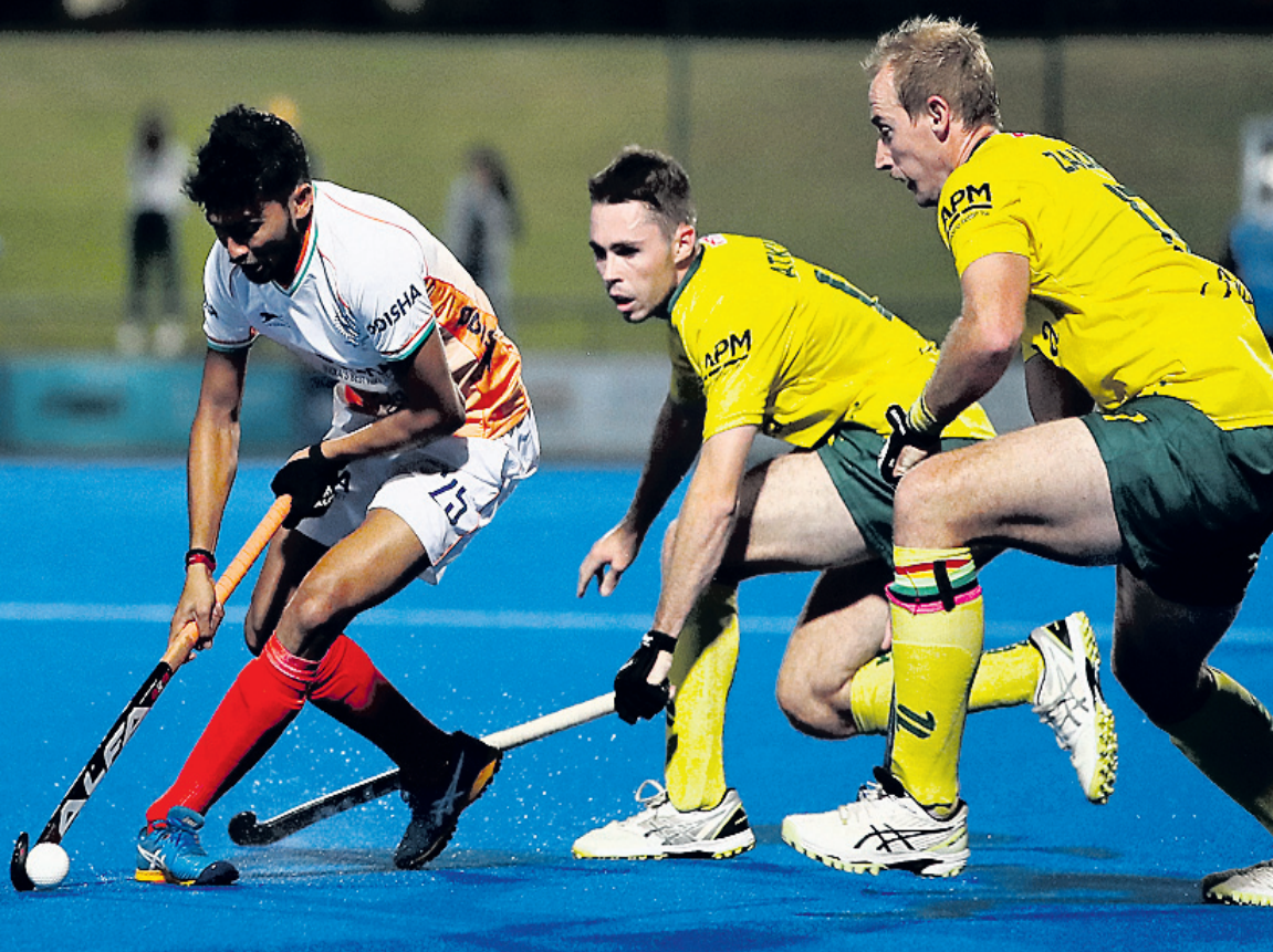
ପର୍ଥରେ ଶୁକ୍ରବାର ଭାରତ ଓ ଅଷ୍ଟ୍ରେଲିଆ ମଧ୍ୟରେ ଅନୁଷ୍ଠିତ ହକି ମ୍ୟାଚର ଏକ ସଂଘର୍ଷପୂର୍ଣ୍ଣ ମୁହୂର୍ତ୍ତ।

କର୍ନରକୁ ଗୋଲରେ ପରିଣତ କରି ଦଳର ବିଜୟକୁ ନିଶ୍ଚିତ କରି ଦେଇଥିଲେ। ଚଳିତ ସିରିଜରେ ଭାରତର ଏହା କ୍ରମାଗତ ୪ର୍ଥ ପରାଜୟ। ଫଳରେ ୫ମ୍ୟାଚ ବିଶିଷ୍ଟ ସିରିଜରେ ଅଷ୍ଟ୍ରେଲିଆ ୪-୧ରେ ଅଗ୍ରଣୀଲାଭ କରିଛି। ପ୍ରଥମ ୩ଟି ମ୍ୟାଚରେ ଅଷ୍ଟ୍ରେଲିଆ ଯଥାକ୍ରମେ ୫-୧, ୪-୨ ଓ ୨-୧ ଗୋଲରେ ବିଜୟ ହାସଲ କରିଥିଲା। ଦୁଇ ଦଳ ମଧ୍ୟରେ ୫ମ ଚତୁର୍ଥ ଅଧିନ ମ୍ୟାଚ ଶନିବାର ଅନୁଷ୍ଠିତ ହେବ।