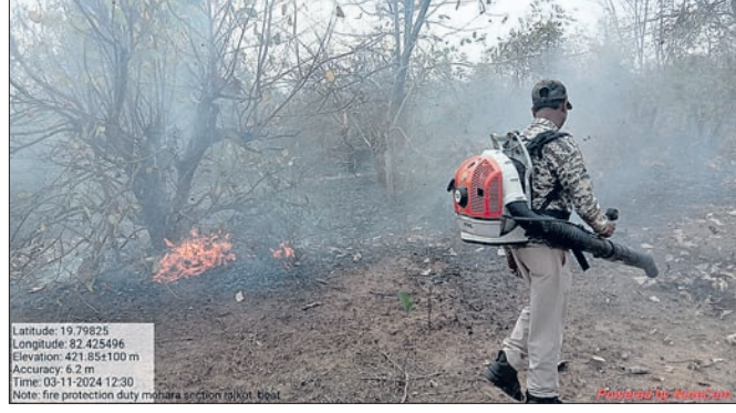
ଜଙ୍ଗଲ ନିଆଁକୁ ଅତ୍ୟଧିକ ଯତ୍ନ ସାହାଯ୍ୟରେ ଲିଭାଯାଉଛି ।

କଳ୍କି ଜଙ୍ଗଲ। ବିପଦରେ ବନ୍ୟପ୍ରାଣୀ ଗତ ବର୍ଷ ଜଙ୍ଗଲ ଜଳିବା କ୍ଷେତ୍ରରେ ସାରା ଦେଶରେ ଓଡ଼ିଶା ପ୍ରଥମ ହୋଇଥିବାବେଳେ ସେଥିମଧ୍ୟରୁ ନବରଙ୍ଗପୁର ବନଖଣ୍ଡ ଅଧୀନ ଝରିଗାଁ ବନାଞ୍ଚଳରେ ସର୍ବାଧିକ ୨୧୩୮.୮୪ ନିୟୁତ ଚର୍ଚ୍ଚ ବୃଦ୍ଧି ସଚେତନତା ଅଭାବରେ ଅଧିକାଂଶ ଗ୍ଲାସରେ ଲୋକମାନେ ହିଁ ଜଙ୍ଗଲ ନିଆଁ ଲାଗାଉଛନ୍ତି। ନିଆଁ ନ ଲଗାଇବାକୁ ଲୋକମାନଙ୍କୁ ସଚେତନ କରାଯାଉଛି । ଫରେଷ୍ଟ ସର୍ଭେ ଅଫ ଇଣ୍ଡିଆର ତଥ୍ୟ ଅନୁଯାୟୀ, ୨୦୨୦ ନଭେମ୍ବରରୁ ୨୦୨୧ ଫେବୃଆରୀ ୨୦୨୧ ମଧ୍ୟରେ ଦେଶରେ ୩ ଲକ୍ଷ ୪୫ ହଜାର ୯୮୯୯ ବନାଗ୍ନି ଘଟଣା ଘଟିଥିଲା । ସେଥିମଧ୍ୟରୁ ଓଡ଼ିଶାରେ ୫୧ ହଜାର ୯୨୮ ଜଙ୍ଗଲରେ ନିଆଁ ଲାଗିଥିଲା, ଯାହା ସମଗ୍ର ଦେଶରେ ସର୍ବାଧିକ । ଅଗ୍ନିଶାଖ ଯୋଗୁଁ ବାୟୁମଣ୍ଡଳରେ