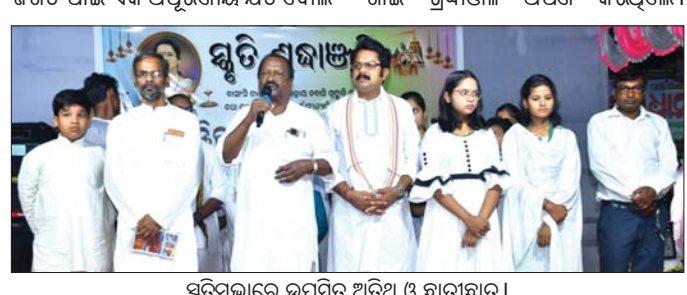
ସ୍ମୃତିସଭାରେ ଉପସ୍ଥିତ ଅତିଥି ଓ ଛାତ୍ରାଛାତ୍ର।