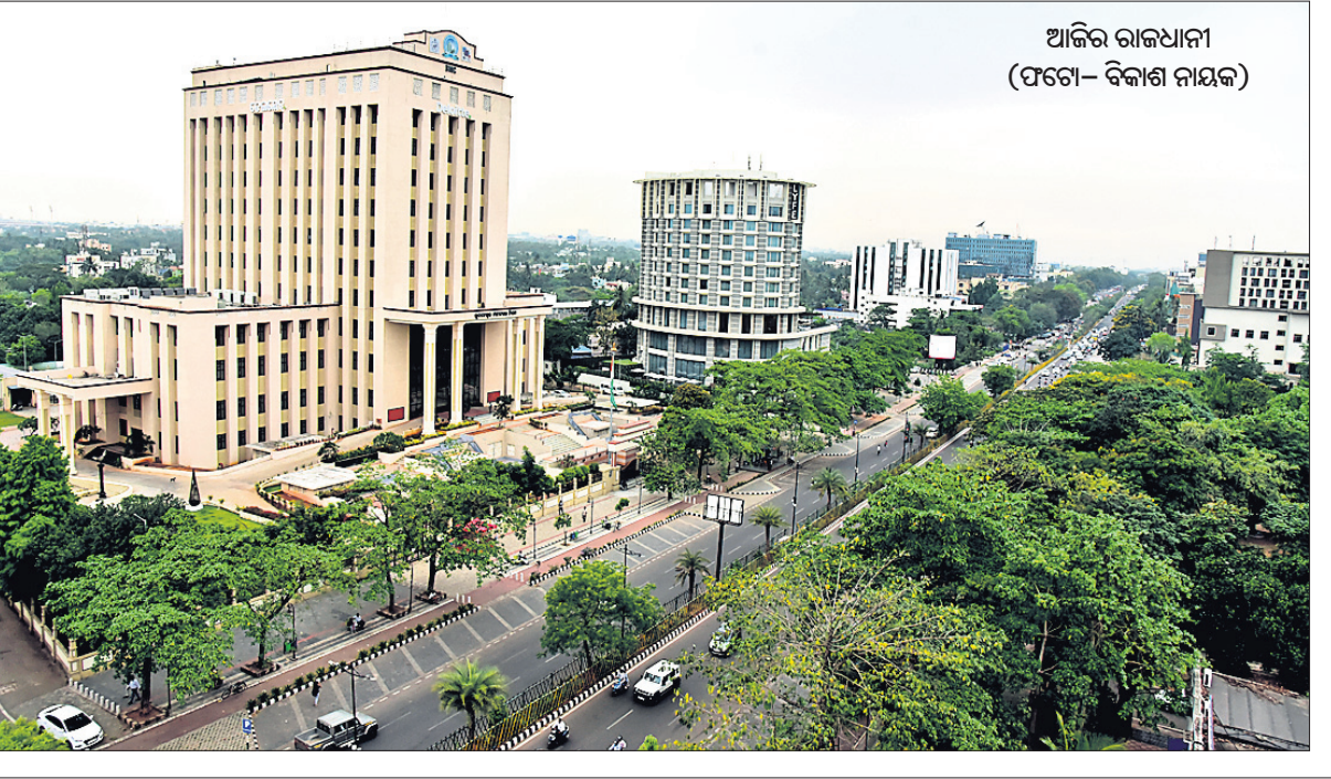
ଆଜିର ରାଜଧାନୀ