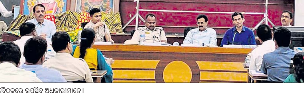
ବୈଠକରେ ଉପସ୍ଥିତ ଅଧିକାରୀମାନେ।