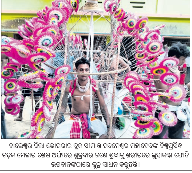
ବାଲେଶ୍ୱର ଜିଲ୍ଲା ଭୋଗରାଜ ବୁଦ୍ଧ ସାମାଜିକ ଚଳନେଶ୍ୱର ମହାଦେବଙ୍କ ବିଶ୍ୱପ୍ରସିଦ୍ଧ ଚତୁକ ମେଳାର ଶେଷ ଅର୍ଦ୍ଧରେ ଶୁକ୍ରବାର ଜଣେ ଶ୍ରଦ୍ଧାଳୁ ଶରୀରରେ ଲୁହାକଣ୍ଠା ଯୋଡ଼ି ଭଗବାନଙ୍କଠାରେ କୁହୁ ସାଧନ କରୁଛନ୍ତି।

ପାଳକାନଗିରି, ୧୨।୪ (ଭୂୟୋଧନ ପାତ୍ର) ଯାଅ କରି ତାଙ୍କଠାରୁ ଗଞ୍ଜେଇ କବଚ କରିଛନ୍ତି। ଯାଅ ବେଳେ ଯୁବକ ଜଣଙ୍କ ଧରିଥିବା ବ୍ୟାଗରୁ ୧୨ କେଜି ୨୦୦ ଗ୍ରାମ ଗଞ୍ଜେଇ ମିଳିଥିଲା। ଏହାକୁ ସେ ପଡ଼ୋଶୀ ଛତିଶଗଡ଼କୁ ଚାଲାଣ କରିଥିବା ପରାଭବରା ବେଳେ ଜଣାପଡ଼ିଛି।