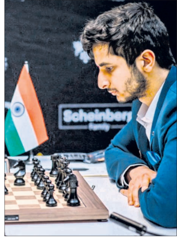
ଗୁଜରାଟ ସପ୍ତମ ରାଉଣ୍ଡ ମ୍ୟାଚ ଅବସରରେ ଭାରତର ଭିଦିତ ଗୁଜରାଟି ଓ ଆର୍. ପ୍ରଞ୍ଚାନନ୍ଦ

ଚେନ୍ନାଇ, ୧୨/୪ (ପି.ଟି.) ଏଠାରେ ଚାଲିଥିବା କ୍ୟାଣ୍ଡିଡେଟ୍ ଚେମ୍ପିୟନସ୍‌ସିପରେ ପ୍ରଥମ ପରାକ୍ରମ ବରଣ କରିଛନ୍ତି ଭାରତୀୟ ଗ୍ରାଣ୍ଡମାଷ୍ଟର ଡି. ଗୁଜରାଟ। ଫଳରେ ସେ ଯୁଗ୍ମ ଶୀର୍ଷ ସ୍ଥାନରୁ ତଳକୁ ଖସିଛନ୍ତି। ପ୍ରାନ୍ତର ଫିରୋଜଜା ଅଲିରେଜାଙ୍କ ବିପକ୍ଷ ମ୍ୟାଚରେ ସେ ପରାକ୍ରମ ସ୍ୱୀକୃତି ରାଖିଛନ୍ତି। ତେବେ ଅନ୍ୟତମ ଭାରତୀୟ ଗ୍ରାଣ୍ଡମାଷ୍ଟର ଆର୍. ପ୍ରଞ୍ଚାନନ୍ଦ ଆମେରିକାର ଫାରିଆନୋ କରୁଆନାଙ୍କ ବିପକ୍ଷରେ ମ୍ୟାଚ ତ୍ର ରଖିଛନ୍ତି। ଅଲିରେଜାଙ୍କଠାରୁ ପରାସ୍ତ ହେବା ଦ୍ୱାରା ୧୭ ବର୍ଷୀୟ ଗୁଜରାଟ ୪ ପଏଣ୍ଟ ସହିତ କରୁଆନା ଓ ପ୍ରଞ୍ଚାନନ୍ଦଙ୍କ ସହ ମିଳିତ ଦ୍ୱିତୀୟ ସ୍ଥାନରେ ରହିଛନ୍ତି। ଗୁଜରାଟ ଲିଆନ ନେପୋମନିଆଡି ୪.୫ ପଏଣ୍ଟ ପାଇ ଏକକ ଅଗ୍ରଣୀଭାବ କରିଛନ୍ତି। ସେ ନିଜର ୭ମ ରାଉଣ୍ଡ ମ୍ୟାଚକୁ ଆମେରିକାର ହିକାଭୁ ନାକାମୁରାଙ୍କ ବିପକ୍ଷରେ ତ୍ର ରଖିଛନ୍ତି। ସେହିପରି ପଏଣ୍ଟ ଭାଗ କରିବା ଦ୍ୱାରା ଆଜରବେଜାନର ନିଜାତ ଆବାସୋଭ ଓ ଭିଦିତ ଗୁଜରାଟି ୩.୫ ପଏଣ୍ଟ ଲେଖାଏ ପାଇ ଯୁଗ୍ମଭାବେ ୫ମ ସ୍ଥାନରେ ରହିଥିବାବେଳେ ନାକାମୁରା ଓ ଅଲିରେଜା ୨.୫ ପଏଣ୍ଟ ସହିତ ୭ମ ସ୍ଥାନ ପାଇଛନ୍ତି। ଆବାସୋଭ ୨ ପଏଣ୍ଟ ସହିତ ଶେଷ ସ୍ଥାନରେ ରହିଛନ୍ତି। ଅଲିରେଜା ଭାଗ୍ୟର ସାଥୀ ବଳରେ ଗୁଜରାଟକୁ ହରାଇବାରେ ସକ୍ଷମ ହୋଇଛନ୍ତି। ଏହାଏପରି ଏକ ଦିନ ଥିଲା ଯେଉଁଥିରେ କି ଗୁଜରାଟ ଯୋଜନା ଅନୁସାରେ ଖେଳିପାରି