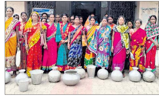
ପ୍ରତିବାଦ କରିବାକୁ ଆସୁଥିବା ମହିଳାମାନେ।

ଶାସ୍ତ୍ରୀ ସମସ୍ୟା ସମାଧାନ କରିବାକୁ ଦାବି କରିଥିଲେ। ଅଭିଯୋଗ ଅନୁଯାୟୀ, ଉକ୍ତ ଗ୍ରାମର ବାଦବାହାଳି ମହାନ୍ତସାହି ଓ ମାଟିଆଁ ସାହିରେ ପାଖାପାଖି ୮୦ ପରିବାର ରହୁଛନ୍ତି। ମାଟିଆଁ ସାହିରେ ଥିବା ନଳକୂପରୁ ଲୌହଯୁକ୍ତ ପାଣି ବାହାରୁଥିବାରୁ ତାହା ପିଇବା ଉପଯୋଗ ନୁହେଁ। ସେହିପରି ବାଦବାହାଳି ସାହିରେ ଥିବା ନଳକୂପରୁ କମ୍ ପରିମାଣର ପାଣି ବାହାରୁଛି। ପାଣି ପାଇଁ ନଳକୂପ ନିକଟରେ ମହିଳାମାନଙ୍କୁ ବନ୍ଧୁ ସମୟ ଧରି ଅପେକ୍ଷା କରିବାକୁ ପଡ଼ୁଛି। ଉଭୟ ନଳକୂପ ମରାମତି କରିବା ସହ ମହାନ୍ତ ସାହିରେ ଜଳ ସମସ୍ୟା ଦୂର କରିବାକୁ ଏକ ନଳକୂପ ଖନନ କରିବାକୁ ମହିଳାମାନେ ଦାବି