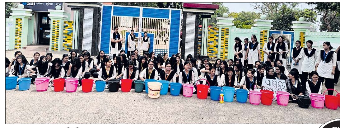
ଛାତ୍ରୀମାନେ ଧାରଣରେ ବସିଛନ୍ତି।