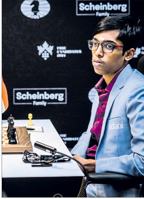
ଗୁଜରାଟ ସପ୍ତମ ରାଉଣ୍ଡ ମ୍ୟାଚ ଅବସରରେ ଭାରତର ଭିଦିତ ଗୁଜରାଟି ଓ ଆର୍. ପ୍ରଞ୍ଚାନନ୍ଦ

କ୍ୟାଣ୍ଡିଡେଟ୍ ଚେମ୍ପିୟନସ୍ ମହିଳା ବର୍ଗରେ ଆର୍. ଦୈଶାକା ଟୁର୍ନାମେଣ୍ଟରେ ତୃତୀୟ ପରାକ୍ରମ ବରଣ କରିଛନ୍ତି। ଗାଲନାର ଚିକିତ୍ସା ଲି ପ୍ରଦର୍ଶନ କରି ଦୈଶାକାଙ୍କ ବିପକ୍ଷରେ ସହଜ ବିଜୟ ହାସଲ କରିଥିଲେ। ଅନ୍ୟ ୩ଟି ବୋର୍ଡରେ ମ୍ୟାଚ ତ୍ର ରହିଥିଲା। ୪.୫ ପଏଣ୍ଟ ପାଇ ସାରିଥିବାରୁ ମହିଳା ବିଭାଗରେ ଭାରତର ଖୋଜାସି