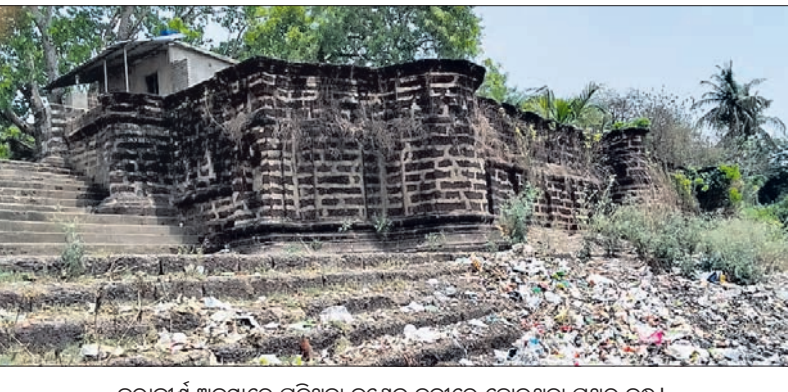
କରାଜାଣ୍ଡି ଅବସ୍ଥାରେ ପଡ଼ିଥିବା କୁଶେଇ ନଦୀରେ ହୋଇଥିବା ପଥର ବନ୍ଧ।