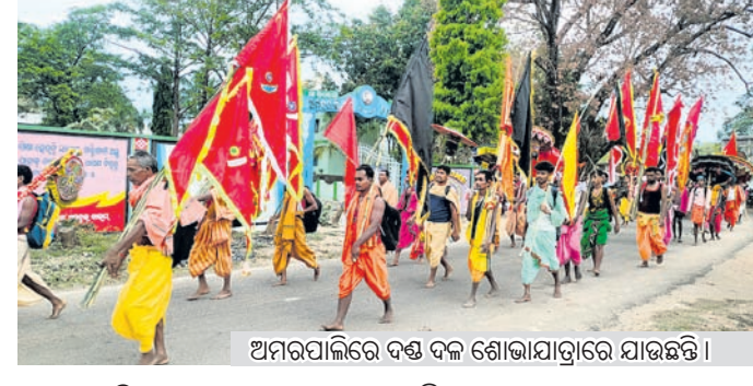
ଅମରପାଲିରେ ଦଣ୍ଡ ଦଳ ଶୋଭାଯାତ୍ରାରେ ଯାଉଛନ୍ତି ।