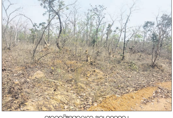
ବାରନରସିଂହପୁରଠାରେ ଥିବା ନନ୍ଦନବନ ।

ବୌଦ୍ଧ ଜିଲ୍ଲାର ପ୍ରାକୃତିକ ପରିବେଶ ଅତ୍ୟନ୍ତ ମନୋରମ । ଏହାକୁ ଦୃଷ୍ଟିରେ ରଖି ପ୍ରଶାସନ ଜିଲ୍ଲାରେ ଅକ୍ତି-ରୁଚିତ୍ୱ ପ୍ରକଳ୍ପ ଗ୍ରହଣ ଉପରେ ଗୁରୁତ୍ୱ ଦେଇ ବିଭିନ୍ନ ପ୍ରକଳ୍ପ ହାତକୁ ନେଇଛି । ଏହି ପରିପ୍ରେକ୍ଷାରେ ହରଭଙ୍ଗା ରୁକ୍ତ ବାରନରସିଂହପୁରଠାରେ ନନ୍ଦନବନ ପ୍ରକଳ୍ପ ପାଇଁ ଯୋଜନା ପ୍ରସ୍ତୁତ ହୋଇ କାର୍ଯ୍ୟ ଆରମ୍ଭ ହୋଇଛି । କିନ୍ତୁ ନନ୍ଦନବନରେ ପୂର୍ବରୁ ରହିଥିବା ଘଞ୍ଚ ଜଙ୍ଗଲ ଉପଯୁକ୍ତ ରକ୍ଷଣାବେକ୍ଷଣ ଅଭାବରୁ ଜ୍ରମଣ ଧୂସାଭିମୁଖୀ ହେବାରେ ଲାଗିଛି । ପ୍ରଶାସନର ଲକ୍ଷ୍ୟ ଏହି ନନ୍ଦନବନ ପ୍ରକଳ୍ପ ସମ୍ପୂର୍ଣ୍ଣ କାର୍ଯ୍ୟକାରୀ ହେଲେ ଜିଲ୍ଲା ଓ ଅଞ୍ଚଳର ବିକାଶ ହେବା ସହିତ ବହୁ ଲୋକ କର୍ମନିଯୁକ୍ତି ପାଇପାରିବେ । ନନ୍ଦନବନରେ ବନ୍ୟଜନ୍ତୁଙ୍କ ପାଇଁ ସଫାରି, ହୋଟେଲ ଓ ପାର୍କ ନିର୍ମାଣ ସହ ବୋଟିଂ ସୁବିଧା କରାଯାଇ ପର୍ଯ୍ୟଟକଙ୍କୁ ଆକୃଷ୍ଟ