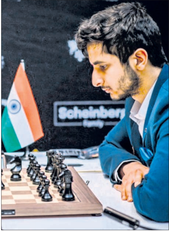
ଗୁଜରାଟ ସପ୍ତମ ରାଉଣ୍ଡ ମ୍ୟାଚ ଅବସରରେ ଭାରତର ଭିତିତ ଗୁଜରାଟି ଓ ଆର୍. ପ୍ରଞ୍ଚାନନ୍ଦ

ଚେନ୍ନାଇ, ୧୨୧୪ (ପି.ଟି.): ଏଠାରେ ଚାଲିଥିବା କ୍ୟାଣ୍ଡିଡେଟ୍ ଚେମ୍ପିୟନସ୍‌ସିପରେ ପ୍ରଥମ ପରାଜୟ ବରଣ କରିଛନ୍ତି ଭାରତୀୟ ଗ୍ରାଣ୍ଡମାଷ୍ଟର ଡି. ଗୁଜରାଟ। ଫଳରେ ସେ ଯୁଗ୍ମ ଶୀର୍ଷ ସ୍ଥାନରୁ ତଳକୁ ଖସିଛନ୍ତି। ପ୍ରାନ୍ତର ଫିରୋଜଜା ଅଲିରେଜାଙ୍କ ବିପକ୍ଷ ମ୍ୟାଚରେ ସେ ପରାଜୟ ସ୍ୱୀକାର କରିଛନ୍ତି। ତେବେ ଅନ୍ୟତମ ଭାରତୀୟ ଗ୍ରାଣ୍ଡମାଷ୍ଟର ଆର୍. ପ୍ରଞ୍ଚାନନ୍ଦ ଆମେରିକାର ଫାରିଆନୋ କରୁଆନାଙ୍କ ବିପକ୍ଷରେ ମ୍ୟାଚ ଡ୍ର ରଖିଛନ୍ତି। ଅଲିରେଜାଙ୍କଠାରୁ ପରାସ୍ତ ହେବା ଦ୍ୱାରା ୧୭ ବର୍ଷୀୟ ଗୁଜରାଟ ୪ ପଏଣ୍ଟ ସହିତ କରୁଆନା ଓ ପ୍ରଞ୍ଚାନନ୍ଦଙ୍କ ସହ ମିଳିତ ଦ୍ୱିତୀୟ ସ୍ଥାନରେ ରହିଛନ୍ତି। ଗୁଜରାଟ ଲୀୟନ ନେତାପାନିଆତି ୪.୫ ପଏଣ୍ଟ ପାଇ ଏକକ ଅଗ୍ରଣୀଭାବ କରିଛନ୍ତି। ସେ ନିଜର ୭ମ ରାଉଣ୍ଡ ମ୍ୟାଚକୁ ଆମେରିକାର ହିକାଭୁ ନାକାମୁରାଙ୍କ ବିପକ୍ଷରେ ଡ୍ର ରଖିଛନ୍ତି। ସେହିପରି ପଏଣ୍ଟ ଭାଗ କରିବା ଦ୍ୱାରା ଆଜରବୈଜାନର ନିଜାତ ଆବାସୋଭ ଓ ଭିତିତ ଗୁଜରାଟି ୩.୫ ପଏଣ୍ଟ ଲେଖାଏ ପାଇ ଯୁଗ୍ମଭାବେ ୫ମ ସ୍ଥାନରେ ରହିଥିବାବେଳେ ନାକାମୁରା ଓ ଅଲିରେଜା ୨.୫ ପଏଣ୍ଟ ସହିତ ୭ମ ସ୍ଥାନ ପାଇଛନ୍ତି। ଆବାସୋଭ ୨ ପଏଣ୍ଟ ସହିତ ଶେଷ ସ୍ଥାନରେ ରହିଛନ୍ତି। ଅଲିରେଜା ଭାଗ୍ୟର ସାଥୀ ବଳରେ ଗୁଜରାଟକୁ ହରାଇବାରେ ସକ୍ଷମ ହୋଇଛନ୍ତି। ଏହା ଏପରି ଏକ ଦିନ ଥିଲା ଯେଉଁଥିରେ କି ଗୁଜରାଟ ଯୋଜନା ଅନୁସାରେ ଖେଳିପାରି