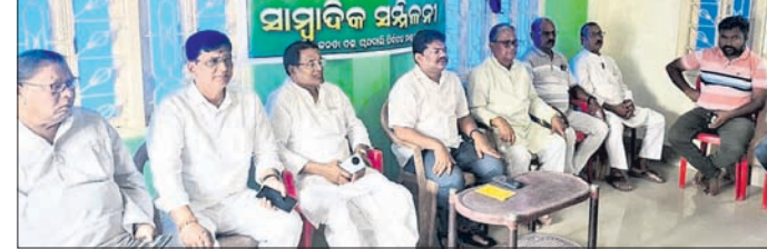
ଖବରଦାତା ସମ୍ମିଳନୀରେ ବିଜେଡି କର୍ମକର୍ମୀ।