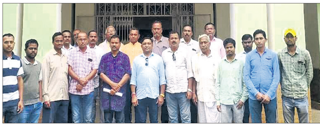
ବୈଠକରେ ଯୋଗ ଦେଇଥିବା ଚାଷୀ ପ୍ରତିନିଧିଙ୍କୁ ।