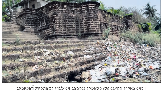
ଜରାଜୀର୍ଣ୍ଣ ଅବସ୍ଥାରେ ପଡ଼ିଥିବା କୁଶେଳ ନଦୀରେ ହୋଇଥିବା ପଥର ବନ୍ଧ।

ପ୍ରାୟ ୧୫ ଫୁଟ ଉଚ୍ଚତାରେ ନିର୍ମାଣ ହୋଇଛି। ବୁଲପାଶୁରେ ଆଡ଼ି ବନ୍ଧ ସହ ୧୨ ଫୁଟ ଓସାରର ବନ୍ଧ ଉପରେ ଛୋଟ ଛୋଟ ଗନ୍ଧୁଳ ନିର୍ମାଣ କରାଯାଇଥିଲା। ନଦୀ କୂଳରେ ଓଡ଼ିଶାର ସର୍ବ ପୁରାତନ