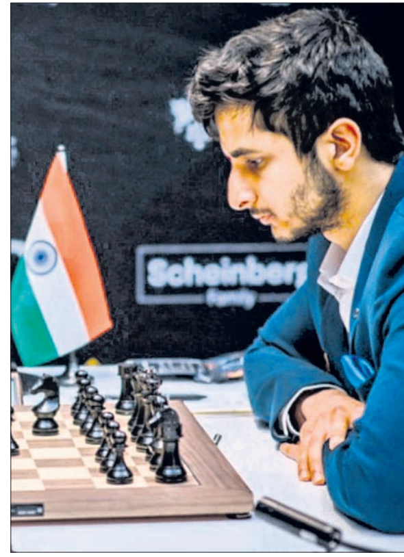
ଗୁଜରାଟ ସପ୍ତମ ରାଉଣ୍ଡ ମ୍ୟାଚ ଅବସରରେ ଭାରତର ଭିଦିତ ଗୁଜରାଟୀ ଓ ଆର୍. ପ୍ରଜ୍ଞାନନ୍ଦ।

ଏଠାରେ ଚାଲିଥିବା କ୍ୟାଣ୍ଡିଡେଟ୍ ଚେସ୍ ଟୁର୍ନାମେଣ୍ଟରେ ପ୍ରଥମ ପରାଜୟ ବରଣ କରିଛନ୍ତି ଭାରତୀୟ ଗ୍ରାଣ୍ଡମାଷ୍ଟର ଡି. ଗୁଜରାଟୀ। ଫଳରେ ସେ ଯୁବ ଶୀର୍ଷ ସ୍ଥାନରୁ ତଳକୁ ଖସିଛନ୍ତି। ପ୍ରାନ୍ତର ଫିରୋଜଜା ଅଲିରେଜାଙ୍କ ବିପକ୍ଷ ମ୍ୟାଚରେ ସେ ପରାଜୟ ସ୍ୱୀକାର କରିଛନ୍ତି। ତେବେ ଅନ୍ୟତମ ଭାରତୀୟ ଗ୍ରାଣ୍ଡମାଷ୍ଟର ଆର୍. ପ୍ରଜ୍ଞାନନ୍ଦ ଆମେରିକାର ଫାରିଆନୋ କରୁଆନାଙ୍କ ବିପକ୍ଷରେ ମ୍ୟାଚ ଡ୍ର ରଖିଛନ୍ତି। ଅଲିରେଜାଙ୍କଠାରୁ ପରାସ୍ତ ହେବା ଦ୍ୱାରା ୧୭ ବର୍ଷୀୟ ଗୁଜରାଟୀ ୪ ପଏଣ୍ଟ ସହିତ କରୁଆନା ଓ ପ୍ରଜ୍ଞାନନ୍ଦଙ୍କ ସହ ମିଳିତ ଦ୍ୱିତୀୟ ସ୍ଥାନରେ ରହିଛନ୍ତି। ଗୁଜରାଟୀଙ୍କ ଇଆନ ନେପୋମନିଆଡି ୪.୫ ପଏଣ୍ଟ ପାଇ ଏକକ ଅଗ୍ରଣୀଲାଭ କରିଛନ୍ତି। ସେ ନିଜର ୭ମ ରାଉଣ୍ଡ ମ୍ୟାଚକୁ ଆମେରିକାର ହିକାଭୁ ନାକାମୁରାଙ୍କ ବିପକ୍ଷରେ ଡ୍ର ରଖିଛନ୍ତି। ସେହିପରି ପଏଣ୍ଟ ଭାଗ କରିବା ଦ୍ୱାରା ଆଜରବୈଜାନର ନିଜାତ ଆବାସୋଭ ଓ ଭିଦିତ ଗୁଜରାଟୀ ୩.୫ ପଏଣ୍ଟ ଲେଖାଏ ପାଇ ଯୁଗ୍ମଭାବେ ୫ମ ସ୍ଥାନରେ ରହିଥିବାବେଳେ ନାକାମୁରା ଓ ଅଲିରେଜା ୨.୫ ପଏଣ୍ଟ ସହିତ ୭ମ ସ୍ଥାନ ପାଇଛନ୍ତି। ଆବାସୋଭ ୨ ପଏଣ୍ଟ ସହିତ ଶେଷ ସ୍ଥାନରେ ରହିଛନ୍ତି। ଅଲିରେଜା ଭାଗ୍ୟର ସାଥୀ ବଳରେ ଗୁଜରାଟୀଙ୍କୁ ହରାଇବାରେ ସକ୍ଷମ ହୋଇଛନ୍ତି। ଏହାଏପରି ଏକ ଦିନ ଥିଲା ଯେଉଁଥିରେ କି ଗୁଜରାଟୀ ଯୋଜନା ଅନୁସାରେ ଖେଳିପାରି