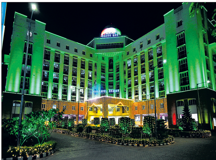
ଶନିବାର ୭୭ତମ ରାଜଧାନୀ ପ୍ରତିଷ୍ଠା ଦିବସ ପରିପ୍ରେକ୍ଷାରେ କମିଶନରେଟ୍ ପୋଲିସ୍ ମୁଖ୍ୟାଳୟ, ଲୋକସେବା ଭବନ, ଖାରବେଳ ଭବନ ସମେତ ଭୁବନେଶ୍ୱରରେ ଥିବା ବିଭିନ୍ନ ସରକାରୀ କାର୍ଯ୍ୟାଳୟ ଓ ପ୍ରତିଷ୍ଠାନକୁ ରଙ୍ଗିନି ଆଲୋକମାଳାରେ ସଜା ଯାଇଛି।