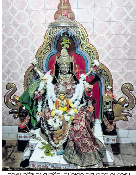
କଟଣା କୁଦିଆରୀ ଗ୍ରାମସମିତ ମା' ଜାଗୁଳାଇ ଋଦ୍ଧମାତା ବେଶ।