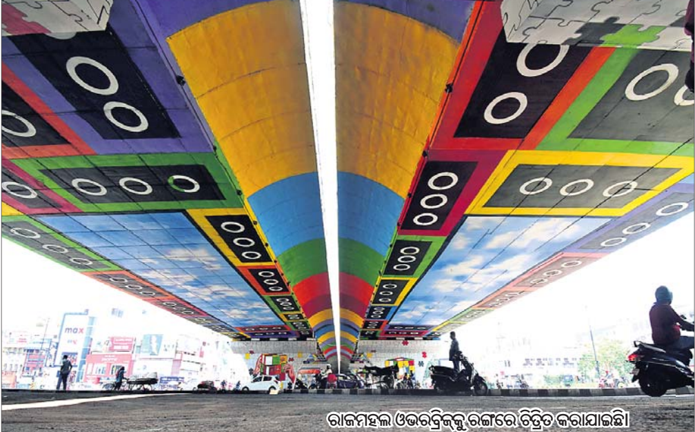
ରାଜମହଲ ଓଭରବ୍ରିଜକୁ ରଙ୍ଗରେ ଚିତ୍ରିତ କରାଯାଇଛି।

୧୯୪୮ ଏପ୍ରିଲ ୧୩, ଓଡ଼ିଶା ଇତିହାସରେ ସ୍ୱର୍ଣ୍ଣାକ୍ଷରରେ ଲିପିବଦ୍ଧ। ମାତ୍ର ୪୦ହଜାର ଲୋକଙ୍କୁ ନେଇ ପ୍ରତିଷ୍ଠା ହୋଇଥିବା ରାଜଧାନୀ ଭୁବନେଶ୍ୱରର ଜନସଂଖ୍ୟା ଏବେ ୧୧ ଲକ୍ଷ ପାର୍ କରିଛି। ପରିସୀମା ବଢ଼ିଛି, ବାସଗୃହ ବଢ଼ିଛି। ସହରର ନବଜଳେବର ବଦଳିବା ସହ ଏବେ ଦିଲ୍ଲୀ, ପୂର୍ଯ୍ୟା ଭଳି ମେଟ୍ରୋସିଟି ସହ ତାଳ ଦେଇ ଆଗକୁ ବଢ଼ୁଛି। ସ୍ୱାସ୍ଥ୍ୟ, ଶିକ୍ଷା, ଗମନାଗମନ, ରାଜନୀତି, ବ୍ୟବସାୟ, ଖେଳକୁଳ, ସଂସ୍କୃତି, ପର୍ଯ୍ୟଟନ କ୍ଷେତ୍ରରେ ସଫଳତାର ଫର୍ଦ୍ଦ ପରେ ଫର୍ଦ୍ଦ ଯୋଡ଼ିହେବାରେ ଲାଗିଛି। ଶନିବାର ରାଜଧାନୀ ଭୁବନେଶ୍ୱର ତା'ର ୭୬ତମ ଜନ୍ମଦିନ ପାଳନ କରିବା ୭୬ବର୍ଷରେ ପାଦଥାପିଥିବା ରାଜଧାନୀର ସଫଳତା, ସମସ୍ୟା, ଆଶା ଓ ଆକାଂକ୍ଷାକୁ ନେଇ ସ୍ୱତନ୍ତ୍ର ଉପସ୍ଥାପନା। (ବନ୍ଦନା ସେଠୀ)