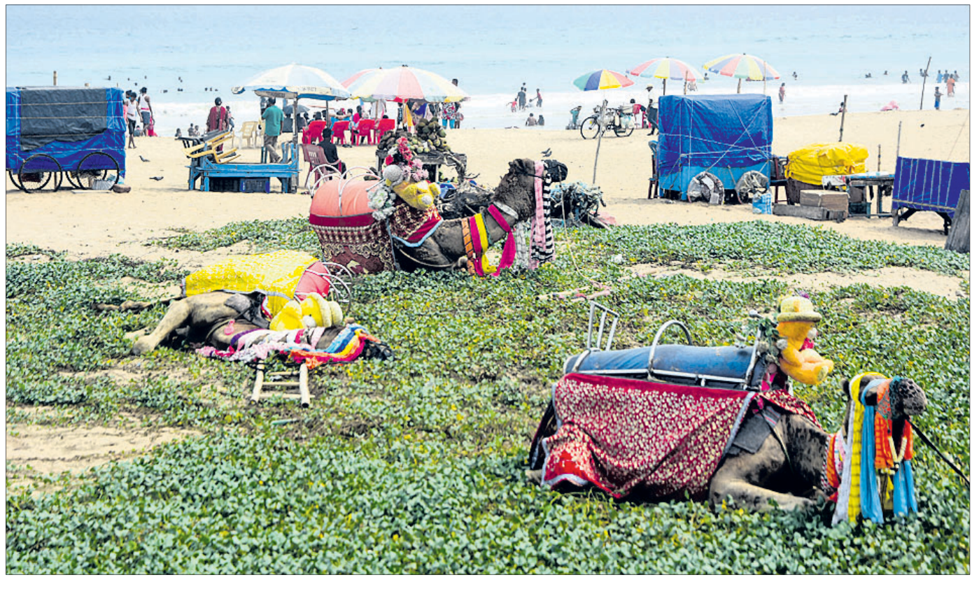
ପ୍ରବଳ ରୌଦ୍ରତାପ ଯୋଗୁ ଶୁକ୍ରବାର ପୁରୀ ବେଳାଭୂମିର ଘାସ ଗାଳିଗାରେ ଓଷ୍ଟରୁଡିକ ବିଶ୍ରାମ ନେଉଛନ୍ତି ।