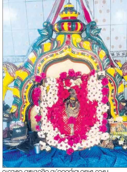
ରାମେଶ୍ୱର ପଞ୍ଚାୟତସମିତ ମା' ବନପୁରୀଙ୍କ କୁମ୍ଭାଣ୍ଡ ବେଶ।

ଘର ଦୁଲି ମତଦାନ କରିବାକୁ ଭୋଟରଙ୍କ ମଧ୍ୟରେ ସଚେତନତା ସୃଷ୍ଟି କରିବାକୁ ନିର୍ଦ୍ଦେଶ ଦିଆଯାଇଛି। ବିଶେଷକରି ଯୁବ ମତଦାନୀଙ୍କୁ ବିଏଲଓ ସଚେତନ କରିବା ଉପରେ ଗୁରୁତ୍ୱ ଦେବେ। ଏହାସହ ଅନ୍ୟମାନେ ଉପସ୍ଥିତ ହୋଇପାରିବେ। ସେହିଭଳି ରଜୋଲି, ନିର୍ବାଚନ ପର୍ବ ଆମ ଦେଶର ଗର୍ବ ଉପରେ ବିଭିନ୍ନ ପ୍ରତିଯୋଗିତା, ଭିଡିଓ ଓ ରେଡିଓ ବାର୍ତ୍ତା, ହୋଟିଓ, ଫ୍ଲାଇ ପୋଷ୍ଟ, ମାରାଥନ, ଦ୍ରବ୍ୟଗତ