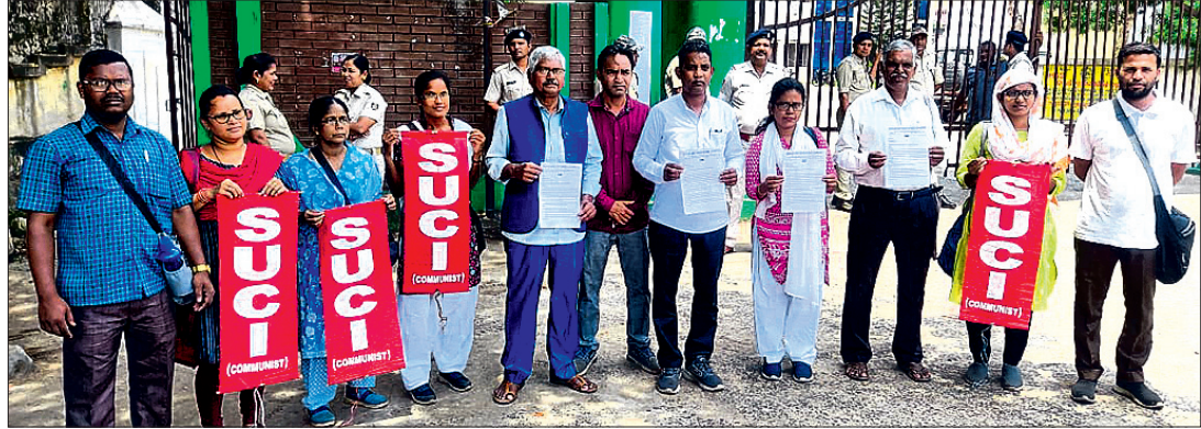
ଏସୁସିଆଇ(ସି) ସଦସ୍ୟମାନେ ଶୁକ୍ରବାର ସିଏମ୍ପି କମିଶନରଙ୍କୁ ସ୍ମାରକପତ୍ର ଦେବାକୁ ଆସିଛନ୍ତି।

କଟକ ସଦର ଥାନା ଅଧୀନ ରାଜକୋଷ୍ଠରେ ଜଣିତ ବ୍ୟାପାରୀଙ୍କୁ ଲାଗିଛି। ଚାପରେ ଆପଣେ ଦୃଷ୍ଟି ପାନୀୟକ ପାଇଁ ଲୋକେ ଜଣିତରେ ଆକ୍ରାନ୍ତ ହୋଇଛନ୍ତି। ନିମ୍ନମାନ ପାଇଁ କଟିଆରେ ଯୋଗାଇ ଦିଆଯାଉଥିବା ପାଣି ପିଇ ରୋଗି ଖର୍ଚ୍ଚ ୮୬ରୁ ଅଧିକ ଲୋକ ଜଣିତରେ ଆକ୍ରାନ୍ତ ହୋଇଥିବା ଜଣାପଡିଛି। ଆକ୍ରାନ୍ତଙ୍କ ସଂଖ୍ୟା ଦିନକୁ ଦିନ ବୃଦ୍ଧି ପାଇଁ ଅଧିକାଂଶ ହେଉଛି। ପ୍ରତିବର୍ଷ ସହରର ବିଭିନ୍ନ ସ୍ଥାନରେ ଦୃଷ୍ଟି ପାନୀୟ କଳ ପାଇଁ ଜଣିତ ଓ ବିଭିନ୍ନ ରୋଗ ବ୍ୟାପୁଛି। ମାତ୍ର ଅତ୍ୟନ୍ତ ଦୁଃଖର ବିଷୟ ପ୍ରମାଣନ ଏଥୁପାଇଁ ସ୍ଥାୟୀ ପ୍ରତିକାର ବ୍ୟବସ୍ଥା କରୁନାହିଁ। ଅଧିକ ମିଳନ ସଂଯୋଗ ଓ ଲୋକକଠାଉ କଳ ଦେଇ ଆଦାୟ ରାଜିଛି। ଏପରି କି ପ୍ରତ୍ୟେକ ଗ୍ରାମ୍ୟ ପ୍ରବାହ ସେହି ସହରର ଜନସହଜ ସ୍ଥାନରେ ପାନୀୟ ଜଳ ଯୋଗାଇ କେନ୍ଦ୍ର ବ୍ୟବସ୍ଥା କରାଯାଇନାହିଁ। ଏଣୁ ଜଣିତ ନିରାକରଣ ଓ ବିଶୁଦ୍ଧ ପାନୀୟ ଜଳ ଯୋଗାଇ ପାଇଁ ଏସୁସିଆଇ(ସି) ପକ୍ଷରୁ ଦାବି କରାଯାଇଛି।