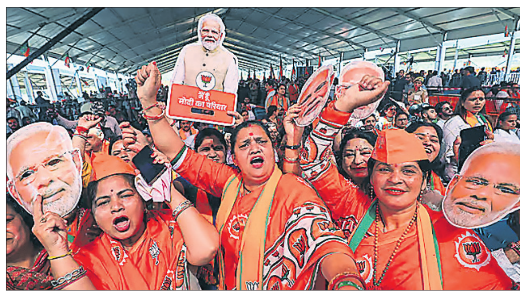
କଂଗ୍ରେସର ଉପମୁଖରେ ଲୋକ ସଭା ନିର୍ବାଚନ ପାଇଁ ପ୍ରଧାନମନ୍ତ୍ରୀ ନରେନ୍ଦ୍ର ମୋଦିଙ୍କ ସଭାରେ ଭାଜପାର ମହିଳା ସମର୍ଥକ।

ଦଶନ୍ଧି ପରେ କଂଗ୍ରେସ-କମ୍ପାନୀରେ ଆତଙ୍କବାଦୀଙ୍କ ଭୟ ନ ଥାଇ ଏବଂ ବିନା କୌଣସି ସାମାପାର ରୁଲିରେ ଶାନ୍ତିପୂର୍ଣ୍ଣ ଭାବେ ନିର୍ବାଚନ ହେବାକୁ ଯାଉଛି ବୋଲି ଶୁକ୍ରବାର ପ୍ରଧାନମନ୍ତ୍ରୀ ନରେନ୍ଦ୍ର ମୋଦି କହିଛନ୍ତି। ଆସନ୍ତା ୧୯ରେ ଲୋକ ସଭା ନିର୍ବାଚନ ଅନୁଷ୍ଠିତ ହେବାକୁ ଥିବା ଉପମୁଖରେ ଏକ ସଭାକୁ ସମ୍ବୋଧିତ କରି ମୋଦି କହିଛନ୍ତି, ସମାଧାନ ଅନୁଷ୍ଠିତ ୩୭୦ ଉଲ୍ଲେଦ ହେବା ପରେ ଜନ୍ମ ଓ କମ୍ପାନୀବାସୀ ଦାୟିତ୍ୱ ନିରି ଭୋଗୁଥିବା ଦୁର୍ଦ୍ଦଶାର ଅନ୍ତ ଘଟିଛି। ତାଙ୍କ ସରକାର ଲୋକଙ୍କ ଆଶା ଆକାଂକ୍ଷାକୁ ପୂରଣ କରିଛି। କଂଗ୍ରେସ ସମେତ ବିରୋଧୀ ଦଳଗୁଡ଼ିକର ସତ୍ୟାହସ ଥିଲେ ସେମାନେ ସମାଧାନର ଧାରା ୩୭୦କୁ ଫେରାଇ ଆଣନ୍ତୁ ବୋଲି ପ୍ରଧାନମନ୍ତ୍ରୀ ଚ୍ୟାଲେଞ୍ଜ କରିଛନ୍ତି। ଅନ୍ୟପକ୍ଷେ ପ୍ରଧାନମନ୍ତ୍ରୀ ଉପମୁଖରେ ନିର୍ବାଚନୀ ସଭାକୁ ସମ୍ବୋଧିତ କରୁଥିବାବେଳେ