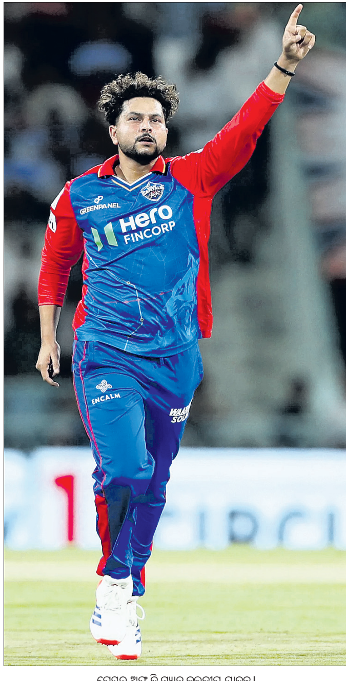
ଦୈନିକ ଅଫ ଦି ମ୍ୟାଚ୍ କ୍ରମାବଳୀ ଯାଦବ।

ଲକ୍ଷ୍ମୀ, ୧୨୧୪ ଇଣ୍ଡିଆନ ପ୍ରିମିୟର ଲିଗ୍ ଶୁକ୍ରବାର ଅନୁଷ୍ଠିତ ମ୍ୟାଚରେ ଦିଲ୍ଲୀ କ୍ୟାପିଟାଲ୍ସ ୬ ରନର ସମତାରେ ଲକ୍ଷ୍ମୀକୁ ହରାଇଲା। ଆୟତ୍ତକ୍ରମରେ ଅପରାଧିତ ଅର୍ଦ୍ଧଶତକ ବଳରେ ଲକ୍ଷ୍ମୀ ୨୦ ଓଭରରେ ୪ ରନର ହାରରେ ୧୬୦ ରନ କରିଥିଲା।