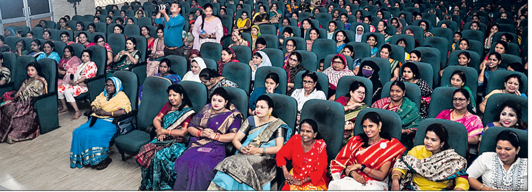
କଟକ ସାରଳା ଭବନରେ ଅନୁଷ୍ଠିତ ସମାବେଶରେ ଯୋଗଦେଇଥିବା ମହିଳାମାନେ।