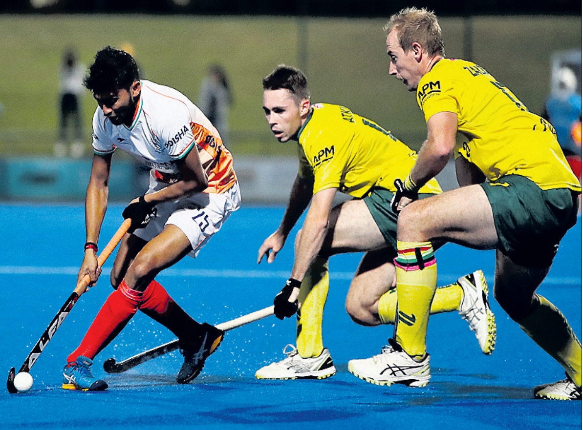
ପର୍ଥରେ ଶୁକ୍ରବାର ଭାରତ ଓ ଅଷ୍ଟ୍ରେଲିଆ ମଧ୍ୟରେ ଅନୁଷ୍ଠିତ ହକି ମ୍ୟାଚର ଏକ ସଂଘର୍ଷପୂର୍ଣ୍ଣ ମୁହୂର୍ତ୍ତ।