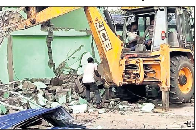
କେସିବି ସାହାଯ୍ୟରେ ବେଆଇନ ଦୋକାନଗୃହ ଭଙ୍ଗାଯାଇଛି ।

ବାଙ୍କୀ ମେଡିକାଲ ରୋଡ଼ରେ ବେଆଇନ ଭାବରେ ପାଚେରିକୁ ଲାଗି ନିର୍ମାଣ କରାଯାଇଥିବା ଦୋକାନ ଗୃହଗୁଡ଼ିକୁ ଶୁକ୍ରବାର ଅପରାହ୍ନରେ କେସିବି ସାହାଯ୍ୟରେ ଭଙ୍ଗି ଦିଆଯାଇଛି । ଏ ସଂକ୍ରାନ୍ତରେ ବହୁ ପୂର୍ବରୁ ବାଙ୍କୀ ପ୍ରଶାସନକୁ ଅଭିଯୋଗ କରାଯାଇଥିଲେ ମଧ୍ୟ କୌଣସି କାର୍ଯ୍ୟାନୁଷ୍ଠାନ ନିଆଯାଇନଥିଲା । ଶୁକ୍ରବାର ବାଙ୍କୀ ନିର୍ବାଚନ ମଞ୍ଜୁଳା ସୁବ କଂଗ୍ରେସ ସଭାପତି ରାଜେଶ କୁମାର ବେହେରାଙ୍କ ନେତୃତ୍ୱରେ ଏକ ପ୍ରତିନିଧିମଣ୍ଡଳୀ ବାଙ୍କୀ ଉପଜିଲ୍ଲାପାଳଙ୍କ କାର୍ଯ୍ୟାଳୟକୁ ଯାଇ