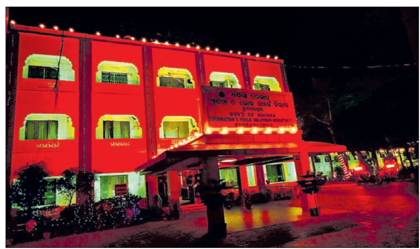
ରାଜ୍ୟ ସୂଚନା ଓ ଲୋକ ସମ୍ପର୍କ ବିଭାଗ କାର୍ଯ୍ୟାଳୟ