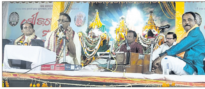
କାର୍ଯ୍ୟକ୍ରମରେ ବକ୍ତାମାନେ ପ୍ରବଚନ ଦେଇଛନ୍ତି।

ପରିସରରେ ଦୈନିକ ବୈଦିକ ମହାଯଜ୍ଞ, ଆଧ୍ୟାତ୍ମିକ ଭାବଧାରା ଓ ଚେତନାକୁ ଜାଗ୍ରତ କରୁଛି। ସେହିପରି ସନ୍ଧ୍ୟା ୬ଟାରେ ପ୍ରବକ୍ତାମାନଙ୍କ ଦ୍ୱାରା ଶ୍ରୀଜଗନ୍ନାଥଙ୍କ କଥାମତ୍ତ ଆଲୋଚନା କରାଯାଇଛି।