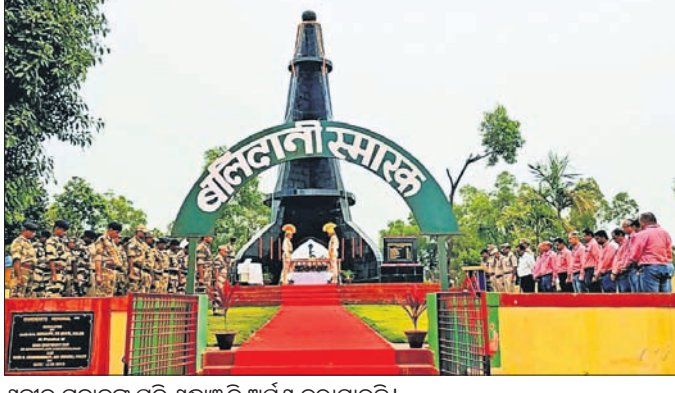
ଶହୀଦ ଯବାନଙ୍କ ପ୍ରତି ଶ୍ରଦ୍ଧାଞ୍ଜଳି ଅର୍ପଣ କରାଯାଇଛି।

କୋରାପୁଟ ଜିଲ୍ଲା ନାଲକୋ ବାମନଯୋଡ଼ି ଖଣି ଅଞ୍ଚଳରେ ୨୦୦୯ ଏପ୍ରିଲ ୧୨ରେ ମାଉସାସା ଆକ୍ରମଣରେ ଶହୀଦ ଯବାନଙ୍କୁ ପ୍ରତି ଶ୍ରଦ୍ଧାଞ୍ଜଳି ଅର୍ପଣ କରାଯାଇଛି।