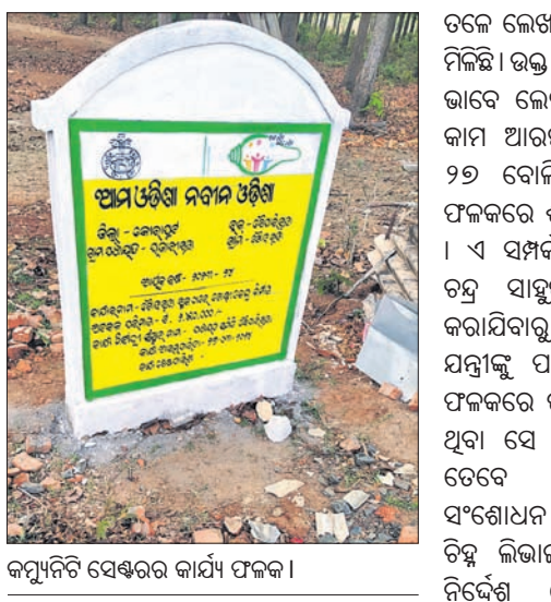
କମ୍ପ୍ୟୁଟିସି ସେକ୍ସର କାର୍ଯ୍ୟ ଫଳକ।

ନିର୍ବାଚନ ଆଚରଣବିଧି ଉଲ୍ଲଂଘନ ଅଭିଯୋଗ ଗଢାଯାଇଛି।