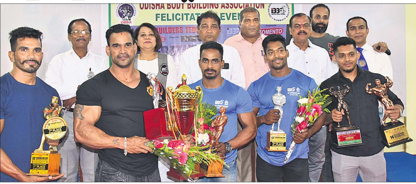
ସମ୍ବର୍ଦ୍ଧିତ ବଡ଼ବିଲ୍ଲୁରମାନେ ଅତିଥି ଓ କର୍ମକର୍ତ୍ତାଙ୍କ ଗହଣରେ ।