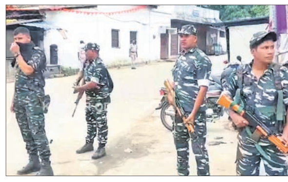
ହନୁମାନ ଜୟନ୍ତୀ ପାଇଁ ସହରରେ ପୋଲିସ୍ ପୁରସ୍କା ବ୍ୟବସ୍ଥା ।

■ ହନୁମାନ ଝଣାରେ ଚୈତ୍ତ୍ୟମୟ ସାରା ସହର ■ ସମ୍ବେଦନଶୀଳ ସ୍ଥାନରେ ପୋଲିସ୍ ପହଞ୍ଚା