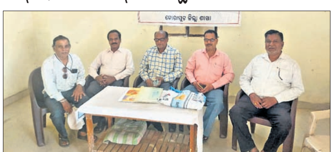
ବୈଠକରେ ଉପସ୍ଥିତ କର୍ମକର୍ତାମାନେ ଆଲୋଚନା କରୁଛନ୍ତି।

କୋରାପୁଟ, ୧୩/୪ (ପବନ ପାଣିଗ୍ରାହୀ) କୋରାପୁଟ ଜିଲ୍ଲା ଶାଖାର ଏକ ବୈଠକ ସଭାପତି ଚେତେ ଜିଲ୍ଲା ସ୍ତରରେ ହୋଇଥିବା କଣ୍ଠୋଲ ରୁମ୍ ଲୋକେ ଜଣାଇପାରିବେ ବୋଲି ଜିଲ୍ଲା ପ୍ରଶାସନ ପକ୍ଷରୁ କୁହାଯାଇଛି।