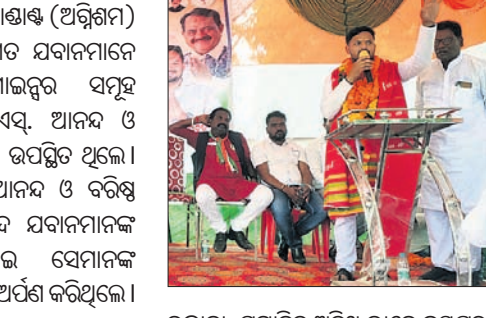
କୋରାପୁଟ ଜିଲ୍ଲା ଦଶମକ୍ରମରେ କଂଗ୍ରେସର କର୍ମୀ ସମ୍ମିଳନୀ ଶୁଭାରମ୍ଭ ହୋଇଛି।