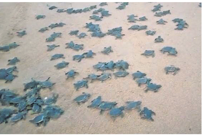
ମାସ ପର୍ଯ୍ୟନ୍ତ ସାମୁଦ୍ରିକ କଟକଣା ଜାରି ସୂଚନା ଉପରେ ଛୁଆଁ ପୁଟାଇବା ପାଇଁ କରାଯାଇଛି। ଅଲିଭ୍ ରିଡ୍‌ଲେ କଳଙ୍କି