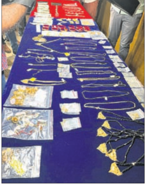
ଜବତ ଅଳଙ୍କାର, ଟଙ୍କା ଓ ଅନ୍ୟାନ୍ୟ ସାମଗ୍ରୀ।