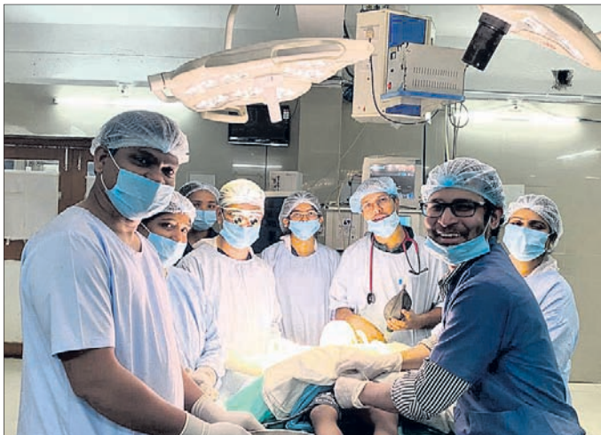
କଟକ, ୧୩/୪ (ଶିଶୁ ପ୍ରିୟଦର୍ଶିନୀ)

କୁକୁର କାମୁଡ଼ାରେ ଗୁରୁତର ହୋଇ କଟକ ଏସ୍‌ସିବି ମେଡିକାଲକୁ ଆସିଥିବା ଜଣେ ଶିଶୁଙ୍କୁ ଅସ୍ତ୍ରୋପଚାର ପ୍ରକାଶ ପାଇବା ପରେ ସଫଳତାର ସହ ଶନିବାର କରାଯାଇଛି। ଏହା ପୂର୍ବରୁ ଶିଶୁ ଗଭୀର ଆହତ ହୋଇଥିଲେ। ଏବେ ମେଡିକାଲ ପ୍ରଶାସନିକ ଏକ କୁକୁର କାମୁଡ଼ିବେବାରୁ ବିବେକୀୟ ମୁହଁରେ ଗଭୀର କ୍ଷତ ହୋଇଥିଲା। ଗୁରୁତର ଅବସ୍ଥାରେ ତାଙ୍କୁ ଭଦ୍ରକ ଜିଲ୍ଲା ପୁଖ୍ୟ ଚିକିତ୍ସାକର ଭର୍ତ୍ତି କରାଯାଇଥିଲା। ହେଲେ ସ୍ୱାସ୍ଥ୍ୟାବସ୍ଥା ବିଗଢ଼ିବାରୁ ତାଙ୍କୁ ଏସ୍‌ସିବି ମେଡିକାଲକୁ ସ୍ଥାନାନ୍ତର କରାଯାଇଥିଲା। ପୁଖ୍ୟ କଟକ ଏସ୍‌ସିବି ମେଡିକାଲକୁ ଆସିଥିବା ଜଣେ ଶିଶୁଙ୍କୁ ଅସ୍ତ୍ରୋପଚାର ପ୍ରକାଶ ପାଇବା ପରେ ସଫଳତାର ସହ ଶନିବାର କରାଯାଇଛି। ଏହା ପୂର୍ବରୁ ଶିଶୁ ଗଭୀର ଆହତ ହୋଇଥିଲେ। ଏବେ ମେଡିକାଲ ପ୍ରଶାସନିକ ଏକ କୁକୁର କାମୁଡ଼ିବେବାରୁ ବିବେକୀୟ ମୁହଁରେ ଗଭୀର କ୍ଷତ ହୋଇଥିଲା। ଗୁରୁତର ଅବସ୍ଥାରେ ତାଙ୍କୁ ଭଦ୍ରକ ଜିଲ୍ଲା ପୁଖ୍ୟ ଚିକିତ୍ସାକର ଭର୍ତ୍ତି କରାଯାଇଥିଲା। ହେଲେ ସ୍ୱାସ୍ଥ୍ୟାବସ୍ଥା ବିଗଢ଼ିବାରୁ ତାଙ୍କୁ ଏସ୍‌ସିବି ମେଡିକାଲକୁ ସ୍ଥାନାନ୍ତର କରାଯାଇଥିଲା। ପୁଖ୍ୟ କଟକ ଏସ୍‌ସିବି ମେଡିକାଲକୁ ଆସିଥିବା ଜଣେ ଶିଶୁଙ୍କୁ ଅସ୍ତ୍ରୋପଚାର ପ୍ରକାଶ ପାଇବା ପରେ ସଫଳତାର ସହ ଶନିବାର କରାଯାଇଛି। ଏହା ପୂର୍ବରୁ ଶିଶୁ ଗଭୀର ଆହତ ହୋଇଥିଲେ। ଏବେ ମେଡିକାଲ ପ୍ରଶାସନିକ ଏକ କୁକୁର କାମୁଡ଼ିବେବାରୁ ବିବେକୀୟ ମୁହଁରେ ଗଭୀର କ୍ଷତ ହୋଇଥିଲା। ଗୁରୁତର ଅବସ୍ଥାରେ ତାଙ୍କୁ ଭଦ୍ରକ ଜିଲ୍ଲା ପୁଖ୍ୟ ଚିକିତ୍ସାକର ଭର୍ତ୍ତି କରାଯାଇଥିଲା।