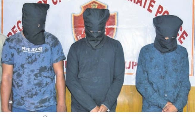
ଗିରଫ ହୋଇଥିବା ଡକ୍ଟରୀ ଗ୍ୟାଙ୍ଗ୍‌ର ୩ ସଦସ୍ୟ।

ଭୁବନେଶ୍ୱର ସମେତ ଖୋର୍ଦ୍ଧା, ଯଦି ଚୋରି ବା ଡକ୍ଟରୀ ବେଳେ କେହି ବିରୋଧ କଲେ ମାରଣାଣ୍ଡ କେନ୍ଦ୍ରାପଡ଼ାରେ ବେଶ୍ ସକ୍ରିୟ ରହିଛନ୍ତି। ବିଶେଷକରି ସେମାନେ ବିଭିନ୍ନ ଅଞ୍ଚଳରେ ଘାନାୟ ଲୋକଙ୍କୁ ଇନ୍ଦ୍ରପାଠୀର ରଖି ବନ୍ଦ ଥିବା ଘର ଓ ଟଙ୍କା, ଗହଣା ଘରେ ରଖିଥିବା ପରିବାର ସମ୍ପର୍କରେ ଚିକିତ୍ସା ସୂଚନା ପାଇଥାନ୍ତି। ପରେ ବିଭିନ୍ନ ସୂଚନା ଦେଖି ସେମାନେ ଘରକୁ ଗାର୍ଗେଟ କରି କଳାକନା ରୁଲାଇଥାନ୍ତି।