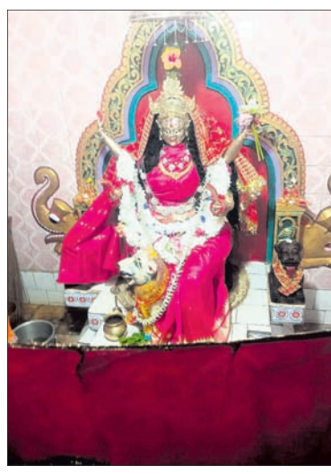
ଜଗଣୀ କୁଟିଆରାସ୍ଥିତ ମା' ଜାଗୁକୋଳି କାତ୍ୟାୟନୀ ଦେବୀ।