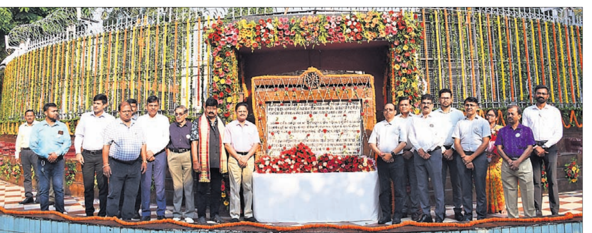
ଭୁବନେଶ୍ୱର, ୧୩୪ (ବନ୍ଦନା ସେଠୀ)