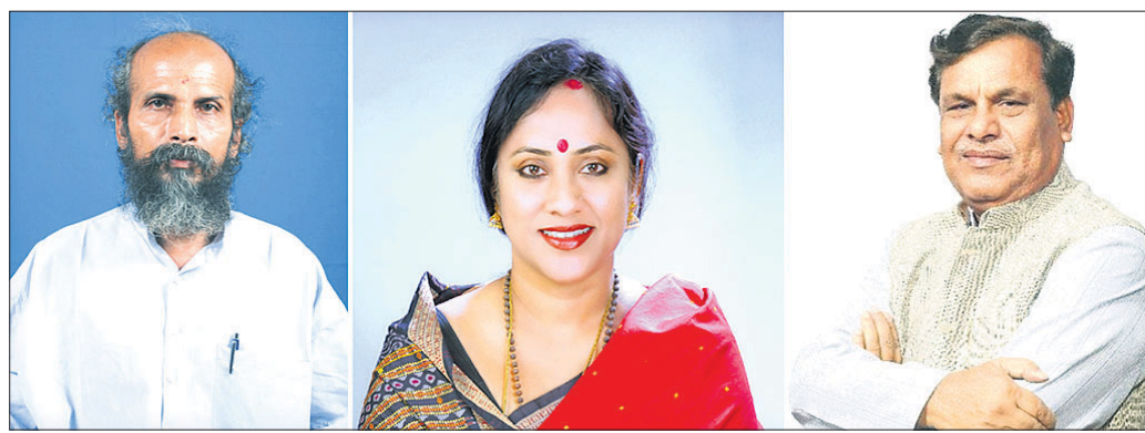
ପ୍ରତାପ ଚନ୍ଦ୍ର ଷଡ଼ଙ୍ଗୀ