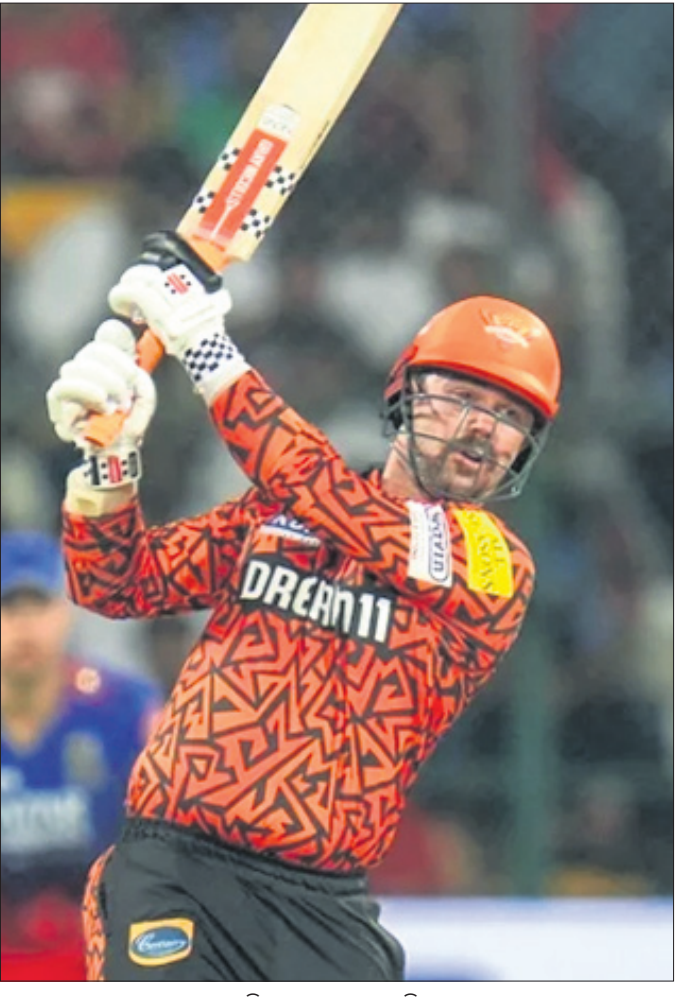
ଶର୍ ଖେଳିବା ଅବସରରେ ଗ୍ରାଭିସ୍ ହେଡ୍।

ଆଇପିଏଲ୍ କାର୍ଯ୍ୟକ୍ରମ (ଆଜିର ମ୍ୟାଚ) କୋଲକାତା ବନାମ ରାଜସ୍ଥାନ ସ୍ଥାନ: କୋଲକାତା ସମୟ: ସନ୍ଧ୍ୟା ୭.୩୦ ପ୍ରସାରଣ: ଷ୍ଟାର୍ ସ୍ପୋର୍ଟ୍ସ