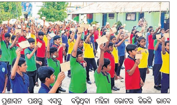
ନିର୍ବାଚନ ମହାପର୍ବରେ ଶ୍ରତପ୍ରତିଷ୍ଠା ମତଦାନ ପାଇଁ ପ୍ରସ୍ତୁତି

ଆୟତ୍ତ ଆୟତ୍ତ ଅନୁଗୋଳ ଜିଲ୍ଲାର ଶ୍ରତି ବିଧାନସଭା ଆସନରେ ମତଦାନ କରାଯିବ। ଏହି ମତଦାନ ପର୍ବରେ ସମସ୍ତେ ସାମିଲ ହୋଇ ଦେଶ ପାଇଁ ଗର୍ବ ବଢ଼ାଇବାକୁ ଜିଲ୍ଲା ପ୍ରଶାସନ ପକ୍ଷରୁ ଆହ୍ୱାନ ଦିଆଯାଇଛି।