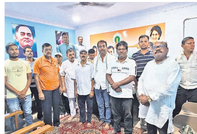
ତାଳଚେର, ୧୫୫୪