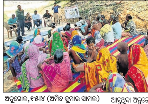
ଅନୁଗୋଳ, ୧୫୪୪ (ଅମିତ କୁମାର ସାମଲ)

ନିର୍ବାଚନ ମହାପର୍ବରେ ଅନୁଗୋଳ ଜିଲ୍ଲାର ସମସ୍ତ ଭୋଟରଙ୍କୁ ସାମିଲ କରିବାକୁ ପ୍ରସ୍ତୁତି ଆରମ୍ଭ ହୋଇଛି। ଯେତକି ଜଣେ ହେଉଛି ବି ମତଦାତା ମତଦାନରୁ ବାଦ ନ ପଡ଼ିବେ ସେ ନେଇ ସଚେତନତା କାର୍ଯ୍ୟକ୍ରମକୁ ବ୍ୟାପକ କରାଯାଇଛି।