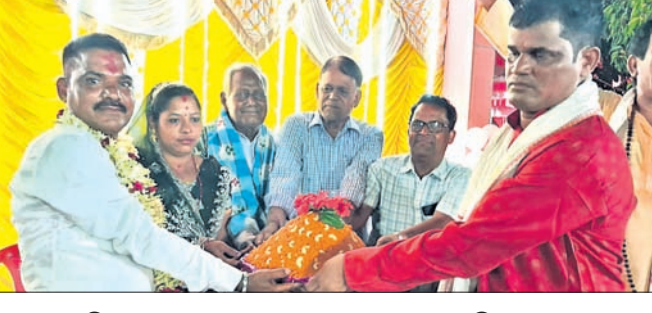
ପ୍ରବେଶ କରିଥିଲେ। ପରେ ଆଖାପାଖି ଆଖାପାଖି ଆଖାପାଖି ଶୁଖିଲା ମା'ଙ୍କ ଦର୍ଶନ କରିଥିଲେ। କର୍ମ ସମ୍ପନ୍ନ ଆଜ୍ଞାପାଳ ଓ ଆଜ୍ଞାପାଳ ନିର୍ମାଣ କରାଯାଇଥିଲା।

ଅନୁଗୋଳ ଜିଲ୍ଲା ବେଳୁପୁର ଗ୍ରାମର ଅଧ୍ୟକ୍ଷାତ୍ମା ଦେବୀ ମା' ବାସନ୍ତିକ ଦୁର୍ଗାଙ୍କ ସପ୍ତମୀ ପୂଜା ପାଳିତ ହୋଇଯାଇଛି। ପ୍ରଥମେ ମାଙ୍କ ଆଳମ ଏବଂ ଆଜ୍ଞାପାଳକୁ ଏକ ବିରାଟ ପତୁଆରେ ଗ୍ରାମ ପରିକ୍ରମା କରାଯାଇଥିଲା।