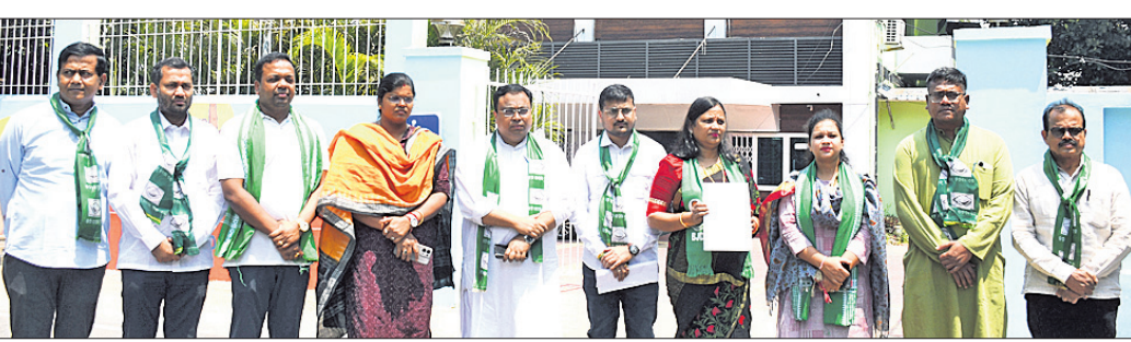
ରାଜ୍ୟ ମୁଖ୍ୟ ନିର୍ବାଚନ ଅଧିକାରୀଙ୍କୁ ଭେଟିବାକୁ ଆସିଥିବା ବିଜେଡି ପ୍ରତିନିଧି ।