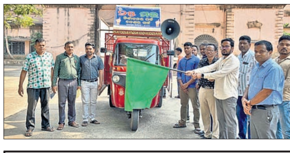
ଅନୁଗୋଳ, ୧୫୪୪