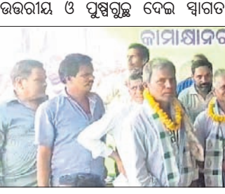
କାମାକ୍ଷାନଗର, ଦବୀଚନ୍ଦ୍ର ମଣ୍ଡଳୀ