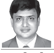
ଡା. ସମ୍ପାଦକ କର

ସେ ଦିନ ବଦଳିବାକୁ ମୋର କମ୍ପ୍ୟୁଟର କ୍ଷିପ୍ରଲିଖିତ ସହକାରୀ ଶୁଦ୍ଧକ୍ଷେତ୍ର ଶ୍ରୀକାନ୍ତର ମୋର ବାଜିରିଠିଲା। ସକାଳୁଆ ଶୁଦ୍ଧକ୍ଷେତ୍ର ଜଣାଇବା ସହ ବ୍ୟବହାର କଣ୍ଠରେ କହିଲା ଯାଉ, ମୋ ସମ୍ପର୍କିତ ଭାଇ ବିକୃତି ସହଜେ ଇଚ୍ଚପ୍ରତ୍ୟ ଥିବାବେଳେ ପୂର୍ଣ୍ଣ ପାଇଁ କର୍ମସଂସ୍ଥାନ ବ୍ୟବହାରିତ କରିଛି। ବହୁ ଆଶ୍ଚର୍ଯ୍ୟର କଥା ଅବସର ସମୟ ବା କେବଳ ଶୋଇଲା ବେଳ ନୁହଁ ଅନ୍ୟ ସମୟରେ ସେ ଟା ମୋବାଇଲ ମୋ କମ୍ପ୍ୟୁଟରରେ ବହୁ ବ୍ୟବହାର ହୋଇ ଏଣୁରେକ୍ଟ କ’ଣ ସବୁ ଦେଖୁଛି ? ନିଜକୁ ନିଜ ବେଳେବେଳେ ଚିହ୍ନିତ୍ୱା ପରି ହୋଇଯିବା ସହ ବିଚିତ୍ର ଶବ୍ଦ ସବୁ କିନ୍ତୁ ଯଦି ଟା’ର କୌଣସି ମାନସିକ ସମସ୍ୟା ନାହିଁ। କିନ୍ତୁ ସେ କମ୍ପ୍ୟୁଟର ଓ ମୋବାଇଲରେ ଯେଉଁପରି ଅପ୍ରବ୍ୟସ୍ତ ହୋଇ ଚିହ୍ନିତ୍ୱା ହେଉଛି ବିଶେଷକରି ଇ-ମେଲ୍ ସବୁ ଖୋଲି ଯୋସିଆଲ ମିଡିଆରେ ସକ୍ରିୟର ବାହାମା ସମ୍ବନ୍ଧରେ ଦେଖାଉଛି କି ? ପୂର୍ଣ୍ଣ ଶ୍ରୀକାନ୍ତକୁ କହିଲି, ତମେ ମୋ ଲେଖା ସହ ଏପରି କିହିତ ହୋଇଯାଇଛ ଯେ ତୁମେ ବେଶ୍ ଭଲ ଭାବେ ସେହି ପିଲାଟିର ତଥ୍ୟ ମୋତେ ଜଣାଇ ପାରିଲ, ବ୍ୟସ୍ତ ହୁଅନା ପୂର୍ଣ୍ଣକୁ ସବିଶେଷ କରୁଛି। ଆଜିର ସମୟରେ ଲୋକମାନଙ୍କ ଅଧିକାଂଶ ସମୟ କମ୍ପ୍ୟୁଟର ନଟେର୍ ମୋବାଇଲରେ ଯାଉଛି। ପୂର୍ବରୁ ଲୋକମାନଙ୍କର ଏ ଦୁର୍ବଳତା ଥିଲା, କିନ୍ତୁ ଏବେ କରୋନା ବିକାଶିକା ପାଇଁ ବର୍ଷ ବର୍ଷ ଘରେ ବସି ଅନୁଲୀନ ସହ ବେଶି ଆସକ୍ତ ହୋଇଗଲେ। ସବୁଠାରୁ ବଡ଼ କଥା ସୋସିଆଲ ମିଡିଆର ଭଲ ଦିଗ ଯେତିକି ରହିଛି ଖରାପ ଦିଗ ମଧ୍ୟ ତତୋଧିକ। ଆପଣଙ୍କ ହାତ ପାହାଞ୍ଜରେ ସମଗ୍ର ବିଶ୍ୱ ବ୍ରହ୍ମାଣ୍ଡର ସମଗ୍ର ଜ୍ଞାନ, ପାଠକାଠ, ମନୋରଞ୍ଜନ, ସବୁ ପ୍ରକାର ଉତ୍ତର ସବୁକିଛି ପାଇବେ। କିନ୍ତୁ ଏହା ଆପଣଙ୍କୁ ଯେତିକି ଦେଉଛି ତା’ଠାରୁ ଅଧିକ ଯାହା ସବୁ କ୍ଷତି କରୁଛି ତାର ବଡ଼ ବିପାହରଣ ହେଉଛି ଡ୍ରୁମିଞ୍ଚୋଲିଙ୍ଗ। ସୋସିଆଲ ମିଡିଆରେ ନିକାରାମୂଳ ଖବରଗୁଡ଼ିକୁ ପଢ଼ିବାର ଅଧିକ ସମୟ ବିଚାରଣା ସହ ଖୋଜିବାର ଅଭାବକୁ ମନୋବିଜ୍ଞାନ ଭାଷାରେ ‘ଡ୍ରୁମିଞ୍ଚୋଲିଙ୍ଗ’ ବା ‘ଡ୍ରୁମି ସରପିଙ୍ଗ’ ନାମ ଦିଆଯାଇଛି। ଡ୍ରୁମିଞ୍ଚୋଲିଙ୍ଗ ଏକପ୍ରକାର ମାନସିକ ଅଭାବ ଏବଂ କରୋନା ପରେ ଏହା ଏକ ଗମ୍ୟର