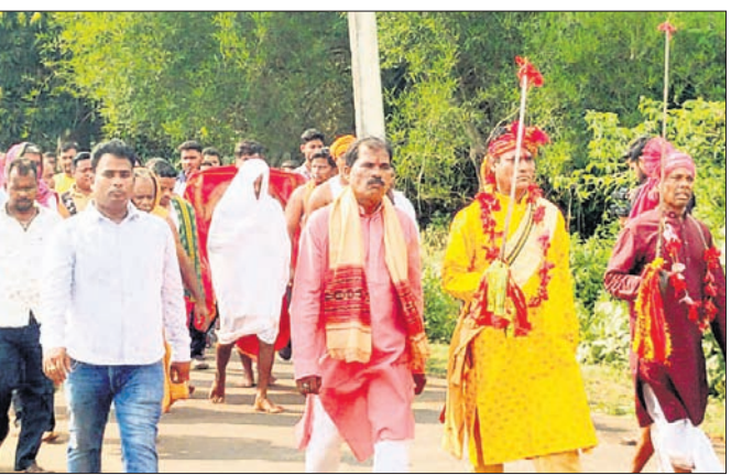
ତାଳଚେର, ୧୫୫୪ (ମନୋଜ ନନ୍ଦ)

ତାଳଚେରର ଅଧିକାଂଶ ଦେବୀ ଅଗ୍ନିଭୂପା ମା' ହିଲୁଲାଇ ଯାତ୍ରା ଆସନ୍ତା ୨୨ ତାରିଖରୁ ଆରମ୍ଭ ହେବ। ଏଥିପାଇଁ ମା'ଙ୍କ ଜନ୍ମଦିନ ପର୍ବ ଗୋପାଳପ୍ରସାଦପୁର ମା'ଙ୍କୁ ଭଜଣେ ପାଠରେ ପାଳିତ