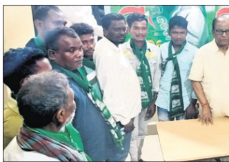
ପରଜଙ୍ଗ, ୧୫୫୪ (ନିଗମାନନ୍ଦ ଦଳବେହେରା) / ଭୁବନ (ବିପିନ ବିହାରୀ ସେଠୀ)

କଲକତ୍ତା, ୧୫୫୪ (ପରିଷିତ ସାହୁ) ଅନୁଗୋଳ କିଲ୍ଲା କିଶୋରନଗର ବ୍ଲକ୍ ଅଞ୍ଚଳ ଥାନା ଅଞ୍ଚଳରେ ବିଜେଡି ସହ ଅଜଣା ଲୋକମାନଙ୍କ ଉପସ୍ଥିତି ଦେଖିବାକୁ ମିଳିଛି। ଫଳରେ ଗ୍ରାମାଞ୍ଚଳରେ ନାନା ଆଶଙ୍କା ପ୍ରକାଶ ପାଉଛି। ରବିବାର ସିରିପିପାଲି ଗ୍ରାମରେ ଜଣେ ଅଜଣା ଅଣାଡ଼ିଆ ବ୍ୟକ୍ତିଙ୍କୁ ନେଇ ଲୋକେ ଭୟଭୀତ ହୋଇପଡ଼ିଥିଲେ। ପିଲ୍ଲା ଗୋର ସଦେହ କରି ସମ୍ପୃକ୍ତ ବ୍ୟକ୍ତିଙ୍କୁ ପ୍ରଥମେ ଗ୍ରାମର ଅଧିକ ରଖାଯାଇଥିଲା। ପରେ ତାଙ୍କୁ ଛାଡ଼ି ଦିଆଯାଇଥିଲା। ଘଟଣାରୁ ଜଣାପଡ଼ିଛି, ଅନ୍ୟ ରାଜ୍ୟରୁ କେତେଜଣ ମହିଳା ଓ ପୁରୁଷ ଆସି କଲକତ୍ତା, ଡାକ୍ ଆଖି ପାଖ ଅଞ୍ଚଳରେ ଯାଯାବର ଭାବେ ପ୍ରଥମେ ରହୁଛନ୍ତି। ପରେ ବିଭିନ୍ନ କରୁଥିବା ଅଭିଯୋଗ ହୋଇଛି। ରବିବାର ଜଣେ ଅଣାଡ଼ିଆ ବ୍ୟକ୍ତି ମହିଳାଙ୍କ ଡ୍ରେସିଂ