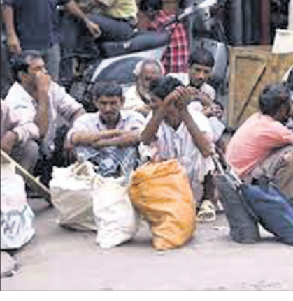
ଟିକସ ଚିହାନ୍ତି ପାଇବେ, ରଣ ପରିଶୋଧ କରିବାକୁ ପଡ଼ିବ ନାହିଁ। ଯଦି ପଡ଼ିବ କମ୍ ପଡ଼ିବ ଏବଂ ଟିକସର ବୋଧ ଗରିବଙ୍କ ଉପରେ ବେଶି ପଡ଼ିବ। ବର୍ତ୍ତମାନ ଧନୀ, ଶିଳ୍ପପତି, ପୁଞ୍ଜିପତି ତଥା କର୍ମଚାରୀମାନଙ୍କୁ ସ୍ୱାଧୀନ ଯେଉଁଥିରେ ସାଧନ ହେବ, ସେହିପରି ପଦକ୍ଷେପ ନିଆଯାଉଛି ଏବଂ ଟିକସଦାତାଙ୍କ ଅର୍ଥରେ ଘନ ଘନ ପ୍ରଚାର କରାଯାଉଛି। ଦେଶରେ ଦରଦାନ ବୃଦ୍ଧି ଅତ୍ୟନ୍ତ ଭୟଙ୍କର ଏବଂ ଶିକ୍ଷା, ସ୍ୱାସ୍ଥ୍ୟ ଅପହଞ୍ଚି। ମାର୍ଚ୍ଚ ୧୮ରେ ପ୍ରକାଶିତ ଖାଲି ଉଦ୍ଧାରକାଳିନି ଲ୍ୟାଭ ରିପୋର୍ଟ ଅନୁସାରେ, ଭାରତର ଆଧୁନିକ ପୁଞ୍ଜିପତିବର୍ଗଙ୍କ ‘ବିଲିଓନେୟାର ରାଉଁ’ ଉପନିବେଶବାଦୀଙ୍କ ‘ବ୍ରତୀଶ ରାଉଁ’କୁ ବଳିଯାଇଛି।

ହେଉଛି ତାହାର ପରିଚାଳକ। ସମାଲୋଚକ, ଗଣମାଧ୍ୟମ, ନ୍ୟାୟାଳୟ, ବିରୋଧୀ ଦଳ, ବୃଦ୍ଧିକାବ୍ୟ ବିଶେଷକରି ପ୍ରଗତିଶୀଳ ଚିନ୍ତାଧାରାର ଲୋକ ଏମାନେ ହେଉଛନ୍ତି ବ୍ରହ୍ମା। ଯଦି ଦୁର୍ଗତାଗତ ଗାଡ଼ିର ବ୍ରେକ୍ ବୁକ୍ ହୁଏ ବା ଫୋକ୍ ମାରେ ଯାହା ଅବସ୍ଥା ହୁଏ, ଆମ ଦେଶରେ ଶାସନ ବ୍ୟବସ୍ଥା, ଶାସକ ଶ୍ରେଣୀର କାର୍ଯ୍ୟକଳାପ ସେହି ଅବସ୍ଥାକୁ ଗଢାନ୍ତି। ଗରିବ ଓ ଦୁର୍ବଳ ଶ୍ରେଣୀ ଉପରେ ଶୋଷଣ ରୂପେ ଗାଡ଼ି ଦୁର୍ଗତ ଗଣତନ୍ତ୍ର ଯାଉଛି। ଶାସକ ଶ୍ରେଣୀର ନୀତି ଧନିକ ଶ୍ରେଣୀକୁ ସୁଧାଉଛି। କର୍ତ୍ତବ୍ୟରେ ଜଗତ ସରକାରଙ୍କୁ ଏପରି ନୀତି ପ୍ରଣୟନ କରିବାକୁ ବାଧ୍ୟ କରୁଛି, ଯେପରି ସେମାନେ