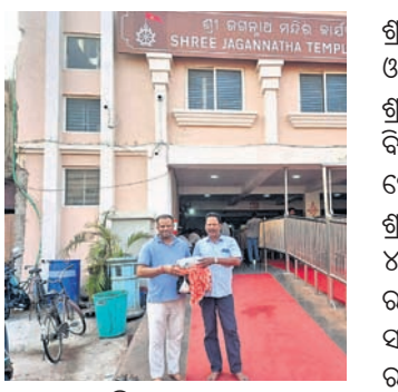
ପୁରୀରୁ ଆସିଥିବା ଆଜ୍ଞାମାଳ।