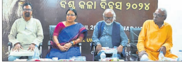
ଭୁବନେଶ୍ୱର, ୧୫.୪ (ବନ୍ଦନା ସେଠୀ)