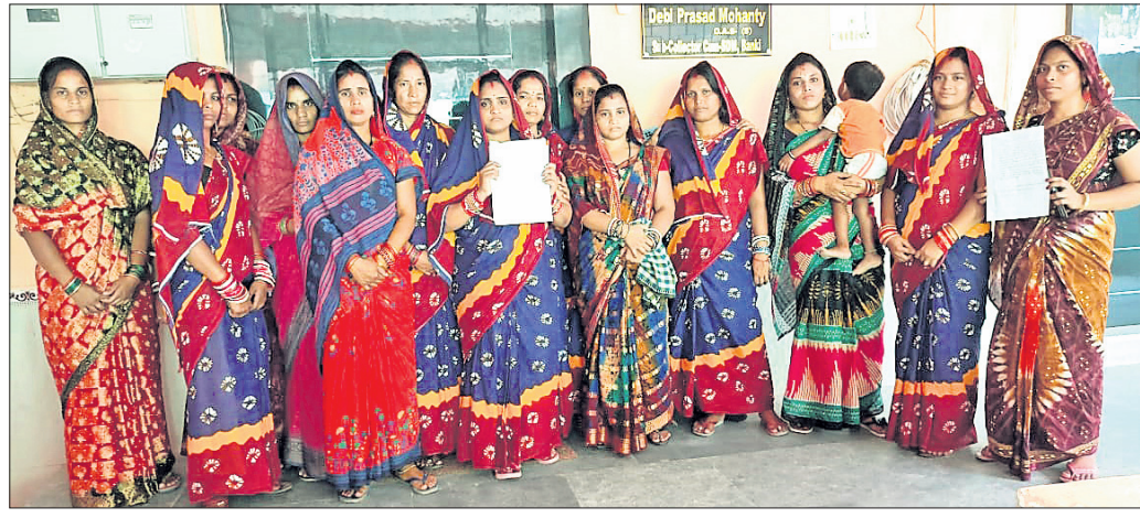
ସମ୍ପୃକ୍ତ ଅଭିଯୋଗ ଉପରେ ଭୁବନେଶ୍ୱର ସମ୍ପୃକ୍ତ ଅଭିଯୋଗ କଲେ ମହିଳା ଗୋଷ୍ଠୀ। ଏହାକୁ ଏକ କୁଳଖିଲ କାର୍ଯ୍ୟାଳୟ ନେବା ସହ କ୍ଷତିପୂରଣ ମାଛ ଉତ୍ସବ ପୋଖରୀରେ ମରି ଲାହୁଡ଼ିବା ଦେବାକୁ ମହିଳାମାନେ ଦାବି କରିଛନ୍ତି।