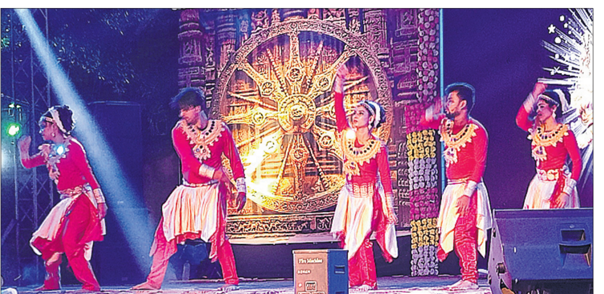
କଳାକାରମାନେ ନୃତ୍ୟ ପରିବେଷଣ କରୁଛନ୍ତି।