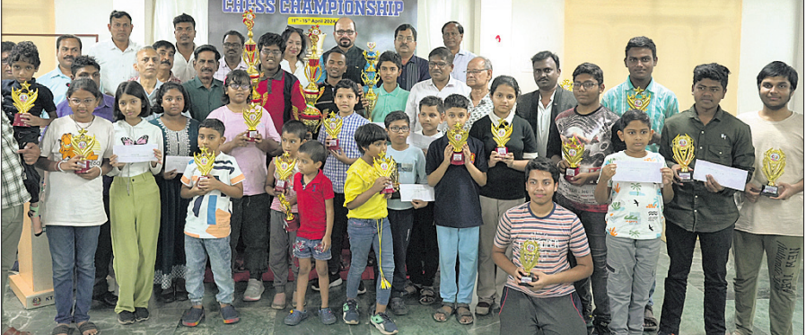
କୃତୀ ପ୍ରତିଯୋଗୀମାନେ ପୁରସ୍କାର ସହ ଅତିଥିଙ୍କ ସମ୍ମୁଖରେ।

ଭୁବନେଶ୍ୱର, ୧୫୪ (ତପନ ସାଲ୍) ଅଲ୍ ଓଡ଼ିଶା ଚେସ୍ ଆସୋସିଏସନ୍ ଓ ଅଲ୍ ଇଣ୍ଡିଆ ଚେସ୍ ଫେଡେରେସନ୍ ସହଯୋଗରେ ୧୨ଶ କେଟି ଗ୍ଲୋବାଲ୍ ସ୍କୁଲ୍ ଅଲ୍ ଓଡ଼ିଶା ଓପନ ଫିଟେ ଚେସ୍ ଟର୍ଣ୍ଣାମେଣ୍ଟ ଯୋଜନାରେ ଶେଷ ହୋଇଛି। ୯ ରାଉଣ୍ଡ ବିଶିଷ୍ଟ ପ୍ରତିଯୋଗିତାରେ ରଜପତିର