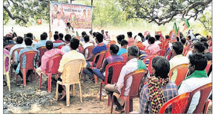
ବୈଠକରେ ଯୋଗଦେଇଥିବା ଭାଜପା ନେତା ଓ କର୍ମୀମାନେ।

ବୋଲଗଡ଼/ବେଗୁନିଆ, ୧୫୪ (ବେଦବତ୍ତ ହୋତା/ ସନ୍ଧ୍ୟାରାଣୀ ମିଶ୍ର)