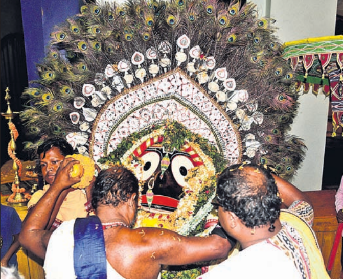
ମହାପ୍ରଭୁ ଶ୍ରୀଜଗନ୍ନାଥଙ୍କୁ ପହଣ୍ଡି କରି ନିଆଯାଉଛି ।