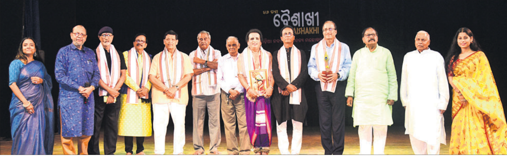
'ଡିଡା ଓ ଚେତନା' ପକ୍ଷରୁ ଯୋଗବାର ଭୁବନେଶ୍ୱର ରବୀନ୍ଦ୍ର ମଞ୍ଚପରେ ଆରମ୍ଭ ହୋଇଥିବା ୨ ଦିନିଆ ୪୬ତମ 'ଧରିତ୍ରୀ' ମହୋତ୍ସବର ଉଦ୍‌ଘାଟନ ଅବସରରେ ଅତିଥିଙ୍କ ସହ ସମ୍ବନ୍ଧିତ ବ୍ୟକ୍ତିଗଣମାନେ ।