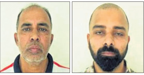
ଗିରଫ ଦୁଇ ଅଭିଯୁକ୍ତ।