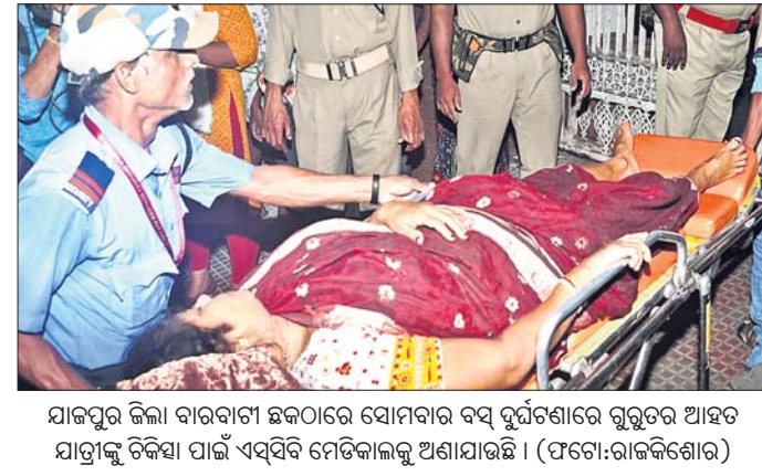
ଯାକପୁର ଜିଲ୍ଲା ବାରବାଟୀ ଉପରେ ସୋମବାର ବସ୍ ଦୁର୍ଘଟଣାରେ ଗୁରୁତର ଆହତ ଯାତ୍ରୀଙ୍କୁ ଚିକିତ୍ସା ପାଇଁ ଏସ୍‌ପି ମେଡିକାଲକୁ ଅଣାଯାଇଛି।