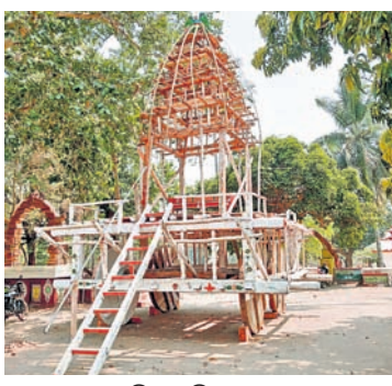
ରଥଖଳାରେ ରହିଥିବା ବିଜୟର ରଥ।