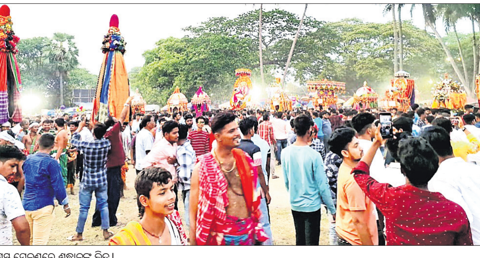
ଅଷ୍ଟଶମ୍ଭୁ ମେଳଣରେ ଶ୍ରଦ୍ଧାଳୁଙ୍କ ଭିଡ଼।

ମହାବିଷ୍ଣୁ ସଂକ୍ରାନ୍ତି ଅବସରରେ ବାଲୁଗାଁର ପ୍ରସିଦ୍ଧ ଶୈବପୀଠ ଭମାମହେଶ୍ୱର ଦେବଙ୍କ ପୀଠରେ ଦୁଇଦିନ ବ୍ୟାପୀ ଅନୁଷ୍ଠିତ ଅଷ୍ଟଶମ୍ଭୁ ମେଳଣ ଉତ୍ସବ ସୋମବାର ସନ୍ଧ୍ୟାରେ ଉଦ୍‌ଯାପିତ ହୋଇଯାଇଛି। ଉତ୍ସବର ଗ୍ରହାଧିପତି ଭମାମହେଶ୍ୱର ଦେବଙ୍କ ନିମନ୍ତେ ନିମନ୍ତେ ନିମନ୍ତେ ଗବପଦର, ଗତିଶ୍ୱରଦେବ ମଙ୍ଗଳାକପୁର, ନାଳକଣ୍ଠେଶ୍ୱର ଦେବ ନିମିଷେଡା, ବାଲୁକେଶ୍ୱର ଦେବ ବୋଳପୁଣ୍ଡା, ବାଳନିଧିଦେବ ଗବପଦର, ଚନ୍ଦ୍ରଶେଖର ଦେବ ବଡ଼କୁଳ, ରୁପେଶ୍ୱର ଦେବ ରଘୁନାଥପୁର, ଦଧିବାମନ ଦେବ ସାତରାପୁର(ବାଲୁଗାଁ), ଗୋପାଳଜୀଉ ଦେବ ପାଟଣାସାହି, ରଘୁନାଥ ଦେବ ବାଲୁଗାଁ, ରାଧାଗୋବିନ୍ଦ ଦେବ କୁଳାକୁଣ୍ଡେଶ୍ୱର ନୂଆଗାଁ, ପାଟଣା ସାହି ଓ ବୁଢ଼ପୁରୁ ଠାକୁରାଣୀଙ୍କ ସମେତ ୧୫ ଦେବଦେବୀ ବିବିଧର ରୀତିରୀତି ଶୋଭାଯାତ୍ରାରେ ଆସି ମେଳଣ ପଡ଼ିଆରେ ବିଜେ କରିଥିଲେ। ଏହା ପରେ ଠାକୁରଙ୍କୁ ପଣା ଭୋଗ ଲାଗି ହୋଇଥିଲା। ଏହି ଅବସରରେ ବିଭିନ୍ନ ଅନୁଷ୍ଠାନ ପକ୍ଷରୁ ରୀତିତମାମ ସାଂସ୍କୃତିକ କାର୍ଯ୍ୟକ୍ରମ ହୋଇଥିଲା। ସୋମବାର ଭୋଗରୁ ଠାକୁରଙ୍କୁ ଦୁଇଟି ପର୍ଯ୍ୟାୟରେ ଭୋଗଲାଗି ହେବା ସହ ଦିନତମାମ ପୂଜାର୍ଚ୍ଚନା ଜାରି ରହିଥିଲା। ସନ୍ଧ୍ୟାରେ