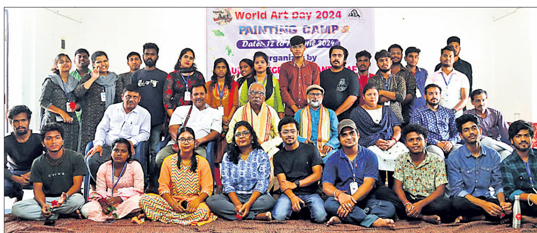
ଭୁବନେଶ୍ୱର, ୧୫.୪ (ଅନୁରାଧା ମହାରଣା)