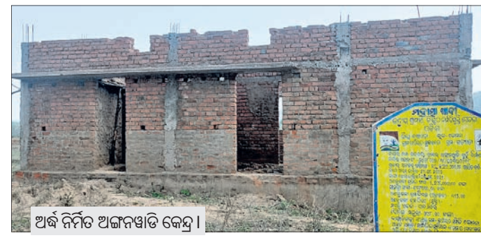
ଅର୍ଦ୍ଧ ନିର୍ମିତ ଅଙ୍ଗନୱାଡ଼ି କେନ୍ଦ୍ର।

ସ୍ୱାଧୀନତାର ଦୀର୍ଘ ବର୍ଷ ପରେ ବିଲୋକେ ମୌଳିକ ସୁବିଧାକୁ ବଞ୍ଚିତ କେନ୍ଦ୍ର ଓ ରାଜ୍ୟ ସରକାର ମାଙ୍ଗଳା ଯୋଜନା କରୁଥିଲେ ମଧ୍ୟ ଲୋକ କିମ୍ପା ଗାଁ ପର୍ଯ୍ୟନ୍ତ ପହଞ୍ଚି ପାରୁନାହିଁ।