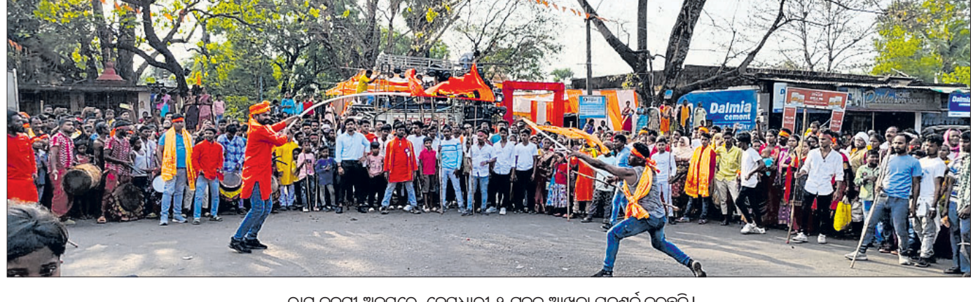
ରାମ ନବମୀ ଅବସରରେ ବେସଧାରୀ ୨ ଯୁକ୍ତ ଆଖଡ଼ା ପ୍ରଦର୍ଶନ କରୁଛନ୍ତି ।