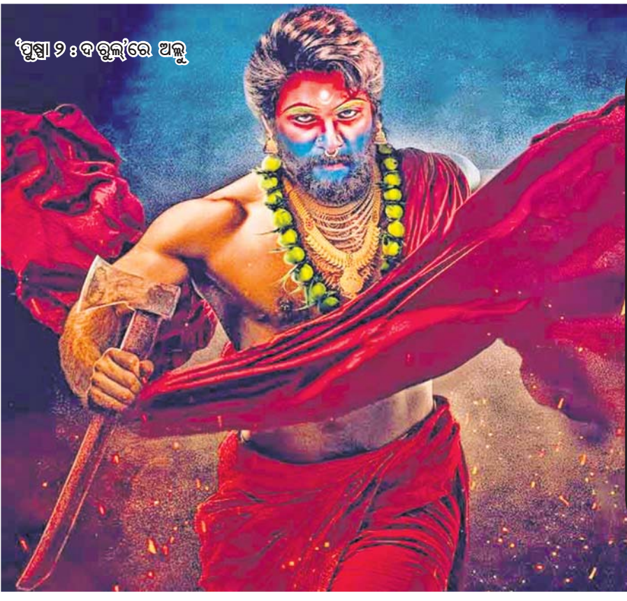
ପୁଷ୍ପା ୨ : ଦ ରୁଲ୍ରେ ଅଲୁ

ବିଲିଭରେ ଧର୍ମେନ୍ଦ୍ରଙ୍କ ବିଷୟରେ ବର୍ଣ୍ଣନା କରିବା କେବଳ ଧୂସୃତା ହେବ। କାରଣ ନିଜର ଅନାୟିକ ବ୍ୟକ୍ତିତ୍ୱ ଏବଂ ନିଖୁଣ ଅଭିନୟ କଳରେ ସେ ଏବେ ମଧ୍ୟ ଦର୍ଶକଙ୍କ ହୃଦୟରେ ରାଜ କରୁଛନ୍ତି। ତାଙ୍କ ଅଭିନୀତ ପ୍ରଥମ ସିନେମା ଥିଲା 'ଦିଲ୍ ଭି ତେରା ହମ୍ ଭି ତେରା'। ଫିଲ୍ମଟି ୧୯୭୦ରେ ରିଲିଜ୍ ହୋଇଥିଲା। ବେଶ୍ କିଛି ଆଶା ନେଇ ଏହାର ନିର୍ଦ୍ଦେଶକ ଅର୍ଜୁନ ହିଙ୍ଗରାନି ତାଙ୍କୁ ସାଇନ୍ କରାଇଥିଲେ। କିନ୍ତୁ ଯେତେବେଳେ ଫିଲ୍ମଟିକୁ ଦର୍ଶକ ପ୍ରତ୍ୟାଖ୍ୟାନ କଲେ ସେତେବେଳେ ଅର୍ଜୁନ ହିଙ୍ଗରାନି ଉତ୍ତରରେ ଭାଙ୍ଗି ପଡ଼ିଥିଲେ। ସେତେବେଳେ ଧର୍ମେନ୍ଦ୍ର ତାଙ୍କୁ ସାହୁକାରୀ ଦେଇ କହିଥିଲେ ଯେ, ପ୍ରଥମରୁ ଏମତି