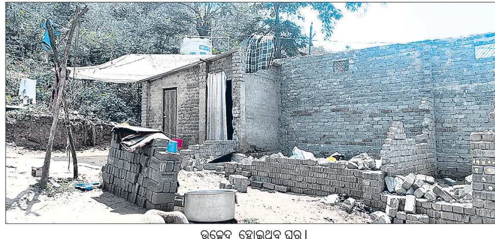
ଉଚ୍ଛେଦ ହୋଇଥିବା ଘର ।

ସୁନ୍ଦରଗଡ଼ ଜିଲା ରଘୁନାଥପାଳା ନିର୍ବାଚନମଣ୍ଡଳୀରେ ବସ୍ତି ସମସ୍ୟା ମୁଖ୍ୟ ଚେଷ୍ଟା। ରାଉରକେଲା ଲକ୍ଷ୍ମୀଚାରୁଣୀ ନଗର ୨୨ଟି ସେକ୍ଟର ଲକ୍ଷ୍ମୀଚାରୁଣୀ ଅଞ୍ଚଳ ଓ ଲାଠିକଟା ନୁକର ୨ଟି ପଞ୍ଚାୟତକୁ ନେଇ ଗଠିତ ଉଚ୍ଚ ନିର୍ବାଚନ ମଣ୍ଡଳୀରେ ରହିଛି ଛୋଟବଡ଼ ୨୫୫ରୁ ଊର୍ଦ୍ଧ୍ୱ ବସ୍ତି। ଉଚ୍ଚ ବସ୍ତି ଗୁଡ଼ିକରେ ବାସଗୃହ, ଉଚ୍ଚତ ଲକ୍ଷ୍ମୀଚାରୁଣୀ, ପରିମଳ ବ୍ୟବସ୍ଥା ଆଦି ମୌଳିକ ସୁବିଧା ପୂରଣ ହେଉ ନ ଥିବା ଯୋଗୁଁ ବିବାଦ ମୁଖ୍ୟ ଚେଷ୍ଟା। ଏହିକ୍ରମରେ ଲକ୍ଷ୍ମୀଚାରୁଣୀ ଅଞ୍ଚଳ ସେକ୍ଟର-୨ ଦୁର୍ଗାପୁର ପାହାଡ଼ ନିମ୍ନ ଅଞ୍ଚଳରେ ଥିବା ଏକତା ବସ୍ତି, ଜାମଗୋଲି, ବିନ୍ଦୁ ବସ୍ତି, ସୁବାସ ବସ୍ତି, ପାହାଡ଼ି ବସ୍ତି, ନେପାଳୀ ମନ୍ଦିର ବସ୍ତି, ଟାଙ୍କି ବସ୍ତି, ଲେଫ୍ଟିପଡ଼ା ବସ୍ତି, ସେକ୍ଟର-୫ ବସ୍ତି ସମେତ ୨୦୦ ଊର୍ଦ୍ଧ୍ୱ ବସ୍ତି ଗୁଡ଼ିକରେ ବାସଗୃହକୁ ନେଇ ବିବାଦ ଦେଖାଯାଇଛି। ରାଉରକେଲା ବନବିଭାଗ ପକ୍ଷରୁ କିଛି ଘର ଜବରଦଖଲ ଉଚ୍ଛେଦ ହୋଇଛି। ଏହାକୁ ବସ୍ତିବାସୀ ବିରୋଧ କରିଛନ୍ତି।