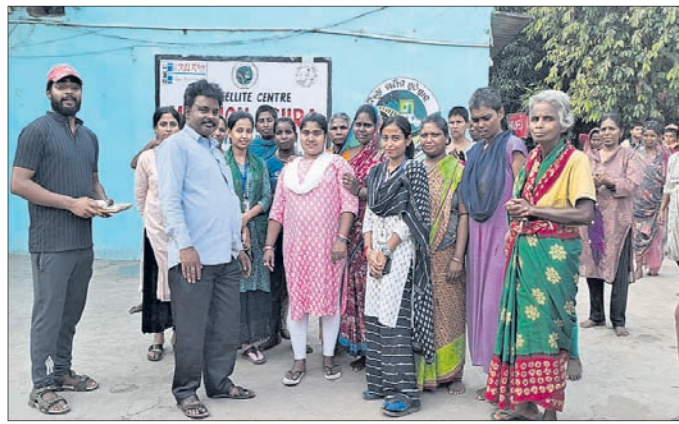
ରୋମିକୁ ବିଦାୟ ଦେଉଛନ୍ତି ମିଶନ ଆଶ୍ରା ଅନ୍ତର୍ଦ୍ଧେୟ ।

ଝାରସୁଗୁଡ଼ା, ୧୭୪୪ (ସଞ୍ଜୟ ମାଲି) ଝାରସୁଗୁଡ଼ା ଏବଂ କଟାପାଲିଠାରେ ଥିବା 'ମିଶନ ଆଶ୍ରା' ପିପୁଲସ ପ୍ରୋଗ୍ରାମ, ଜିଲ୍ଲା ଖଣିଜ ପାଣି ଓ ଜିଲ୍ଲା ପ୍ରଶାସନ ସହଯୋଗରେ ପରିଚାଳିତ ।