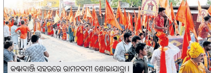
କଣ୍ଟାବାଞ୍ଜି ସହରରେ ରାମନବମୀ ଶୋଭାଯାତ୍ରା।

କଣ୍ଟାବାଞ୍ଜି, ୧୭୪୪(ଗୁରୁ ଦୟାଳ ହଂସ) ଧରଣ ଶ୍ରୀରାମ ନବମୀରେ ରାମନବମୀ ଶୋଭାଯାତ୍ରା ଆରମ୍ଭ ହୋଇଛି।