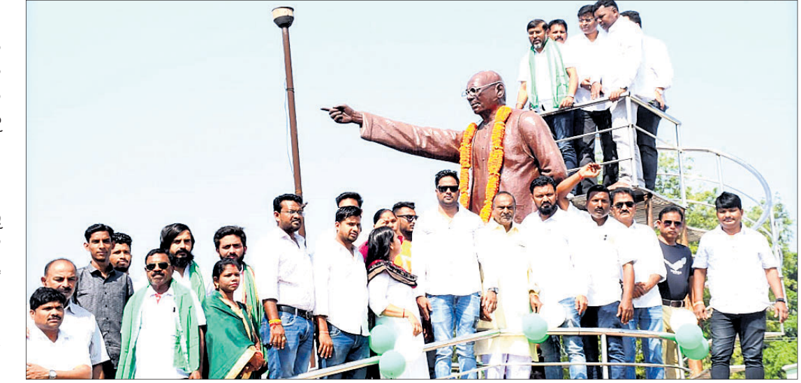
ବିଜୁ ବାବୁଙ୍କ ପ୍ରତିମୂର୍ତ୍ତି ନିକଟରେ ଦଳୀୟ ନେତା ଓ କର୍ମୀ ।

ପ୍ରବାଦ ପୁରୁଷ ରଥା ଓଡ଼ିଶାର ପୂର୍ବତନ ପୁଖ୍ୟମନ୍ତ୍ରୀ ବିଜୁ ପଟ୍ଟନାୟକଙ୍କ ଶ୍ରାଦ୍ଧ ଦିବସ ବିଜୁ ଜନତା ଦଳ ପକ୍ଷରୁ ପାଳିତ ହୋଇଯାଇଛି ।