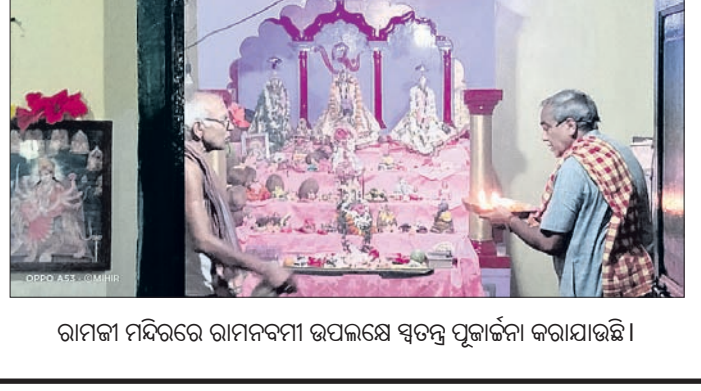
ରାମଜୀ ମନ୍ଦିରରେ ରାମନବମୀ ଉପଲକ୍ଷେ ସ୍ୱତନ୍ତ୍ର ପୂଜାର୍ଚ୍ଚନା କରାଯାଇଛି ।

ଆୟୋଜିତ ହୋଇଥିଲା। ମନ୍ଦିର ପରିଚାଳନା କମିଟିର ବେଶୁମାଧବ ତ୍ରିପାଠୀଙ୍କ ତତ୍ତ୍ୱାବଧାନରେ ମନ୍ଦିର ପୂଜକ କୃଷ୍ଣଚନ୍ଦ୍ର ପୂଜାରୀ, ବିଶ୍ୱଜିତ ପୂଜାରୀ, ଅମିତ ପୂଜାରୀଙ୍କ ଦ୍ୱାରା ମନ୍ଦିରର ସମସ୍ତ ନୀତିକାନ୍ତି ପରିଚାଳିତ ହୋଇଥିଲା। ଗୁରୁବାରଠାରୁ ୨୫ତାରିଖ ପର୍ଯ୍ୟନ୍ତ ପ୍ରତ୍ୟହ ସନ୍ଧ୍ୟାରେ ରାମକଥା ଉପରେ ପ୍ରବଚନ କାର୍ଯ୍ୟକ୍ରମ ଅନୁଷ୍ଠିତ ହେବ ବୋଲି ମନ୍ଦିର ପରିଚାଳନା କମିଟି ପକ୍ଷରୁ ସୂଚନା ଦିଆଯାଇଛି।