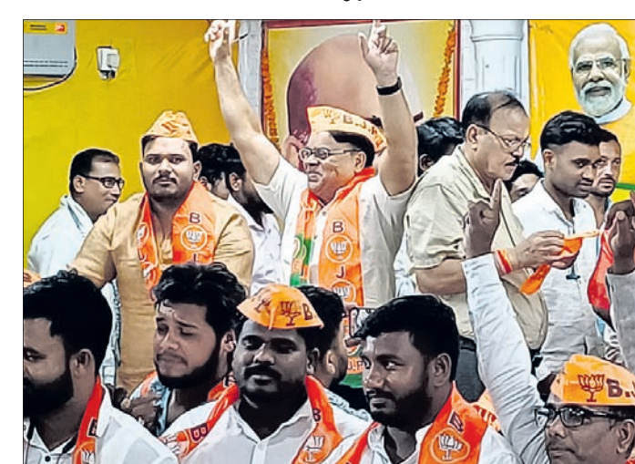
ଭାଜପାରେ ସାମିଲ ହୋଇଥିବା ବରିଷ୍ଠ ନେତୃବୃନ୍ଦ।

ନୂଆପଡ଼ା ନିର୍ବାଚନସଭାରେ ୩ ପ୍ରମୁଖ ଦଳରେ ପ୍ରାର୍ଥୀ ଘୋଷଣା ପରେ ଦଳ ଦଳ ମଧ୍ୟରେ ବିତ୍ରୋହ ହୋଇ ଦଳ ବଦଳ ପ୍ରକ୍ରିୟା ଚାଲିଛି।