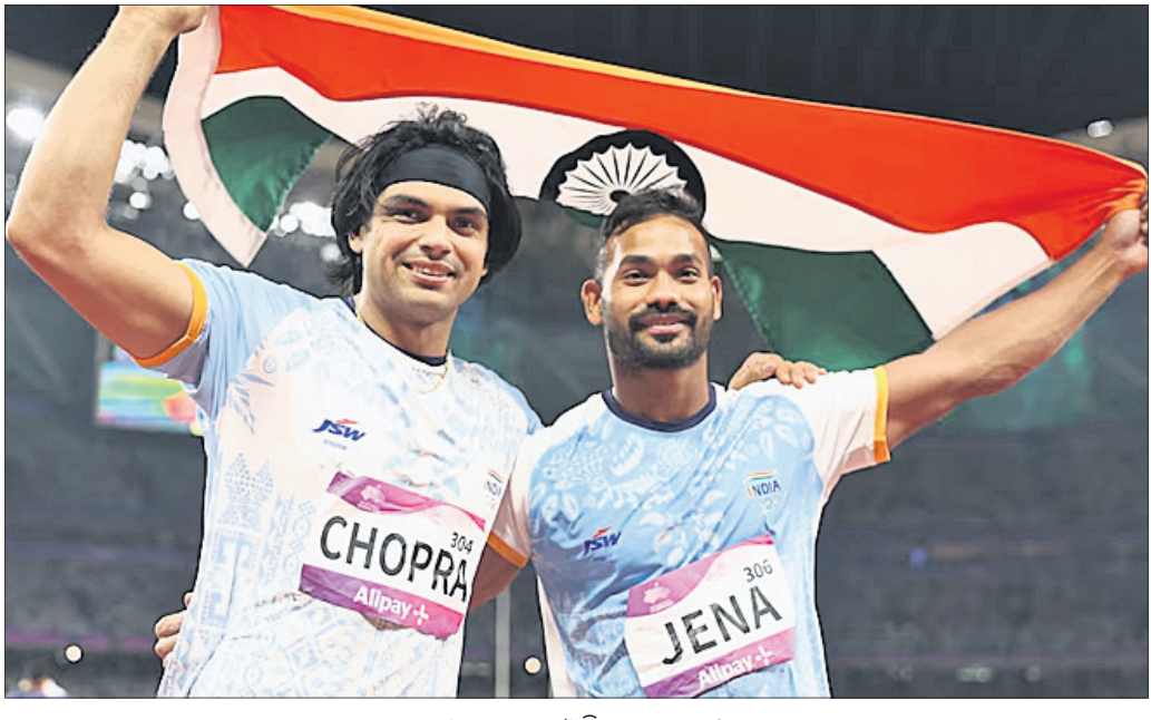
ନୀରଜ ଚୋପ୍ରା ଓ କିଶୋର ଜେନା।

ନୂଆଦିଲ୍ଲୀ, ୧୭/୪ ଗ୍ରୀଷ୍ମ ଏଥେଲେଟିକ୍ସ ମଇଲିରେ ଅଲିମ୍ପିକ୍ସ ମଣ୍ଡଳରେ ଅଗ୍ର ସଂଯୋଗ ହୋଇଛି। ଏଥିରେ ଚୋପ୍ରା ଅଲିମ୍ପିକ୍ସ ବିଜୁଳା ପ୍ୟାରିସ ଅଲିମ୍ପିକ୍ସର ୧୦୦ ଦିନ ଆକାଶ ତାହା ଆରମ୍ଭ ହୋଇଛି। ଗତ ଟୋକିଓ ଅଲିମ୍ପିକ୍ସରେ ଭାରତ ୧ ସ୍ୱର୍ଣ୍ଣ, ୨ ରୌପ୍ୟ ଓ ୪ ବ୍ରୋଞ୍ଜ ସହିତ ୭ଟି ପଦକ ହାସଲ କରି ରେକର୍ଡ କରିଥିଲା। ପ୍ୟାରିସରେ ଭାରତୀୟ ଦଳ ଏହି ରେକର୍ଡରେ ଉନ୍ନତି ଆଣିବା ଲକ୍ଷ୍ୟରେ ରହିଛି। ଟୋକିଓରେ ଭାରତ ଏହାର ଇତିହାସରେ ସବୁଠାରୁ ଅଧିକ ସଂଖ୍ୟକ ପ୍ରତିନିଧି ଦଳ ପଠାଇଥିଲା। ଏହା ମଧ୍ୟରେ ୧୨୪ ଆଥଲେଟ୍ ସାମିଲ ଥିଲେ। ପ୍ୟାରିସରେ ମଧ୍ୟ ତାହାର ପୁନରାବୃତ୍ତି ହେବା ଆଶା କରାଯାଉଛି।