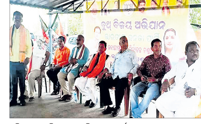
ମାଡିଙ୍ଗ ବଜାର ପଡିଆଠାରେ ଅନୁଷ୍ଠିତ ଭାଜପା କାର୍ଯ୍ୟକ୍ରମ।

ନରେନ୍ଦ୍ର ମୋଦିଙ୍କ ଲୋକାଭିମୁଖୀ ଅବଗତ କରାଇବା ପାଇଁ ପ୍ରବାସୀ ଯୋଜନାରେ ଜନସାଧାରଣ ଯେପରି ଦକ୍ଷ ଧର୍ମୀଙ୍କୁ ଆହ୍ୱାନ ଦେଇଥିଲେ।