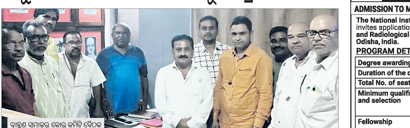
ଭବାନୀପାଟଣା, ୧୭୪୪(ଉତ୍ତମ କୁମାର ଦାଶ)

ବ୍ରାହ୍ମଣ ସମାଜ କଳାହାଣ୍ଡି ପକ୍ଷରୁ ଆସନ୍ତା ମେ ୧୦ ତାରିଖ ଅକ୍ଷୟ ତୃତୀୟାରେ ପଶ୍ଚିମ ଓଡ଼ିଶା ପାଇଁ ଅବସରରେ ନିଷ୍ପତ୍ତି ସାମୂହିକ ବ୍ରତୋପନୟନ ଆୟୋଜନ କରିବା ପାଇଁ କୋର୍ କମିଟି ବୈଠକରେ ସ୍ଥିର କରାଯାଇଛି।