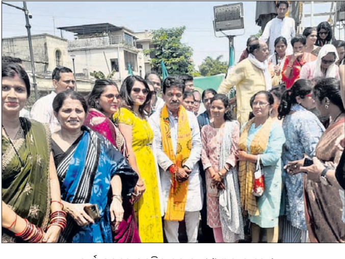
କାର୍ଯ୍ୟକ୍ରମରେ ଉପସ୍ଥିତ ଶ୍ରମ ମନ୍ତ୍ରୀ ଓ ଅନ୍ୟମାନେ ।

ଭୋଟ ପ୍ରଚାର କରିବା ସହିତ ଅଞ୍ଚଳର ଜନସାଧାରଣଙ୍କ ସହିତ ସାକ୍ଷାତ କରି ଭୋଟ ଭିକ୍ଷା କରୁଛନ୍ତି। ଏହି ଅବସରରେ ହେମବିର, କନିକା, ଗାଙ୍ଗରପାଲି, ଲେଫ୍ଟିପଡ଼ା ଆଦି ବ୍ଲକ୍ ବିଭିନ୍ନ ଅଞ୍ଚଳରେ ବୁଲି ମାଗାଥନ ପ୍ରଚାର ଆରମ୍ଭ କରିଛନ୍ତି। ତେବେ ନିର୍ବାଚନରେ ସୁଧାରାଣୀ ବିଜେଡି ଓ ଭାଜପାକୁ କଡ଼ା ଚଞ୍ଚର ଦେବ ବୋଲି ଅଞ୍ଚଳରେ ଚର୍ଚ୍ଚା ହେଉଛି ।