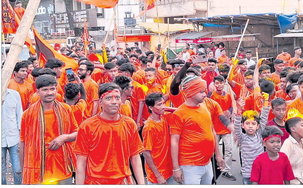
ରାମନବମୀ ଉପଲକ୍ଷେ ବାହାରିଥିବା ଶୋଭାଯାତ୍ରା ।