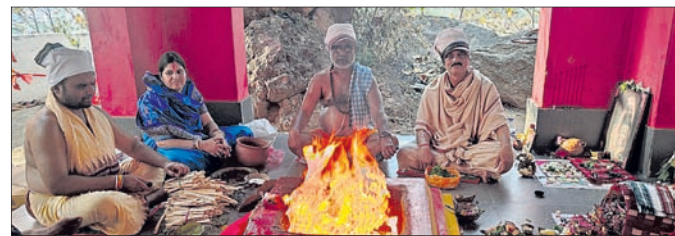
ତାରିଣୀ ପୀଠରେ ଅନୁଷ୍ଠିତ ଚଣ୍ଡୀଯଜ୍ଞ।

ଭବାନୀପାଟଣା ସହର ପୂର୍ବ ଉପକଣ୍ଠ ତାରିଣୀ ପୀଠରେ ଦେବୀଙ୍କ ଚୈତ୍ର ଯାତ୍ରା ଉପଲକ୍ଷେ ପବିତ୍ର ରାମ ନବମୀରେ ଏକଦିବସୀୟ ଚଣ୍ଡୀଯଜ୍ଞ ଅନୁଷ୍ଠିତ ହୋଇଛି।