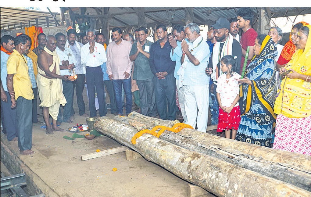
ଖପୁରିଆସ୍ଥିତ ସରକାରୀ ସ' ମିଲରେ ରଥକାଠ ତିରଟ ପାଇଁ ପୂଜାର୍ଚ୍ଚନା କରାଯାଇଛି।