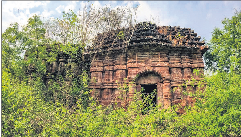
ଗଞ୍ଜାମ ମହୁରିଗଡ଼ରେ ଥିବା କରନାଥ ମନ୍ଦିର ଅବହେଳିତ ଅବସ୍ଥାରେ ପଡ଼ିଛି।

ଭୁବନେଶ୍ୱର, ୧୭୧୪ (ଶ୍ରୀମତୀ ପାଣିଗ୍ରାହୀ) ଓଡ଼ିଶା କଳା, ସଂସ୍କୃତି, ଐତିହ୍ୟରେ ସମୃଦ୍ଧ। ପ୍ରତି ଲିଙ୍ଗରେ ରହିଛି ଅନନ୍ୟ ଐତିହ୍ୟର ପରିଚୟ। ମାତ୍ର ଭୁବନେଶ୍ୱର, କୋଣାର୍କ, ପୁରୀ ଆଦି କେତେକ ସ୍ଥାନକୁ ବାଦଦେଇ ଅଧିକାଂଶ ଐତିହ୍ୟ ଅବହେଳିତ ଅବସ୍ଥାରେ ପଡ଼ି ରହିଛି। ମିହିରମାଲିନୀ ଭୁବନେଶ୍ୱର ସମେତ ରାଜ୍ୟର ବିଭିନ୍ନ ସ୍ଥାନରେ ଥିବା ପୁରାତନ ମନ୍ଦିରରେ ପାଠ ସୃଷ୍ଟି ହେବା, ଗଛ ଉପରୁ ଭଲ ଦୃଶ୍ୟ ସାମାନ୍ୟତା ଆସୁଛି। ସେହିପରି ଶିଳ୍ପପାତ୍ରକୁ ଭଲ ସମ୍ପୂର୍ଣ୍ଣ ଐତିହ୍ୟ ଆଜି ମାଟିରେ ମିଶିବାକୁ ଲାଗିଛି। ଐତିହ୍ୟ ସହ ପର୍ଯ୍ୟଟନ ଯୋଡ଼ି ହୋଇ ରହିଛି। ଫଳରେ ରାଜ୍ୟ ପର୍ଯ୍ୟଟନ କ୍ଷେତ୍ର ମଧ୍ୟ ପ୍ରଭାବିତ ହେଉଛି। ଯେତକି ବିକାଶ ହେବା କଥା ସେତକି ହେଉନାହିଁ। ଏପରି ସ୍ଥିତିରେ ଓଡ଼ିଶା ଗୁରୁବାର ବିଶ୍ୱ ଐତିହ୍ୟ ଦିବସ ପାଳନ କରିବାକୁ ଯାଉଛି। ଚଳିତବର୍ଷର ଥିମ୍ ରହିଛି 'ଆବିଷ୍କାର ଏବଂ ବିକାଶ' ଅନୁଭୂତି'। ଐତିହ୍ୟର ସୁରକ୍ଷା ସହ ଏହାର ସଂରକ୍ଷଣ ଏବଂ କୃତ୍ରିମ ଭାବରେ ଐତିହ୍ୟର ଆବିଷ୍କାର ହେବା ନିହାତି ଜରୁରୀ ବୋଲି ମତ ପ୍ରକାଶ ପାଇଛି। ୫-ଟି ଅଧ୍ୟାନରେ ବିଭିନ୍ନ ଲିଙ୍ଗରେ ଥିବା ପ୍ରମୁଖ ଐତିହ୍ୟସ୍ଥଳର ରୂପାନ୍ତରଣ ପାଇଁ ପ୍ରସ୍ତାବ ରାଜିଛି। ମାତ୍ର ଅବହେଳିତ, ଅସଂରକ୍ଷିତ ଐତିହ୍ୟକୁ ଉପଯୁକ୍ତ ପରିଚୟ ଦେବାରେ ଆବଶ୍ୟକ ପଦକ୍ଷେପ ନେବାକୁ ଐତିହ୍ୟ ଗବେଷକମାନେ ଗୁରୁତ୍ୱ ଦେଇଛନ୍ତି।