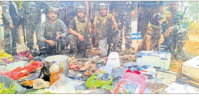
କ୍ୟାମ୍ପରୁ ଜବତ ହୋଇଥିବା ମାଓବାଦୀ ସାମଗ୍ରୀ।

ବଣାଲି, ୧୭୧୪ (ପ୍ରବାପ ଟ୍ରିପୁଠୀ) ଓଡ଼ିଶା-ଝାଡ଼ଖଣ୍ଡ ସୀମାନ୍ତ ତଥା ଓଡ଼ିଶା ସଂଲଗ୍ନ ଗୋଧୁଳିକେରା ଥାନା ତଳେ ଜଙ୍ଗଲରେ ଗୁମାସ୍ତା ଅପରେଶନ ବେଳେ ମାଓବାଦୀ କ୍ୟାମ୍ପ ଠାରୁ ହୋଇଛି ବିଶାଳ ବିଶାଳ ଲୋପ ଥିବା ୨୧ଟି ତାର, ଅବହେଳି କଲେ ଗନ୍ଧ ପାଉଁର, ପାଞ୍ଚ କିଲୋ ଓଜନର ଆନେନିଆ, ନାଇଟ୍ରେଟ୍ ପାଉଁର, ଗୋଟିଏ କିଲୋ ସଲ୍ଫିଡ୍ ପାଉଁରର ସହ ଅନେକ ମାଓବାଦୀ ସାମଗ୍ରୀ ଜବତ ହୋଇଛି। ହେଲେ ମାଓବାଦୀନେତାମାନେ ଛତ୍ରଭଙ୍ଗ ଦେଇଥିଲେ। ଆଗକୁ ସାଧାରଣ ନିର୍ବାଚନ ଥିବାକୁ ଏହି ସମୟରେ କିଛି ଅଘଟଣ ଘଟାଇପାରନ୍ତି ମାଓବାଦୀ। ଏହାକୁ ନଜରରେ ରଖି ସୀମାନ୍ତର ଅଞ୍ଚଳରେ ଉଚ୍ଚ ଖାତାରେ ଓଡ଼ିଶା ସୀମାନ୍ତର ବେଳେ ମାଓବାଦୀ କ୍ୟାମ୍ପ ଠାରୁ ହୋଇଛି ବିଶାଳ ବିଶାଳ ଲୋପ ଥିବା ୨୧ଟି ତାର, ଅବହେଳି କଲେ ଗନ୍ଧ ପାଉଁର, ପାଞ୍ଚ କିଲୋ ଓଜନର ଆନେନିଆ, ନାଇଟ୍ରେଟ୍ ପାଉଁର, ଗୋଟିଏ କିଲୋ ସଲ୍ଫିଡ୍ ପାଉଁରର ସହ ଅନେକ ମାଓବାଦୀ ସାମଗ୍ରୀ ଜବତ ହୋଇଛି। ହେଲେ ମାଓବାଦୀନେତାମାନେ ଛତ୍ରଭଙ୍ଗ ଦେଇଥିଲେ। ଆଗକୁ ସାଧାରଣ ନିର୍ବାଚନ