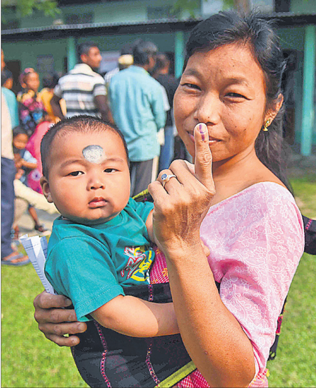
ଆସାମର ନଗାଓଁସ୍ଥିତ ଏକ ମତଦାନ କେନ୍ଦ୍ରରେ ଭୋଟ ଦେବା ପରେ ଜଣେ ମହିଳା ନିଜ ଅଲୁକିର ଅଲିଭା କାଳି ଦେଖାଉଛନ୍ତି।

୩୧ଜଣଙ୍କ ଜୀବନହାନି ଘଟିଥିଲା। ଜଳପଥରେ ଯିବା ଆସିବା କରୁଥିବା ଯାତ୍ରୀଙ୍କ ସୁରକ୍ଷାକୁ ଦେଖି ରାଜ୍ୟ ସରକାର ଓଡ଼ିଶା ନୌକା ନାଟି (ବୋର୍ ପଲିସି)- ୨୦୦୪ କାର୍ଯ୍ୟକାରୀ କରୁଛନ୍ତି। ଏହି ନାଟି କଡ଼ାକଡ଼ି ପାଳନ କରାଯିବାକୁ ନିର୍ଦ୍ଦେଶ ଦିଆଯାଇଥିବା ସତ୍ତ୍ୱେ ତଳା ପରିଚାଳନା କରିଥିବା ସଂସ୍ଥା କିମ୍ବା ବ୍ୟକ୍ତି ଏବଂ ଯାତ୍ରୀମାନେ ଲାଲପ୍ ଜାକେଟ୍ ପିନ୍ଧିବାକୁ ଅଣଦେଖା କରୁଛନ୍ତି। ପ୍ରଶାସନ ତରଫରୁ ମଧ୍ୟ ଏହାକୁ ଗୁରୁତ୍ୱ ଦିଆଯାଉନାହିଁ। ଫଳରେ ତଳାବୁଡ଼ିଲେ ଏହାର ସମସ୍ତ ଉଦ୍ଧାରଣ ହେଲା ଝାରସୁଗୁଡ଼ାରେ ଶୁକ୍ରବାର ହୋଇଥିବା ତଳାବୁଡ଼ି। ସେହିପରି କେତେକ ବଡ଼ ତଳାବୁଡ଼ି ଘଟଣା ମହାନଦୀ, ତିଳିକା, ହାରାକୂପ ଥାନା, କୋଲାବ ଜଳଭଣ୍ଡାର ଆଦିରେ ଘଟିଛି। ୨୦୧୪ ଫେବୃଆରୀ ୯ରେ ହାରାକୂପ ଜଳଭଣ୍ଡାରରେ ମୋଟରଚାଳିତ ତଳା ବୁଡ଼ିଯିବାରୁ