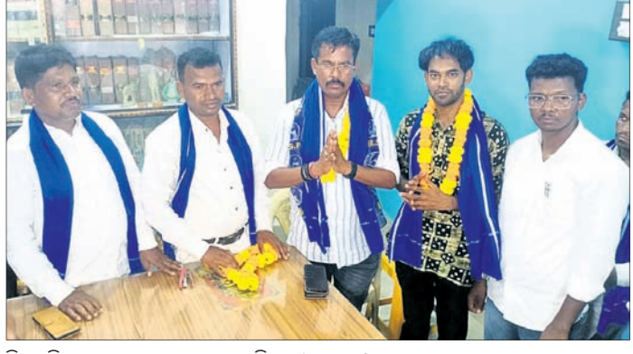
ବିଏସ୍‌ପିରେ ଯୋଗ ଦେଇଥିବା ୨ ଆଦିବାସୀ ନେତା।