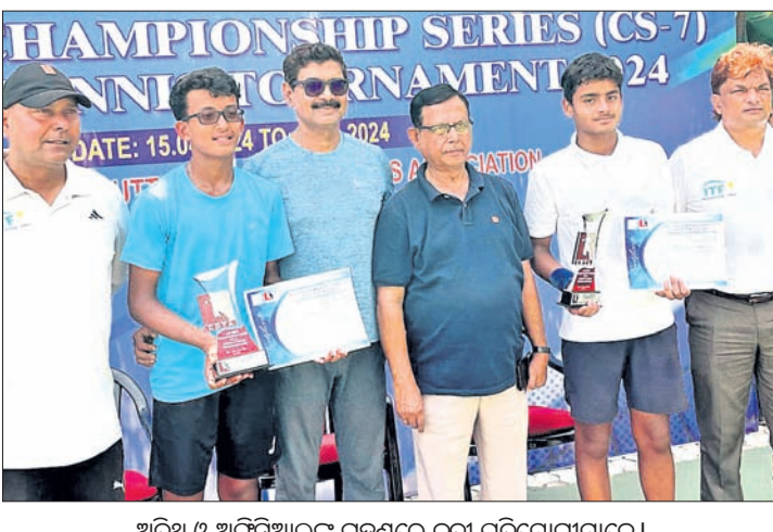
ଅତିଥି ଓ ଅତିଥିଆଳଙ୍କ ରହଣରେ କୁଟୀ ପ୍ରତିଯୋଗୀମାନେ।

ଭୁବନେଶ୍ୱର, ୧୯୪୪ (ତପନ ସାହୁ) କଟକ ଜିଲ୍ଲା ଚେନିସ ଆସୋସିଏସନ ଆନୁକୂଲ୍ୟରେ ବାରବାଟୀ ଷ୍ଟାଡ଼ିୟମ ଚେନିସ କମ୍ପ୍ଲେକ୍ସରେ ଏଆଇଟିଏ-ସିଟିଏ ଚେନିସ ଚାମ୍ପିୟନଶିପ୍ (ସିଏସ-୭) ଶୁକ୍ରବାର