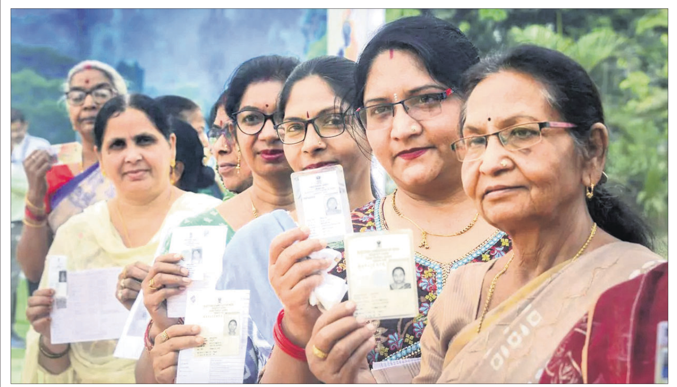
ମାଓବାଦୀପ୍ରବଣ ବସ୍ତର ଜିଲ୍ଲାର ଏକ ବ୍ଲକ୍‌ରେ ଭୋଟ ଦେବା ପାଇଁ ମହିଳାମାନେ ଧାଡ଼ିରେ ଛିଡ଼ା ହୋଇଛନ୍ତି।