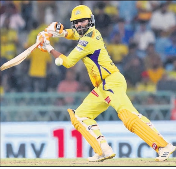
ଶର୍ ଖେଳିବା ଅବସରରେ ରବୀନ୍ଦ୍ର ଜାଡେଜା।