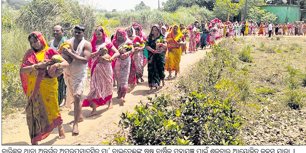
ଗରିଛକ ଥାନା ଅନ୍ତର୍ଗତ ଅମରପ୍ରସାଦସ୍ଥିତ ମା' ବାଇଦେଇଙ୍କ ଷଷ୍ଠ ବାର୍ଷିକ ମହାଯଜ୍ଞ ପାଇଁ ଶୁକ୍ରବାର ଆୟୋଜିତ କଳସ ଯାତ୍ରା ।

ଗରିଛକ, ୧୯୪୪ (ଶଶିବର ସ୍ୱାଇଁ): ଗରିଛକ ଥାନା ଅନ୍ତର୍ଗତ ଅମରପ୍ରସାଦସ୍ଥିତ ମା' ବାଇଦେଇଙ୍କ ଷଷ୍ଠ ବାର୍ଷିକ ମହାଯଜ୍ଞ ପାଇଁ ଶୁକ୍ରବାର କଳସ ଯାତ୍ରା ଅନୁଷ୍ଠିତ ହୋଇଯାଇଛି। ଏହି କଳସ ଯାତ୍ରା ପୂର୍ବରୁ ପ୍ରଥମେ ମା' ବାଇଦେଇ ଠାକୁରାଣୀଙ୍କୁ ସ୍ନାନ କରି କଳସ ପାଣି ଆଣିବା ପାଇଁ ଅମରପ୍ରସାଦ ନିକଟସ୍ଥ ପବିତ୍ର ଗୋଡାଠାକୁ ଯାଇଥିଲେ। ସେଠାରେ ନୀତି ନିୟମ ଅନୁଯାୟୀ ପୂଜା କରି କଳସ ଆଣିଥିଲେ। ଏହି କଳସ ଯାତ୍ରାରେ ଭାଗ ନେଇ କଳସ ଉଠାଇ କୁଞ୍ଜରେ ନିଷ୍ଠାପର ସହକାରେ ଘ୍ରାପନ କଲେ ମନସ୍କାମନା ପୂରଣ ହୋଇଥାଏ ବୋଲି ବିଶ୍ୱାସ ରହିଛି ବୋଲି କଳସ ଯାତ୍ରାରେ ଭାଗ ନେଇଥିବା ମାନସିକ ଧାରାମାନେ କହିଥିଲେ। ମା' ବାଇଦେଇଙ୍କ କଳସ ଯାତ୍ରାରେ ବିଭିନ୍ନ ଅଞ୍ଚଳରୁ ଶତାଧିକ ମହିଳା ପୁରୁଷ ଯୋଗଦେଇ କଳସ ଆଣି ଯଜ୍ଞ ମଣ୍ଡପରେ ଘ୍ରାପନ କରିଥିଲେ। ଏହି କଳସ ଯାତ୍ରାରେ ମା' ବାଇଦେଇ କମିଟିର ସଦସ୍ୟ, ସାଜବାସା ବ୍ରହ୍ମ ସହିତ ଆସିଥିବା ଶ୍ରଦ୍ଧାଳୁମାନେ ଯୋଗଦେଇ ସହଯୋଗ କରିଥିଲେ।