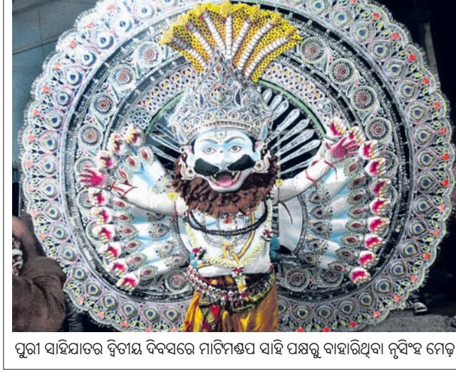
ପୁରୀ ସାହିଯାତର ବିଗ୍ରହ ବିକସରେ ମାଟିମଣ୍ଡପ ସାହି ପକ୍ଷରୁ ବାହାରିଥିବା ନୃସିଂହ ମେଡ଼ ।