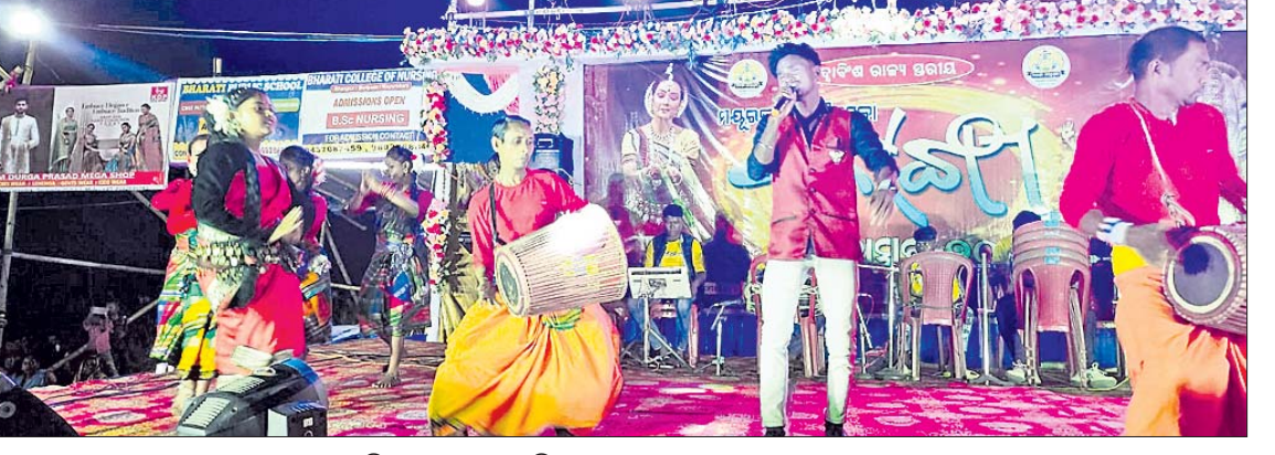
କଳାକାରଙ୍କ ଦ୍ୱାରା ମଞ୍ଚରେ ନୃତ୍ୟ ଓ ସଙ୍ଗୀତ ପରିବେଷଣ କରାଯାଇଛି।