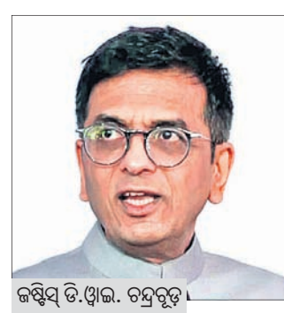
କଷ୍ଟିସ୍ ଡି.ୟୁ.ଏ. ଚନ୍ଦ୍ରଚୂଡ଼

କେନ୍ଦ୍ର ସରକାର କାର୍ଯ୍ୟକାରୀ କରିଥିବା ନୂଆ ଆପରାଧିକ ଆଇନକୁ ଭାରତର ପ୍ରଧାନ ବିଚାରପତି (ସିଜେଆଇ) ଡି.ୟୁ.ଏ. ଚନ୍ଦ୍ରଚୂଡ଼ ପ୍ରଶଂସା କରିଛନ୍ତି। ଏହା ଆପରାଧିକ ନ୍ୟାୟ ଉପରେ ଭାରତର ନ୍ୟାୟିକ ତାହାକୁ ନୂତନ ମୂଳ ଅନୁଯାୟୀ ବଦଳାଇଦେଇଥିବା ଜଷ୍ଟିସ୍ ଚନ୍ଦ୍ରଚୂଡ଼ କହିଛନ୍ତି। 'ଭାରତର ଆପରାଧିକ ନ୍ୟାୟ ବ୍ୟବସ୍ଥା ଉପରେ ଆଇନ ଓ ନ୍ୟାୟ ମନ୍ତ୍ରଣାଳୟ ଦ୍ୱାରା ଆୟୋଜିତ ସମ୍ମିଳନୀରେ ଉଦ୍‌ବୋଧନ ଦେଇ ସିଜେଆଇ କହିଥିଲେ, ପାଠିତକ ସ୍ୱାର୍ଥର ସୁରକ୍ଷା ପାଇଁ ଏଥିରେ ଗୁରୁତ୍ୱ ଦିଆଯିବ। ସହ ତଦନ୍ତ ଏବଂ ବିଚାର ପ୍ରକ୍ରିୟାକୁ ଅଧିକ ପ୍ରଭାବୀ କରାଯାଇଛି। ୩ ନୂଆ ଆଇନ ଭାରତୀୟ ନ୍ୟାୟ ସଂସ୍କୃତି, ଭାରତୀୟ ନାଗରିକ ସୁରକ୍ଷା