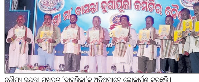
ରୌପ୍ୟ ଜୟନ୍ତୀ ମୁଖପତ୍ର 'ବାସନ୍ତୀ'କୁ ଅତିଥିମାନେ ଲୋକାର୍ପଣ କରୁଛନ୍ତି।