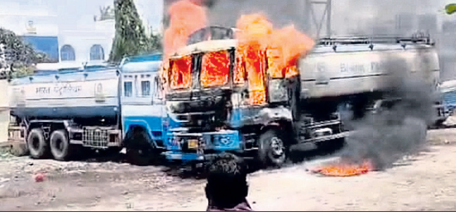
ନିଆଁ ଲାଗି ଜଳିଯାଇଥିବା ଟ୍ୟାଙ୍କର ।

ପାରାଦୀପର ବାଉଁଶିଆପାଳଘାଟଠାରେ ଥିବା ବିପିସିଏଲ(ଭାରତ ପେଟ୍ରୋଲିୟମ କର୍ପୋରେସନ ଲିମିଟେଡ୍) ଚର୍ମିନାଲ ସମ୍ମୁଖରେ ଶନିବାର ଖରାବେଳେ ଆଗ୍ନିକ ଦୁର୍ଘଟଣା ଘଟିଛି । ତେଲ ବୋହେଇ ପାଇଁ ଆସିଥିବା ୩ଟି ଟ୍ୟାଙ୍କର ଗାଡ଼ିରେ ନିଆଁ ଲାଗି ପେଡ଼ିଯାଇଛି । ଚର୍ମିନାଲ ଅଗ୍ନିଶମ ଗାଡ଼ି ଏବଂ ପାରାଦୀପ ବନ୍ଦର, କୁଳଜ ଅଗ୍ନିଶମ ଗାଡ଼ିକୁଡ଼ିକ ପହଞ୍ଚିନିଆଁକୁ ଆୟତ୍ତ କରିଥିଲେ । ଏହାଦ୍ୱାରା ଏକ ବଡ଼ ବିପଦରୁ ସେଠାରେ ଥିବା ୩ଟି ଚର୍ମିନାଲ ଓ ପାରାଦୀପ ଶିଳ୍ପ ସହର ବର୍ତ୍ତିଯାଇଛି । ଅଗ୍ନିଶମ କାରଣ ଅସ୍ପଷ୍ଟ ରହିଛି । ପ୍ରାଥମିକତାରେ ଅତ୍ୟଧିକ ଗରମ ଯୋଗୁ ଗାଡ଼ିର ବ୍ୟାଚେରିରେ ଶର୍ତ୍ତସଂକଟ ହୋଇ ନିଆଁ ଲାଗିଥିବା ଜୁହାଯାଇଛି । କୁଳଜ ଅଞ୍ଚଳରେ ଥିବା ଏକ ପେଟ୍ରୋଲ