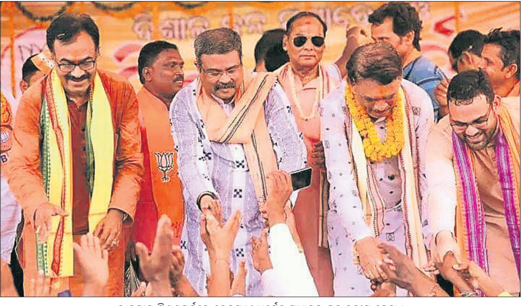
ଭାଜପାର ମିଶ୍ରପର୍ବରେ କେନ୍ଦ୍ରମନ୍ତ୍ରୀ ଧର୍ମେନ୍ଦ୍ର ପ୍ରଧାନଙ୍କ ସହ ଦଳୀୟ ନେତା ।