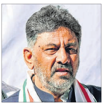
ହୋଇଥିବା ଶିବକୁମାରଙ୍କ ଭାଇ ଡି.କେ. ସୁରେଶଙ୍କ ପାଇଁ ପ୍ରଚାର କଲାବେଳେ ଶିବକୁମାର ଏମ୍.ସି.ସି.ର ଉଲ୍ଲଂଘନ କରିଥିବା ଅଭିଯୋଗରେ ପରେ ଇସି ନୋଟିସ ପଠାଇଛନ୍ତି। ବେଙ୍ଗାଳୁରୁ ରୁରାଲ ଆସନରେ ପ୍ରାର୍ଥୀ

ଆଦର୍ଶ ଆଚରଣ ବିଧି (ଏମ୍.ସି.ସି.)ର ଉଲ୍ଲଂଘନ କରିଥିବା କର୍ମଚର ଉପମୁଖ୍ୟମନ୍ତ୍ରୀ ଡି.କେ. ଶିବକୁମାରଙ୍କ ବିରୋଧରେ ନିର୍ବାଚନ କମିଶନ (ଇସି) ଶନିବାର କାର୍ଯ୍ୟାନୁଷ୍ଠାନ ଗ୍ରହଣ କରିଛନ୍ତି। କାବେରୀ ଜଳ ଗଠିଥିଲେ କଂଗ୍ରେସକୁ ଭୋଟ ଦେବାକୁ ଶିବକୁମାର ଭୋଟରମାନଙ୍କୁ ଧମକ ଦେଇଥିବା ଗଣମାଧ୍ୟମରେ ରିପୋର୍ଟ ପ୍ରକାଶ ପାଇଥିଲା। ସେ ଏମ୍.ସି.ସି.ର ଉଲ୍ଲଂଘନ କରିଥିବା ନେଇ ଭାଜପା ଅଭିଯୋଗ କରିବାର ଦିନକ ପରେ ଇସି ନୋଟିସ ପଠାଇଛନ୍ତି। ବେଙ୍ଗାଳୁରୁ ରୁରାଲ ଆସନରେ ପ୍ରାର୍ଥୀ