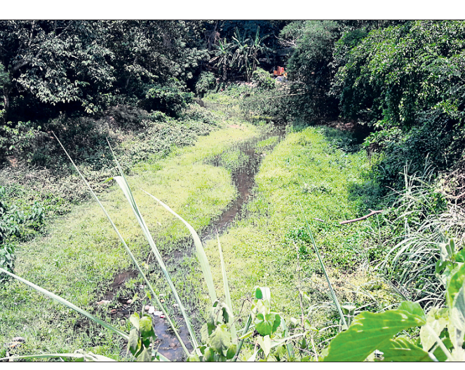
ଘାସ, ବନରେ ଭରି ହୋଇଛି କୁଣ୍ଡିନଈ।

ଦିନ ଥିଲା କୁଣ୍ଡିନଈ ପାଇଁ ୯ ପଞ୍ଚାୟତ ଶତାଧିକାରୀଙ୍କୁ ହେଉଥିଲା। ପାର୍ଶ୍ୱବର୍ତ୍ତୀ ଗାଁର ଲୋକଙ୍କ ଜୀବନ ଜୀବିକା ସହ ଯୋଡ଼ି ହୋଇଥିଲା ଏହି ନଦୀ। ଏହା ଯୋଗୁ ଲୋକେ ନିଜର ଗୁରୁତ୍ୱା ଶେଷକରାଣୁ ସମ୍ପଦ ହେଉଥିଲେ। ହେଲେ ସମୟ ବଦଳିବା ସାଙ୍ଗକୁ ନଈର ନଦୀ ବଦଳି ଯାଇଛି। ତିହିଡ଼ି କୁଳର ୫ ପଞ୍ଚାୟତ ବେଳ ଯାଇଥିବା ଏହି ନଦୀ ଏବେ ବିଭିନ୍ନ ଗ୍ରାମରେ ପୋତି ହୋଇପଡ଼ିଥିବା ବେଳେ ଦଳ ଓ ଘାସରେ ପରିପୂର୍ଣ୍ଣ। ପୁନରୁଦ୍ଧାର ଦିଗରେ କୌଣସି ସହଯୋଗ ନିଆଯାଇ ଅଧିକାରୀଙ୍କୁ ପ୍ରକାଶ ପାଇଛି। କୁଣ୍ଡି ନଈ ଭଦ୍ରକ ବେଞ୍ଚାଳ ଠାରେ ସାକନ୍ଦା ନଦୀକୁ ବାହାରି ତିହିଡ଼ି କୁଳର କାହାଳୁଳାଠାରେ ମଡେଇ ନଦୀରେ ମିଶିଛି। ଭଦ୍ରକ କୁଳର କେଦାରପୁର, ବରହମପୁର, ତିହିଡ଼ି କୁଳର ବୋଲସାହି, ନୂଆନନ୍ଦ, ପାଳିଆଦିଆ, ଅବକ,