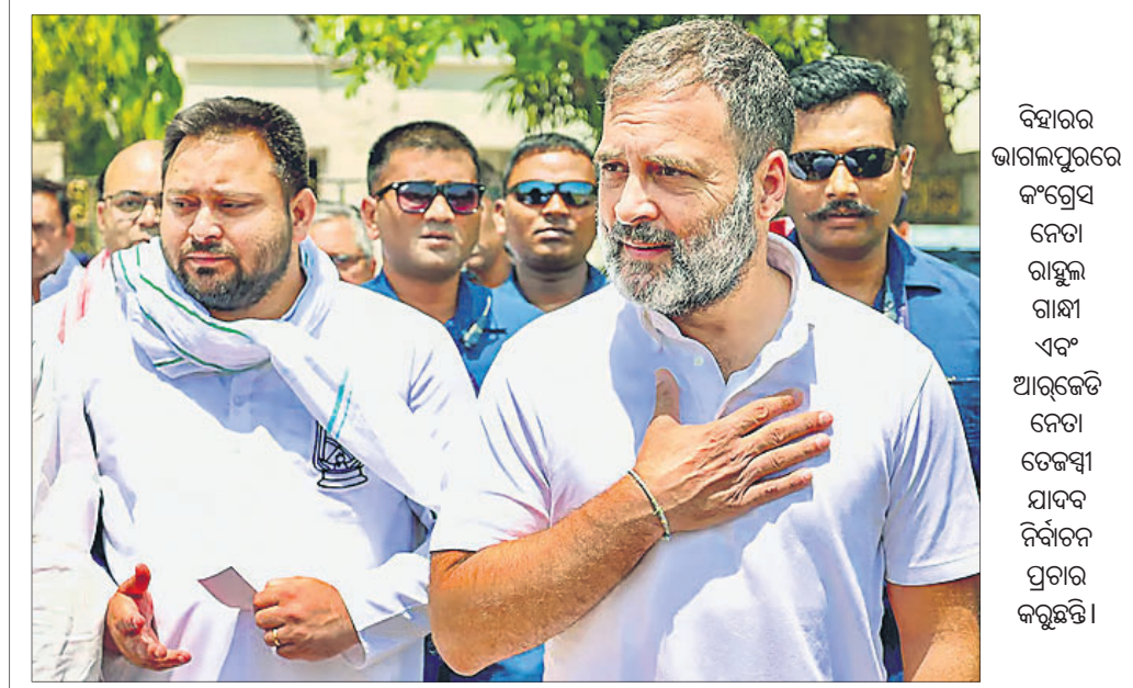
ସିଦ୍ଧାର ଭାରତପୁରରେ କଂଗ୍ରେସ ନେତା ରାହୁଲ ଗାନ୍ଧୀ ଏବଂ ଆରଜେଡି ନେତା ତେଜସ୍ୱୀ ଯାଦବ ନିର୍ବାଚନ ପ୍ରଚାର କରୁଛନ୍ତି।

ଗାନ୍ଧୀନଗର, ୨୦୧୪: ରୁଜ୍ଜରାଟର ଗାନ୍ଧୀନଗର ଲୋକ ସଭା ଆସନରୁ ସ୍ୱରାଷ୍ଟ୍ର ମନ୍ତ୍ରୀ ଅମିତ ଶାହା ଶୁକ୍ରବାର ନାମାଙ୍କନ ପତ୍ର ଦାଖଲ କରିଛନ୍ତି। ଶାହା ଦାଖଲ କରିଥିବା ସମ୍ପତ୍ତିପତ୍ର ଅନୁଯାୟୀ ତାଙ୍କର ସମ୍ପତ୍ତି ୩୬ କୋଟି ଟଙ୍କାର ସମ୍ପତ୍ତି ରହିଛି। ଶାହାଙ୍କର ୨୦ କୋଟି ଟଙ୍କାର ଅସ୍ତ୍ରାବର ସମ୍ପତ୍ତି ରହିଥିବାବେଳେ ୧୬ କୋଟି ଟଙ୍କାର ସ୍ତ୍ରାବର ସମ୍ପତ୍ତି ରହିଛି। ସେହିପରି ତାଙ୍କ ପାଖରେ ନଗଦ ୨୪ ହଜାର ୧୧୪ ଟଙ୍କା ଓ ୭୨ ଲକ୍ଷ ଟଙ୍କାର ଅଳଙ୍କାର ରହିଛି। ସେହିପରି ୨୦୨୨-୨୩ ଆର୍ଥିକ ବର୍ଷରେ ଶାହାଙ୍କ ବାର୍ଷିକ ଆୟ ୭୫.୦୯ ଲକ୍ଷ ଟଙ୍କା ରହିଥିଲା। ଏମ୍.ପି ଭାବେ ପାଠଥିବା ଦରମା, ଘର ଓ ଜମି ଭତ୍ତା ଏବଂ ଚାଷ କାର୍ଯ୍ୟ ଆଦି ତାଙ୍କ ଆୟର ଉତ୍ସ ହୋଇଥିବା ଶାହା ନିଜ ସମ୍ପତ୍ତିପତ୍ରରେ ଦର୍ଶାଇଛନ୍ତି। ତେବେ ତାଙ୍କର କୌଣସି କାର୍ଯ୍ୟ ନାହିଁ ବୋଲି ଏହି ସମ୍ପତ୍ତିପତ୍ରରେ ଶାହା ଦର୍ଶାଇଛନ୍ତି।