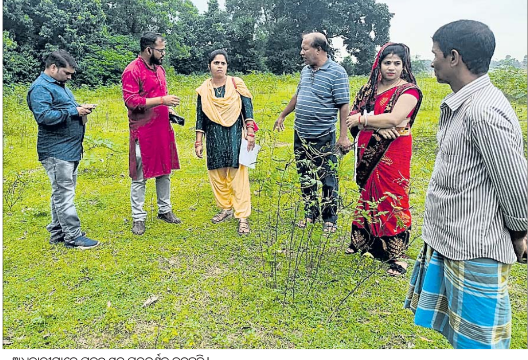
ଅଧିକାରୀମାନେ ପ୍ରକଳ୍ପ ସ୍ଥଳ ପରିଦର୍ଶନ କରୁଛନ୍ତି।

ରଘୁକପୁର ବ୍ଲକର ରାଜତରାପୁର ପଞ୍ଚାୟତ ବ୍ରାହ୍ମଣୀ ନଦୀର ତୀରାଞ୍ଚଳରେ ଅବସ୍ଥିତ ନଦୀକୂଳରେ ପଞ୍ଚାୟତର ଅଧିକାରୀଙ୍କ ସହ ଯୋଜନା କରାଯାଇଛି। ଯେଉଁଠି ନଦୀକୂଳରେ ଥିବା ଜମିକୁ ସୁରକ୍ଷା ଦେବା ପାଇଁ ଯେରିବନ୍ଧ ନିର୍ମାଣ କରିବାକୁ ନିର୍ଦ୍ଦେଶ ଦିଆଯାଇଛି। ଉକ୍ତ ପ୍ରକଳ୍ପକୁ ମଞ୍ଜୁରୀ ମିଳିଥିବାରୁ ରାଜତରାପୁର ପଞ୍ଚାୟତରାସୀ ୫-ଟି ଅଧକ୍ଷ କାର୍ଯ୍ୟ ପାଇଁ ଆନନ୍ଦରେ ପୂର୍ଣ୍ଣ ହୋଇଛନ୍ତି। ଯେରିବନ୍ଧ ନିର୍ମାଣ ହେଲେ ପଞ୍ଚାୟତର ଜନସାଧାରଣଙ୍କ ହିତକାରୀ ପ୍ରକଳ୍ପ ନିର୍ମାଣ ଓ ଗଠନପ୍ରକଳ୍ପ ପ୍ରଦାନରେ ସହାୟକ ହେବ ବୋଲି ମନେ କରି ପଞ୍ଚାୟତ ପକ୍ଷରୁ ସରପଞ୍ଚ ସ୍ୱୀକୃତି ପାଇଁ ଯତ୍ନ ଗୁଠାଇଲେ।