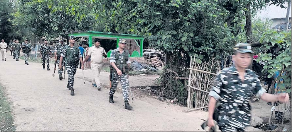
ପାଣିକୋଇଲି ପୋଲିସ ପକ୍ଷରୁ ଶନିବାର ଫ୍ଲାଗ ମାର୍ଚ୍ଚ କରାଯାଇଛି।

ବଢ଼ାଇପାରେ ବୋଲି କୁହାଯାଇଛି। ଏହି ନିର୍ବାଚନମଣ୍ଡଳର ଧୂଳିଗଡ଼, ମଙ୍ଗଳପୁର, କଞ୍ଚୁପୁରା, କିଛିରିଗଡ଼ିଆ, ଖୁମୁଡ଼ିଆ, ରାଜପୁର ଆଦି ପଞ୍ଚାୟତର ୩୦ରୁ ଉର୍ଦ୍ଧ୍ୱ ନେତା ଓ କର୍ମୀ ଭାଜପାର ବୁକ୍ସ୍ୱାରା ଟେକ୍ସଟରେ ଉପସ୍ଥିତ ଥିଲେ। ତେବେ ନିଲୟିତ ହୋଇଥିବା ବିଜେଡି ନେତା ଭାଜପା ସହ କେତେଜଣ କର୍ମୀଙ୍କ ପାଇଁ କାମ କରିଥିଲେ। କଳିଙ୍ଗନଗର ପ୍ରାଥମିକ ଶିକ୍ଷା କେନ୍ଦ୍ରର ଚିତ୍ରା ବିଜାୟାଲେ ବିଜେଡି ନେତା ଭାଜପା ସହ କେତେଜଣ କର୍ମୀଙ୍କ ପାଇଁ କାମ କରିଥିଲେ। କଳିଙ୍ଗନଗର ପ୍ରାଥମିକ ଶିକ୍ଷା କେନ୍ଦ୍ରର ଚିତ୍ରା ବିଜାୟାଲେ ବିଜେଡି ନେତା ଭାଜପା ସହ କେତେଜଣ କର୍ମୀଙ୍କ ପାଇଁ କାମ କରିଥିଲେ।