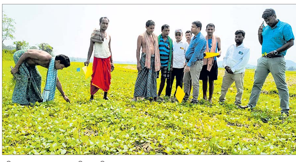
କୃଷି ଅଧିକାରୀମାନେ ମୃଗ କ୍ଷେତ ବୁଲି ଦେଖୁଛନ୍ତି।