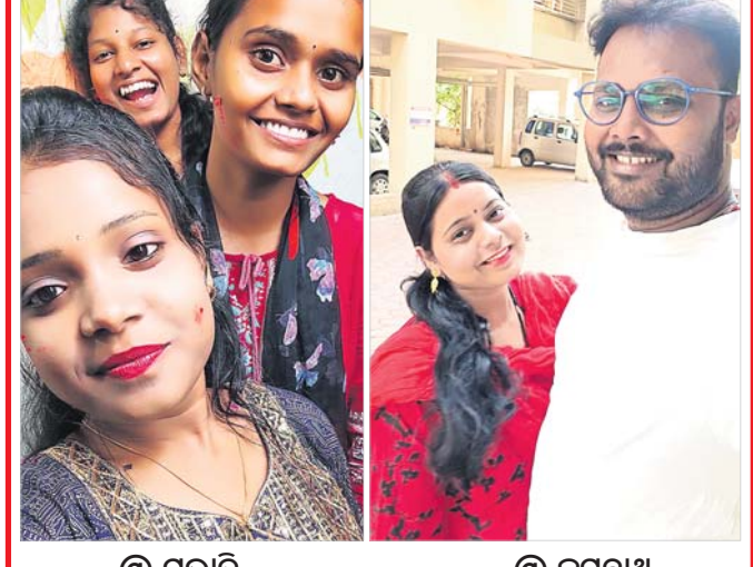
@ ପ୍ରଭାତି @ ଜଗନ୍ନାଥ