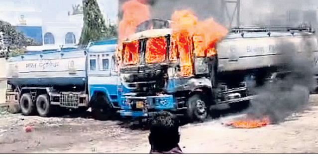
ନିଆଁ ଲାଗି ଜଳିଯାଇଥିବା ଟ୍ୟାଙ୍କର ।

ପାରାଦୀପର ବାଉଁଶିଆପାକନ୍ଦାଠାରେ ଥିବା ବିପିସିଏଲ୍ (ଭାରତ ପେଟ୍ରୋଲିୟମ କର୍ପୋରେସନ ଲିମିଟେଡ୍) ଚର୍ମିନାଲ ସମ୍ମୁଖରେ ଶନିବାର ଖରାବେଳେ ଆଗ୍ନିକ ଦୁର୍ଘଟଣା ଘଟିଛି । ତେଲ ବୋହେଇ ପାଇଁ ଆସିଥିବା ୩ଟି ଟ୍ୟାଙ୍କର ଗାଡ଼ିରେ ନିଆଁ ଲାଗି ପେଡ଼ିଯାଇଛି । ଚର୍ମିନାଲ ଅଗ୍ନିଶମ ଗାଡ଼ି ଏବଂ ପାରାଦୀପ ବନ୍ଦର, କୁଳଜ ଅଗ୍ନିଶମ ଗାଡ଼ିକୁଡ଼ିକ ପହଞ୍ଚି ନିଆଁକୁ ଆୟତ୍ତ କରିଥିଲେ । ଏହାଦ୍ୱାରା ଏକ ବଡ଼ ବିପଦରୁ ସେଠାରେ ଥିବା ୩ଟି ଚର୍ମିନାଲ ଓ ପାରାଦୀପ ଶିଳ୍ପ ସହର ବର୍ଚ୍ଛିତ ହୋଇଛି । ଅଗ୍ନିଶମ କାରଣ ଅସ୍ପଷ୍ଟ ରହିଛି । ପ୍ରାଥମିକତାରେ ଅତ୍ୟଧିକ ଗରମ ଯୋଗୁ ଗାଡ଼ିର ବ୍ୟାଚେରିରେ ଶର୍ତ୍ତସଂକଟ ହୋଇ ନିଆଁ ଲାଗିଥିବା ଜୁହାଯାଇଛି । କୁଳଜ ଅଞ୍ଚଳରେ ଥିବା ଏକ ପେଟ୍ରୋଲ