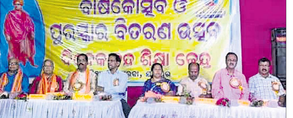
ବିବେକାନନ୍ଦ ଶିକ୍ଷାକେନ୍ଦ୍ର ବାର୍ଷିକ ଉତ୍ସବରେ ମହାସାଧନ ଅତିଥି।