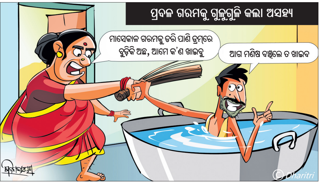
ପ୍ରବଳ ଗରମକୁ ଗୁଲୁଗୁଲି କଲା ଅସହ୍ୟ ମାସେକାଳ ଗରମକୁ ଭରି ପାଣି ଭ୍ରମରେ ବୁଡ଼ିକି ଅଛ, ଆମେ କ'ଣ ଖାଇବୁ ଆମ ମଣିଷ ବଞ୍ଚିଲେ ତ ଖାଇବ