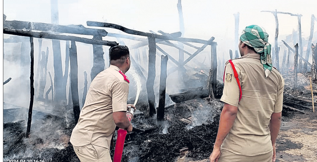
ଅଗ୍ନିଶମକାରୀ ନିଆଁ ଲିଭାଇବାକୁ ଚେଷ୍ଟା କରୁଛି ।