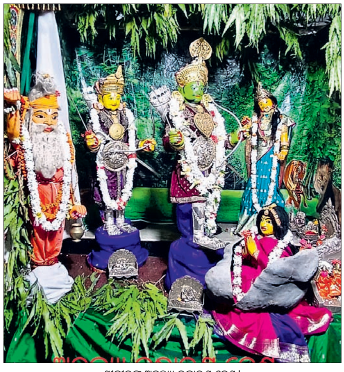
ଶ୍ରୀରାମ ଅହଲ୍ୟା ଭଞ୍ଜାରଣ ବେଶ ।

ଆଶ୍ୱାସନା ଦେଇଥିଲେ । ତ୍ରେତୟା ଯୁଗରେ ପୁନିରାଧିକ ଯଜ୍ଞରକ୍ଷା ଲାଗି ବିଶ୍ୱାମିତ୍ରଙ୍କ ସହ ଆଦି ରାମ ଲକ୍ଷ୍ମଣ ଚାଟକାକୁ ବଧ କରି ମିଥୁନା ରାଜ୍ୟକୁ ଯାଉଥିଲେ । ବିଶ୍ୱାମିତ୍ରଙ୍କ ଲଜିତରେ ରାମନାଥ ସ୍ନିହସଦି ରାସ୍ତା ପାର୍ଶ୍ୱରେ ପଡିଥିବା ଏକ ପରିତ୍ୟକ୍ତ ପଥର ଉପରେ ପାଦ ଥାପି ଥିଲେ । ପଦସ୍ପର୍ଶ ସହ ଆଦି ରାମ ଲକ୍ଷ୍ମଣ ଚାଟକାକୁ ବଧ କରି ମିଥୁନା ରାଜ୍ୟକୁ ଯାଉଥିଲେ । ରବିବାର ଶ୍ରୀରାମ ଗଙ୍ଗା ବିଶ୍ୱାମିତ୍ରଙ୍କ ଲଜିତରେ ରାମନାଥ ସ୍ନିହସଦି