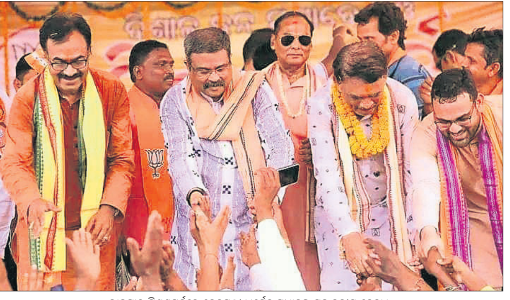
ଭାଜପାର ମିଶ୍ରପର୍ବରେ କେନ୍ଦ୍ରମନ୍ତ୍ରୀ ଧର୍ମେନ୍ଦ୍ର ପ୍ରଧାନଙ୍କ ସହ ଦଳୀୟ ନେତା ।