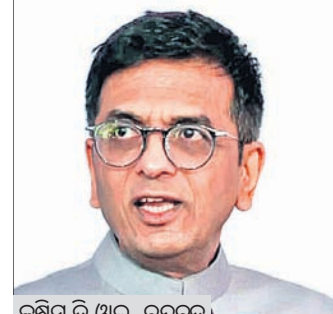
କର୍ମସ୍ୱି ଡି.ୟୁ.ଏ. ଚନ୍ଦ୍ରଚୂଡ଼

କେନ୍ଦ୍ର ସରକାର କାର୍ଯ୍ୟକାରୀ କରିଥିବା ନୂଆ ଆପରାଧିକ ଆଇନକୁ ଭାରତର ପ୍ରଧାନ ବିଚାରପତି (ସିଜେଆଇ) ଡି.ୟୁ.ଏ. ଚନ୍ଦ୍ରଚୂଡ଼ ପ୍ରଶଂସା କରିଛନ୍ତି। ଏହା ଆପରାଧିକ ନ୍ୟାୟ ଉପରେ ଭାରତର ନ୍ୟାୟିକ ତାହାକୁ ନୂତନ ଅନୁଯାୟୀ ବଦଳାଇଦେଇଥିବା ଜଣ୍ଟିସ୍ ଚନ୍ଦ୍ରଚୂଡ଼ କହିଛନ୍ତି। 'ଭାରତର ଆପରାଧିକ ନ୍ୟାୟ ବ୍ୟବସ୍ଥା ଉପରେ ଆଇନ ଓ ନ୍ୟାୟ ମନ୍ତ୍ରାଳୟ ଦ୍ୱାରା ଆୟୋଜିତ ସମ୍ମିଳନୀରେ ଉଦ୍‌ବୋଧନ ଦେଇ ସିଜେଆଇ କହିଥିଲେ, ପାଠିତକ୍ଷ୍ମ ସ୍ୱର୍ଣ୍ଣର ପୁରସ୍କା ପାଇଁ ଏଥିରେ ଗୁରୁତ୍ୱ ଦିଆଯିବ। ସହ ତଦନ୍ତ ଏବଂ ବିଚାର ପ୍ରକ୍ରିୟାକୁ ଅଧିକ ପ୍ରଭାବୀ କରାଯାଇଛି। ୩ ନୂଆ ଆଇନ ଭାରତୀୟ ନ୍ୟାୟ ସଂସ୍କୃତି, ଭାରତୀୟ ନାଗରିକ ସୁରକ୍ଷା