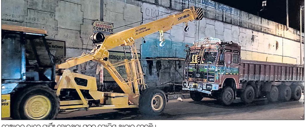
ବେଆଇନ ଭାବେ ପାର୍କିଂ ହୋଇଥିବା ଟ୍ରକ୍ସକୁ ପୋଲିସ ଥାନାକୁ ନେଇଛି।