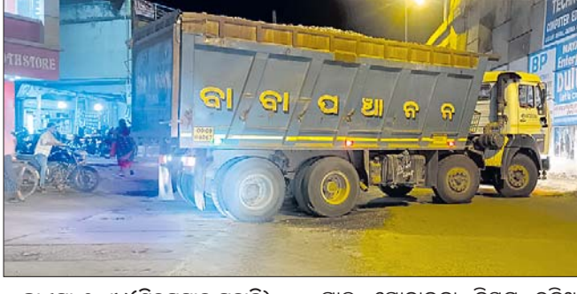
କାଏମା, ୨୦୧୪(ଶିବପ୍ରସାଦ ମହାନ୍ତି):

ଧର୍ମଶାଳା ଥାନା ଅନ୍ତର୍ଗତ କାରକା ଓଡ଼ିଶା ଗୋଲ୍ଡି ପାଖ ସର୍ଭିସ ରୋଡ୍ ଦେଇ ବହୁ ସଂଖ୍ୟକ ଟିକ୍ସ ଓ ପଥର ବୋର୍ଡେଇ ଧର୍ମଶାଳା ମହାବିଦ୍ୟାଳୟକୁ ଯିବା ପାଇଁ ରାସ୍ତା ବୁଦ୍ଧିହୀନ ଚଳଚଳା କରିବା ଯୋଗୁଁ ରାସ୍ତା ଜାମ୍ ହେଉଛି। ଫଳରେ ଯାତ୍ରୀ ଓ ଅଞ୍ଚଳବାସୀଙ୍କ ଚିନ୍ତା ବଢ଼ିଯାଇଛି। ଦିନତମାମ ହାଉଜା ଓ ଡମ୍ପର ସ୍ଥାନୀୟ କ୍ରମରୁ ଓଡ଼ିଶା ଗୋଲ୍ଡି ସାମଗ୍ରୀ ନେଇ ଏହି ରାସ୍ତାଦେଇ ବିଭିନ୍ନ ଅଞ୍ଚଳକୁ ଯାତ୍ରା କରୁଥିବା ଦେଖିବାକୁ ମିଳୁଛି। ସାମଗ୍ରୀ ପରିବହନ ସମୟରେ ପାଇ ଘୋଡ଼ାଇବା ନିୟମ ରହିଥିଲେ ବି କେତେଜଣ ଡ୍ରାଇଭର ଏହାକୁ ମାନ୍ୟନାହାନ୍ତି। କାରକା ବସ୍ ଷ୍ଟାଣ୍ଡଠାରୁ ଧର୍ମଶାଳା ମହାବିଦ୍ୟାଳୟକୁ ଯିବା ପାଇଁ ରାସ୍ତା ବୁଦ୍ଧିହୀନ ଚଳଚଳା କରିବା ଯୋଗୁଁ ରାସ୍ତା ଜାମ୍ ହେଉଛି। ଫଳରେ ଯାତ୍ରୀ ଓ ଅଞ୍ଚଳବାସୀଙ୍କ ଚିନ୍ତା ବଢ଼ିଯାଇଛି। ଦିନତମାମ ହାଉଜା ଓ ଡମ୍ପର ସ୍ଥାନୀୟ କ୍ରମରୁ ଓଡ଼ିଶା ଗୋଲ୍ଡି ସାମଗ୍ରୀ ନେଇ ଏହି ରାସ୍ତାଦେଇ ବିଭିନ୍ନ ଅଞ୍ଚଳକୁ ଯାତ୍ରା କରୁଥିବା ଦେଖିବାକୁ ମିଳୁଛି। ସାମଗ୍ରୀ ପରିବହନ ସମୟରେ ପାଇ ଘୋଡ଼ାଇବା ନିୟମ ରହିଥିଲେ ବି କେତେଜଣ ଡ୍ରାଇଭର ଏହାକୁ ମାନ୍ୟନାହାନ୍ତି। କାରକା ବସ୍ ଷ୍ଟାଣ୍ଡଠାରୁ ଧର୍ମଶାଳା ମହାବିଦ୍ୟାଳୟକୁ ଯିବା ପାଇଁ ରାସ୍ତା ବୁଦ୍ଧିହୀନ ଚଳଚଳା କରିବା ଯୋଗୁଁ ରାସ୍ତା ଜାମ୍ ହେଉଛି। ଫଳରେ ଯାତ୍ରୀ ଓ ଅଞ୍ଚଳବାସୀଙ୍କ ଚିନ୍ତା ବଢ଼ିଯାଇଛି।