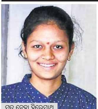
ମୃତ ନେତ୍ରୀ ହିରେମାଥ

ଦୀର୍ଘଦିନ ହେଲା ଷଡ଼ଯନ୍ତ୍ର ଚଳାଇଥିଲେ। ସେମାନେ ଝିଅ ନେତ୍ରୀ (୨୩)ଙ୍କୁ ବନ୍ଦ